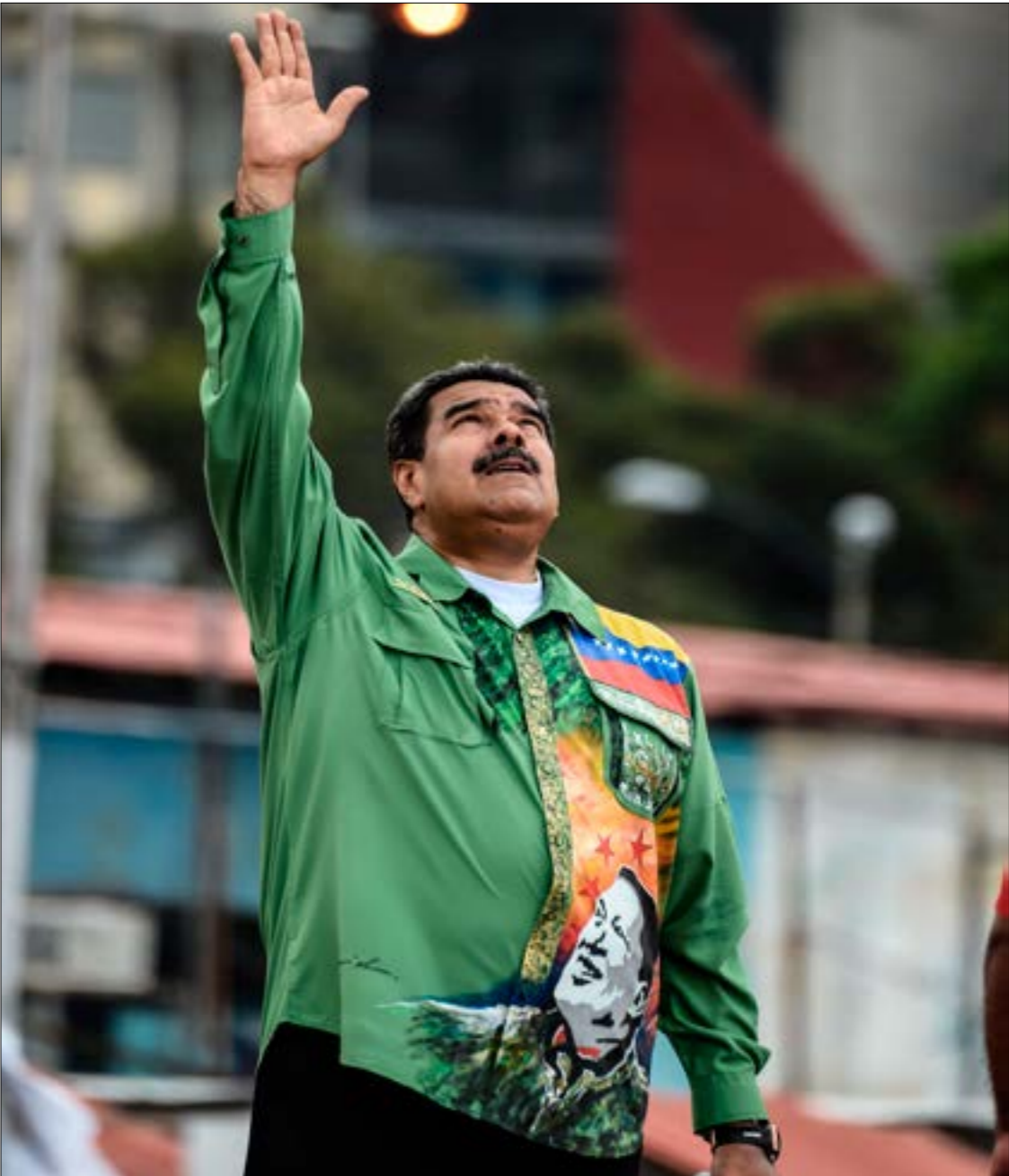
مادورو، هو، الرجل الأخضر، وفقاً للاسم الحركي الذي أطلقه عليه تشافيز

يتوجه أكثر من عشرين مليون ناخب فنزويلي إلى صناديق الاقتراع غداً الأحد للانتخاب رئيس للبلاد وممثلين عنهم في الجمعية الوطنية (البرلمان) وفي البلديات المحلية. التوقعات الأولية تشير إلى أنّ نيكولاس مادورو، وجهته، سيحصلون مجدداً على ثقة الشعب لولاية جديدة رغم كل التحديات الاقتصادية التي سببتها الحملة الأميركية المستمرة