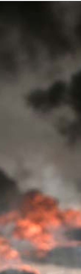
هذه المرة الاولى التي يتاح فيها مصر إلى اجراءات سريعة وواضحة

تشر المصارد نفسها أن «مستوى العروض المقدمة بتخطى الجانب الإنساني هذه المرة، بل تتعلق بتحسينات جوهرية، إذ ستعمل قطر على دعم مشروعات لتحسين الكهرباء والمياه وأصور أخرى قد يعلن عنها العمادي قريباً»، فيما أشير إلى أن غرينبلات اجتمع قبل يومين مع وزير الخارجية القطري، محمد بن عبد الرحمن، بحضور العمادي، في الدوحة، وذلك لبحث في الشأن نفسه.