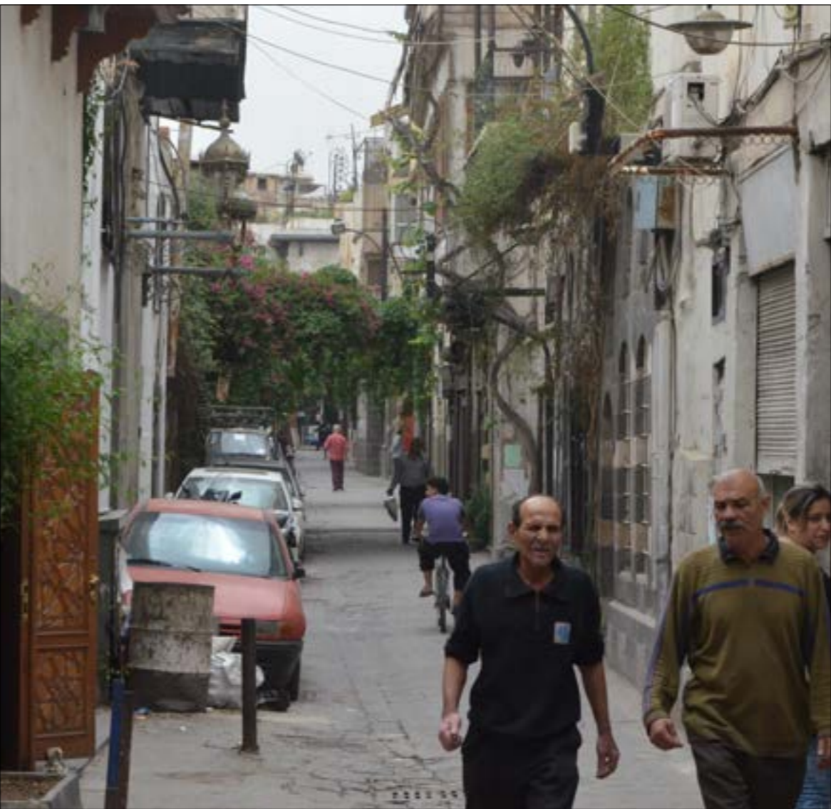
تؤكد موسكو ان المشاركة في إعادة الإعمار يجب ان تتر بالتسيف مع دمهشقة (الأخبار)

على الدول الأوروبية. ومن جهتها، لفتت ميركل إلى أن المحادثات التي ترعاها الأمم المتحدة «تمثل فرصة يجب أن نستفيد منها».