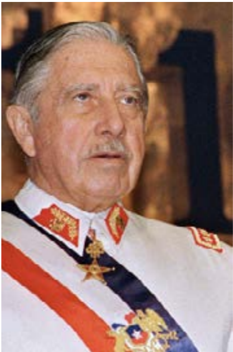
فاد بينوشيه انقلاباً دموياً ضدّ البندقي