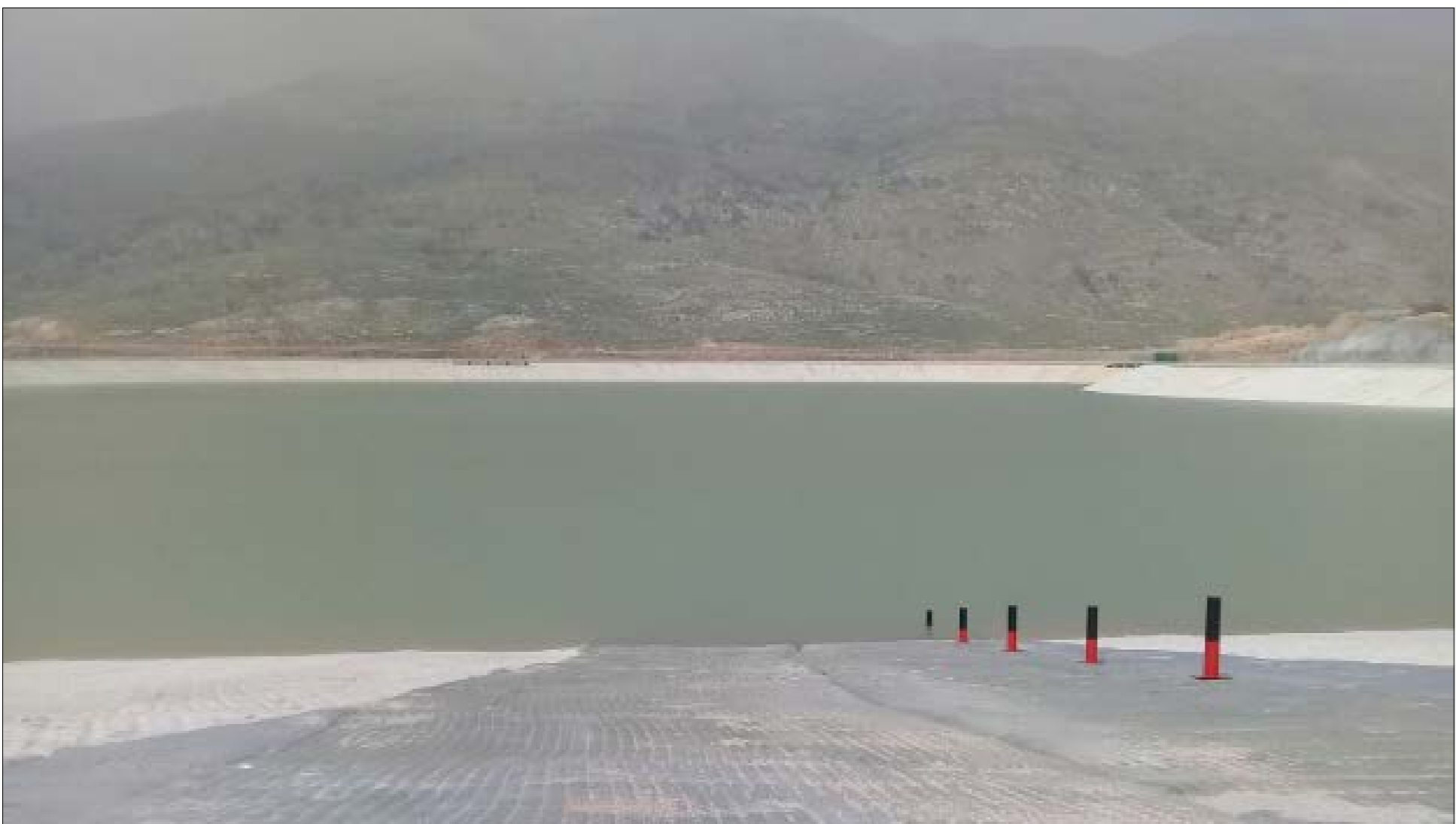
سد القيسماني في إحدى مستوياته

يبلغ متوسط التقديرات لكلفة السد بعد انتهاء العمل فيه بأكثر من 30 مليون دولار، ومتوسط قدرته