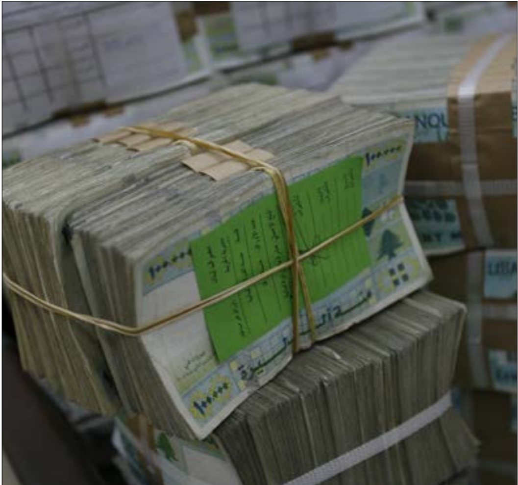
العملية ستوفّر على الخزينة 1,4 مليار دولار كانت مضطرة إلى دفعها على مدى السنوات المقبلة لخدمة الدين (مروان طحّم)