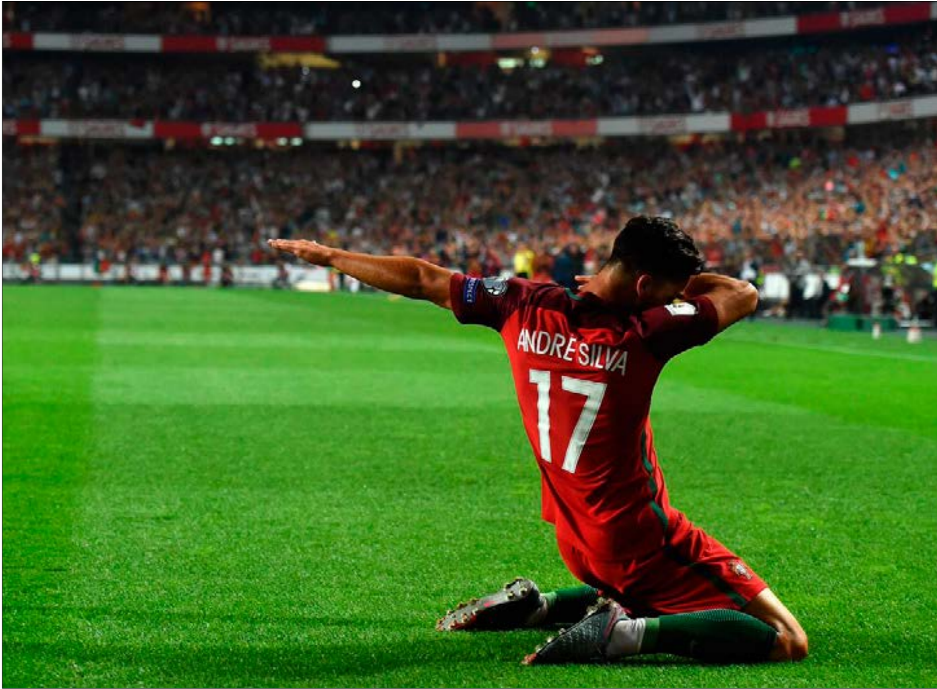
شارك البرتغال 6 مرات في منافسات كأس امم أوروبا