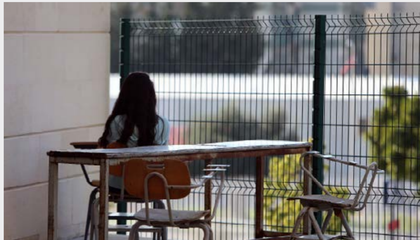
30 طالباً تضم جامعة... بين 25 طالباً فقط (هيثم الموسوي)

توسع الجامعات الخاصة مستمر. الترخيص الذي يجري على اساس توزيع طائفي وهنطضي لا يخفي الأهداف الربحية وفداحة اعداد الطلاب الذين قد يصل عددهم في الجامعة إلى 157 طالباً وفي الكلية أو المعهد الجامعي إلى 27 طالباً فهل هذه «المؤسسات» التي تمنح الشهادات هي جامعات فعلاً؟