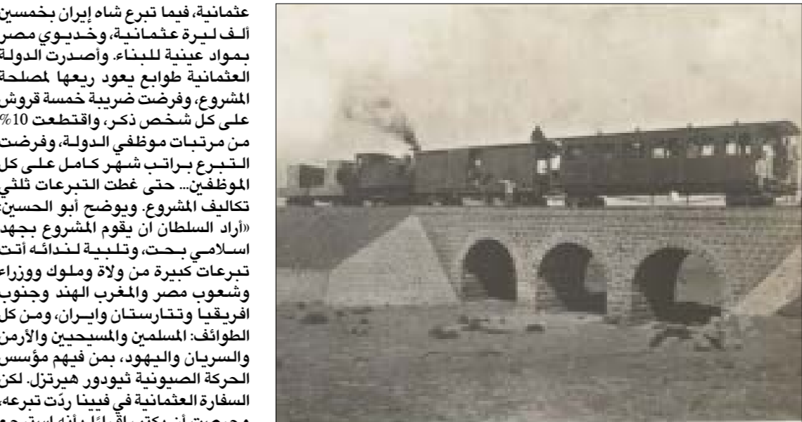
ادركت القوى الاستعمارية، مبكراً، الأهمية الاستراتيجية لهذا الخط

والإستراتيجية لهذا المشروع العلائق في التصديّ للمطامع الاستعمارية الفرنسية في المغرب وتونس من جهة، والبريطانية في مصر من جهة ثانية، بحسب الأستاذ في التاريخ العثماني عبد الرحيم أبو الحسين، وبالفعل، ظهرت أهمية الخط وخطوره العسكرية على بريطانيا، خلال الحرب، عندما مثّل عاملاً مهمّاً في ثبات العثمانيين نحو عامين في وجه القوات البريطانية المتفوقة في جنوب سوريا.