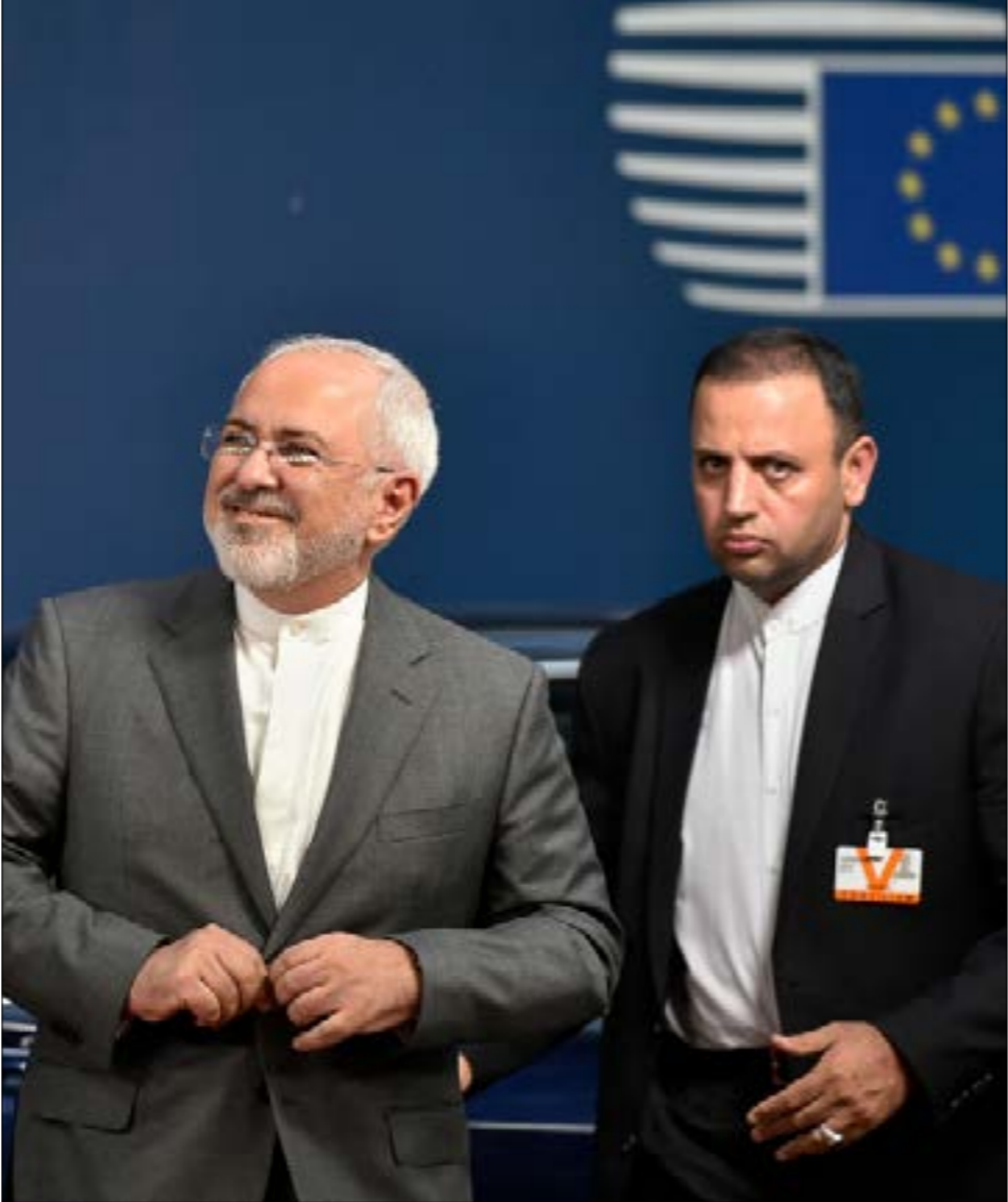
إيران كأنه حكيمه في رضها تجدير مناشاتا النووية واجهرة الطرد المركزية (أ ف ب)

بإمكانيّة حت الدول الأوروبية على الانفصال مع أميركا. لم يحدث أن تحدى زعيم اوروبي غربي الحكومة الأميركية كما تحدّاه جاك شيراك في عام 2002 و2003 عندما حدّث من عواقب الغزو الأميركي للعراق. لكن لم ينته عام 2003 إلا وكان شيراك يزحف عبر المحيط الأطلسي في محاولة لإرضاء واشنطن. ولم