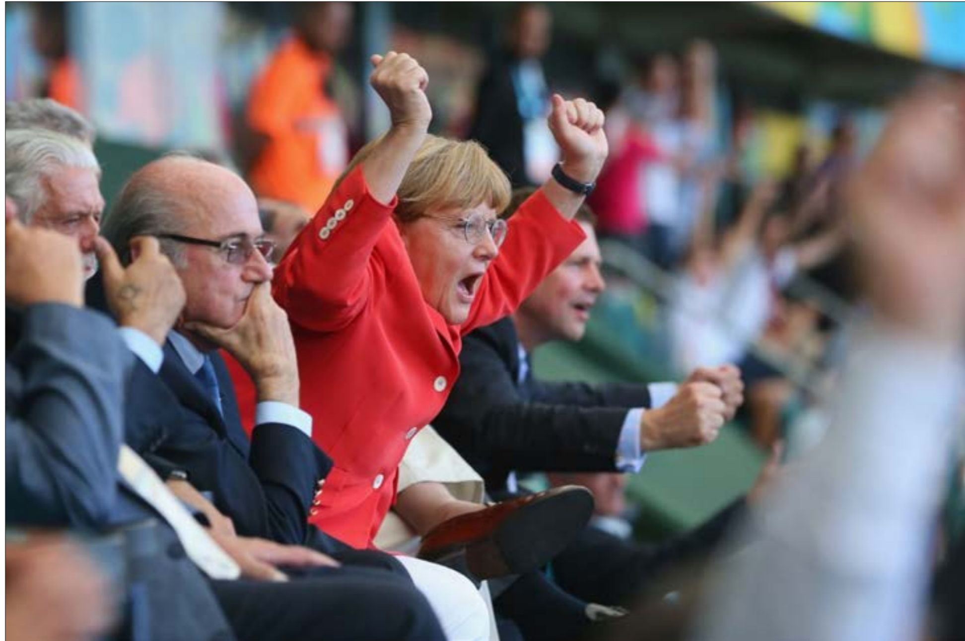
شهدت ميركل في الملعب ذلك مباراة ألمانيا والبرنتيت في مونديال جنوب أفريقيا

وتشجع كرة القدم. دونالد ترامب، الرئيس الـ 45 للولايات المتحدة الأمريكية، الذي بات حديث العالم كله في ليلة وضحاها، بفعل حماقاته المتكررة، بعد صاحب خلفية رياضية كبيرة. فهو أحد هواة لعبة الغولف، وكانت له سابقة في ضرب فينس ماكمان، رئيس اتحاد المصارعة، وهي اللفظة التي أثارته جداً كبيراً حوله. ولكن قليلين هم من يعلمون عن علاقة خليفة أوباما بكرة القدم، فهناك عدة مواقف كروية مسجلة باسمه، كما