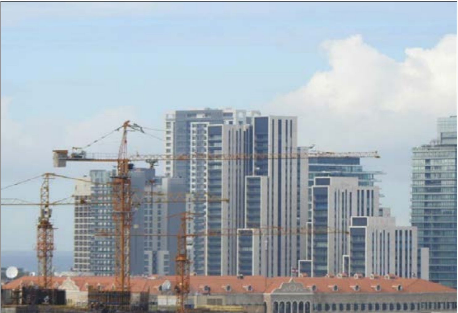
قرميد السراج وبراج سوليدير (اسامة كلب)

«حكايا الناس والأمكنته في بيروت» حكاية في أربعة فصول، وخاتمة: المدينة، البيت... والتكنولوجيا