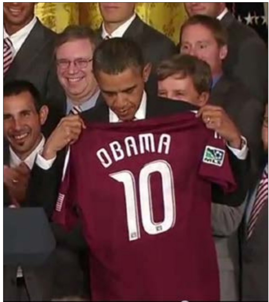
باراك أوباما سبق وأعرب عن رغبته في متابعة المباريات في الملعب

وتشجع كرة القدم. دونالد ترامب، الرئيس الـ 45 للولايات المتحدة الأمريكية، الذي بات حديث العالم كله في ليلة وضحاها، بفعل حماقاته المتكررة، بعد صاحب خلفية رياضية كبيرة. فهو أحد هواة لعبة الغولف، وكانت له سابقة في ضرب فينس ماكمان، رئيس اتحاد المصارعة، وهي الـWWE، في قلب حلبة المصارعة، وهي اللفظة التي أثارته جداً كبيراً حوله. ولكن قليلين هم من يعلمون عن علاقة خليفة أوباما بكرة القدم، فهناك عدة مواقف كروية مسجلة باسمه، كما