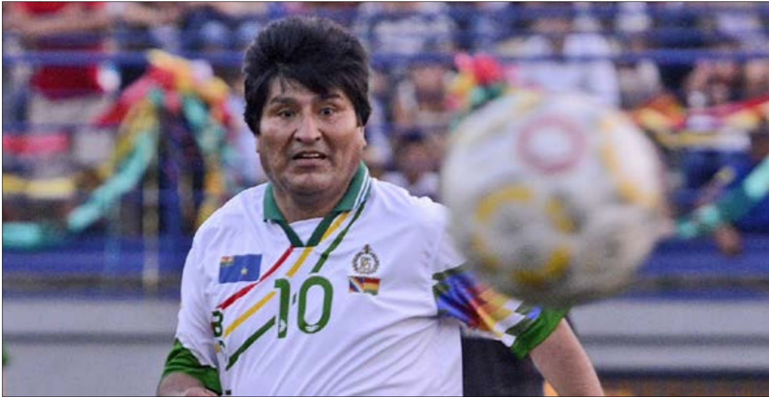
رغم اهتمام الرئيس لكرة القدم فإن حالها في بوليفيا ليس على ما يرام

تكون انتصارا تكعب بمثابة الدواء الذي سوف يساعد في التغلب على امراض الفقر والفساد والظلم الاجتماعي الذي يعاني منه الشعب البرازيلي». ولكن البرازيل خسرت وفازت إبطالبا، ولكن العالم كله دعم البرازيل لأنها البرازيل وليست أميركا. كان أوباما على حق إذاً. وقبل ترامب، وقبل أوباما، هناك بيل كلينتون، الذي تابع من الملعب مباراة الولايات المتحدة الأمريكية أمام الجزائر 2010 وكان قد توجه إلى الملاعبين وشجعهم قبل بدء المباراة كما وكان قد عُيّن كرئيس للبعثة المسؤولة عن ملف أميركا لاستضافة كأس العالم 2018 و2022 الذي ذهب لصالح روسيا 2018 وقطر 2022. أما في فرنسا ففوز منتخب فرنسا بكأس العالم 1998 أرقص رئيس فرنسا الأسبق جاك شيراك الذي لوح طويلاً بقميص «الدبوك» من مقصورته الشرفية خلال المباراة النهائية أمام البرازيل. لوح شيراك لمنتخب قاده زين الدين زيدان.