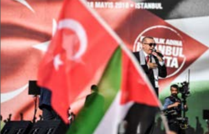
اردوغان، إذا لم نستطع حماية قبلتنا الاولى فلا يمكننا النظر بثقة إلى مستقبل قبلتنا الاخيرة

شوارع وأحياء مختلفة. أما في غزة، فتوافد آلاف الفلسطينيين للمشاركة في «جمعة الوفاء للشهداء والجرحى»، عبر مسيرات حدودية، أصيب فيها نحو 12 مواطناً. وشارك إسماعيل هنية في غزة ونائب قائد «حماس»