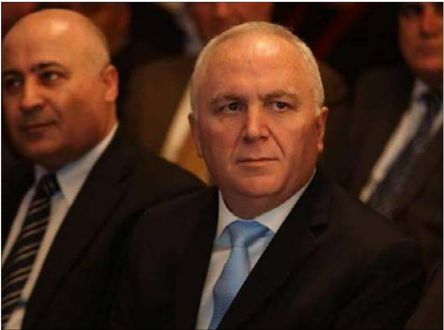
هل سيترك جرمائوس للتخفيف، في إخبار نعامك ضاهر، نجاريا، هم إسرائيليين؟