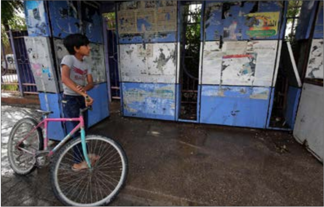
من موقم التفجير الانتحاري الذي استهدف، امس، منطقة الشعلة في العاصمة بغداد