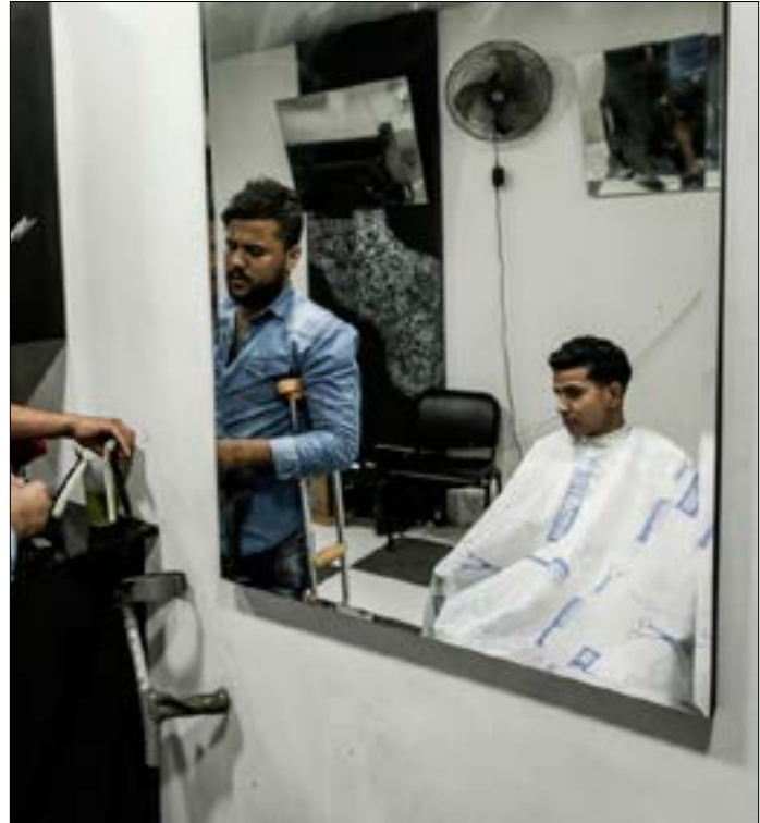
مصائب في غزة يكتمها طبعها المحلية وهو على عازر طيب

من جهة أخرى، اعلن وزير الأمن الإسرائيلي، أفسغدور ليبرمان، أمس، منح تصاريح لبناء 2500 وحدة استيطانية في الضفة المحتلة الجديد وتمثل بإعادة التهدة مقابل الحملة بمواد مشتعلة، الأمر الذي أدى إلى إحراق أكثر من 3000 دونم زراعي حتى اللحظة بواسطة 300 طائرة، وفق إحصائية نشرتها صحيفة «يديעות أحرונوت» أمس بموازاة ذلك، يواصل الجيش الإسرائيلي رفع وتيرة تهدياته لمنع المتظاهرين من التفكير في اختيار الحدود وتخريب معادته، إذ كشفت صحيفة «معاريف» أمس أن الجيش قد يكثف نشاطاته الهجومية وصولاً إلى سياسة اغتيالات ضد من يجتازون السياج على الصعيد السياسي الداخلي، بغرار من النائب العام (في غزة) الذي لا تعترف به حكومة التوافق».