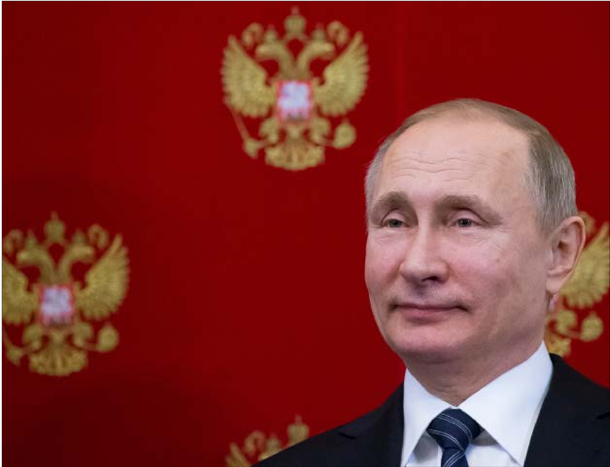
حصد الرئيس الروسي الحزام الأسود من الدرجة الثالثة في رياضة «التايكواندو»