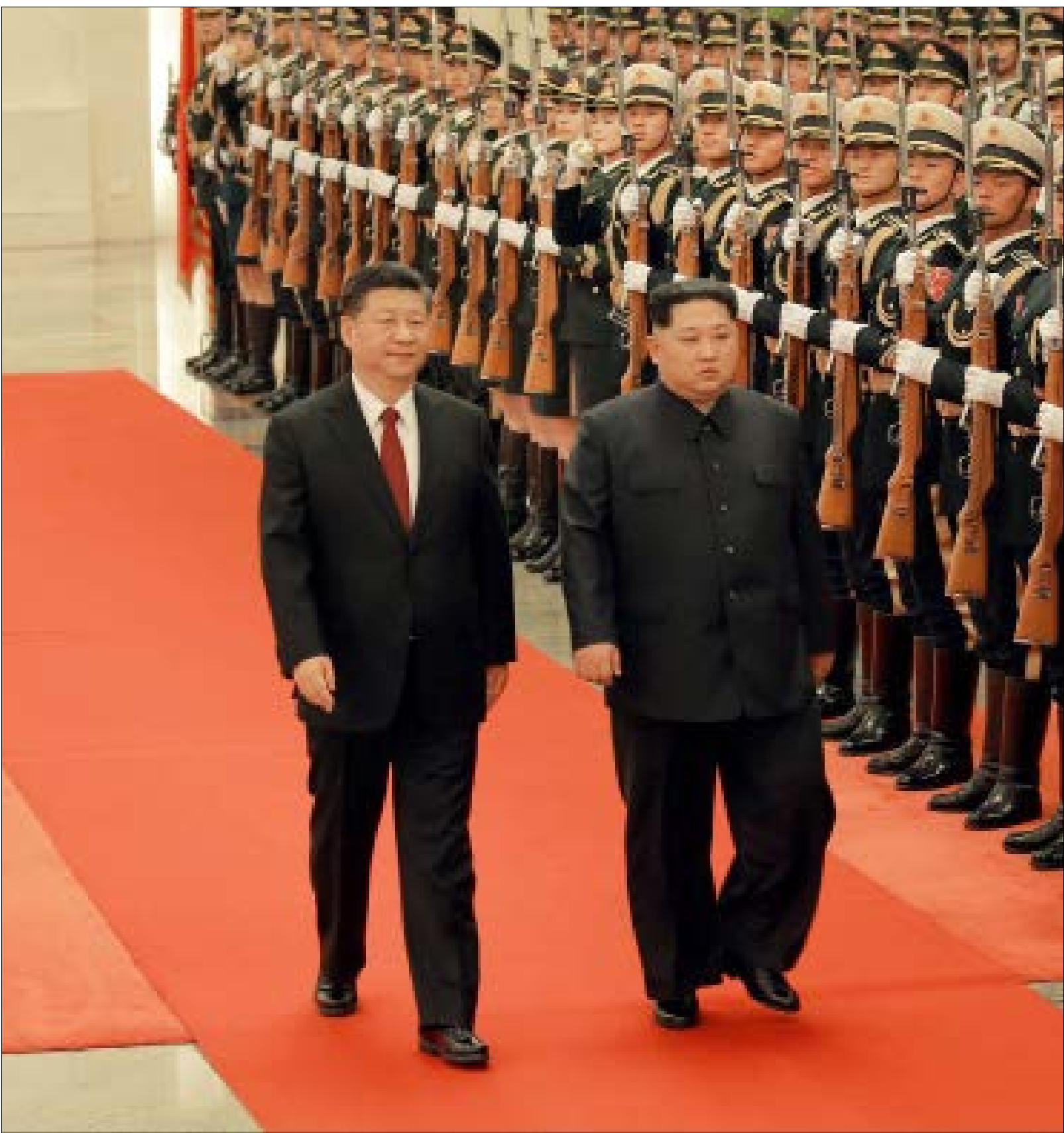
في العدة الأخيرة، اجتمع كيم جونج أون نائب زعيم كوريا الشمالية

وفق مختلف القراءات المقدّمة، ثمة شبه إجماع على أنّ الرئيس الصيني شي جين بينغ، يريد حماية المصالح الإستراتيجية لبكين وضمان أن يكون لها أثر في العملية السلمية الكورية، خاصة عندما يتعلق الأمر بالحفاظ على نظام صديق في بيونغ يانغ، كحاجز مع القوات الأميركية وكوريا الجنوبية مع نظيره الكوري الجنوبي، مون جاي إن. وفي النهاية، عاد كيم ليتلقى شي للمرة الثانية في مدينة