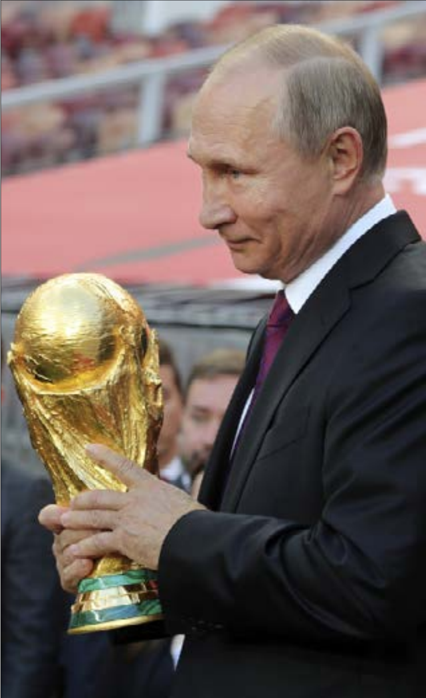
لم يرسل أي بريد إلكتروني في حياته