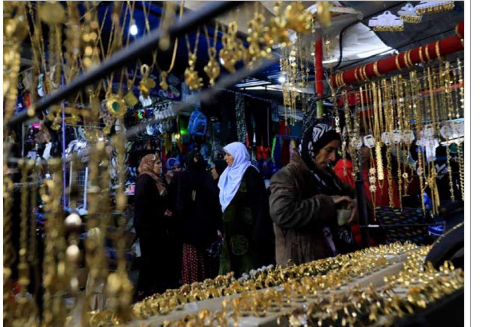
الكثير من الصائغين عموماً والحليين خصوصاً خسروا مهنتهم بعد احتراقها ابا عن جد

تشرح بايسط طريقة حقيقة أن الحرب لم تمز على شريحة من السوريين. وعليه، فإن ما تراه العين في السهرات الشامية لا يمثل، وعلى طغيانه ظاهرياً، أوضاع أسواق الذهب في كل المدن السورية. الكثير من الصائغين عموماً، والحليين خصوصاً خسروا مهنتهم، بعد احتراقها أبا عن جد. ولا ينسى السوريون عندما كانت صناعة المصاغ الذهبية (عيار 21) تزدهر في مدينة حلب، منفوقة حتى على ورش العاصمة، وتنافس الدول المجاورة فيما تستقطب، اليوم، تركيا في المقام الأول، مهر صناعي الذهب والحليين والتجار، إضافة إلى لبنان كخط هجرة ميدني نحو أوروبا وغيرها لاحقاً. وليبق سوق بيع الذهب متركزاً في أسواق العاصمة التي يتجاوز حجم مبيعاتها 3 كغ يومياً، موزعة على أكثر من 300 ورشة عاملة، و2100 منسج إلى جمعية الصاغة. ويتقلص حجم المبيعات إلى نصف هذا المبلغ وما دونه في اللاذقية مثلاً، التي تصل أعداد محال بيع الذهب فيها إلى 150 محلاً، إضافة إلى وجود ورشات صناعية قليلة فيها. فيما يعتبر عدد من التجار أن إنتاج ذهب الإضرار من ليرات وأوضاع ذهنية توقف خلال الحرب، ولم يمثل طيلة السنوات الماضية أكثر من 10% من حركة بيع الذهب شهرياً. في حين شهد السوق خلال الفترة الأخيرة حركة بيع المدخرات الذهبية، بعد انحسار الحرب عن مناطق عديدة، فاتجه السوريون إلى بيع ما