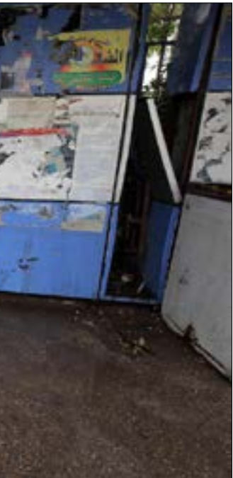
من موقم التفجير الانتحاري الذي استهدف، امس، منطقة الشعلة في العاصمة بغداد

تهديد تجلّت آخر حلقاته أمس، في الهجوم الانتحاري الذي استهدف منطقة الشعلة في بغداد، وادى إلى مقتل ما لا يقل عن 4 أشخاص وإصابة 15 آخرين بجروح. وبحسب بيان صادر عن مركز الإعلام الأمني فإن الانتحاري فجر سترته الناسفة عند مدخل منزله الصقلاوية اثر محاصرته من القوات الأمنية. وفي محافظة