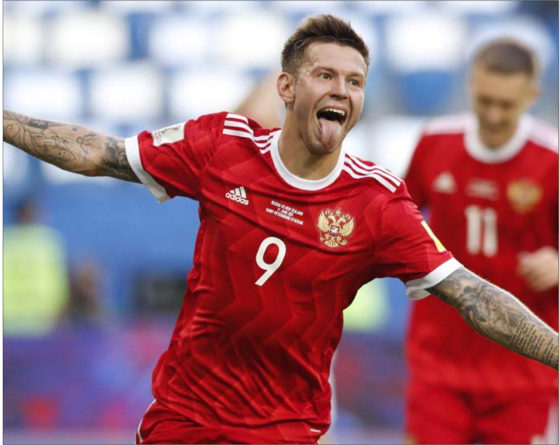
استقطب سمولوف اهتمام الاندية الأوروبية كريك محريد الاسباني وروسيا دورتموند الالماني

من الناحية الفنية، روسيا متواضعة، ومن الناحية المعنوية: الفريق، يحاول النهوض بعد صدمة الوديات، اما من الناحية التاريخية، فالقياصرة عودوا «الغزاة» على المفاجات.