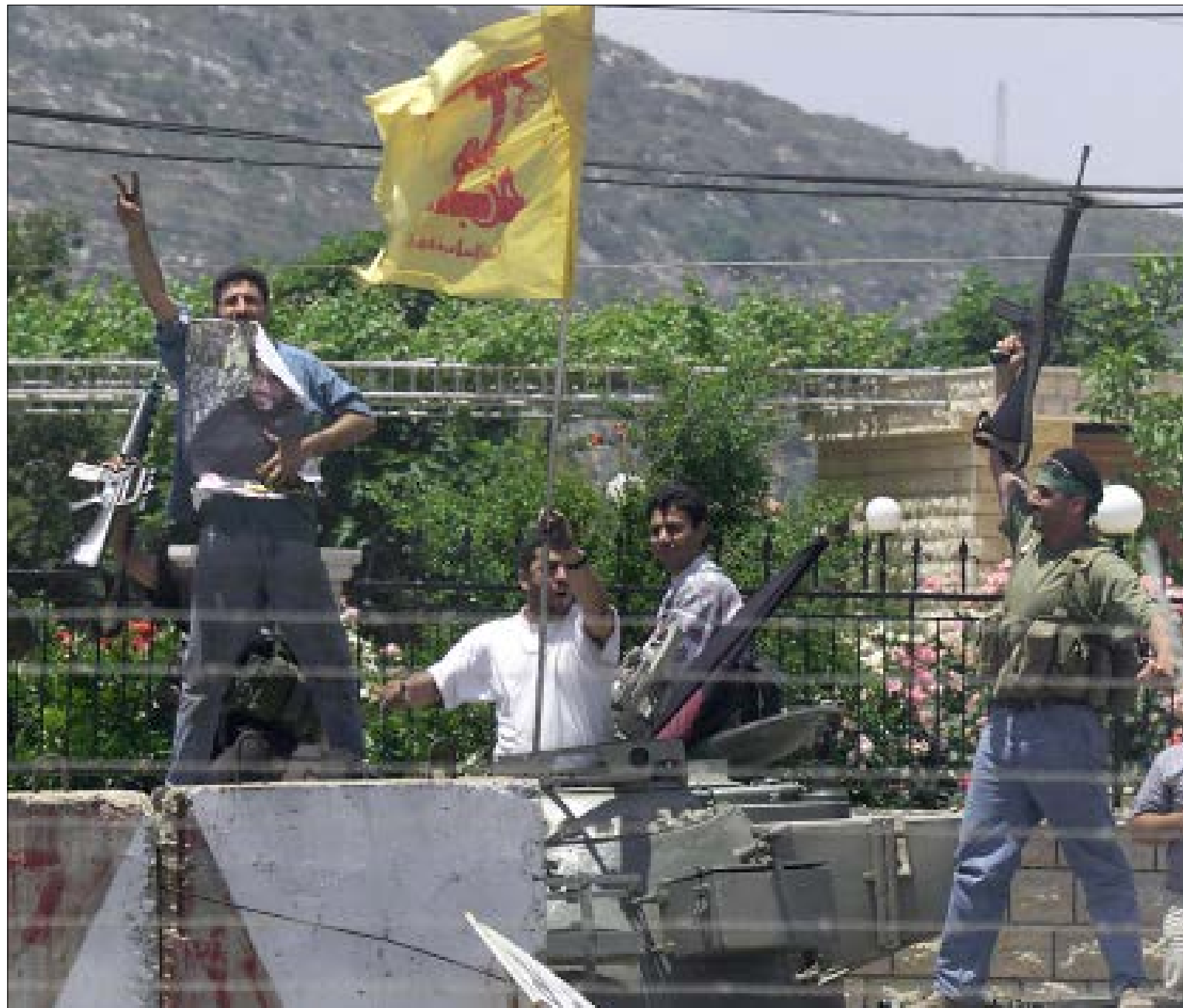
من اللحظات الأولى للتحرير، أدركت قيادة المقاومة أن إسرائيل ستحاول بكل الوسائل أن تحطم «النموذج الجديد»

في ذلك الحين، لجأت إسرائيل إلى سياسة الاعتیالات، بدءاً باغتال القادة، على رأسهم الشيخ راغب حرب والسيد عباس الموسوي، والعديد من الكوادر القيادية الميدانية، سروراً بخوض المعارك التقليدية المباشرة مع المقاومين، كما حدث في معركة ميدون عام 1988 نموذجاً، وصولاً إلى استهداف المدنيين وتهجيرهم بهدف تاليبيهم على المقاومة (حرباً 1993 و1996). انشغال إسرائيل في حماية احتلالها لجزءاً من الجنوب اللبناني، حول الاحتلال نفسه إلى عبء على الكيان الإسرائيلي قيادة