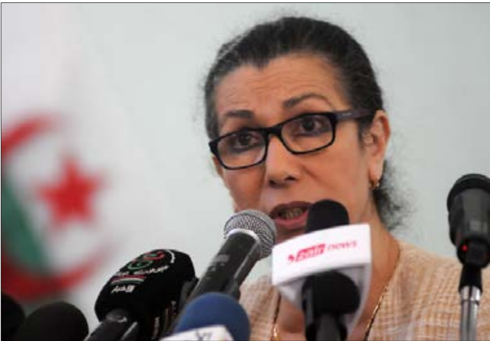
دمت حنون الجزائر إلى تجميد عضويتها في المنظمة (عن الوب)