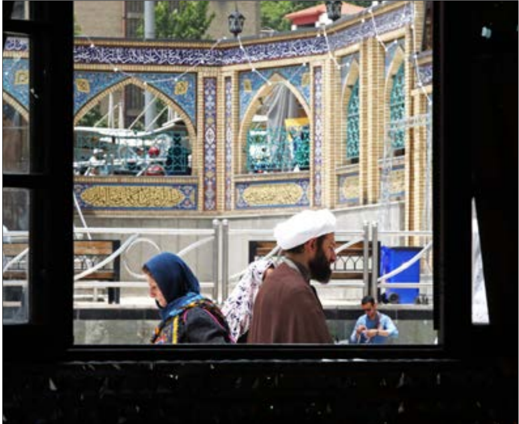
حولت واشنطن الإجراءات العقابية ضد طهران الى مسلسل لا ينتهي

تدابعات العقوبات الأميركية بنسبة كبيرة، لكن الغاز الصخري، وأضاف المصدر للوكالة الفرنسية: «إنها إبقاء هذا التمايز عن الولايات المتحدة في وقت تتعبد الإدارة الأميركية سياسات لا تراعى مصالحها، في غير مجال، آخرها تلويح ترامب برفض رسوم جرمها على السيارات، وبرزت أمس تصريحات لمسؤول أوروبي، ومن دون منافسة.»