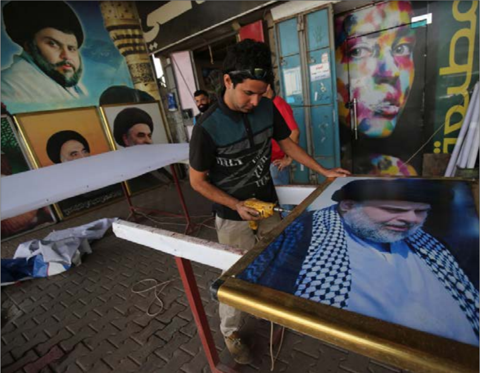
رفض «النبار الصدري»، قرار البرلمان، وأضعا فيه إطار «الضغوط»

البرلمان هو «قرار» وليس «قانوناً»، وهنا تكمن المشكلة برأيه، إذ إن مجلس النواب «لا يملك صلاحية إصدار قرار في موضوع خطير كهذا»، بل تقتصر صلاحيته في إصدار القرارات على «سحب الثقة، والاستجواب، والموافقة على تعيين موظفي الدرجات الخاصة»، وبالتالي «كان الأجدر بمجلس النواب إصدار قانون بدلاً من القرار»، حتى يمكن الإزام