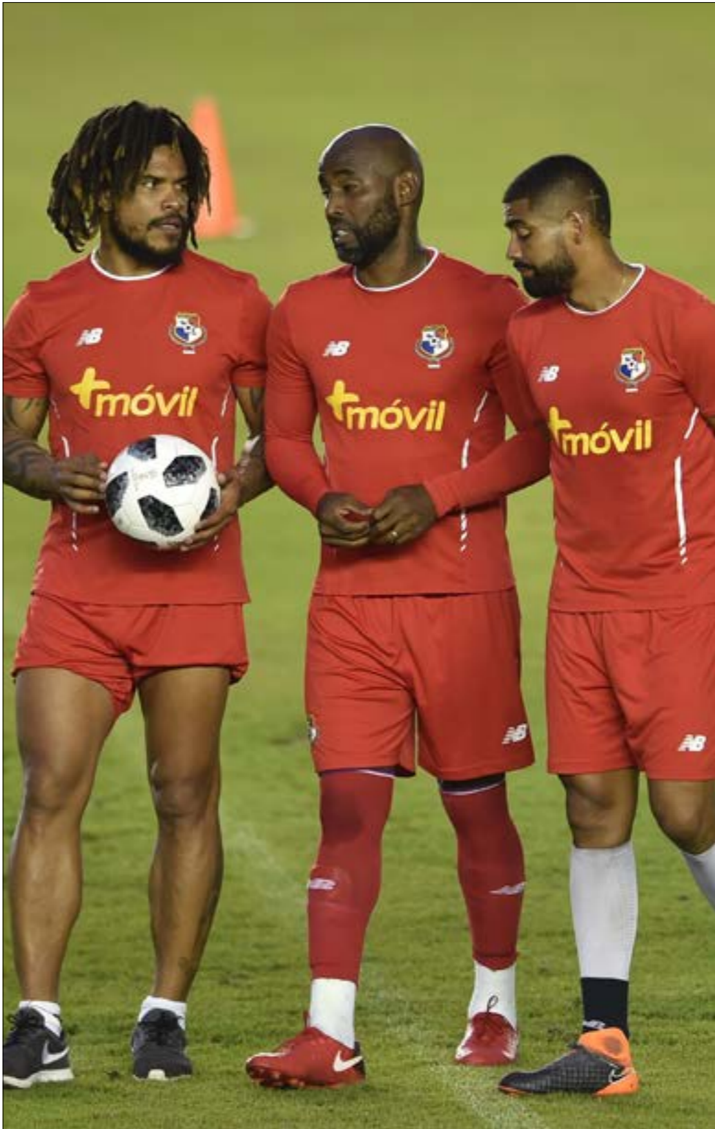
كانت بنما تواجه خطر الخروج من التصفيات

حلماً، اليوم الذي ستأهله فيه بنما لكأس العالم، سيكون عيداً عظيماً، لذلك تساءلت عما إذا كان يستحق عظمة وطنية؟ يتابع: «سالت رئيس مجلس الإدارة، هل سيكون لدينا يوم إجازة للاحتفال بهذا الحدث؟ أولاً، أخبرني أنه يجب علينا الاحتفال، لكن يجب علينا أيضاً صاحب الهدف المنتخب، «كنت في الملعب بعد المباراة مع رئيس بنما»، في هذا البلد كان دائماً