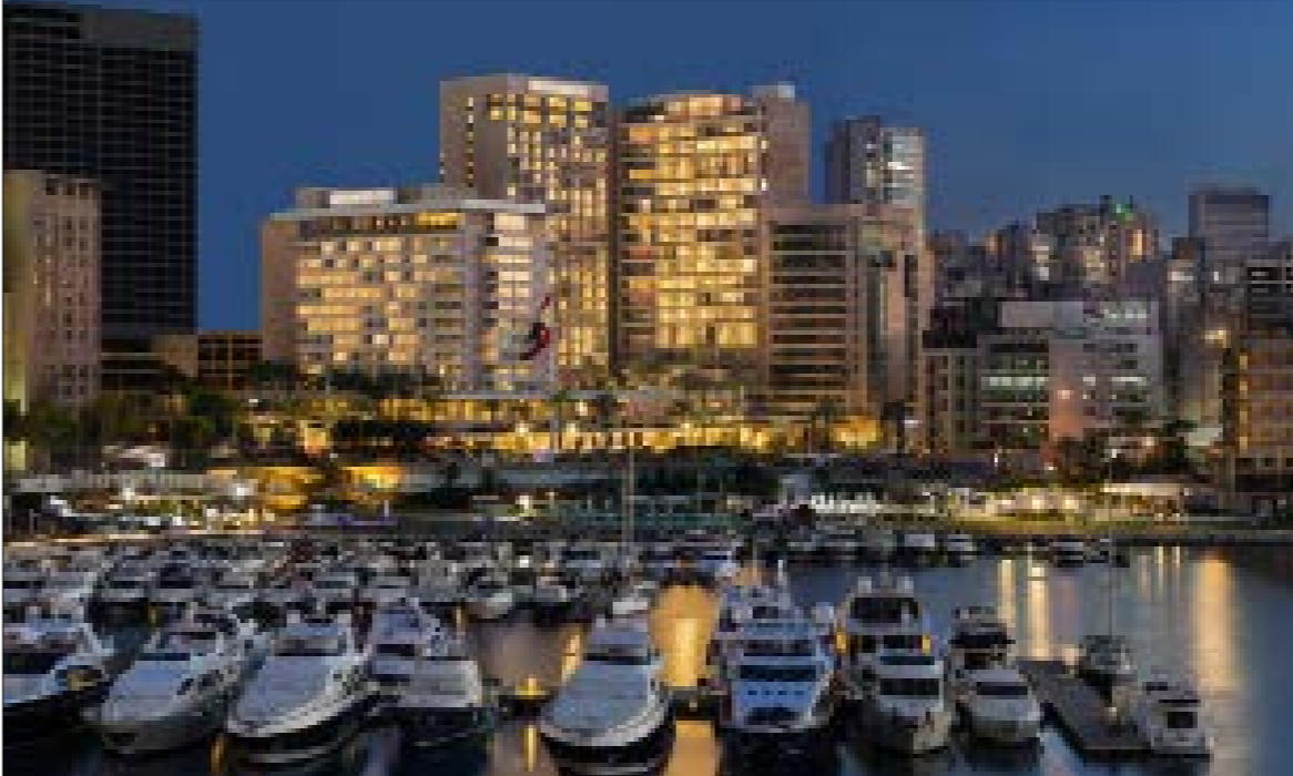
سجّلت بيروت ثاني أدنى نسبة إشغال فندقية في المنطقة لشهر آذار 2018