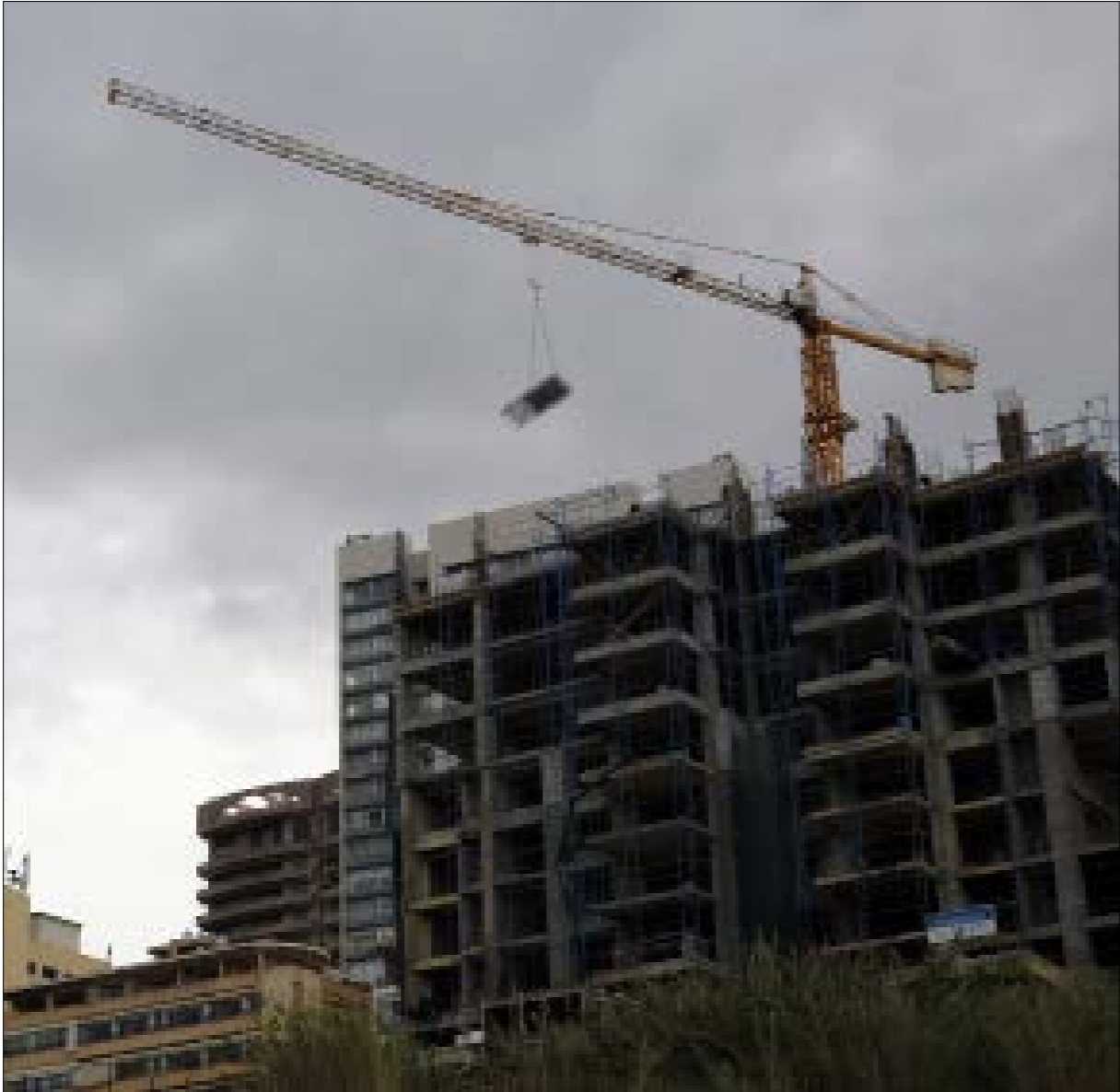
النظام يتجر لتجار العقارات ومصرفية ورجال اعمال من ذوي النفوذ السياسي، التلمّع برباح الريع