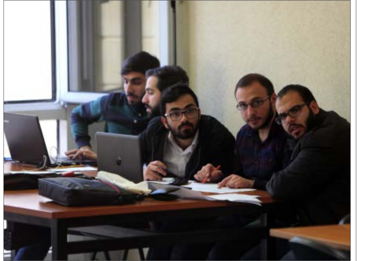
طلاب الماستر 2، في الكيمياء وعلوم المواد يتجزون مشاريع تخرجهم «علوم الروح» (مهلب الموسوي)

ينفذ الاساتذة الباحثون وطلاب الماستر في الكيمياء وعلوم المواد في الجامعة اللبنانية، اعتصاماً عند العاشرة والنصف من صباح غد احتجاجاً على عدم صيانة الاجهزة المخبرية وتأخير المشاريع البحثية والتخرج.