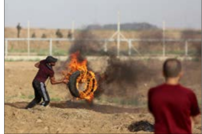
ما يجد فكرة الحراق والطائرات ان الرياح غربية في غزة

تاجع، على رغم أنه شوهدت طائرات إسرائيلية مسيرة تُحاول إسقاط طائرات ورقية فلسطينية أكثر من مرة، والشبان استخلصوا من جهتهم الدروس، واتبعو الطائرات الورقية بباليونات محملة أيضاً بمواد حارقة.