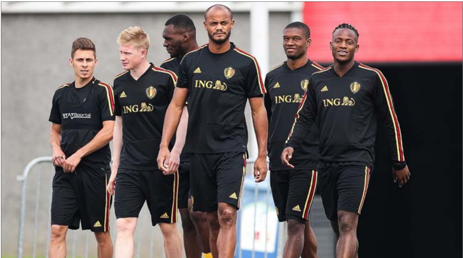
سليم المنتخب البلجيكي في المجموعة السابعة التي تضم كلاً من إنكلترا، بنما وتونس

بروين وادين هازارد ومرتنز وغيرهم، يمكن ان يوضع في خانة المرشحين لإحراز اللقب، او على الاقل الوصول إلى مرحلة متقدمة، بيد ان التجربة بينت تراجع «شخصية» الفريق البلجيكي، عندما يلعب امام الفرق التاريخية، كذلك فإن مدربه ليس وطنياً، ما يشير إلى ان كرة القدم في بلجيكا حالياً هي «ظفرة» لها اسبابها، أكثر من كونها «ثقافة» راسخة وحاضرة، إلا انه في ذلك توافر الإمكانيات، كل شيء ممكن.