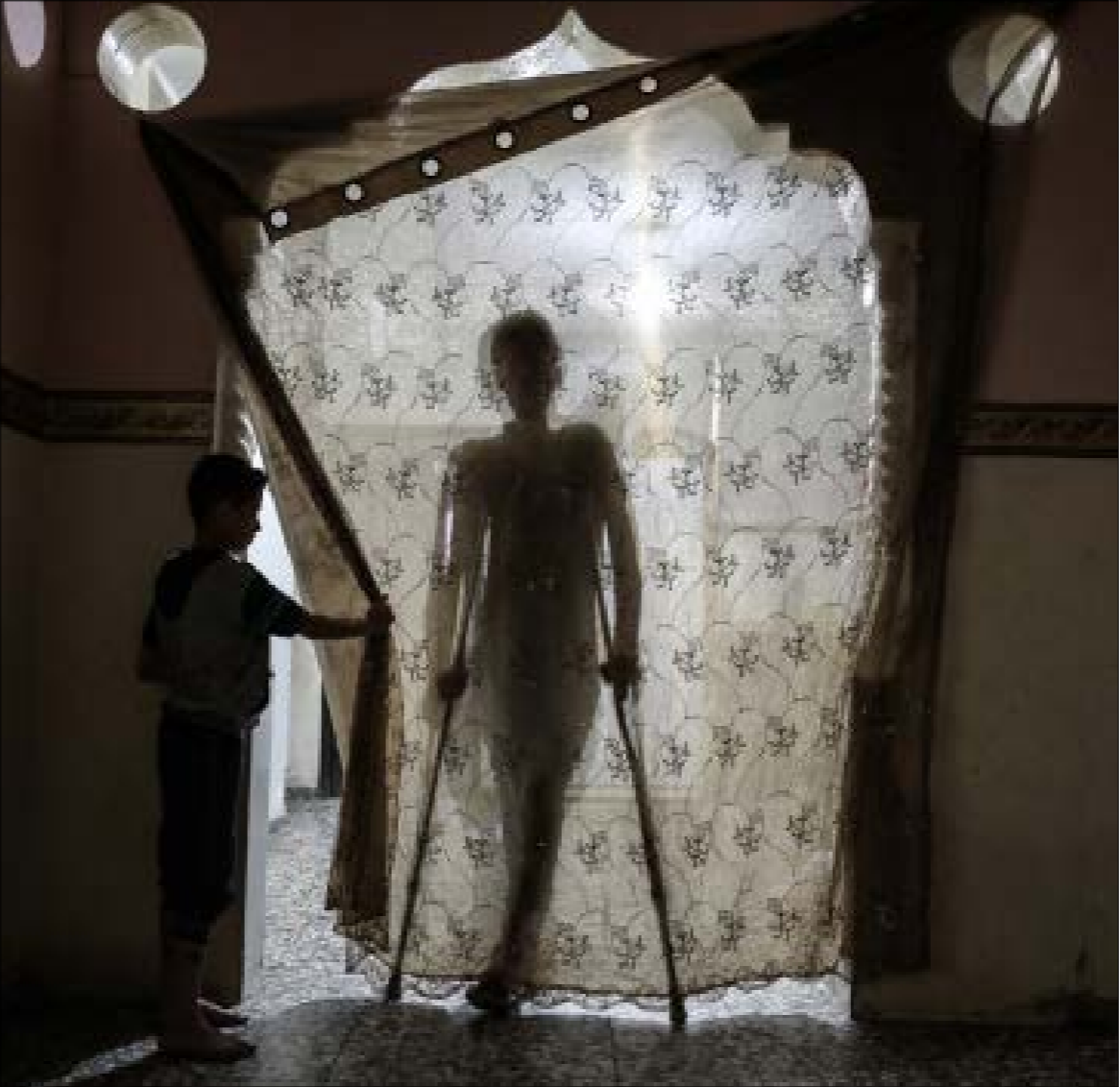
من المقرر أن يرسك في السفينة التي يبحر اليوم عدد من الجرحى والمرضى والطلاب

وفيما يتوقع أن تصدى قوات العدو لهذه الرحلة باعتقال من عليها أو حتى الاعتداء عليهم، قالت «الهيئة العليا لكسر الحصار عن غزة» إن الرحلة تحمل أحلام إنهاء الحصار المعلن. وقال عباس للصحافيين إن عمله غداً (اليوم)، شاركاً أطباء المستشفى الذي أشاد بإبلائه وطواقمه، وكذلك الزعماء والقادة الذين اتصلوا للاطمئنان