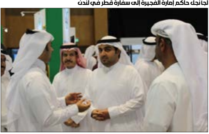
لجانجل حاكم إمارة الفجيرة إلى سفارة قطر في لندن