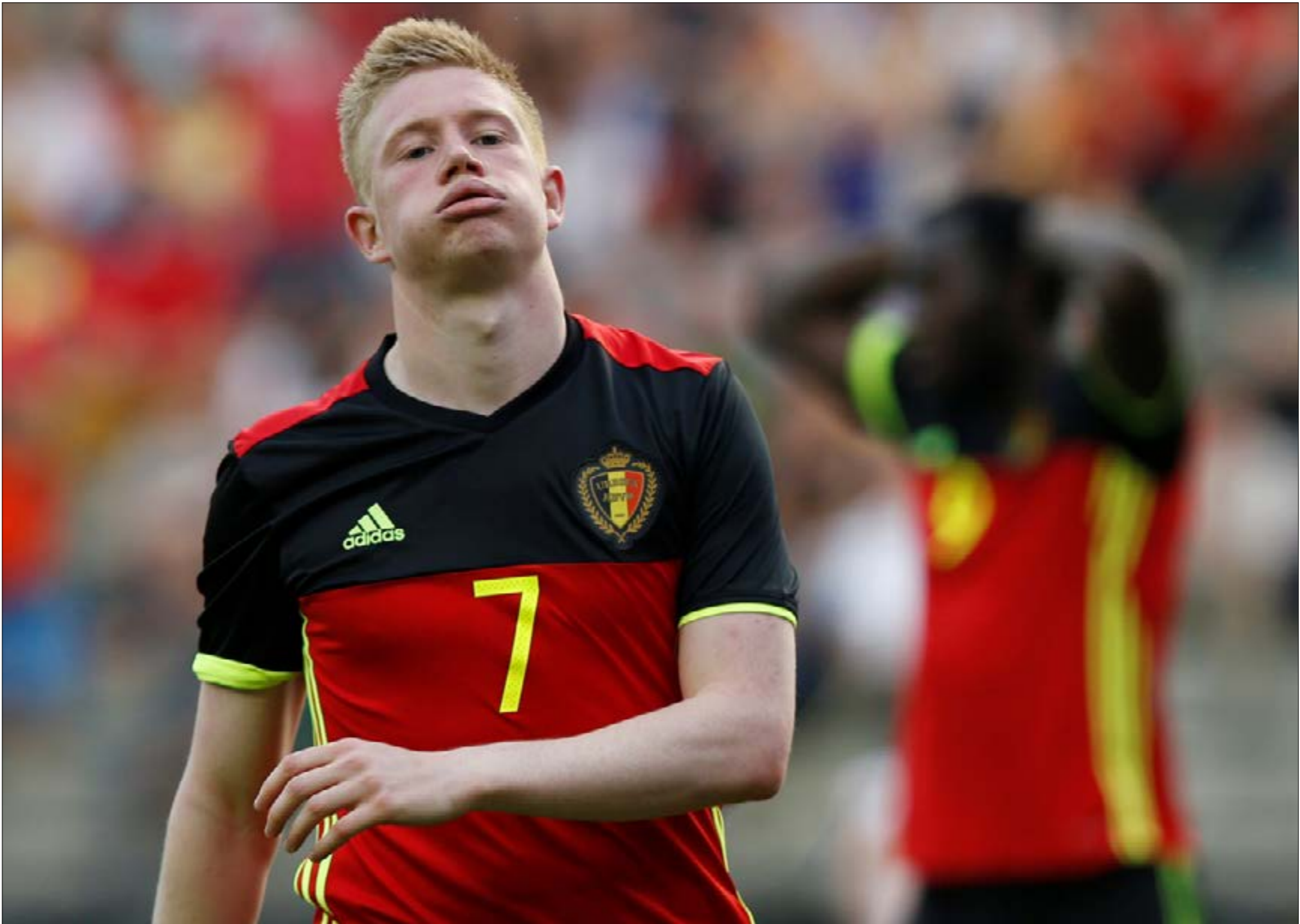
ميزة منتخب بلجيكا هي قوّته الهجومية

هنري مساعداً لمارتينيز لزيادة الفعالية في هذا الخط، نظراً للخبرة والتجربة الكبيرتين للاعب أرنست السابق، خصوصاً أن أكثر النجوم يلعبون في الدوري الإنكليزي حالياً في الدوري الإنكليزي الممتاز، والأهم أنهم في الفرق الكبرى. الحال مع مارتينيز. النتيجة جاءت مفرحة، إذ تمكّن منتخب بلجيكا من أن يتصدر مجموعته بـ 9 انتصارات مقابل تعادل واحد، مبتعداً بـ 9 نقاط عن نظيره اليوناني الثاني، وقد كان أول منتخب أوروبي يتأهل إلى المونديال من خلال التصفيات