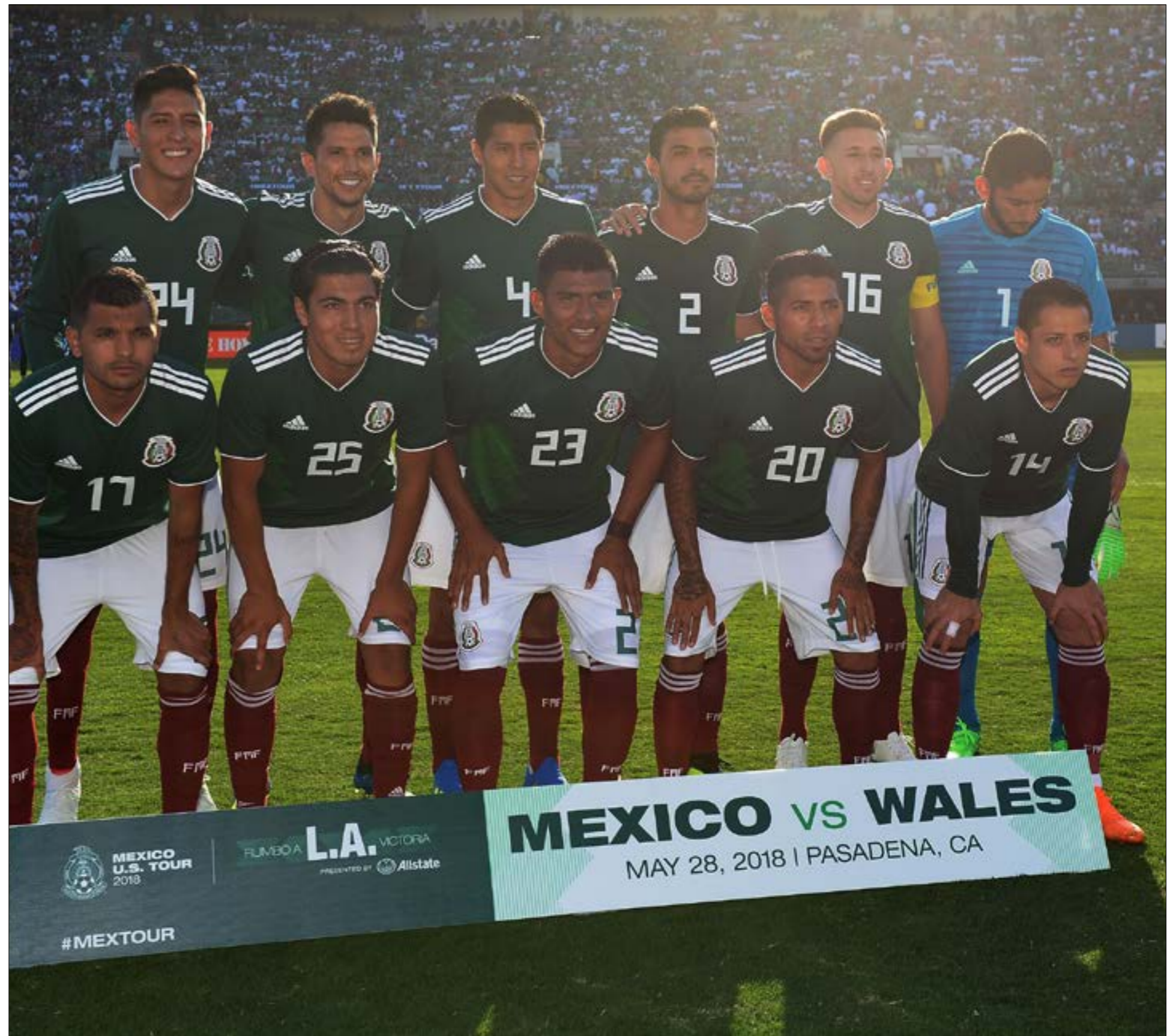
يضم المنتخب مجموعة من النجوم الواعدت كهكتور هيريرا وخيسوس كورونال لاعب بورتو البرتغالي إلى جانب خافيير هيرنانديز