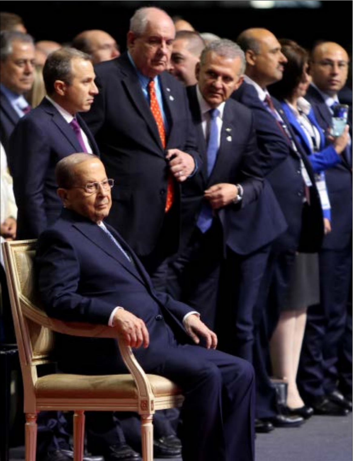
رسم الطائف دوا لرئيس الجمهورية يعو بله إلى مرتبة رئاسة الدولة، بك مؤسناثما (هيلم الموسوي)

لكن عرف نيل رئيس الجمهورية حصة وزارية تكرس مع اتفاق الوجة، عندما بدأ الكلام عن تقسيم الحكومة إلى ثلاثة أثلث: ثلث لقوى 8 آذار وثلث لقوى 14 آذار وثلث لرئيسي الجمهورية والحكومة. ترافق ذلك مع الكلام عن مشاورات لإعطاء «الوزير الملك» (الثلث المعطل) لرئيس الجمهورية، وبحسب سياسيين رافقوا أعمال مؤتمر الدوحة، فإن إعطاء رئيس الجمهورية حصة وزارية هو أحد الأخطاء الأساسية التي أنتجها اتفاق الدوحة، وقد غطت القوى المسيحية مجتمعة هذه الغلطة عندما وافقت على ذلك، بدل التمسك بمبدأ أن تكون الحكومة كلها تحت غطاء رئيس الجمهورية وصاحب الكلمة