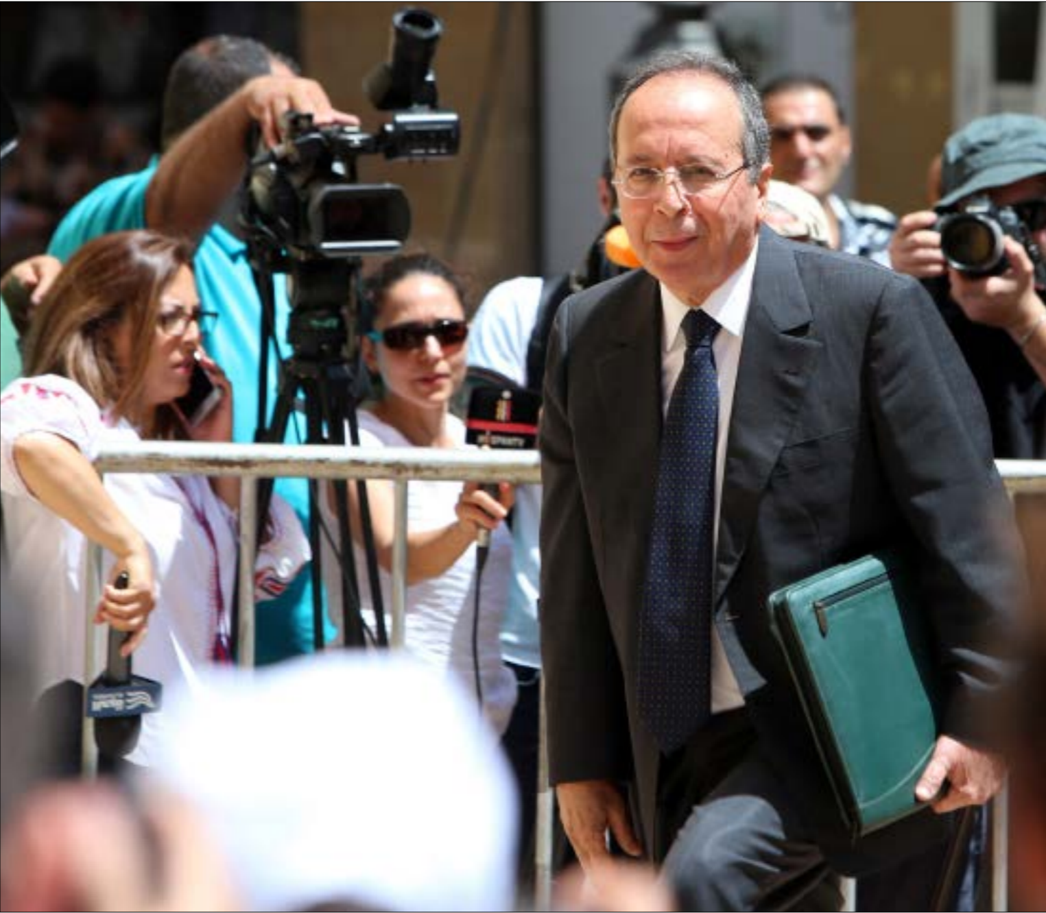
أفزت المحكمة الدوليّة بأنّ التصفيف الدولي مع السيّد كان مصلحياً وخرّج حقوق الإنسان (هيلم الموسوي)

أخر ما كان يتمناه اللبنانيون «الدوليّون» أن يروا جميل السيّد يشهد أمام المحكمة الدوليّة... التي لهنأوا لإنشائها. لم ولن ينسى ما فعلوه بحقّه، ومعهم المحقّقون الدوليّون، باعتقاله ظلماً وبشهادات زور. كلّما ظلّنا نأهمّ انتهوا منه، خرج عليهم أقوى، وفي لحظة أهدأ... لكن أكثر فحشاً. ها قد أصبح اليوم نأنياً مختاراً من الشعب. ما قاله، أمس، في اليوم الأوّل من شهادته في لاهاي، يصعب إيجازه. كل كلمة هي شهادة للتاريخ، من شخص كان شريكاً في صنع حقبة... لم تصب بعد من التاريخ