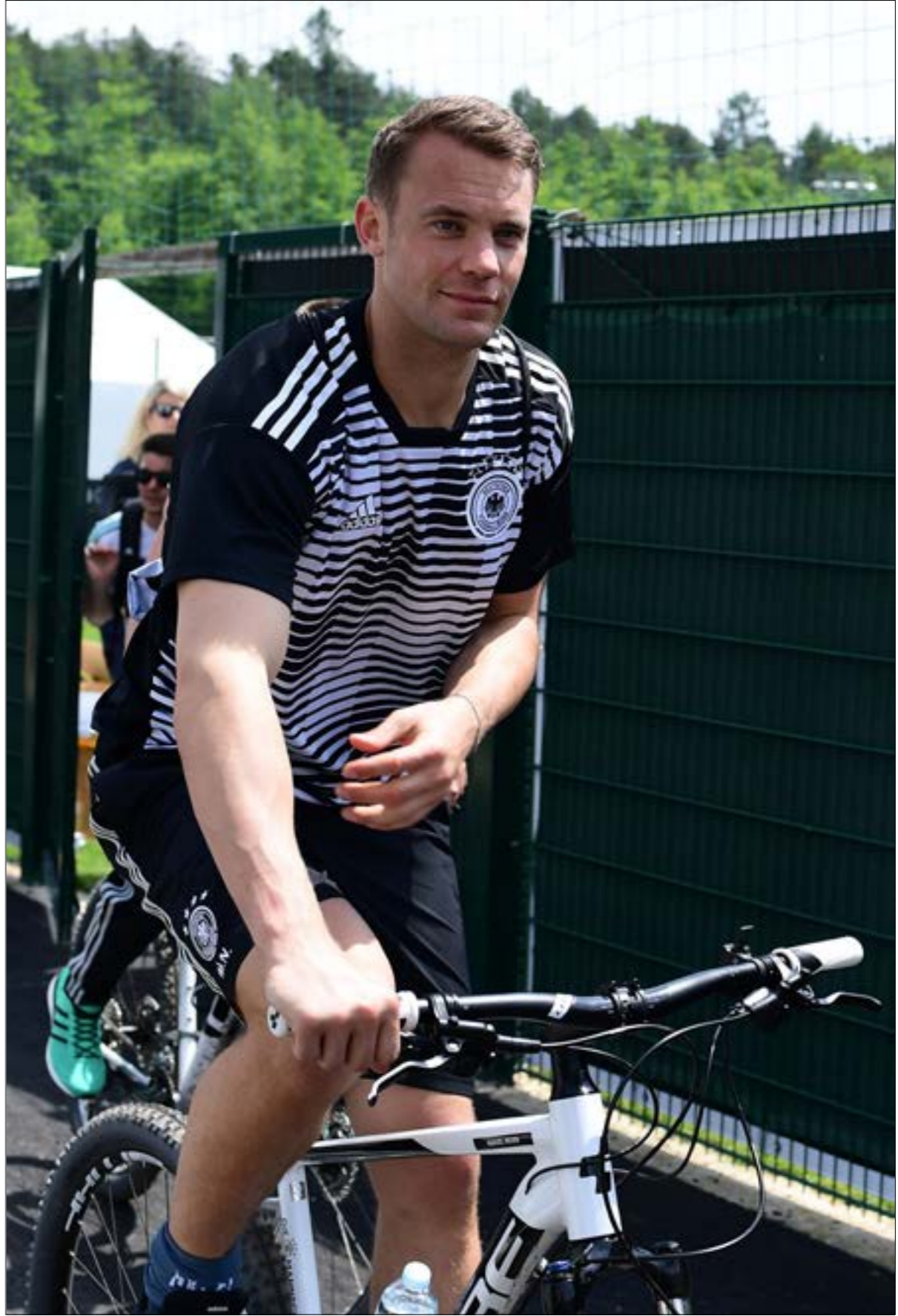
وجود الكبير نور ل براك معلقاً وينتظر الحسم بسبب الإصابة

دور بارز لعبه حراس المرمى في تاريخ كأس العالم، بعضهم قاد بلاده إلى المجد والذهب، أسماء كثيرة لحراس كبار هزت في تاريخ الموندiales، الأنظار على روسيا الآن، حيث سيلعب العديد من الحراس الأكفاء، هنا جردة بحسابات اللاعب رقم 1