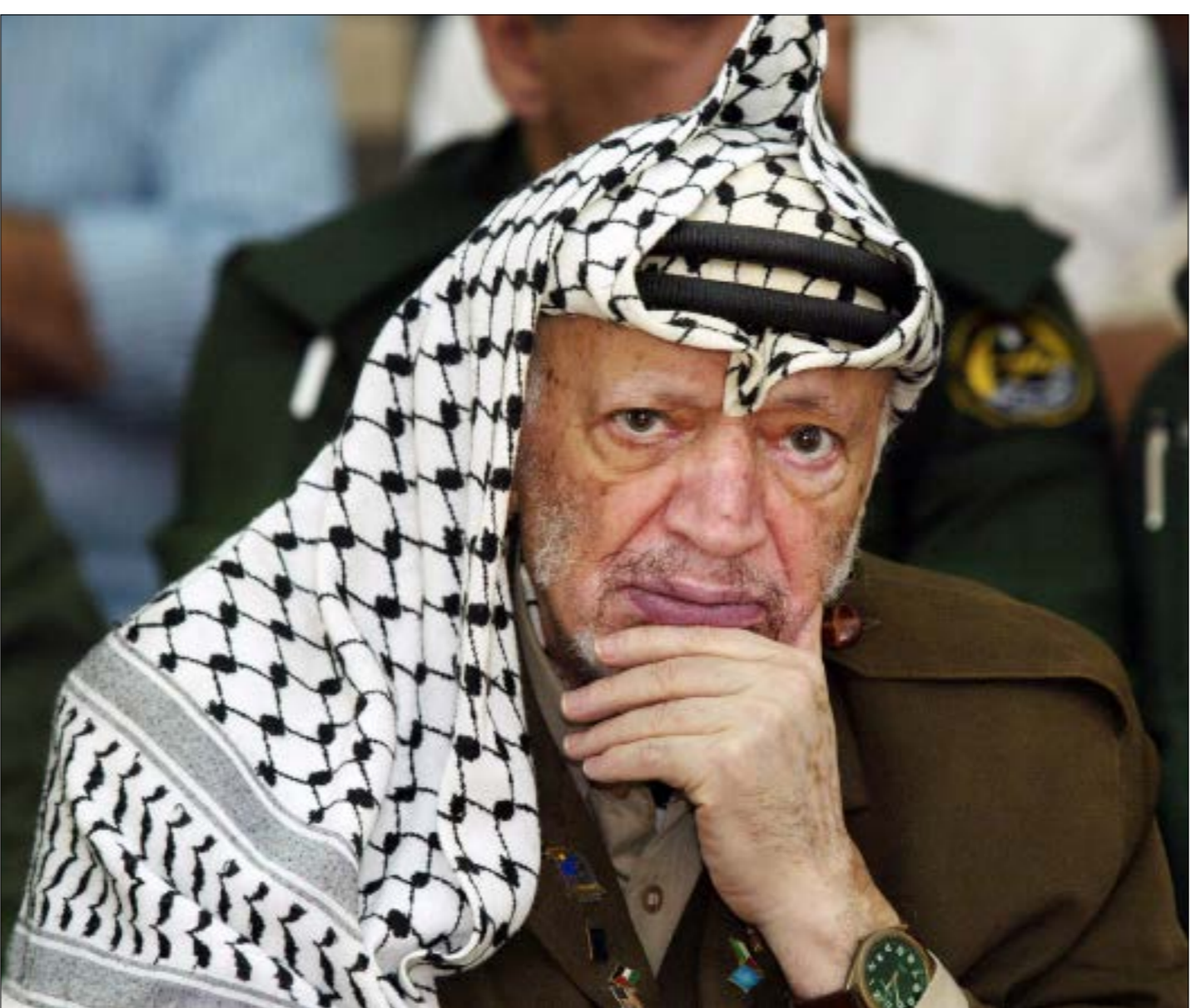
كان الزعيم الفلسطيني يريد أن يحصل على تنازل شكلي من أعدائه

تنازل شكلي من أعدائه، يحفظ للسلاطة الفلسطينية الوليدة بعض مظاهر السيادة على مناطقها، ولكن هؤلاء لا يريدون أن يمنحوه أيّ شيء، ولو كان صورة وشكلاً. حتى مجرد رفع علم فلسطيني على المعبر يرفضه الإسرائيليون. وهم لا يريدون أن يعطني السيادة على معابري، فليأخذ كل ويفترحون تذاكر عبور مختومة بالخطم الإسرائيلي. طال النقاش بين الرجلين كثيراً في تلك الليلة من منتصف شهر تشرين الثاني 1993. ثم لم يلبث هذا الاجتماع