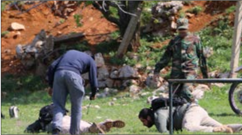
من برنامج «التحدي»

الى احد مخيمات التدريب ويجري اختبارات قوامها تحديات قاسية، يحضّر في كل حلقة مسؤول في