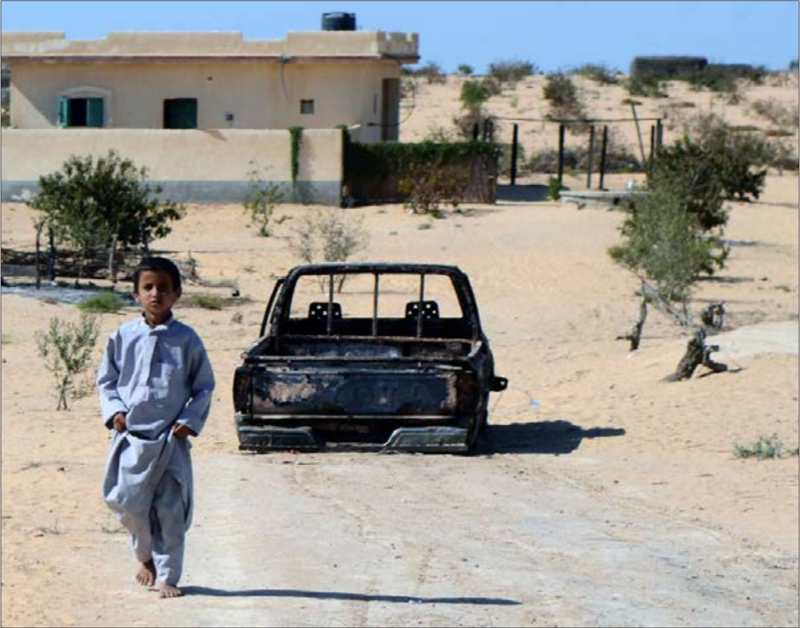
انعكست أسعار السوق السوداء (أو الموازية) سرعبا على الحياة اليومية (أ ف ب)

وقرر رئيس الحكومة فتح باب استيراد الأرز من الخارج بعد النقص الحاد في الأسواق على خلفية قيام الحكومة بالحدّ من زراعات الأرز لمعالجة العجز المائي، علماً أنّ هذا المحصول كانت مصر تحقق فائضاً فيه. ووفق وكالة «رويترز»، «عمدت مصر هذا العام إلى تقليص زراعة الأرز، الكثيف الاستهلاك للمياه، من أجل توفير استهلاك ماء الخبز مع