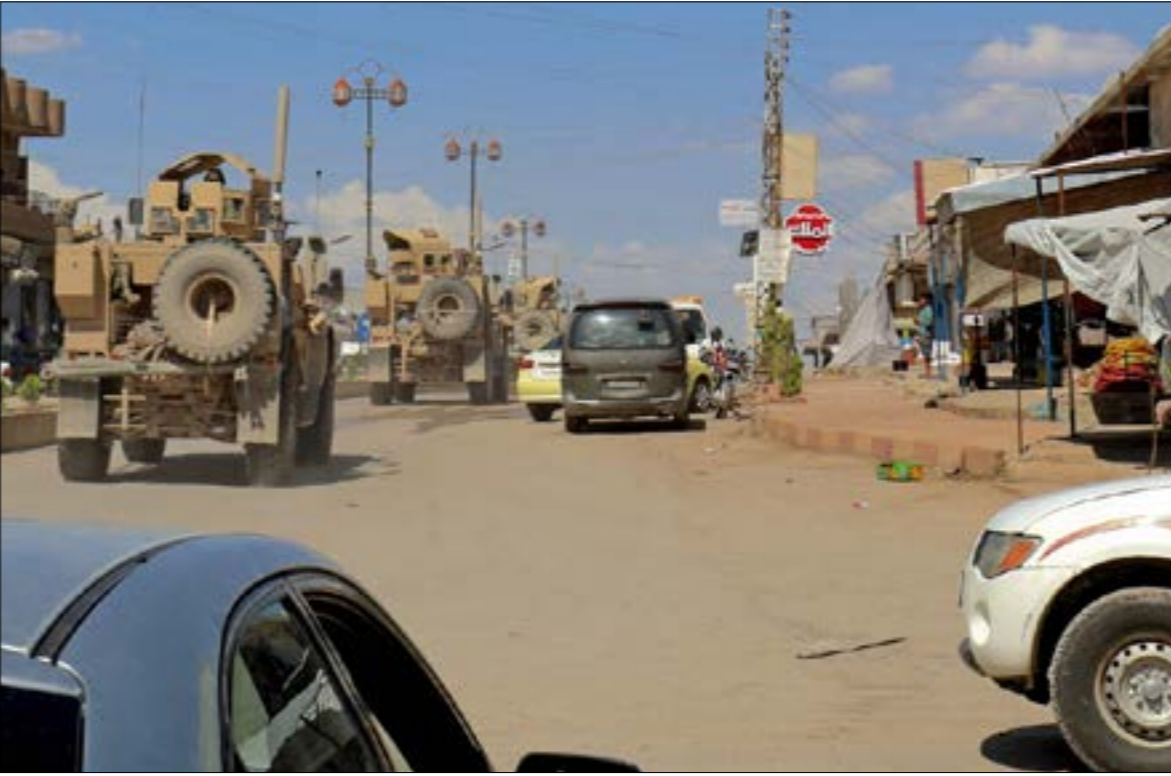
دورية تابعة لـ التحالف، في شوارع الرميلات في ريف الحسكة

التشكيلة الديموغرافية للمدينة قبل الحرب» وغير مرتبطة بـ«الوحدات» الكردية، على حدّ وصف جاويش أوغلو. وكان الأخير أكثر دقة في الحديث، إذ أكد أنه «لن يكون هناك دور لأي دولة ثالثة في منبج، بما حثت ستوتولي قوات من البلدين حفظ الأمن لحين تكوين هيكل «تعكس