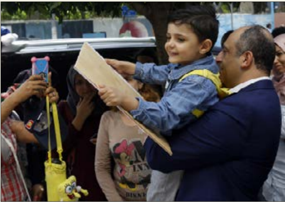
بوعاصي في العطام (مروان طحطح)

وعد وزير الشؤون الإجتماعية بيار بو عاصي أهالي الأطفال ذوي الصعوبات التعليمية بأن تغطي الوزارة تكاليف تعليم وعلاج أولادهم للعام الدراسي المقبل بالحد الأدنى. وأكدّ، خلال وثقة احتجاجية نفذها الأهالي أمام الوزارة، «أننا سنستمر بمساعدة الأطفال والوقوف إلى جانبهم حتى انتهاء البرنامج المتكامل الخاص بهم الذي تعدّه وزارة التربية». وإذ أقر بو عاصي بارتفاع تكاليف ادارة هذا الملف، دعا إلى «إعادة النظر في موازنة وزارة الشؤون لأن الحاجات كبيرة والأمكانيات قليلة». في المقابل، أعلن الأهالي أنهم سيسعدون إلى المدارس التي تدرّس أولادهم بعد عطلة الفطر لتأكدوا من تجديد وزارة الشؤون للعقود معها، خصوصاً أنّ الإدارات هي من البلعتهم بإمكان رفع الدعم عن تغطية تعليم ابنائهم. ولا يزال الشك يساور البعض ممن راجعوا في الأيام الماضية موظفين في الوزارة أبلغوهم أنّ تقديم طلبات الرعاية متوقف حالياً. وقد نقلت إحدى المعضّمات هذا الهاجس للوزير خلال الوقفة الاحتجاجية، فاجابها: «فوتي لجوا هلق واسالي». الام أكدت في ما بعد انها راجعت فعلا الموظف مرة أخرى، ولم يتغير جوابها.