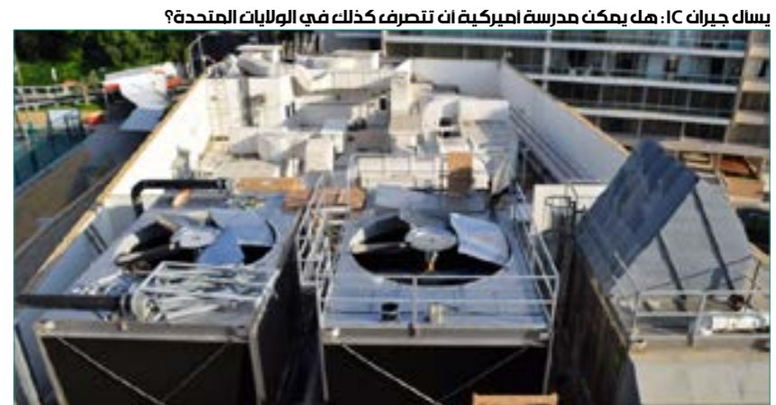
يسأل جيران IC: هل يمكن مدرسة أميركية أن تلصق كذبة في الولايات المتحدة؟

الاستقامة والخدمة العامة والحفاظ على البيئة. لكن قاطني الحي السكني، حيث المدرسة في منطقة عين المرصق يقولون إنهم يرون شيئاً آخر: لا يصدق سكان مبنى «بارك فيو تاور» المجاور تماماً لـ IC أن