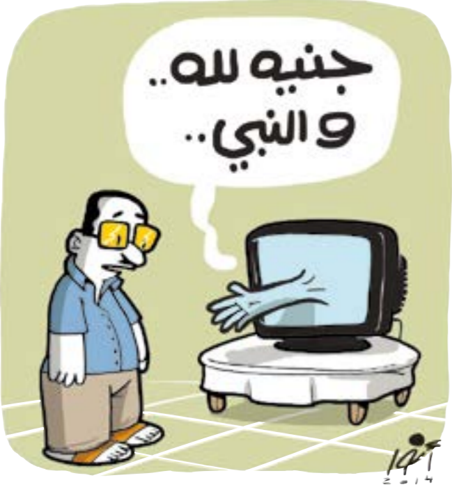
على المؤسسة: ملائمة الإعلانات الخيرية لنشاط «القانون»