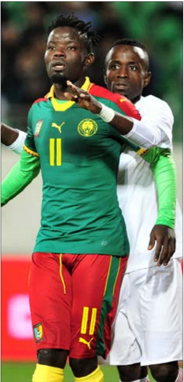
كرة القدم تتطلب مهارات فنية وقدرات جسدية

من الليبيري جورج ويا. إلى السنغالي الحاج ضيوف الذي لعب مع أندية فرنسية وإنكليزية واسكتلندية، والإيفواري الشهير بدييه دروغبا، الذي ملك قلوب تشلسي وحقق لهم لقب دوري أبطال أوروبا، وصولاً إلى لاعب ليفربول الإنكليزي المالي ساديو ماني، والغيني نابي كيتا نجم لايبزيغ الألماني، وإيريك بابلي صمام الأمان لمانشستر يونايتد، شجع لبنايون في أفريقيا فرقاً أوروبية بسبب مشاركة لاعبين منها تلقوا مع أنديةهم. يقول مرتضى: «لقد كان تأثير أفريقيا على بطولات الدوري في أوروبا كبيراً، يكفي أن تذكر: بدييه دروغبا، وصمويل إيتو، والأسطورة بابا توريه، وكولو توريه، وجاي جاي أوكوشا. كلهم جواهر قارتنا الحبيبة. وإذا كنت تحبّ اللعب الحل في كرة القدم حتماً ستختار تشجيعهم، وتلاحق الفرق التي يلعبون فيها حتى لو لم تكن مقيماً في أفريقيا.»