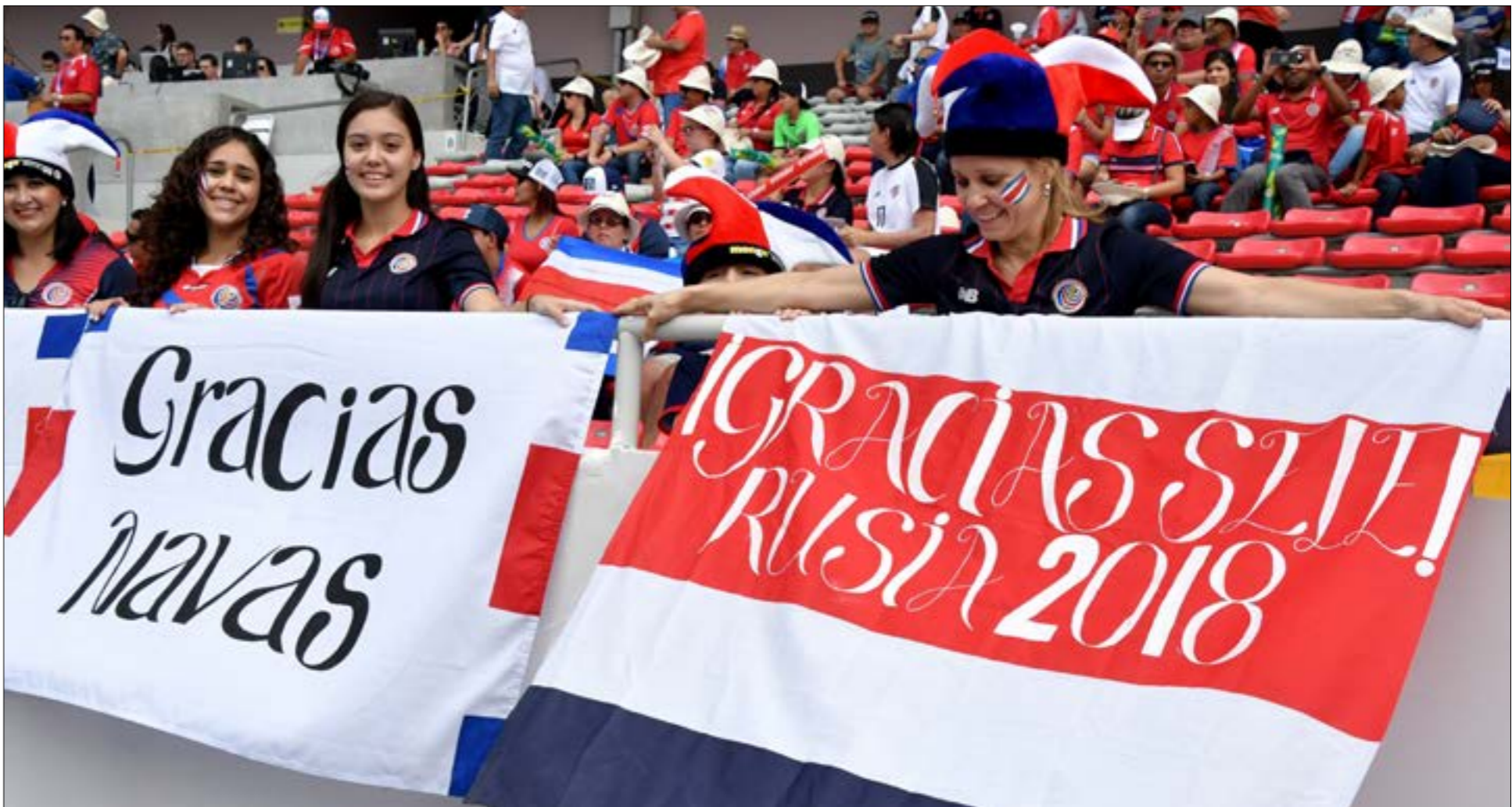
إدا تحدثنا عن كوستاريكا، فلا بد من الحديث عن كيلور نافاس حارس ريك مدريد

امام هولندا في النصف النهائي، انقلب السحر على الساحر لتخرج كوستاريكا بركلات الترجيح. يمكن اعتبار المجموعة التي وقعت فيها كوستاريكا في 2010 اصعب من مجموعتها هذا الصيف على الورق طبعاً، ففي البرازيل تحذرت المجموعة امام إيطاليا، إنكترتا والاوروغواي، أما هذا العام فالمنتخبات الثلاثة أكثر شباباً واندفاعاً في السنوات الأخيرة هم البرازيل، سويسرا و صربيا. المهمة لن تكون سهلة بالنسبة لابناء الوسط في القارة الاميركية والذين يلعبون للمرة الخامسة في كأس العالم.