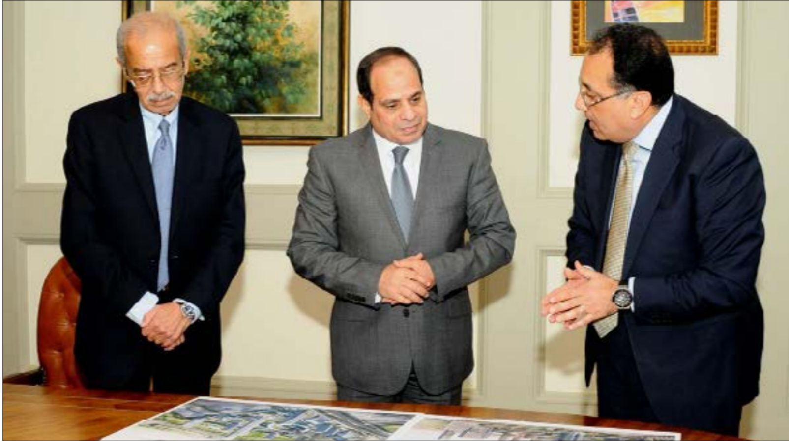
حين تفيد إسماعيل للملح في ألمانيا، كان مدبولي قائماً بأعمال حكومة سلفه

ورغم توقع استمرار بعض الوزراء في مناصبهم، ومن بينهم وزراء النقل