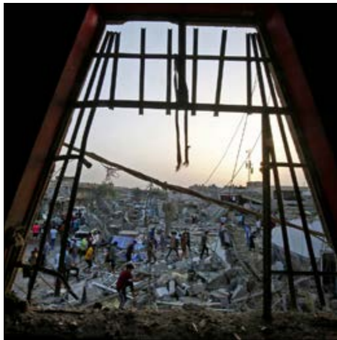
من آثار الانفجار الذي هزّ، أوله ثم امس، مدينة الصدر شرقي بغداد

ولم تكد تمرّ ساعات على تصويت البرلمان (بحضور 172 نائباً من أصل 329) على مشروع قانون يجحد عمل «المفوضية العليا المستقلة للانتخابات»، ويكسّف 9 قضاة «مشهود لهم بالنزاهة» بالإشراف على عملية العد والفرز على أساس يدوي، حتى أعلن «مجلس القضاء الأعلى» تشكيل لجنة لتولي مهام «المفوضية» بالوكالة، داعياً أعضاء إلى اجتماع يوم الأحد المقبل لتسمية