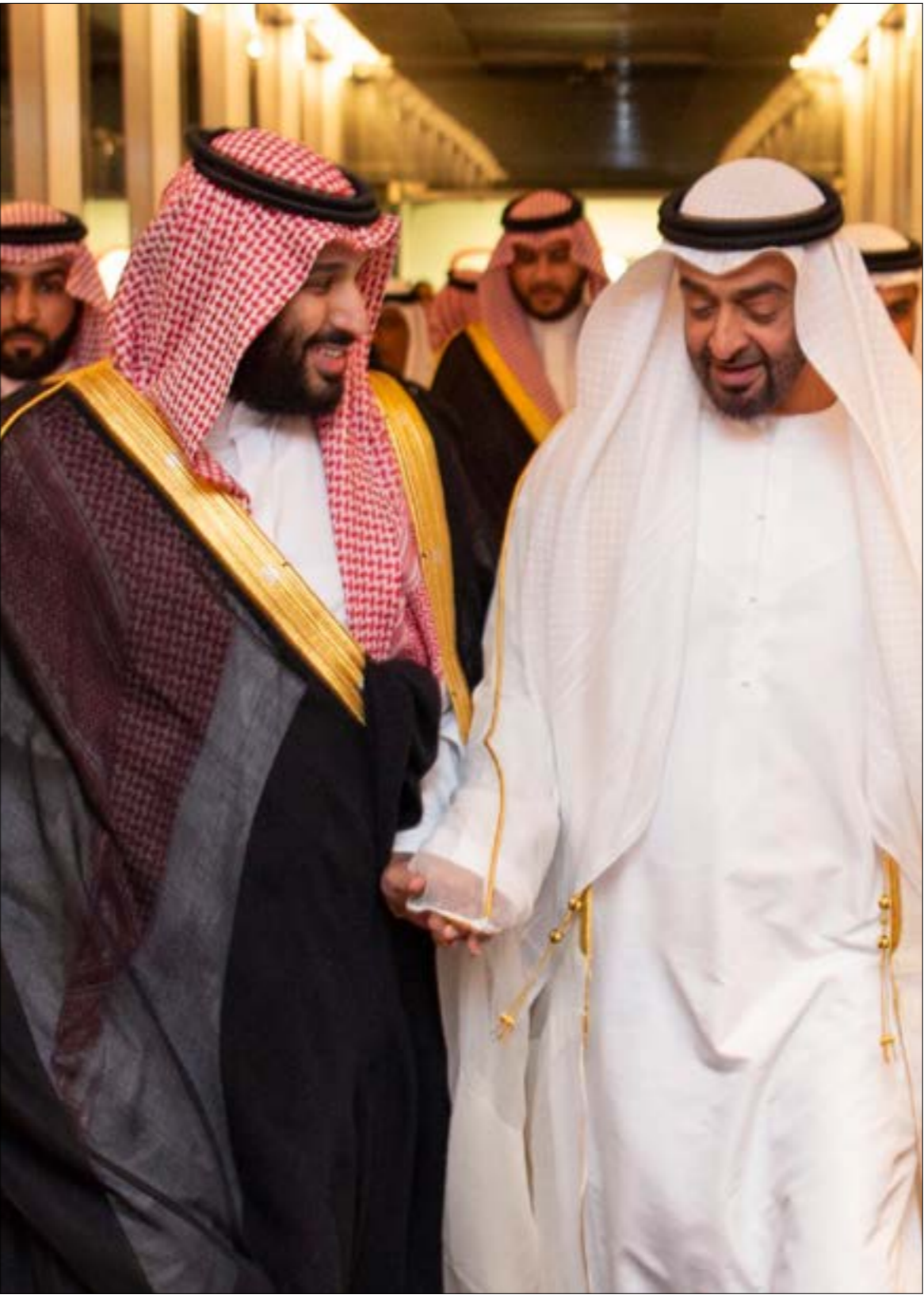
بدا الاجتماع محاولة لإفهام الدوحة بأن الهجوم لا يزال مستمرا