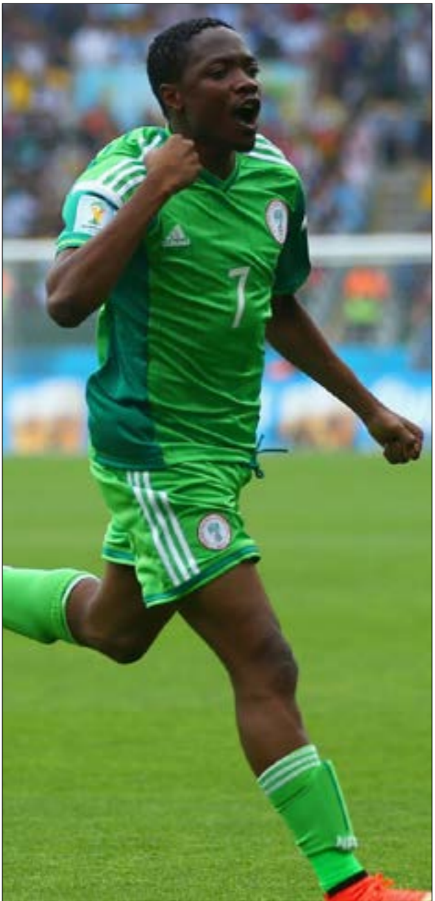
كرة القدم تتطلب مهارات فنية وقدرات جسدية

في جميع الأحوال، النيجيريون للذول الأفريقية وينتظر مبارياتهم