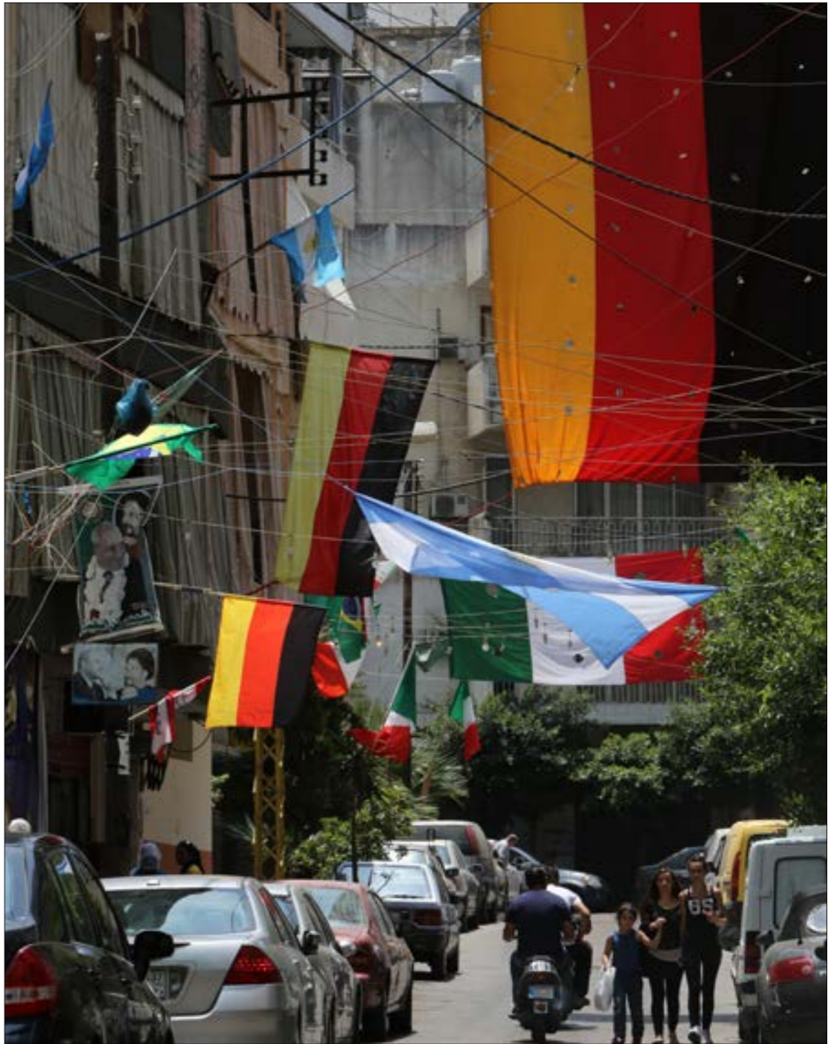
يتجمع مشجعو المنتخب الأرجنتيني حول شعار واحد: «شمس الأرجنتين ستذيب جليد روسيا»

يشكّك الشعب اللبناني حالة خاصة بين المجتمعات العربية، يشتهر بانقسامه في كلّ شيء.. يتقسم طائفياً وسياسياً ومناطقياً. يرسم شعبه جغرافيّة بلدهم كما يشاؤون. يختلفون في طريقة عيشتهم، مآكلهم وملبستهم، وحتىّ في لهجات تخاطبهم! فهل يمكن اللبنانيين أن يتوحّدوا في المونديال حول الفرق الاجنبية؟