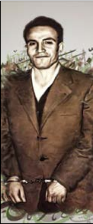
كان العربي بن مهيدي أحد قياديين الثبث حذرا الموترم (ع الوربة)