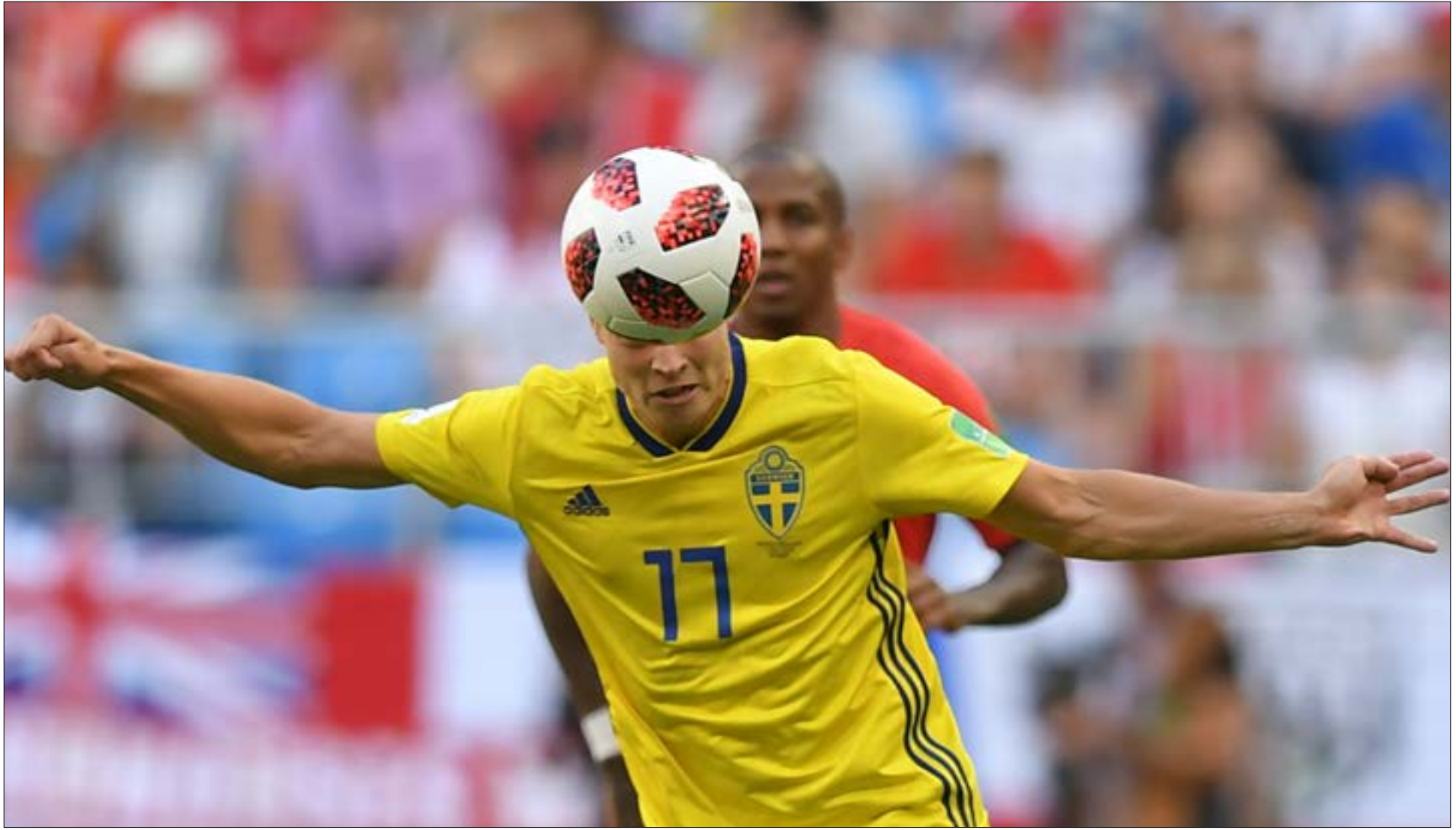
المنتخب السويدي هو احد المنتخبات التي تملك تنظيماً دفاعياً جيداً

بوجود ركيزتيه القائد ديبغو غودين وزميله في اتلتيكو مدريد الإسباني خوسيه ماريّا خيمينيز. وأثبت منتخب الأوروغواي أنه صاحب أقوى خطوط الدفاع في البطولة، فكان الفريق الوحيد في الدور الأول الذي لم تتلق شبكة أي هدف، فتمكّنت الأوروغواي بالتالي من التأهل إلى الدور ربع نهائي البطولة بفضل هذه الصلابة الدفاعية. ورغم الانتحارات البدنية الكثيرة التي وقعت بسبب اعتماد الأسلوب الدفاعي، إلا أنّ المونديال الروسي شهد تضيقاً في أداء اللاعبين، إذ بلغت نسبة البطاقات الحمراء 0,06 لكل مباراة، وهي نسبة ضئيلة تؤكد غلبة اللعب النظيف على المباريات.