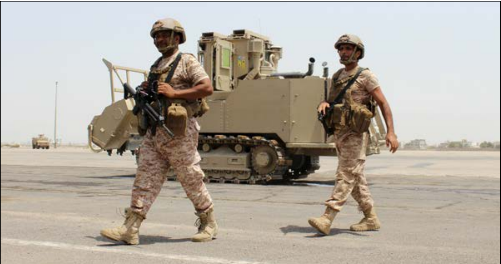
نشأت الإمارات شبكة جاسوسية ضخمة في جنوب اليمن لصالح الاميركيين

الإيراني استبق لقاءه سيد الكرمليين بتصريح وضع فيه مهمته في إطار «الاستراتيجية»، و«المنطق» في العلاقات الإيرانية - الروسية. الأهم ما خرجت به الزيارة، والذي يمكن وضعه في إطار الرد الإيراني الاستراتيجي، أو جزء أساسي من هذا الرد، على الهجعة الأميركية الشرسة ضد نظام طهران، بما من شأنه تفرغ جانبي كبير من العقوبات الأميركية من مضمونها، وتقوية الموقف الإيراني في اليوم التالي للتحرك العقوبات حيز التنفيذ.