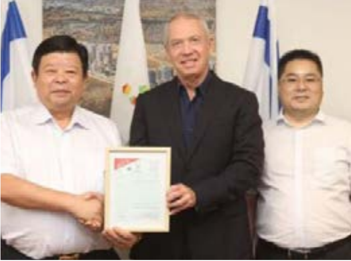
ممثلات عن الشركة الصينية مع وزير الإسكان الإسرائيلي عام 2016 بعد الاتفاق على تنفيذ مشاريع في مستوطنات في فلسطين المحتلة

ولدى التدقيق في ملفات «جيانغسو نانتونغ»، يتبين أن هناك شبكات كثيرة تدور حول هذه الشركة لجهة تعاملها المباشر مع الكيان الصهيوني، إذ إن لها فرعاً في منطقة إرامات غان الإسرائيلية، شرق مدينة تل أبيب في فلسطين المحتلة. وفي عام 2016، وقعت الشركة عقوداً