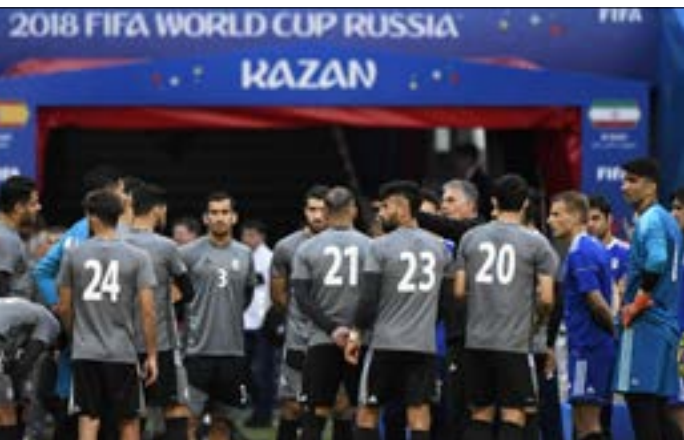
لجنة كتيبة المدرب كارلوس كيروش إلى التنظيم الدفاعي

بوجود ركيزتيه القائد ديبغو غودين وزميله في اتلتيكو مدريد الإسباني خوسيه ماريّا خيمينيز. وأثبت منتخب الأوروغواي أنه صاحب أقوى خطوط الدفاع في البطولة، فكان الفريق الوحيد في الدور الأول الذي لم تتلق شبكة أي هدف، فتمكّنت الأوروغواي بالتالي من التأهل إلى الدور ربع نهائي البطولة بفضل هذه الصلابة الدفاعية. ورغم الانتحارات البدنية الكثيرة التي وقعت بسبب اعتماد الأسلوب الدفاعي، إلا أنّ المونديال الروسي شهد تضيقاً في أداء اللاعبين، إذ بلغت نسبة البطاقات الحمراء 0,06 لكل مباراة، وهي نسبة ضئيلة تؤكد غلبة اللعب النظيف على المباريات.