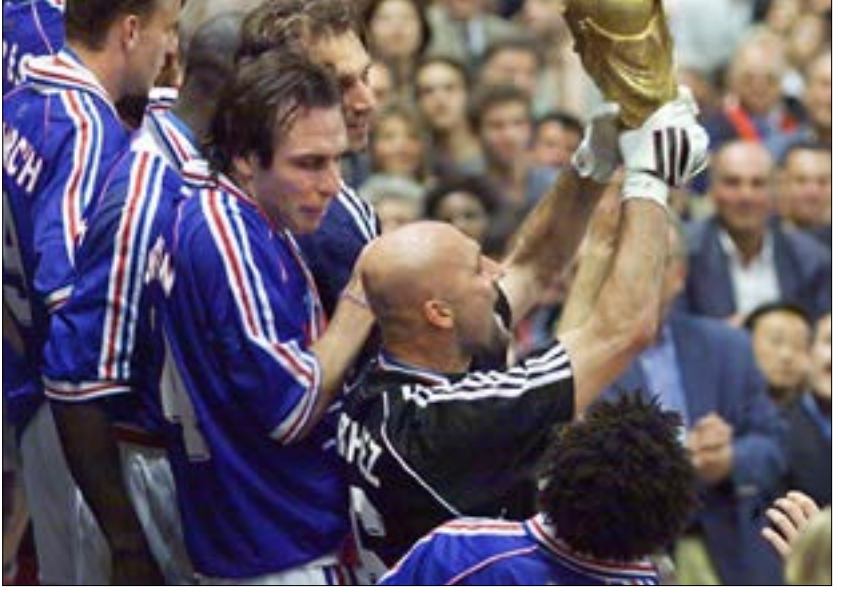
ولد زيدان في مارسيليا ونشأ فيها (بورجو) شربت (أغنية) (جاءه ديمارون (أغنية))

أنفسهم يحملون ذلك الكأس حتى في أكبر أحلامهم. وفي المباريات التحضيرية للبطولة، قدّم المنتخب الفرنسي الذي كان يضم العديد من اللاعبين من أصحاب الأصول الأفريقية وانباء المهاجرين أداءً باهتاً. لم يكن من المتوقع أن يقدموا الكثير خلال المونديال. خصوصاً بعد تعثرهم أمام كل من روسيا والسويد الديوك حينها كانوا يقاتلون لأكثر من كأس العالم، وأكثر من مجرد لقب وميدالية ذهبية. كانوا «يستثمرون» في أعضهادهم الطويل لأفريقيا.