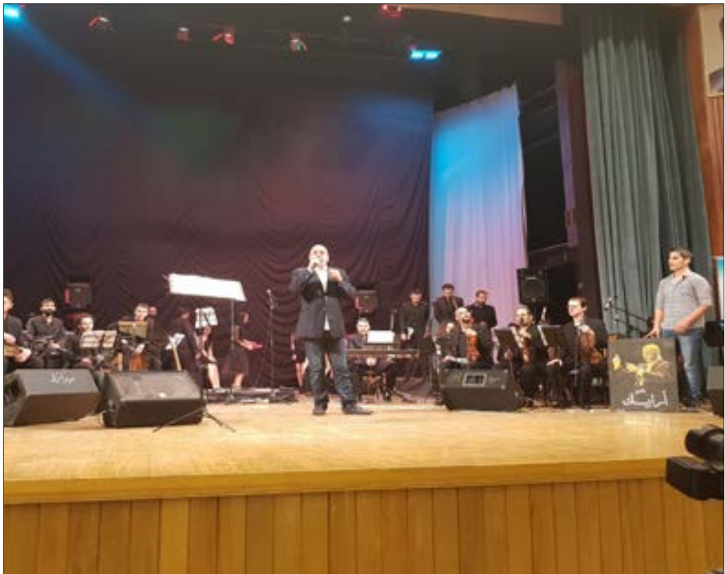
ملا الجمهور القاعة موزعاً أيضاً على درجها في انتظار النغم (الأخبار)