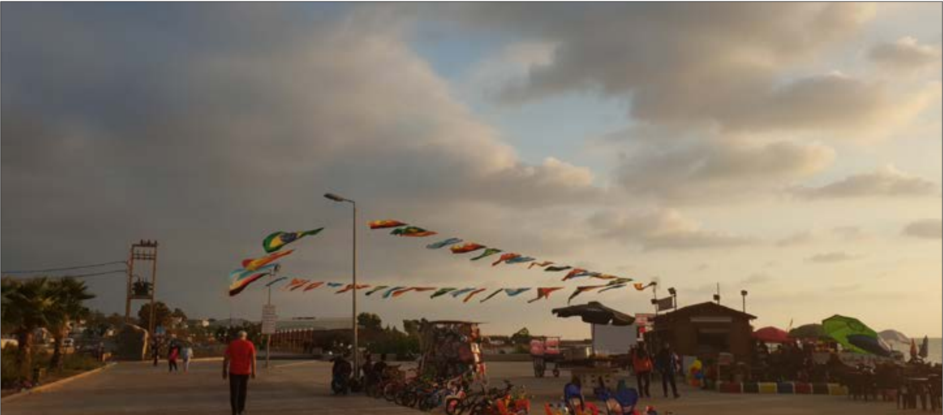
بحه شاطئة التوسط إلى مرسيليا وناپولي (الأخيار)