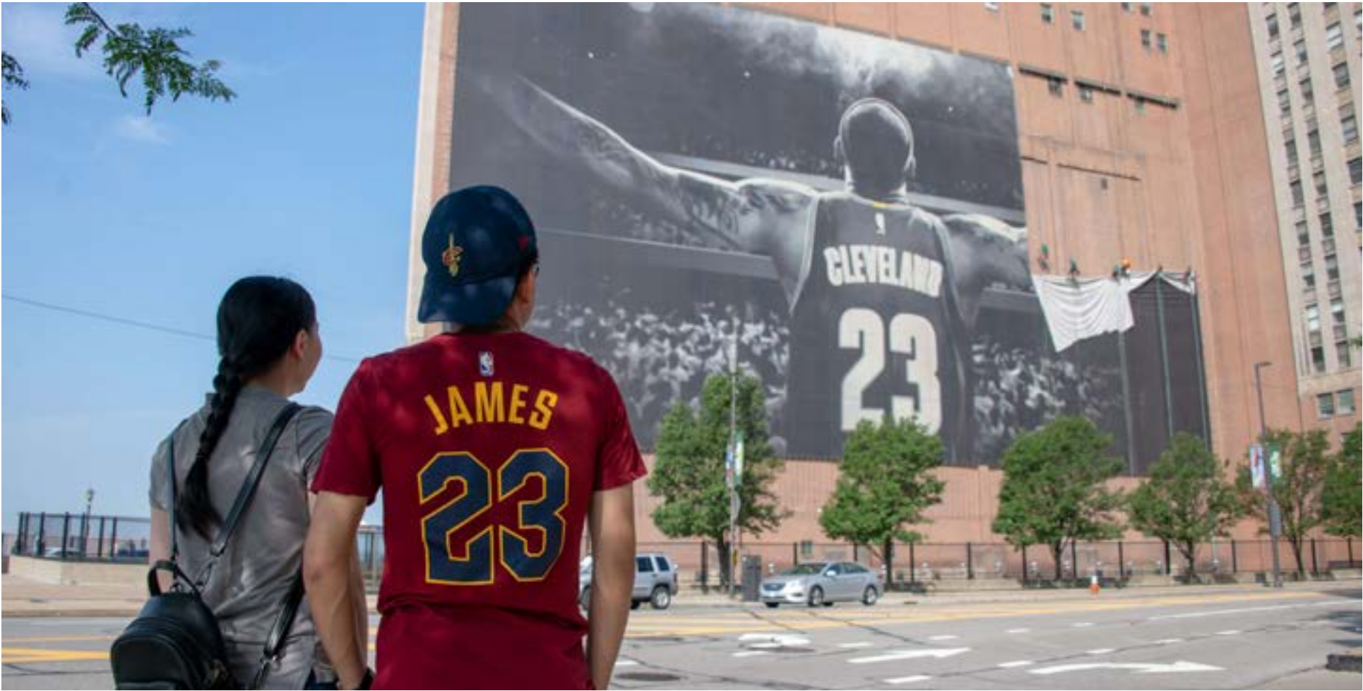
جايمس الذي زرم بزور الألقاب في كليفلاند لن يعاني كثيراً في لوس انجلوس

وفي مفاجاة من العيار الثقيل، أعلن غولدن ستايت تعاquه مع اللاعب ديماركوس كازننز من نيو أورليانز بـ11مليون دولار لمدة عام. وتعرض كازننز (27 عاماً) والذي يجيد اللعب في مركزي الجناح والارتكاز لإصابة في الرباط الصليبي الموسم الماضي الذي خاض فيه 48 مباراة مع نيو أورليانز، وبلغ معدله في المباراة الواحدة 25,2 نقطة مع 12,9 متابعه، و5,4 تمرية حاسمة. وكان كازننز محط اهتمام لوس أنجلوس ليكرز قبل أن يتعاقد مع ليجرون جيمس. الحرب طويلة، والأيام تتأرجح شرقاً وغرباً.