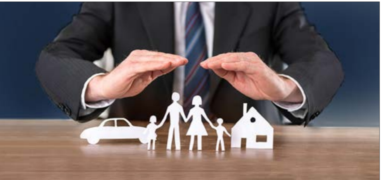
تخوف من ان ينهار صندوق التغطيات الاجتماعية في نقابة المهندسين قريبا

بخلي مسؤولية شركة شديد من التزاماتها المتعلقة بوثائق التأمين السارية والمطالبات التي تنشأ عنها.