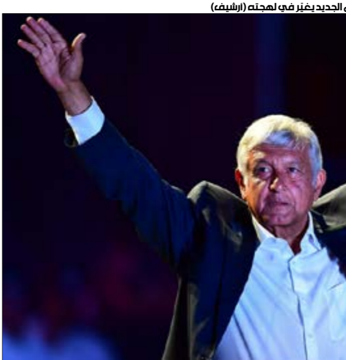
اطلق بومبيو، امس، الحملة الإعلامية المنظمة ضد إيران والتي خطط لها فريق ترامب

بشركاء المكسيك في التحالف، إن الرئيس الجديد يغير في لهجته (الريف)