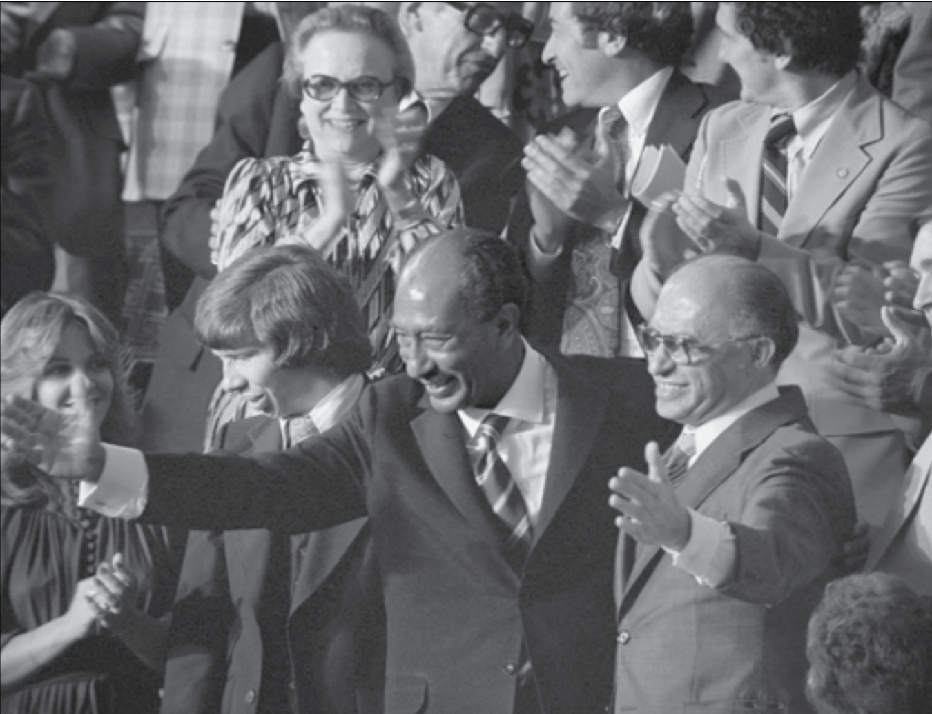
ارتفع صوت السادات حائفاً وهو يقول: «مين هم اللي يقدروا يتهموني بالخيانة؟»

أرضك. إذا قبلت ده، كان بيه. وإذا مش قابل، ما علش. ويا دار ما دلك شي». وردّ الأسد، وهو يكاد يتميّن من الغيظ: «الشر، يا أنور، دخل. وهلا الدار كلبها» (1).