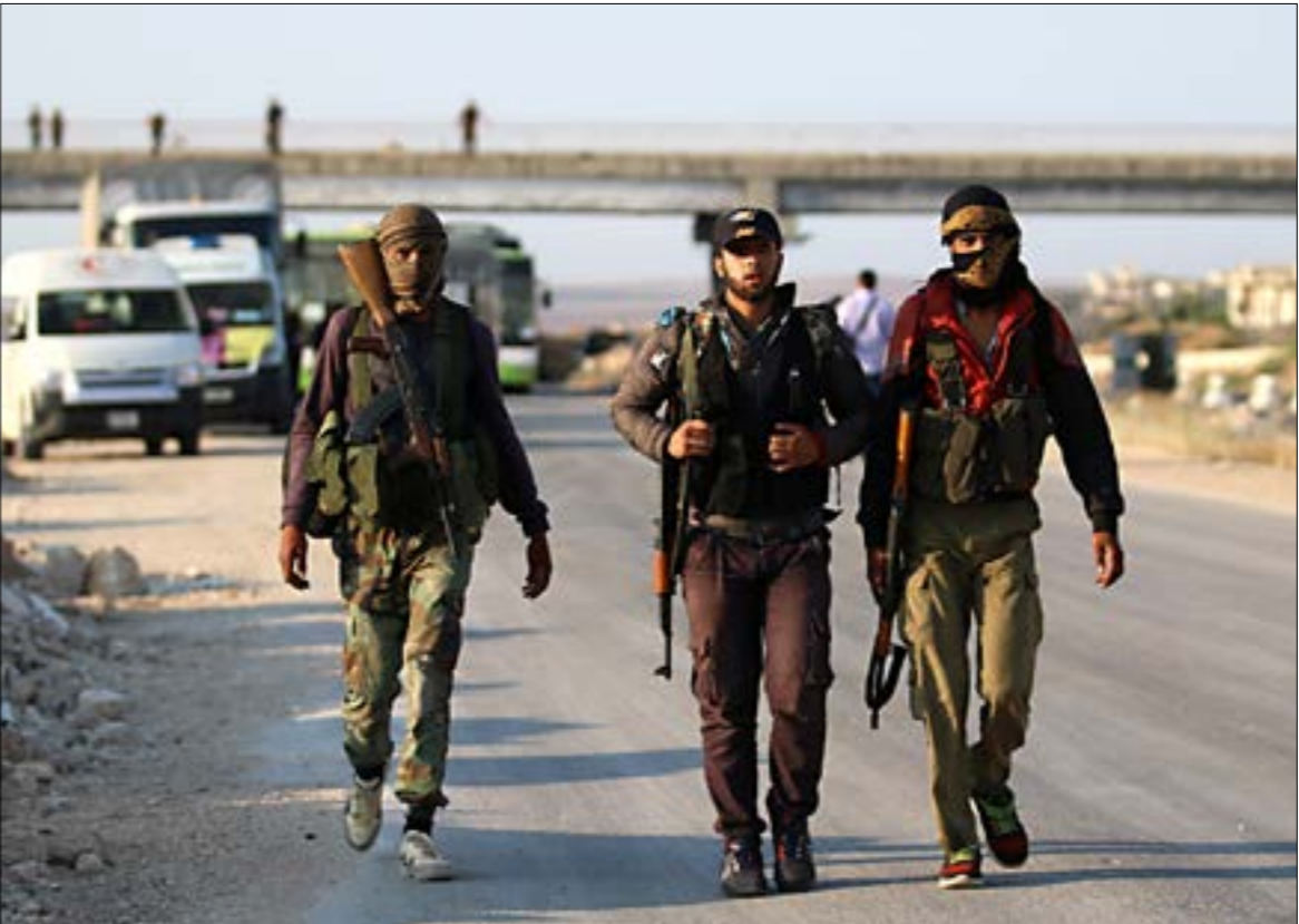
خرجت الدفعة الثالثة من الفرطيل من ريف القنيطرة ووصلت مساءً إلى ريف حماة

ضد «داعش»، من دون أن يصدر أي تعليق رسمي على الموضوع. وفي الميدان، شهدت خطوط التماس مع التنظيم، من ريف القنيطرة شمالاً، وحتى محيط جبلن جنوباً، اشتباكات وقصفاً عنيفاً شارك فيه سلاح الجو الروسي، وكثف الجيش استهدافه المدفعي لمواقع التنظيم في جبلن وعين ذكر ونسبل وعدوان، إلى جانب نقاطه في تل الجموع. ودخل الجيش بلدة غدير البستان، على الجانب الشمالي من جبب «داعش»، وتقدم من محيط تل الجانبية باتجاه تل الجموع، وسط تمهيد مدفعي كثيف، واستخدم الجيش أسس صواريخ متوسطة المدى، في استهداف مواقع التنظيم الحصينة البعيدة عن خطوط التماس. وسبّب إطلاق تلك الصواريخ تدخل العدو الإسرائيلي، وإطلاق صواريخ اعتراضية من منظومة «مقلع داود» التي نشرّت حديثاً، وفق بيان جيش العدو، الذي لم يوضح إذا ما أصابت صواريخه أهدافها، التي سقطت ضمن الأراضي السورية. وبينما أكدت مصادر معارضة هروب كل من قادة فصائل اللواء فرسان الجولان، و«الوية سيف الشام» و«جيش الأيبيل»، إلى إسرائيل، جرى الحديث عن احتمال إخلاء دفعة جديدة من أعضاء «الخوذات البيضاء» وعائلاتهم، على غرار الدفعة السابقة. وخلال أمس، خرجت الدفعة الثالثة من المرشحين من ريف القنيطرة، ووصلت مساءً إلى ريف حماة الشمالي، لتعبر نحو مناطق سيطرة الفصائل المسلحة