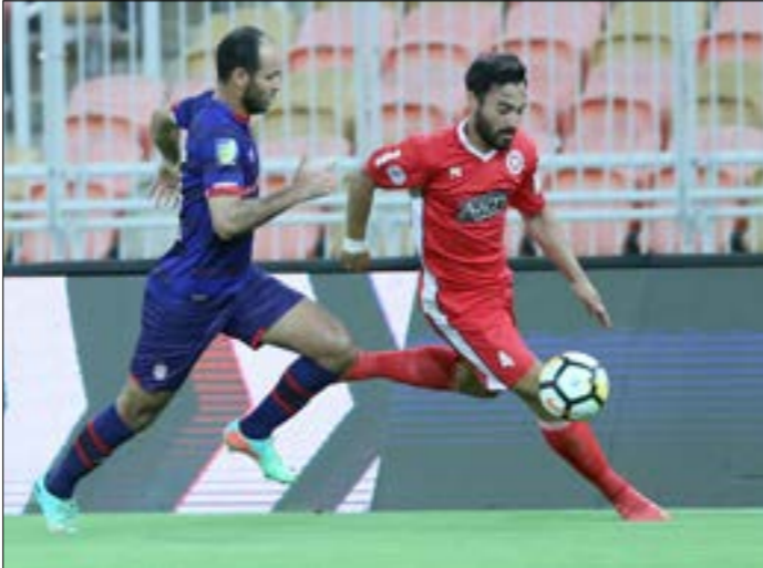
(مدان الحج (على)