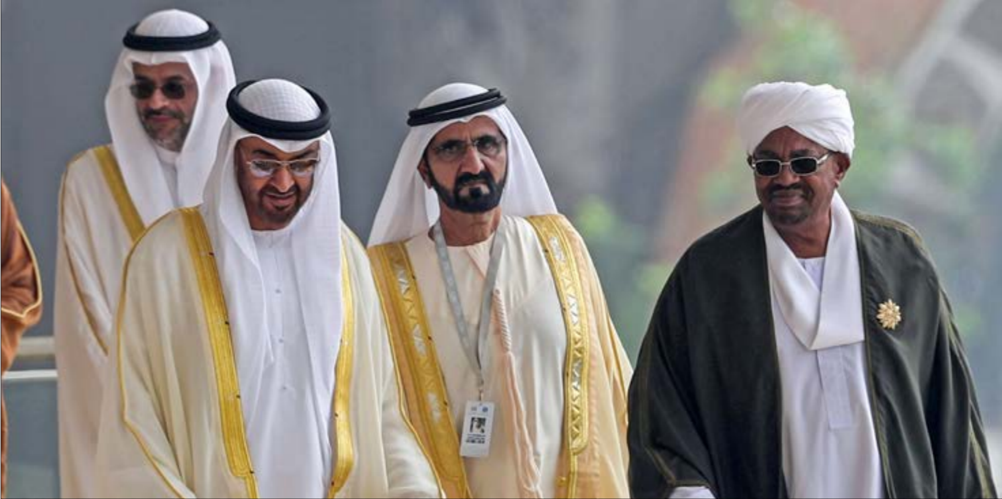
لم تترك السعودية والإمارات نظام عمر البشير حتى دفعتهما دفعا نحو تبديل تموضعه الاستراتيجي

في خطوة لا تخلو من دلالات عقب الضجة التي أثارتها الوثائق المسربة من السفارة الإماراتية في سلطنة عمان، سارع المسؤولون الإماراتيون، أمس، إلى إرسال برقيات تهنئة إلى سلطان عمان، قابوس بن سعيد، بمناسبة اليوم الوطني للسلطنة. وشملت لائحة البرقيات رئيس الدولة خليفة بن زايد، وحاكم دبي محمد بن راشد، وولي عهد أبو ظبي محمد بن زايد، وكذلك ممثل رئيس الدولة سلطان بن زايد. وكانت السفارة الإماراتية في بيروت قد علقت على التسريبات بوصفها إياها بأنها «عارية من الصحة تماماً، ولا علاقة لها بأي مراسلات دبلوماسية إماراتية، وهي من نسج خيال كاتبها». واتهمت السفارة «الأخبار» بـ«السمعي لتشويه صورة دولة الإمارات»، ودعت «المسؤولين اللبنانيين الذين يتنادون دائماً بأفضل العلاقات مع دول الخليج العربي» إلى «اتخاذ الخطوات الرادعة والكفيلة بالألا يتحوّل لبنان إلى ساحة إعلامية تروج من خلاله الأخبار الكاذبة».