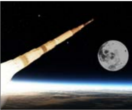
145 مليون دولار

تهدف المبادرة التي أنشأتها اليونيسف وجمعية الفرص الرقمية عام 2017 إلى دعم الشباب المهتمش في لبنان من خلال تطوير مهاراتهم المهنية بهدف تأمين مصادر الدخل، وذلك من خلال تشجيع القطاع الخاص على توظيفهم و تمكينهم. وهي تدرج ضمن إطار مشروع «جيل»، جيل الأفكار الرائدة ضمن برنامج الشباب لليونيسف، ولا يوفر برنامج B.O.T فرص العمل للشباب فحسب، بل يمنحهم أيضاً فرصة لتحسين مهاراتهم أثناء كسب مدخول، وذلك من خلال مسارات التعلم المختلفة والتوجيه المهني بعد تخرجهم من برنامج «جيل» الذي يهدف إلى تزويدهم بالمعرفة المتعلقة بالابتكار والتكنولوجيا وريادة الأعمال الاجتماعية.