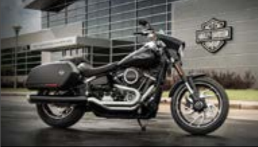
145 مليون دولار