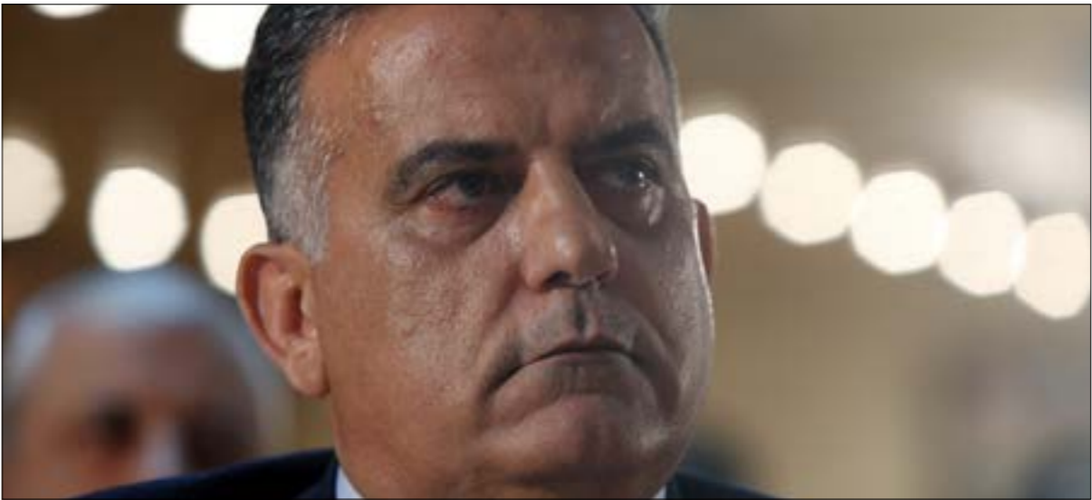
لم يشترط السوريون لتسليم عوده النازحين سوه أن يكون الأمن العام هو المرجع (هيلم الموسوي)

الجمهورية تكليفه إياه محاوراً السلطات السورية في ملفي النزوح السوري والأمن، يجب: «لم أسمع من أحد، أي أحد، اعتراضاً على هذا التكليف ولا على تواصلي والحوار مع سوريا. لا شروط على هذا التكليف، ولا قيود، في أي حال لم يدل أحد بتخلفه عن المهمة هذه. الجميع يجهدون أنهم يؤيدون العودة الطوعية للنازحين السوريين إلى بلادهم، ولأنني لم أسمع أحداً يطالب بقائهم حيث هم، فمن الطبيعي أن