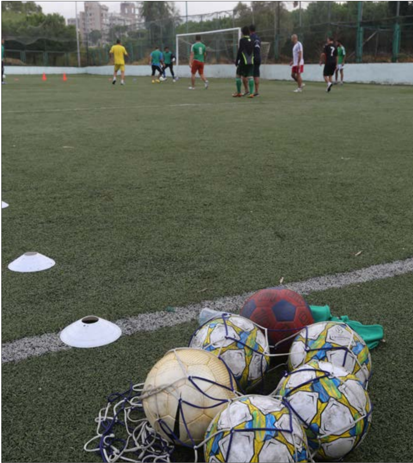
تعلق الأكاديميات على رسوم الاشتراكات المدفوعة عند المالئ (الربح) - مهران - ططخر

ملعبٌ مستأجر، اطقم رياضية، إعلانت على مواقع التواصل الاجتماعي، وصافرة مبروك، بتّ تملك أكاديمية لتعليم كرة القدم للناشئين، هؤلاء الناشئون، يتناحرون على يد ناشئة أيضاً خاض موسماً أو اثنتين في دوري الدرجة الأولى، لكنه ظهر على شاشة التلفزيون، وغالباً لا يزال بإمكانه اللعب مع المنتخب اللومبي، لكنه بطريقة ما، يستطيع ان يُعلم جيلاً أساسيات اللعبة. ومع ملعبٍ اوسع، مكتب، اسمٌ أجنبي، رخصة، ومجموعة من المدربين، يُصبح بإمكان فريق الأكاديمية التي تملكها ان يشارك في المسابقات الرسمية، وان ينشط لاعبه مع المنتخب الوطني، الف مبروك!