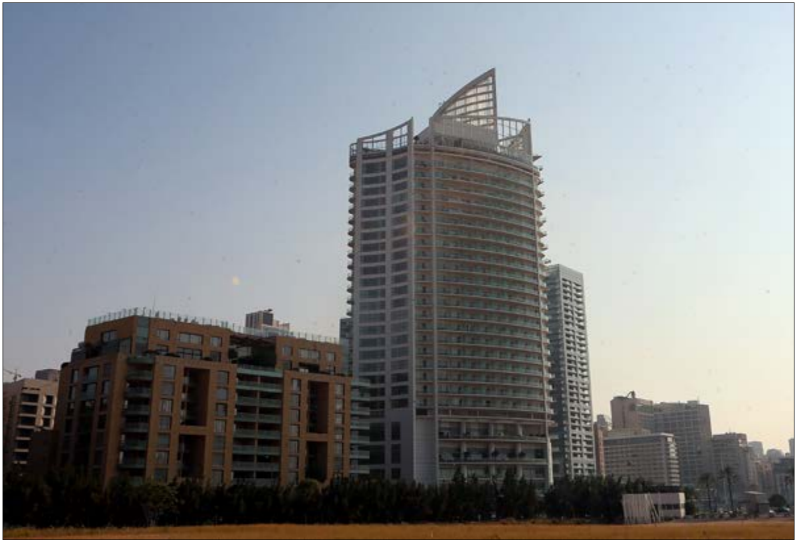
خففت الجمعية العمومية تعويضات أعضاء المجلس عن 25 ألف دولار سنوياً إلى 15 ألفاً (هيلم الموسوي)

بها مناقشة القوانين. فقد شكّل البرلمان ثلاث لجان نيابية لدرس ثلاثة اقتراحات قوانين. يرتبط الأول بالتنقيب عن النفط في البر، والثاني بإنشاء الصندوق السيادي، والثالث بتأسيس الشركة الوطنية للنفط لكن دخول مجلس النواب في «غيبوبة الانتخابات الرئاسية» حال دون الدفع بها إلى الهيئة العامة. بالأمس، وبعدما دعا رئيس مجلس النواب نبيه بري لعقد أول جلسة للجان المشتركة (خلال ولاية المجلس الجديد) الخميس المقبل، تبين أن جدول الأعمال يضم واحداً من القوانين الثلاثة وهو المرتبط بالصندوق السيادي. على قدر أهمية هذا الملف، أتت مغربته من زاوية ضيقة. وقد حال سبلي.