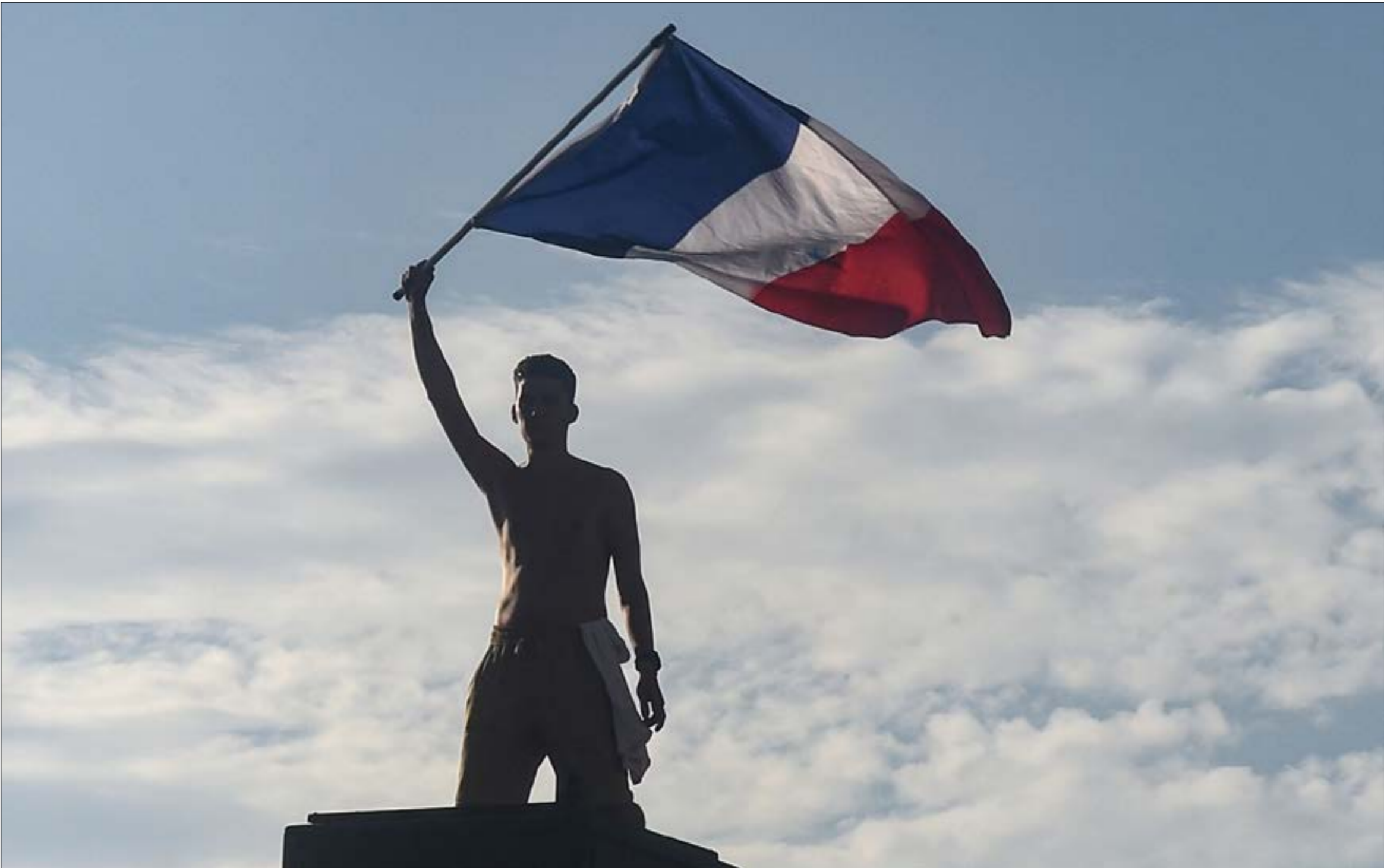
حب مرسيليا اله جبك (ديسن هورما، أرف)