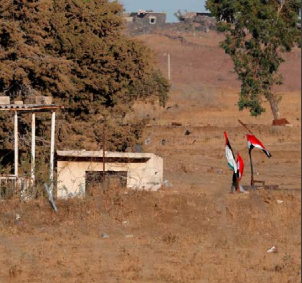
عناصر الجيش السوري في القنيطرة كما يدعوا امس من الجانب المحتل من الجولان

وكان دم الأبرياء في السويداء، اعاد إنعاش المعارضة السورية ورموزها، بعد سلسلة الهزائم التي تعرّضت لها وسقوط مشروعاها بالضربة القاضية في الجنوب السوري. سرعان ما تلقّف المعارضون وإعلامهم جريمة السويداء، ومعهم بعض الإعلام الغربي وحلفائهم في لبنان والخليج، وبدأوا حملة تحريضية منذ صباح أول من امس، هدفها تاليل الرأي العام في السويداء ضدّ الدولة السورية ودفع الأهالي إلى التمرد على الدولة والمطالبة بحكم ذاتي، بذريعة أن الدولة هي من وجّهت إرهابيي «داعش» لضرب المحافظة. طوال السنوات الماضية، تعرّضت السويداء إلى اعتداءات المجموعات الإرهابية من شرقها حيث سيطر «داعش» لفترة والعصابات المحسوبة على الأميركيين مثل «جيش الثورة» و«أحرار الشرقية»، ومن غربيها حيث كانت تسيطر عصابات «الجيش الحر» و«جبهة النصرة» وفرقة شباب الشنة» وغيرها. وكان المعارضون إياهم، يبرزون جرائم هؤلاء بذريعة أن السويداء تناصر الدولة السورية.