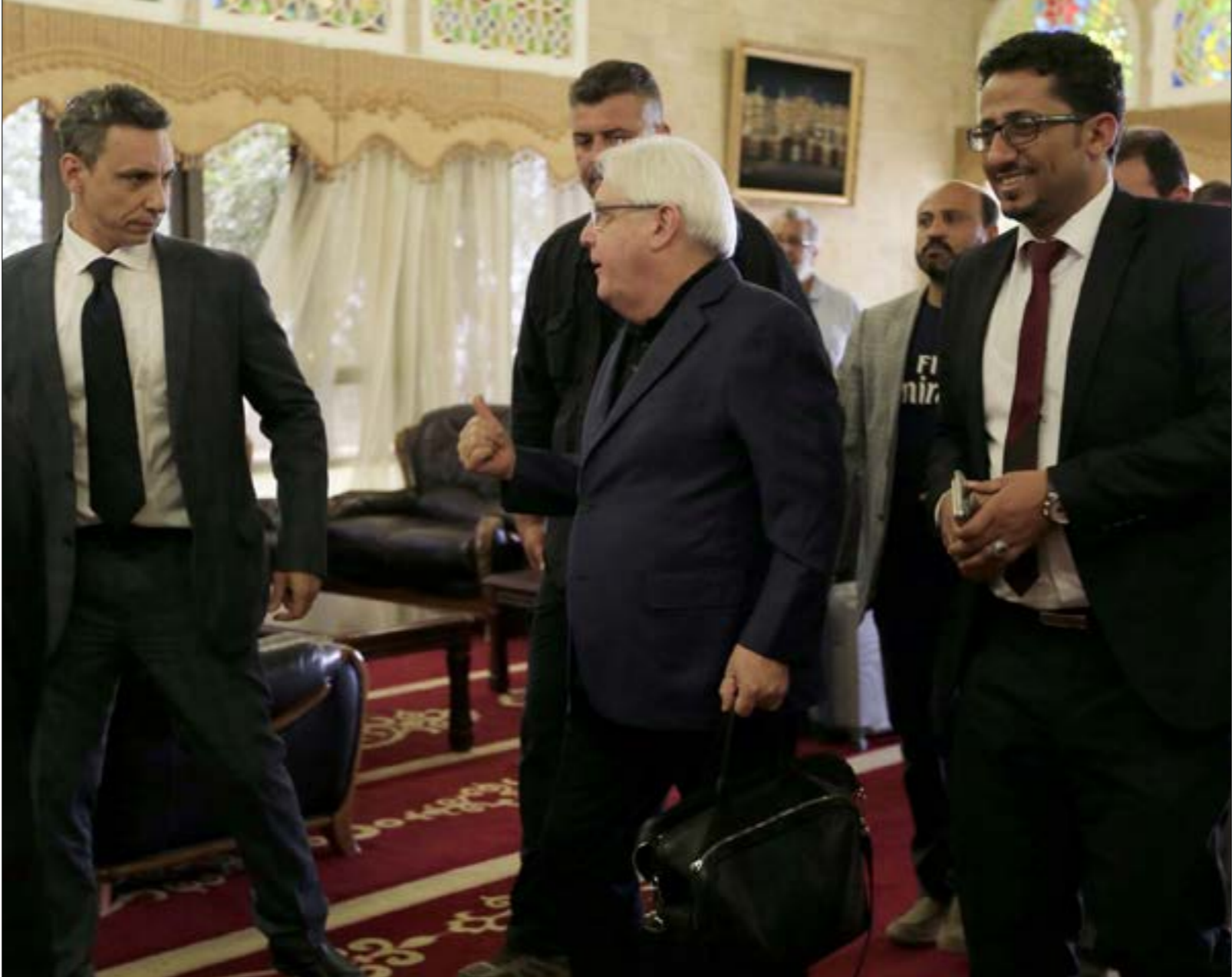
يحاول غريميث الانطلاق من مغلّات جزئية تمهيدا للوصول إلى الحك الشامل

في المقابل، لا تزال الرياض وأبو ظبي ترأهتان على خطب بديلة، قد تكون آخر ما تبقى لديهما لتحقيق إنجاز يمكن بواسطته الخروج من مستنقع الحرب. ولم يكن إعلان السعودي ليل الأربعاء - الخميس، تعليق مرور شحنات النفط عبر باب المندب، إلا