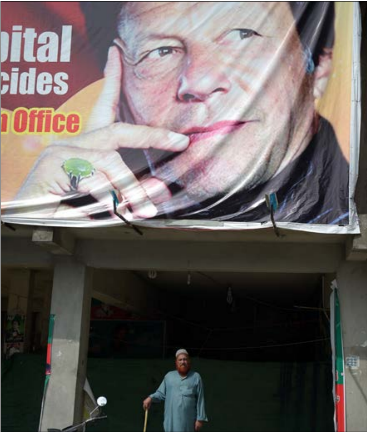
وصف خان حكام العالم الإسلامي بـ«الصح التي تجرأها واشنطن،

عن إرسال الحكومة الباكستانية قوات من الجيش إلى السعودية، من دون اكتساب ثقة المجلس الوطني، وهو ما نتج عنه قيام رئيس مجلس الشيوخ الباكستاني، السينااتور رضا رباني، باستدعاء وزير الدفاع خرم دستغير، لتقديم إيضاحات حول خلفية القرار. بوجه خان، الذي فاز مع بلاده في بطولة العالم للكريكت كلاعب، انظاره