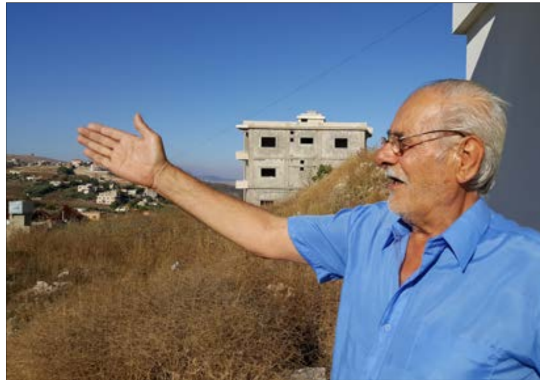
الوالد حيث قُتل طفله وعائلته

نسبياً، فيما كان القتيك يُلملم ما بقي من حياة، ثم يهقل جفّت أو تمّت على تلك الحياة. لأنّ هناك فنّ قصر، وهناك فنّ استسهل، وهناك فنّ ضحك أو بكى ورحل. لكل ذلك، وأكثر. نورد اليوم حكايات بعض تلك المجازر، على ضحالة ما في الارشيف، فضلاً عن شحيح الذاكرة الشفوية، بعد طول المدّة، ليعرف، فنّ لا يعرف، اليوم، وليعرف فنّ سياحي بعدنا، غداً، أنّ ذلك حصل، بعض جفا حصل، في تموز واقترانه من أشهر وأيام وسنين وبعقود