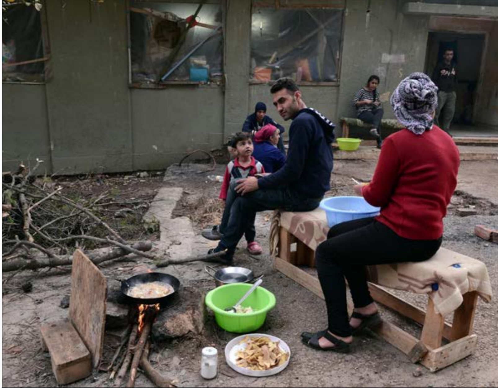
كثير من السوريين عادوا بواسطة رحلات جوية إلى طهران ومنها إلى سوريا

«ماذا ستفعل إن بقيت في حلب؟» يسألهم، ويبدى ارتجوحاً كبيراً في خلال الفترة التي أمضاها إليهم في حلب تسلمت الاحتمالات إلى قائمة أولوياته، وبعد أن كان يظنّ العودة إلى حياة اللجوء خياراً محسوماً، يجد نفسه اليوم حائراً. «كلما فكرت باني بدني سافر تهريب مرة تالفة بوجعني قلبي، الحياة بحلب لسه صعبة بس والله بتردّ الروح». سيكون على الرجل أن يتخذ قراره في غضون شهر، فإما أن يطوي صفحة أوروبا نهائياً ويرسل بطاقة «الكيمليك» إلى ابن عمّه، أو أن يحزم حقائبه ويغادر.