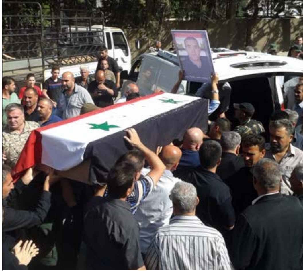
شيعت السويداء عددا كبيرا من الشهداء، ولقت الجائيت الملمع السوري