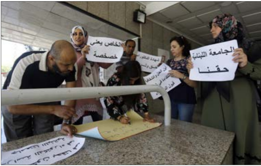
من الاعتصام امام مبنى الدارة المركزية للجامعة اللبنانية امس

لافت من الطلاب على المعدلات التي تم رفعها، ما جعل الطلاب يتهمون الإدارة بالاستنسابية غير المبررة. اللافت هو تحرير العمادة لقرار تحديد أعداد الطلاب المقبولين لجهة اعتبارها أن تحديد العدد هو