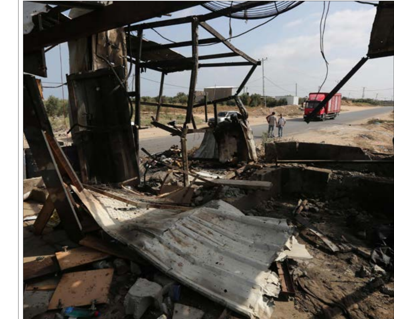
الانسحاب الإسرائيلي من غزة لم يفض إلى استقلال هذا القطاع الذي بقي محاصراً (فان)