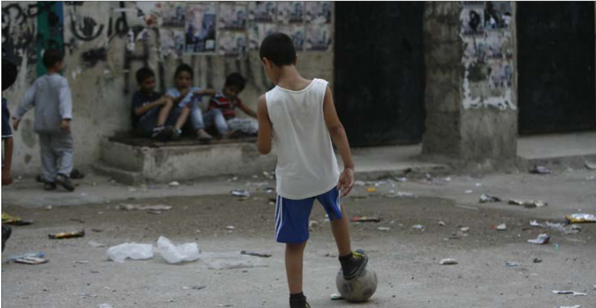
شارك في الدوري الفلسطيني 14 فريقاً نصفها من مخيمات بيروت