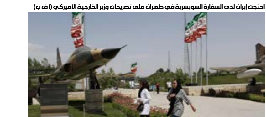
احتجت إيران لدع السفارة السويسرية في طهران على تصريحات وزير الخارجية الأميركي

لكن نهايتها نحن من سيفرضها، لذلك عليك الانتباه من إهانة الشعب الإيراني ورئيس جمهوريتنا، عليك أن تفهم ما تقول، وتسال من سيقوم واستفد من تجاربهم». سليمانبي الذي اعتبر قرار المشرق ملامى بادييات شبيهة بادييات مقامر في ملاه ليلية، رأى أنه ليس من اللائق أن يرد الرئيس الإيراني على تغريدة ترامب، وقال تعليقاً على تهديد الرئيس الأميركي بأنه سيقوم بعمل ضد إيران «لم يختره سوى قلة عبر التاريخ»: «إنك (ترامب) ليس لك أي ماضٍ وبما أن فكرك منشغل بقضايا أخرى لم يخطر على بالك حتى أن تسأل آخرين». وأضاف: «على الأقل اسأل أجهزة الأمن والاستخبارات... اسأل أولاً كي لا تتحدث بكلام لا تعرف كنهه، فاي شيء كنتم قادرين عليه ولم تفعلوه خلال الأوامر العشرين الماضية». ووصف الجنرال الإيراني دعم واشنطن لبعض التنظيمات الإيرانية المعارضة بـ«الخطأ الجسيم»، قائلاً: «أنتم اليوم تتحسّنون وتجمعون النفايات التي ألقيت من داخل إيران كزمرة المنافقين ثم مرحلة اتّخاذ القرار حولها.» (الأخبار)