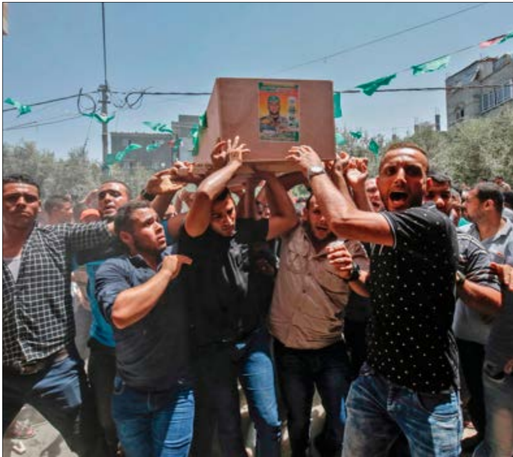
شباب فلسطينيون من 3 مقاومين استشهدوا بقصف إسرائيلي

إسرائيليين في الصباح، ثم غادر القطاع متجهاً إلى تل أبيب، فيما يعود مساءً للقاء قيادة الحركة مرة أخرى، أي في اليوم نفسه. وفق مصادر مطلعة، نقل ملادينوف إلى «حماس» تهديداً إسرائيلياً بقضي مطلب العودة إلى حالة الهدوء، وإلا فإن «إسرائيل ستقدم على حرب طاحنة على غزة»، وأردفت الرسالة بتعهدات من وزير الأمن أفغدور ليريمان، فجواها أن «تكرار عمليات القنص على الحدود أو اقتحام السياج، وكذلك إطلاق