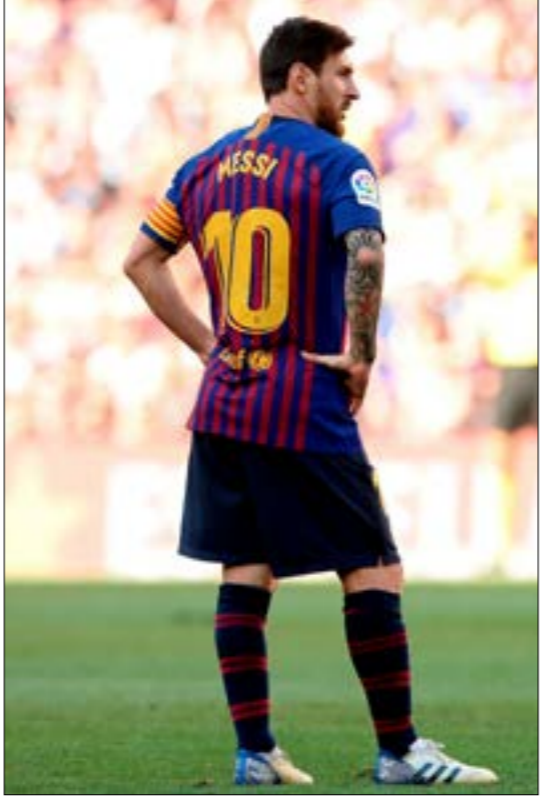
موجد اسم كيميسو بدر امول طالبة على رابطة الليغا

ويقتطع حوالي 7% من المبلغ الذي يجنيه كل فريق من حقوق النقل التلفزيوني كمتعويض لدعم الدرجة الأخرى والرابعة والحكام والمحاربين وغيرهم من الفئات المذكورة في المرسوم.