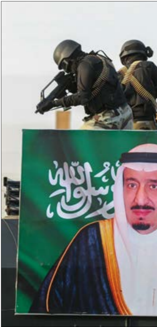
التغييرات التي أحدثها سلمان منذ توليه العرش حتى الآن. منة يوم الإمارات الوجودية

في رهان ممانل، يُعدّ فشل خطة «التحول الوطني» أكبر خطر على المملكة السعودية، رؤيته السعودية 2030، كما اسلفنا، هي من نوع الرهانات الوجودية التي تؤول بالبلاد إلى إحدى خاتمتين: المعجزة أو الكارثة، اشتملت تجارة التجزئة، والطاقة المتجددة، والقطاع الخاص، وأنشئ صندوق الثروة السيادية لدعم الاستثمارات الوطنية. منشوب التفاؤل في خطة «التحول الوطني» كان مرتفعا للغاية، إلى حدّ أنه وعد بخلق ستة ملايين وظيفة جديدة بحلول عام 2030، وهو رقم يتجاوز بكثير أي شيء أنجز في السابق، ولا يأخذ بالأعتبار النساء المحتمل دخولهن سوق العمل. في هذا السياق، تزايد الرهان على دور القطاع الخاص في امتصاص العدد الأكبر من المواطنين بدلاً من الأجانب، فيما كان على الأمر السعودية التكثف مع فقدان الإعانات السخية، وتقلص الاستثمارات القادمة لموظفي الحكومة، الذين ينشكون نفثي إجمالي قوّة العمل. وعلى طريقة جون حنّا، نتّبه «مركز العمل الوقائي» هو الآخر، إلى احتمالية التقلّب البطالة إلى كارثة، وفي أي حال التجمّع يحتاج إلى معجزة لا يفي بتحقيقها ما يتم إعلانه من فرص وظيفية لا تتجاوز العشرات والمئات في كثير من الدوائر والمؤسسات...» تجدر الإشارة إلى أن العنترات من الشركات المتوسطة الحجم قد توقّفت عن العمل منذ