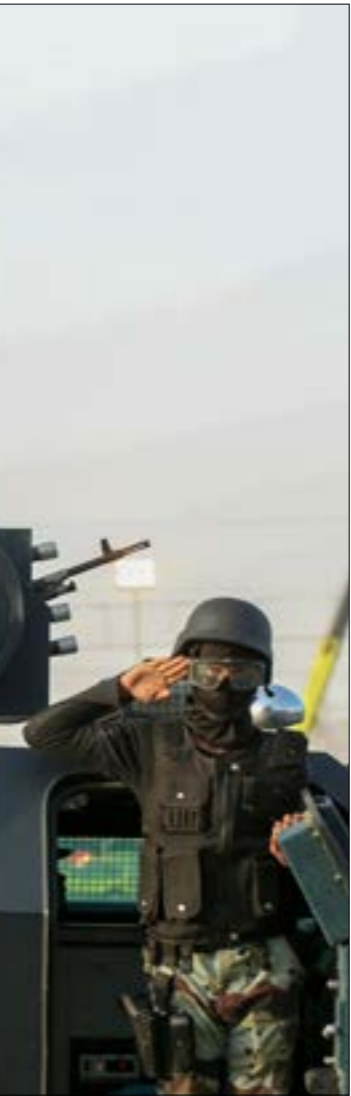
التغييرات التي أحدثها سلمان منذ توليه العرش حتى الآن. منة يوم الإمارات الوجودية

قد لا تتدلّع ثورة شعبية في المملكة السعودية القرن الثامن عشر، وهو يُعَدّ أحد منجزات علاقات الهيمنة وفق التفسير «الفوكوي»، إذ، على الرغم من أختلال موازين القوى، ولا سيما بعد إعلان المملكة السعودية عام 1932، فإن الحاجة المتبادلة بين الشيخ والأمير أمّلت نعطاً في العلاقة التبادعية المتبادلة، ولحسب ماريه، في حقيقة الأمر، حتى ذلك الوقت، لم تتزلق الأخطاء نحو الهاوية والتهديد الكيانى، حينذاك أيضاً، لم يكن يوجد خطر من نقاد الأصول في المملكة في أي وقت قريب، ولكن كلما ساعر العجز في الجزائيه، وانخفضت أسعار النفط، وتراجعت احتياطات النقد الأجنبي، أصبحت الأسواق الدولية أكثر توتراً، فيما لم تغف الدولة عن عادة «التقديمات الاجتماعية» لإيقاع «السطط الشعبي» تحت السيطرة وفي أدنى درجاته. التقط جون حنّا إحصاءات عن الواقع العيشي في مملكة النفط، من بينها معدل البطالة المرتفع الذي تصل نسبته إلى 30 في المئة، ومعدل الفقر الذي يشمل ربع السكان، ومساة مئة والموت الجماعي بفعل التدافع (769 حاجاً)، وسلطت الدولة عن عادة «الإنشارة إلى أن توحيد مركز القيادة للأذرع العسكرية، بقدر ما يخفّف من احتمالات النزاع المسلح على السلطة بين الأمراء، فإن السطط المتعاظم في أوساط عناصر الدفاع والحرس الوطني والداخلية، بفعل التوتّر المتزايد، يقدر ما يخفّف من احتمالات النزاع المسلح على السلطة بين الأمراء، فإن السطط المتعاظم في أوساط عناصر الدفاع والحرس الوطني والداخلية، بفعل التوتّر المتزايد، يقدر ما يخفّذ فرص التمرد والانشقاق المدوم من أمراء فقدوا مناصبهم ونفوذهم، وهذا في حدّ ذاته أحد مغذيات