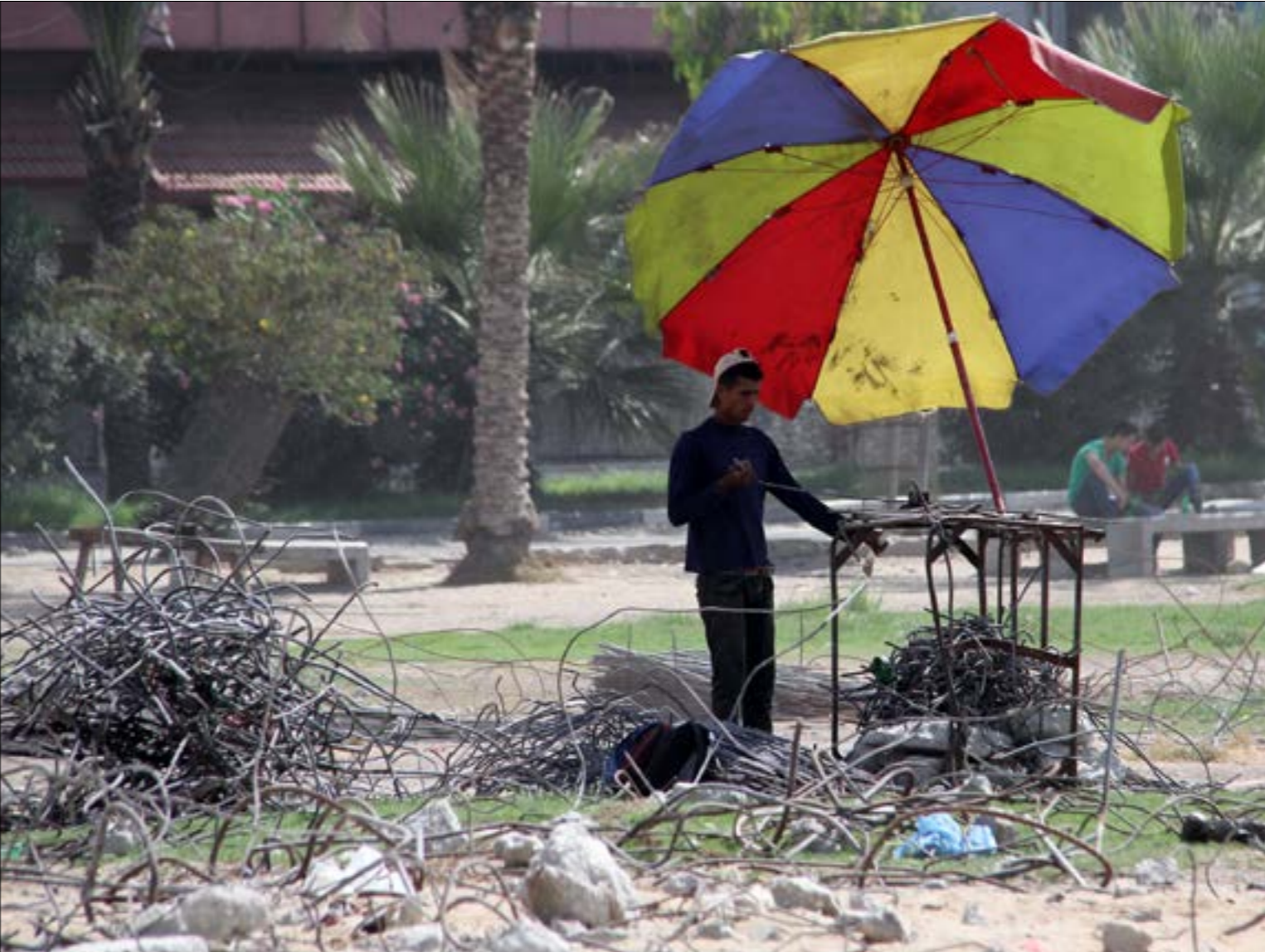
بدأ «البنك الدولي»، طرح مشاريع لتشغيل موقّت في غزة (أيه بيه)

كشفت وزير الأمن الإسرائيلي، أفيغدور ليبرمان، أن تل أبيب تعمل على الوقيعة بين سكان قطاع غزة وحركة «حماس»، وهي استراتيجية جديدة تمثل دليلاً إضافياً على ضيق خيارات إسرائيل وإمكاناتها الفعلية في مواجهة «حماس» والخيار المقاوم الذي يثبت جدواه، في مقابل الفشل الذريع لخيار التفاوض المبني على تنازلات دائمة. أن تعتمد إسرائيل على محاولة الوقيعة كما تقول، ثم أن تكشف عن ذلك وتقرّ به علناً، يكشف بدوره تجاذبات وتردد موقف تل أبيب، الذي يعاند في رفض التسليم بفشل الخيار العسكري الأصلي، واللجوء إلى الخيارات البديلة. مع ذلك، محاولة التسبب في الوقيعة، بمعنى التسبب في الفتنة الأهلية الفلسطينية، تزيد على الانقسام الحاصل أولاً بتطبيق مبدأ «الهدوء مقابل الهدوء»، وثانياً بقرار الإحتلال فتح معابر غزة بعد إغلاقها لشهر، جدواه في هذه الأثناء، مع قرب تحقيق التهيدة البنئية على