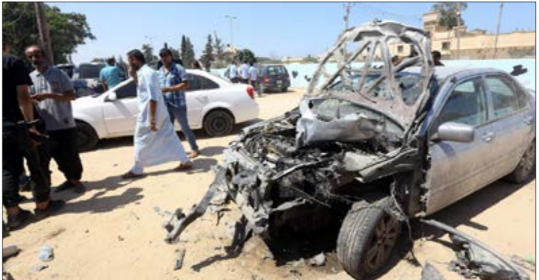
اعلنت حكومة «الوفاق الوطني» في طرابلس فتح تحقيق حول الهجوم (اف ب)

مدينة زليتن إلى عام 2016، حينما تسرّب انتحاري يقود سيارة إطفاء مفخّخة إلى معسكر تدريب تابع لخفر السواحل، وفجّر العربية بين نحو 500 مُتدرب، مخلفاً 70 قتيلًا و150 جريحاً. كما تحدر الإشارة إلى أنّ «الوفاق الوطني» اطلقت «مستمرة إلى حين الانتهاء من تنفيذ مهمتها»، لم ترشح أخبار إضافية