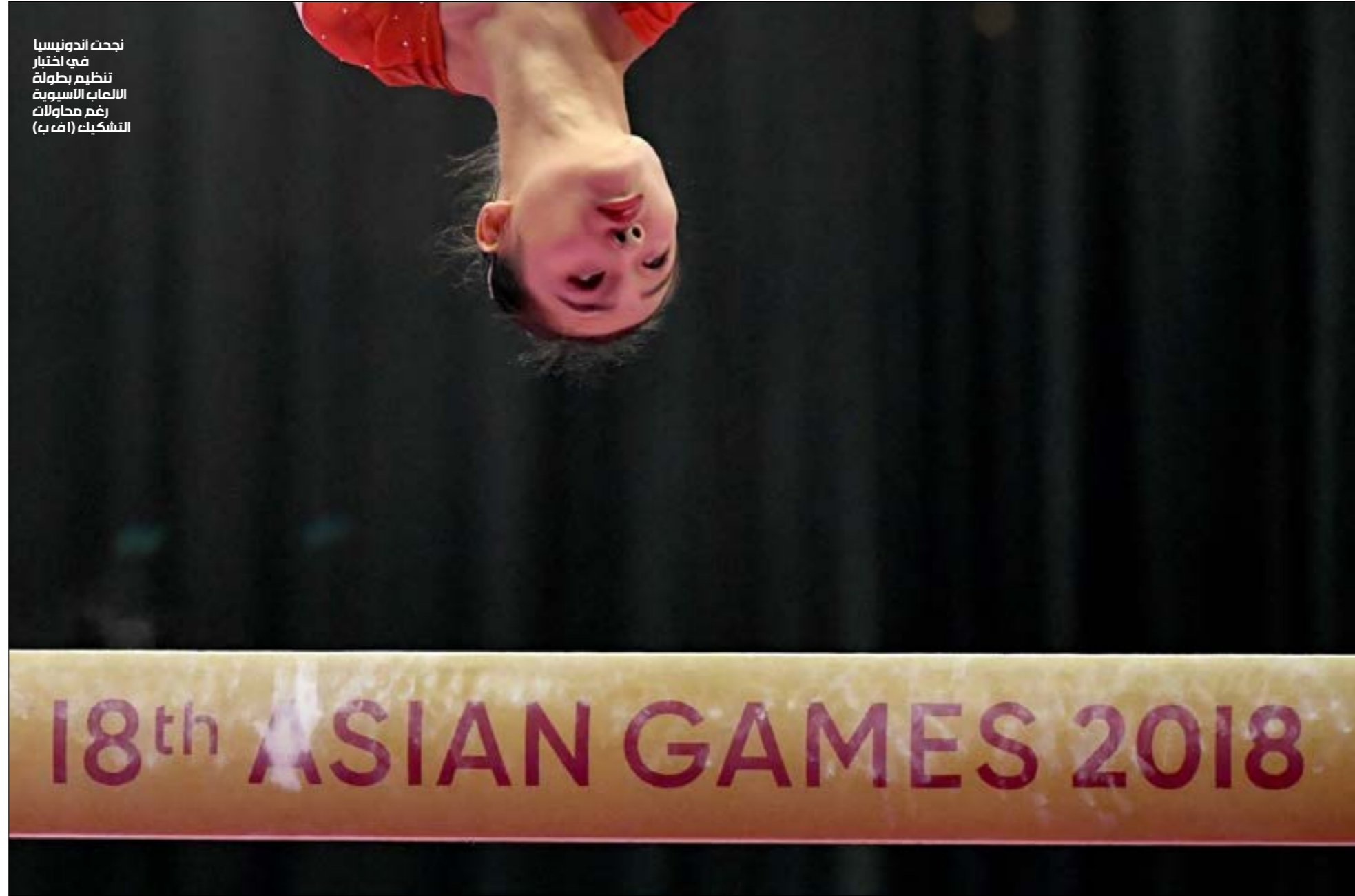
نجحت اندونيسيا في اختيار تنظيم بطولة الالعاب الآسيوية رغم محاولات الشكك