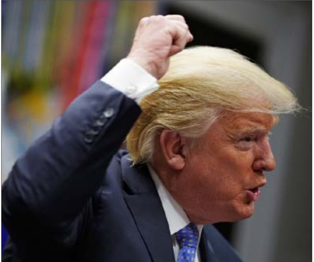
السيناريو الأقره وفق خبراء، هو تخوم الرئيس للساءة البرلمانية

الأميركية، التي اتهم وزيرها جيف سيشنز، بأنه «لا يُحك إدارة الوزارة». الأخير، وفي رد نادر له، علق على اتهامات ترامب بالقول: «قوليت زمام الأمر في وزارة العدل في اليوم الذي أديت فيه اليمين لتولي المنصب... خلال وجودي في منصب وزير العدل لن تتأثر أفعال الوزارة بالاعتبارات السياسية». وتعد الفوضى القضائية التي تحيط بالبيت الأبيض، الأسوأ من نوعها،