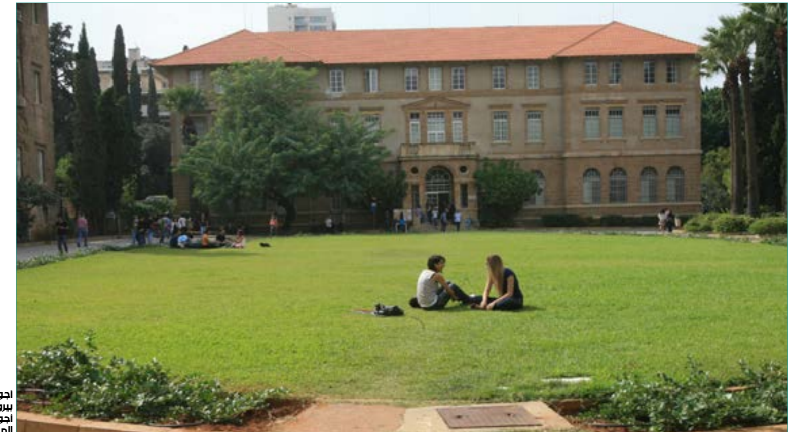
أجور الإداريين في الجامعة في بيروت، نقصاً بين 120 و170 أجور نظرائهم في الولايات المتحدة (مروان بوحد).

وتلحظ الجداول المسربة وجود رواتب مرتفعة «غير مفهومة» كان يتقاضى «موظف سابق» (كما ورد في الجدول) نحو 235 ألف دولار سنوياً، أي أكثر من الحد الأدنى للأجور بنحو 42 مرة (أكثر من 19 ألف دولار شهرياً)، فيما يتقاضى سكرتيرة مساعداً 197 ألف دولار سنوياً. وراتب رئيس الجامعة إلى نحو 869 ألفاً. وتظهر تسريبات لجداول رواتب «كبار» الموظفين والمديرين العاملين في الجامعة لعام 2016 أن رواتب غالبية هؤلاء تتجاوز نصف مليون دولار سنوياً، وهي تتخطى بذلك بنحو 92 مرة قيمة الحد الأدنى السنوي للأجور في لبنان.