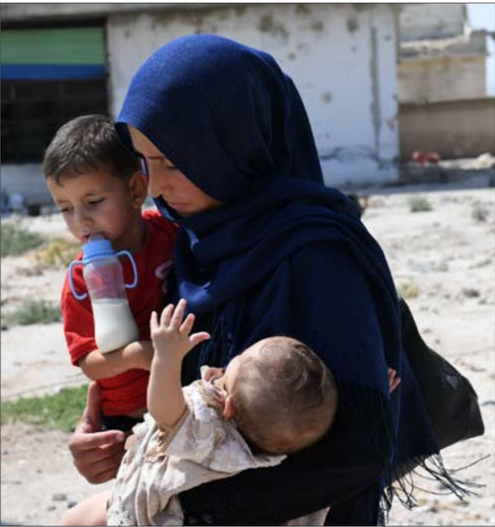
لاحصائيات دقيقة لامداد المدنيين في محافظة إدلب