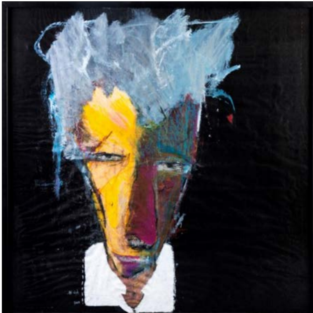
«مى دوت عنوات (اركيليك على ورق - 100 x 100 سنتم - 2018)