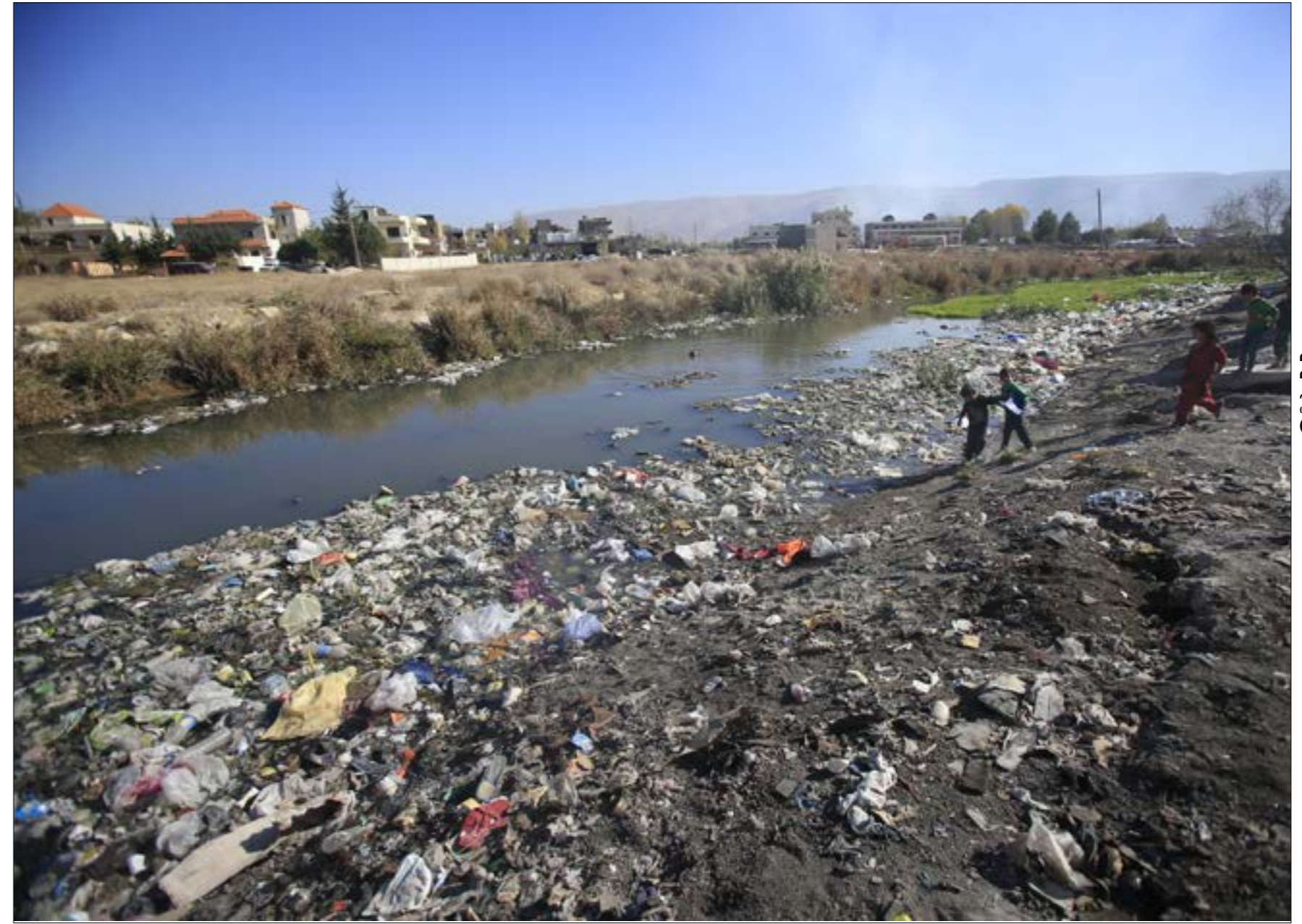
ستعاود مصلحة الليطاني الكشف على المصانع «المكتشفة» (على حشيشو)

النائب العام المالي استدعى الوزير السابق، دوفريج للاستجواب عن تلوين مصنعه للنهر