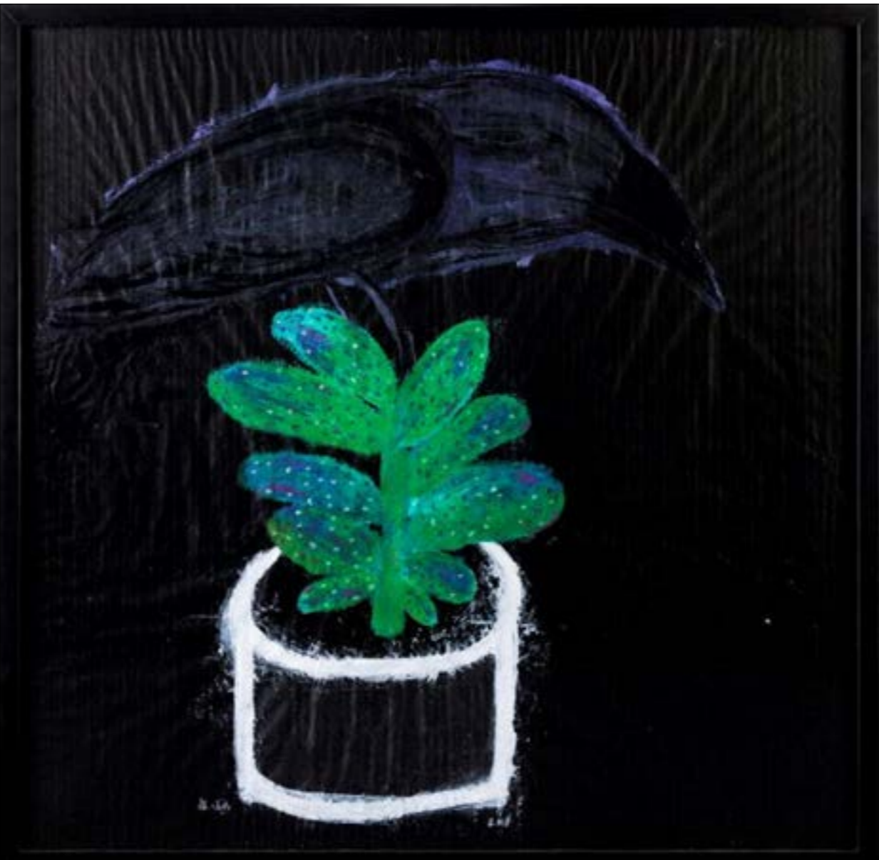
«غراب على صتار في علية قصدير، (اركيليك على ورق - 100 x 100 سنتم - 2018)