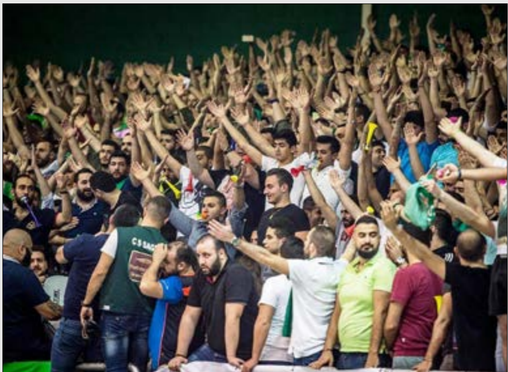
يملك نادي الحكمة أكبر قاعدة جماهيرية في لبنان