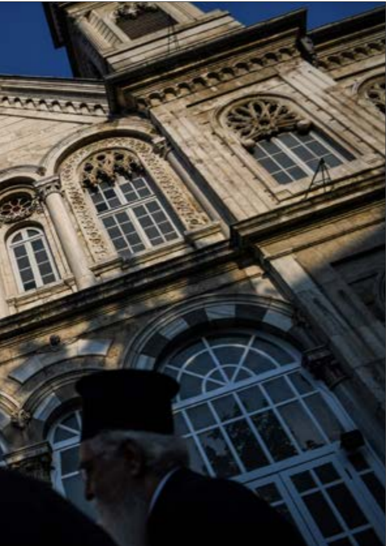
التصيد الكنسي ضد موسكو، يترافق مع مناورات عسكرية في أوكرانيا بمشاركة القوات الأميركية

يُقدّمها الإعلام الأميركي السائد، وهي الدولة التي أعادت الولايات المتحدة الأميركية التعامل معها بوصفها عامل قلق، ورفعها مجدداً إلى مصاف التهديد العسكري. ببساطة، لا تريد واشنطن لموسكو أن تستعيد عافيتها، ولا أن تجد حصاراً على موسكو، في المجالات كافة. فروسيا هي الـ«فراعة»، كما