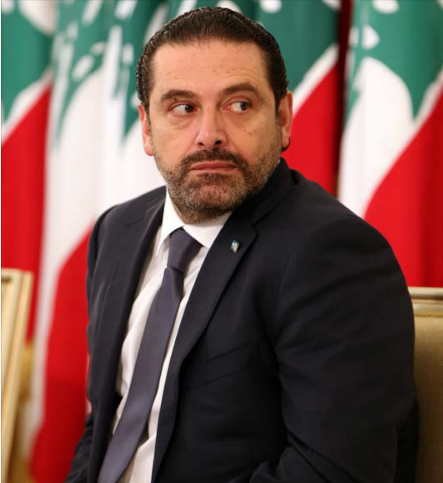
يعتبر الحريري نفسه خارج دائرة التنازل، وكان يتوقع ان تحل المشكلة بين شريكي تفاهم مار مخايل (هيلم الموسوي)

مخايل. رئيس الجمهورية تحدث في مقابلته أول من أمس عن خطأ في التكتيك (لم يسمّ حزب الله، لكن السياق يوحي بأنه كان يقصده) فعن أي تكتيك يتحدث؟ هل في ذلك إشارة إلى استغلال حزب الله لأزمة التمثيل السنّي لتعطيل تشكيل الحكومة؟ وإن كان صحيحاً، فلماذا لا يريد حزب الله حكومة لبنان؟ فريق الهجوم على المقاومة في لبنان سارع إلى ربط القضية، كما دأبه في كل أمر مهما صغر أو كبر، بالمفاوضات الجارية إقليمياً، وبخاصة بشأن العدوان على اليمن. يعتقد هؤلاء أن حزب الله يرى السعودية في موقف حرج، فلماذا سيعطي حليفها في لبنان ما يجعلها أكثر اطمئناناً، على قاعدة رمي الكرة في ملعب الآخرين. حزب الله يرى حل العقد التنازلات؟