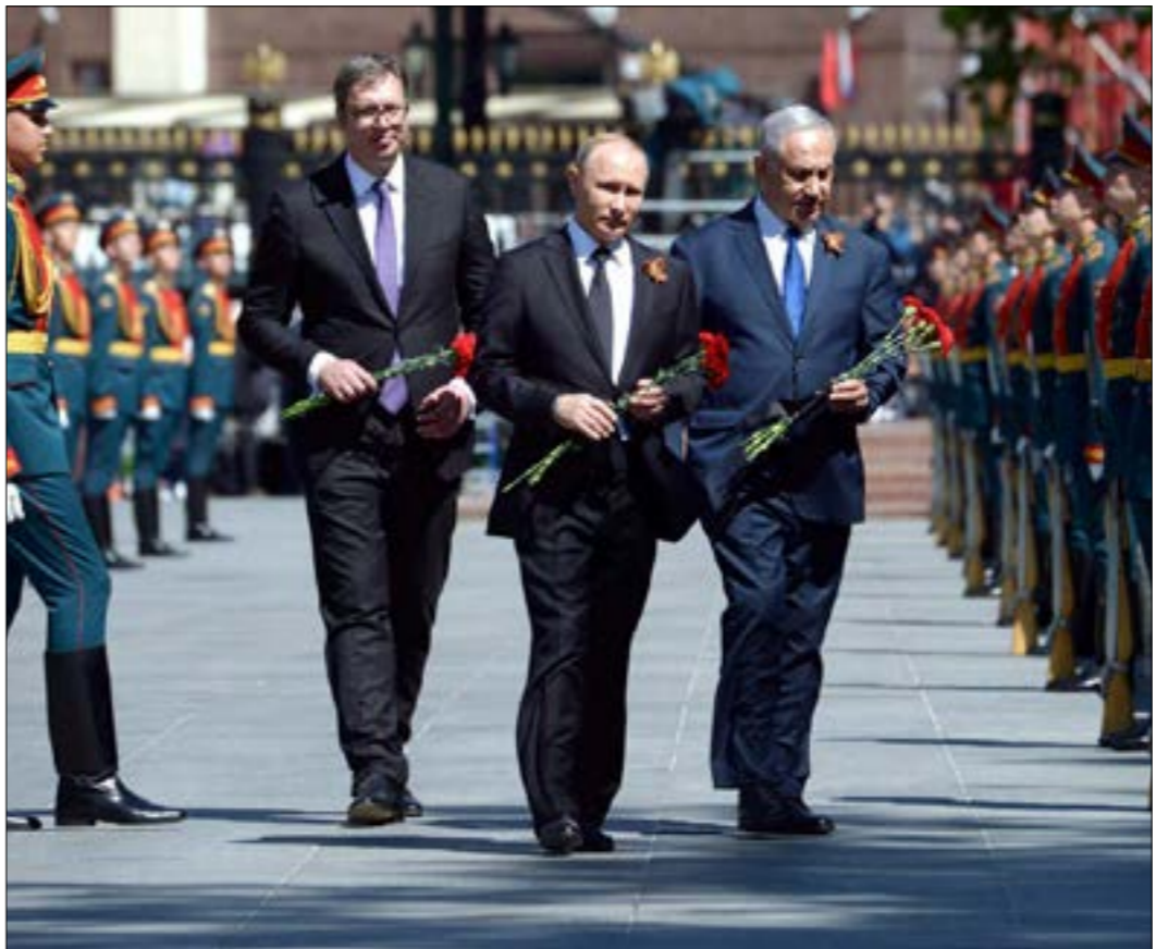
أوضحت موسكو أنه يمكن أن يتبادل بوتين بضع كلمات مع زعماء بمن فيهم نتياهو

أحرونوت»، أن الأزمة مع روسيا مستمرة، لأن الروس يحاولون فرض قواعد جديدة على إسرائيل، من شأنها أن تحد بشكل كبير جداً من فعالية الهجمات الإسرائيلية في سوريا. وأوضح المصادر في الجنوب السوري، وهو الموضوع الذي يقفّ إسرائيل ومؤسستها الأمنية. تشير الصحيفة إلى أن «القطيعة بين المؤسسة السياسية الإسرائيلية ونظيرتها الروسية، تلقي بظلال سميحة على مجمل التفاهات المعقودة مع الجانب الروسي، مع صعوبة بارزة في دفع الروس إلى الإيفاء بالتزاماتهم، خاصة ما يتعلق بالوجود الإيراني، قبل إسقاط الطائرة الروسية. يتضح من التقرير العبري صعوبة توقع جدوى لأي اتصال بين الجيش الإسرائيلي والقيادة العسكرية الروسية في سوريا، وتحديداً ما يتعلق بالوجود العسكري الإيراني في الجنوب السوري، وهو الموضوع الذي يقفّ إسرائيل ومؤسستها الأمنية. تشير الصحيفة إلى أن «القطيعة بين المؤسسة السياسية الإسرائيلية ونظيرتها الروسية، تلقي بظلال سميحة على مجمل التفاهات المعقودة مع الجانب الروسي، مع صعوبة بارزة في دفع الروس إلى الإيفاء بالتزاماتهم، خاصة ما يتعلق بالوجود الإيراني،