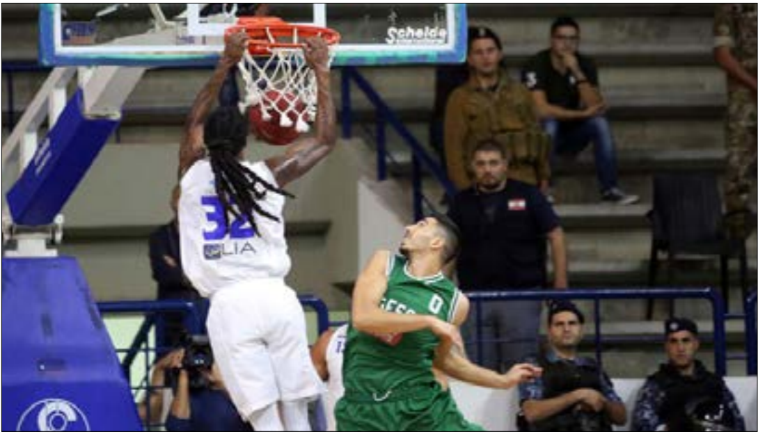
من المتوقع ان تكون الجولة الثمونه هي مرحلة الذهاب