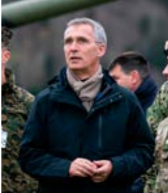
اكد ستولتنبرغ استعداد الحلف لمواصلة الحوار مع روسيا حول المعاهدة

تعود إلى حقبة الحرب الباردة، وكانت الولايات المتحدة قد تعهدت بالانسحاب منها بسبب اتهامات بعدم التزام روسيا بها. وأفاد بيان صدر أمس عن «التلّو» بأن الجانبين «تبادلا وجهات النظر بشكل منفتح بشأن أوكرانيا وتدريب روسيا العسكرية في فوستوك وتدريبات (تريادنت جنكشنز) التي يجريها الحلف، بالإضافة إلى الوضع في أفغانستان والمخاطر الأمنية». ويجري «الأطلسي» أكبر تدريبات