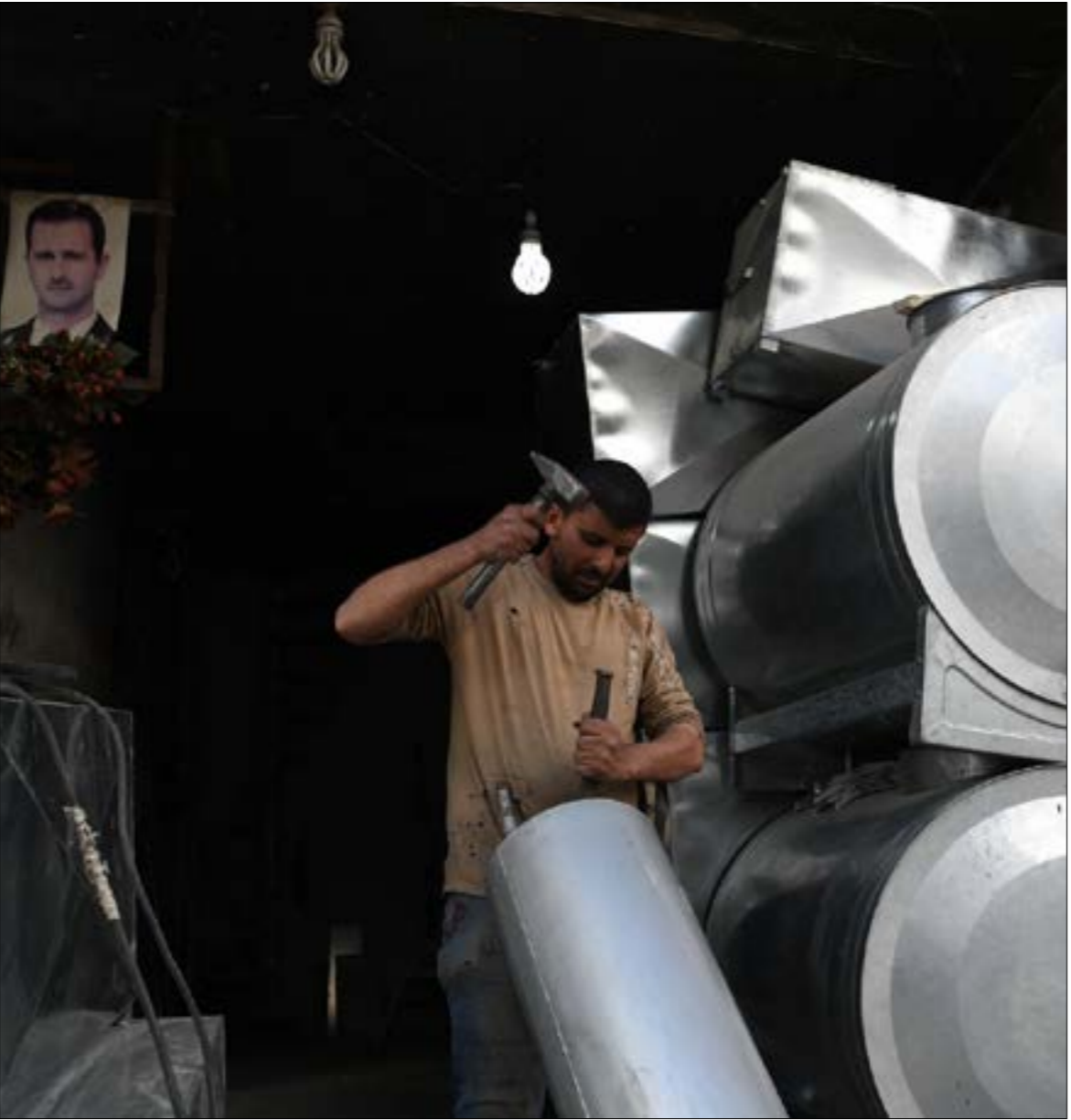
«الحليبي ما يعرف بعيش بلا شغل.. حلب فادرة إذا اشتغلت نعيش كل سوريا

صهيب عنجربني تتجاوز سيطرة الأجرة ساحة العاصي في مدينة حماة قبل أن يطرح السائق سؤاله على المسافرين: «بتحبو نروح من طريق خناصر أم من طريق أبو الصهور؟». قبل فترة، لم يكن امام قاصدي حلب خيارات أخرى سوى طريق «السلمية، أثريا، خناصر» الذي حظي بلقب «شربان حلب» لسنوات طويلة. لكن على امتداد تلك السنوات، سبّب الشريان المذكور وقوع عشرات الضحايا من جراء اوضاعه الفئنة السيئة، لتغدو انشاء حوادث السير فيه امراً روتينياً. ورغم أن الطريق البديل «حماة، أبو الصهور، حلب» لم يحظ بالجاهزية المطلوبة بعد، فإن الرغبة بـ«عبور آمن»، والفضول لاستكشاف تفاصيل جديدة من جغرافيا المناطق المتكوبة يبدوان سببين فخلين بتفضيل المسافرين له. أما السائق، فلا يُخفي سعاته عندما يقرر لإسباب «اقتصاديّة»، خلاصتها أنّ الطريق البديل «أقصر بشي 100 كيلو على الأقل»، لم يستشعر الحواجز العسكريّة على امتداد الطريق بين قرية «كوكب» إلى محطات الطريق البديل بعد. تنتشر الحواجز العسكريّة على امتداد الطريق بين قرية «كوكب» إلى مدينة الأسد إلى دمشق، صادى عالم الآثار البولندي بارتوس ماريكوفسكي لحاوله ترميمه في عام 2016، ونجح مع علماء آثار آخرين، في إعادة البسمة إلى «أسد اللات» في باحة متحف دمشق الوطني، في انتظار أن يعود إلى مسقط رأسه في تدمر!