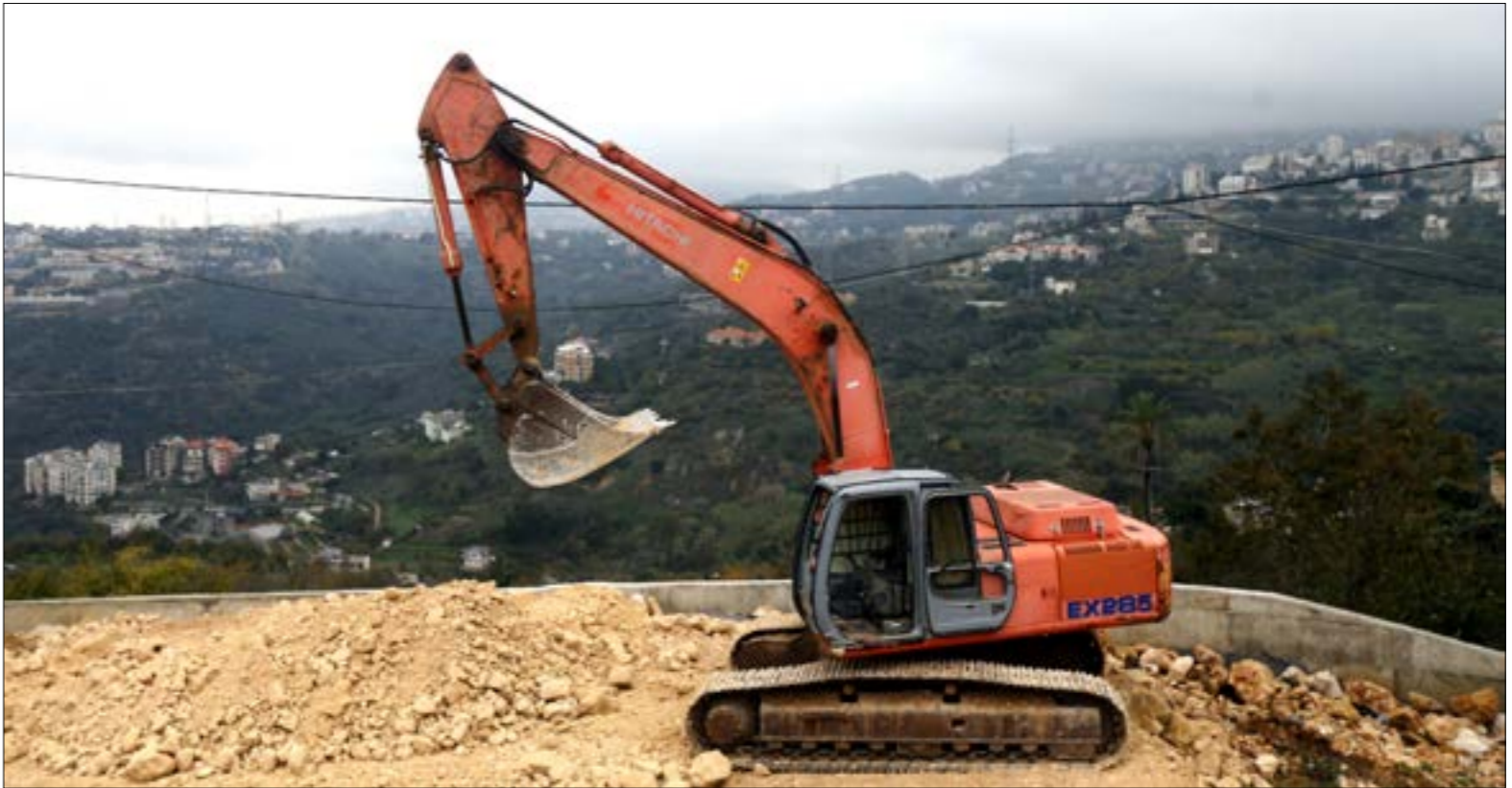
اعمال الحفر جرت سابقا