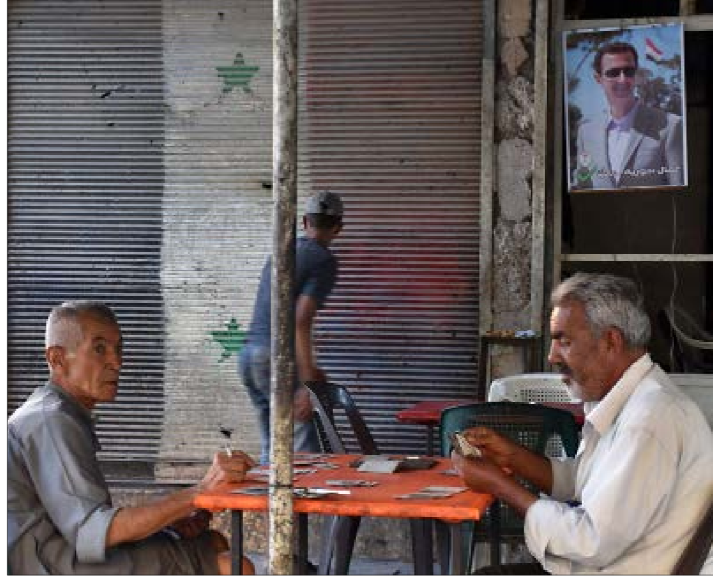
استقر بعض المأهولين في أحياء الجبلية والمرضى والجوية رغم سوء الخدمات فيها

ميزانية عام 2018 لصالح تأهيل المحافظة)، إلا أن المشاريع المنفذة ركزت ضمن الأحياء المأهولة التي لم تخرج عن سيطرة الدولة، فيما بدأ تنفيذ الخطط الخاصة بالأحياء المحررة في عام 2017، في مرحلة متأخرة. ضمن هذا الواقع، ما زال عدد من طلاب الأحياء المحررة يقطع كل يوم مسافة طويلة للوصول إلى المدارس، في ظل قلة المدارس المؤهلة في أحيائهم. وهذا ينسحب على كثير من الخدمات الغائبة رغم عودة بعض السكان. ورغم أن مساحة تلك الأحياء تزيد على 60 في المئة من مساحة المدينة، إلا أن عمليات إعادة التأهيل فيها اقتصر على فتح الشوارع الرئيسية، ورفع الأنقاض لبعض الأبنية. وتعيد الجهات الحكومية تأخر العمل إلى الدمار شبه الكامل للبنية التحتية في كامل المدينة، نتيجة الحصار الذي فرضه «داعش» لثلاث سنوات؛ وهو ما جعل تفعيل الخدمات في الأحياء المكتظة بالسكان أولوية، بما يساعد بناء المدينة من مسؤولية جميع الأهالي وأنا منهم.