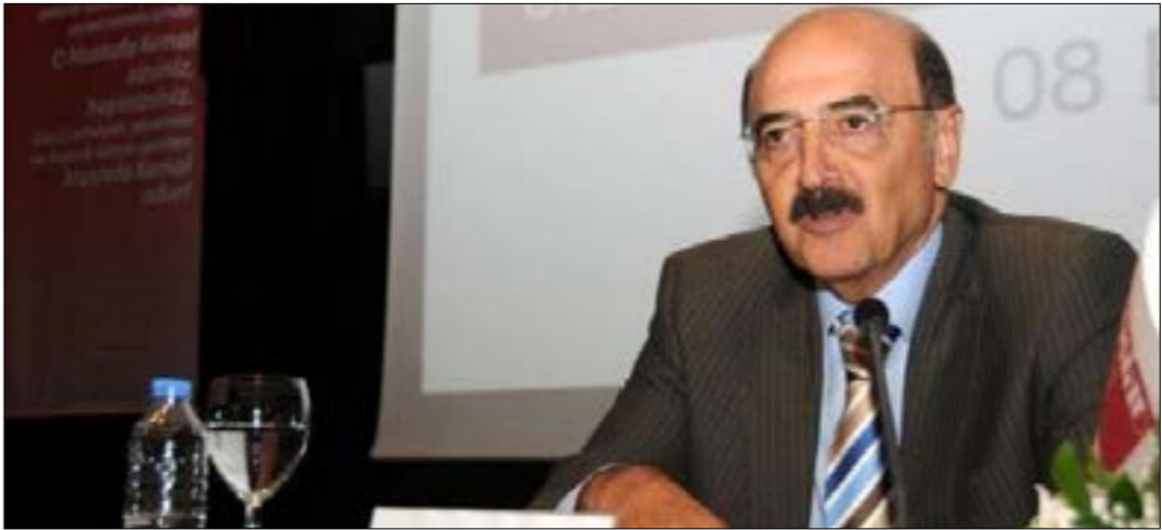
أهم محلي بـالإساءة للدولة والحكومة، ولوزير اردوغان وإهانتها

وخمسة أشهر وخمسة أيام بتهمة الإساءة للرئيس رجب طيب أردوغان، وإهانتته، من خلال وصف الأخير بأنه «ديكتاتوري ويدعم الجماعات المسلحة في سوريا». وربّ محلي على هذه الاتهامات بالقول: «جميع الزعماء السياسيين والوزراء السابقين والجنرالات والدبلوماسيين السابقين، بل وحتى نائب الرئيس الأميركي السابق (جو بايدن) والمستشارة الألمانية (أنجيلا) ميركل والرئيس الروسي فلاديمير بوتين، قد اتهموا تركيا بهذا الموضوع»، مضيفاً: «أنا كصحافي أعتمد على تصريحات هؤلاء المسؤولين، يضاف إلى ذلك ان تركيا لم تعد تدعم الجماعات الإرهابية كالجيش الحر والفضائل الخليفة، بما فيها النصرة في إدلب، بل هي تتعاون معها في جرابلس والباب وعفرين والشمال السوري عموماً، وتوقع مرتبات عناصر هذه المجموعات وتقوم بتدريبهم وتغطي كل حاجاتهم اليومية بالمئات من الشاحنات التي تعبر الحدود». وتابع: «كما ان مسؤولي وعناصر هذه الجماعات يعترفون بالعلاقة مع تركيا عبر تصريحاتهم الصحافية، وفي شبكات التواصل الاجتماعي، وتركيا التي كانت عدواً لروسيا بعد إسقاط طائرتها في تشرين الثاني 2015 هي الآن تتعاون معها بعد اعتذار الرئيس اردوغان من الرئيس بوتين في حزيران 2016، كما تتعاون مع إيران أيضاً لحل المشكلة السورية في إطار اتفاق استانا وسوتشي