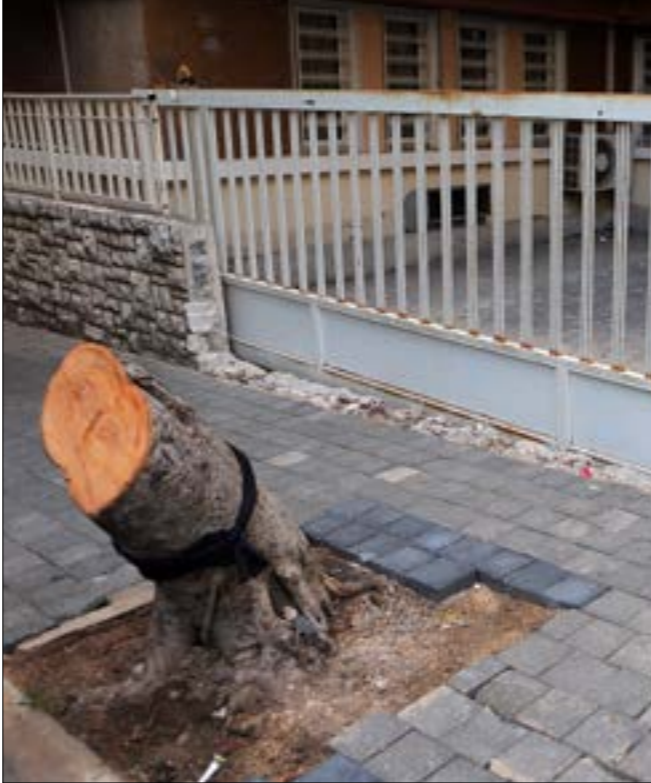
أحد البلدية السكان انهارم نط رخصة لأحد قطع الشجرة (هيلم الموسوي)

برايك؟ أنا أرى هذه الآثار في كل بلد نشط فيه الفلسطينيون. عملاً هنا، في لبنان، مع حركة فتح سابقاً، تلك مرحلة ليس باليسير أن ينقض أثرها الاجتماعي. هذا أحد العوامل». يواكب صاحب الدكان الصغير، الرجل السنيني، موجة التطبيع التي تضرب المنطقة العربية. يعي تماماً لعبة «تلبيع إسرائيل». جرت العادة أن يتبادر إلى ذهن أحدنا، في بلدنا، أنّ أصحاب الدكاكين لا يُجيدون التعبير السياسي بمصطلحات «ثقلية». أو ربّما يعوزهم «العمق». كامل «حالة» تكسر تلك الصورة النمطية. هو من صنف تكرهه إسرائيل جداً. لسان حالها: ما الذي يُمكننا أن