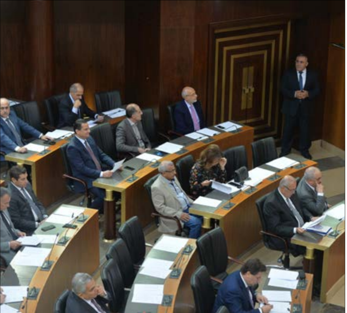
اقتراح قانون بصر الكتله النيابية، هم الفساد او ضده (على فوار)

للتنقيعات والهدر من دون المربود المنتظر». وهذا يقود إلى أن «تراكم العجز في المائتة العائة، وعدم مقدرة الاقتصاد على تحمّل فرض ضرائب جديدة، يفرضان ترشيد الإنفاق، وهو ما لا يمكن أن يحصل من دون إجراءات موحّدة للصفقات والية رقابية رادة، وتأمين الجهة الأكثر اختصاصاً في تولّي تلك المهام بالتعاون مع الجهات