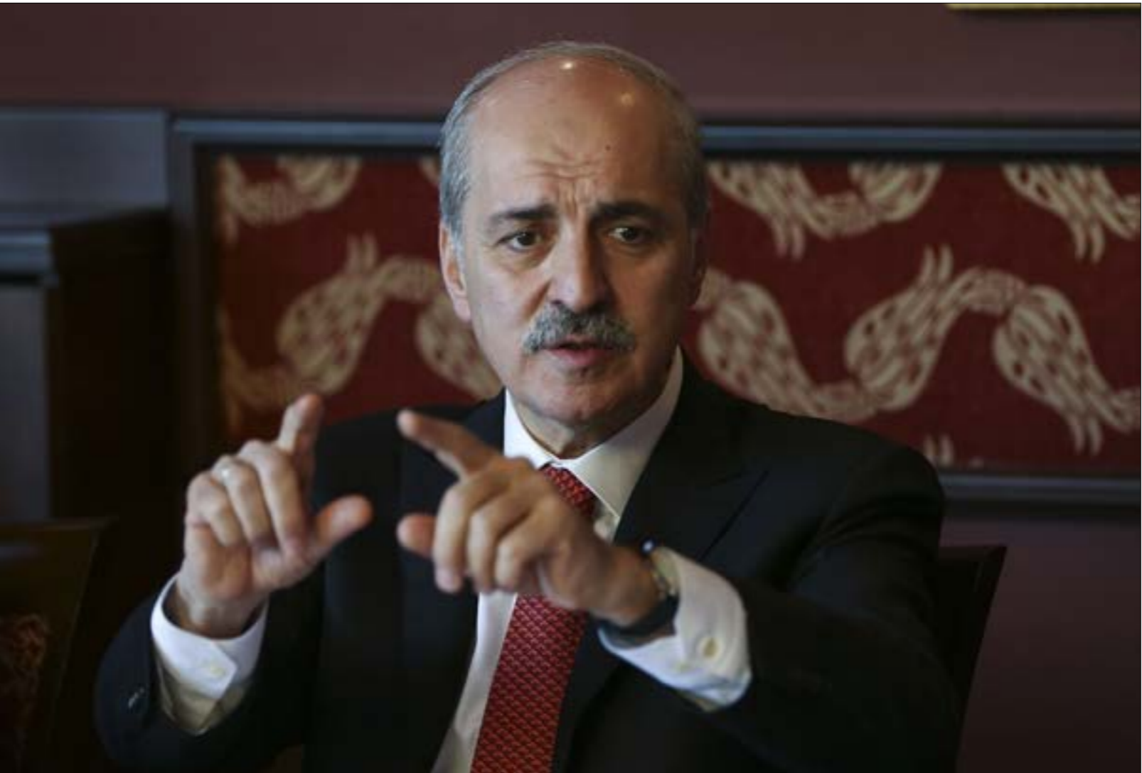
فورتولمون، لا يمكن أن تحدث جريمة من هذا النوع من جهة علم الجهات العليا (الناضول)

سلوكه، خصوصا على المستوى الخارجي. وما يعزّز الحديث عن ذلك التوجّه هو اندفاع الملك نحو حشد التأييد الداخلي لولي العهد، في مؤشر إلى أنه «واقف من أن