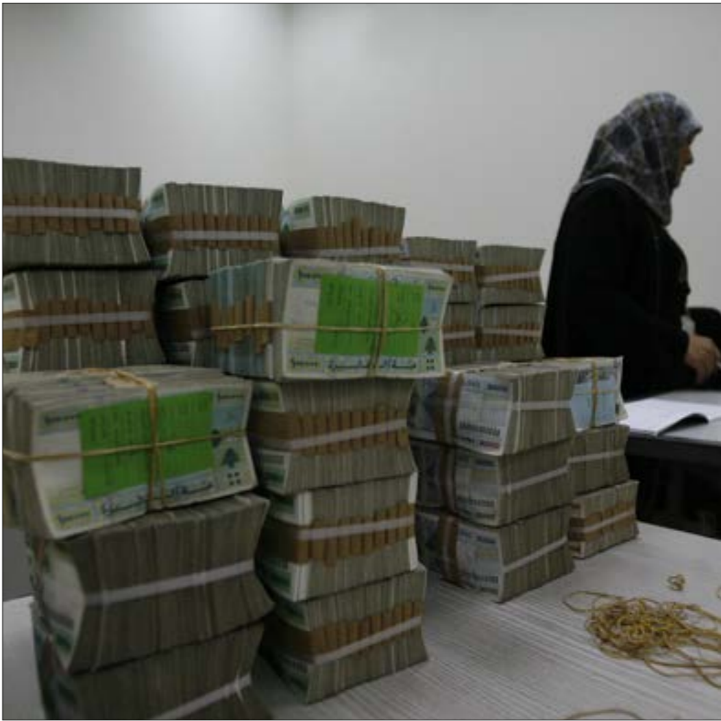
عجز ميزان المدفوعات ارتفع إلى 1,3 مليار دولار والحاجة إلى التدفقات الرسالية تزيد مما يمكن الفائدة

أبواب النفقات الإضافية واضحة المعالم وهي تتراوح بين التحويلات التي انطوت على أهداف انتخابية، وبين انعكاسات دعم الكهبةاء وارتفاع سعر برميل النفط، وتسييد فوائد الدين العام وكلفة سلسلة الرتب والرواتب. ففي هذه الفترة أجريت الانتخابات النيابية وسط