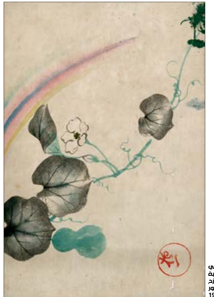
رسم ياباني باللوان العانية لقوس قزح وتمتد رهو 1907