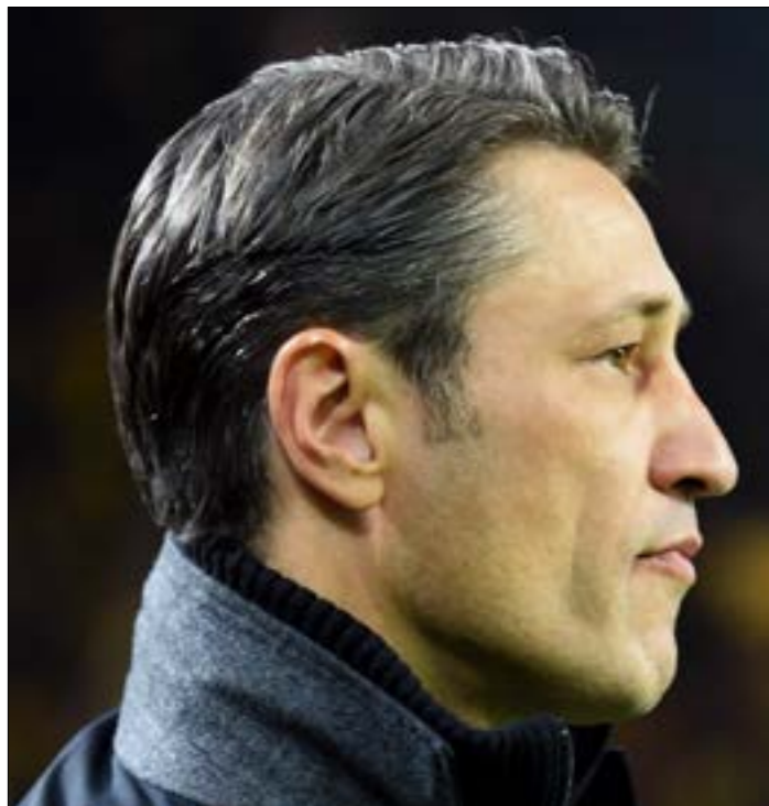
جايمس رودريغز ناقم على المدرب

اسلوب خدم الفريق في العقد الأخير، نظراً لضعف المنافسين والاستقرار الفني، فسيطر البايرن على الدوري المحلي وقدم نسخة طيبة في دوري