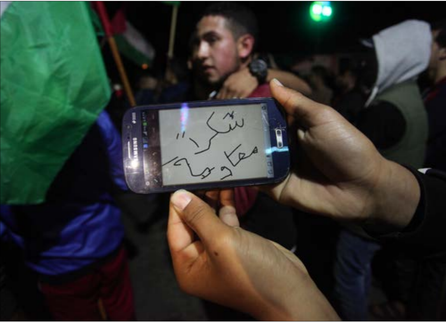
جذبت الحادثة الشهيرة للمقاومة لفتها بها وانطلقت في مسيرات عفوية بعد إعلان التهدئة

الجولة الكبرى منذ الحرب الأخيرة انتهت لمصلحة المقاومة، في مرة ثالثة هذه السنة، بعدما وجهت فصائل كافة ثلاث ضربات نوعية إلى العدو الإسرائيلي، مخرجة له من «أرشيف الإعلام الحربي»، ما زاد من صعوبة الموقف عليه، وأكثر ما كانت الصورة جلية، خرج مستوطنو «غلاف غزة» في مشهد لافت لاستنكار ما حل بهم من جهة، ورضوخ جيشهم للهدوء... محسوب له