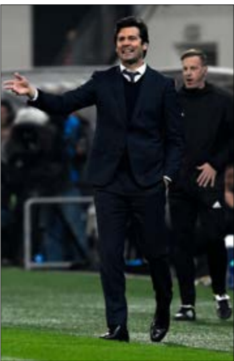
سولاري حرمه في رابعه

في مقالته أن ريال مدريد «حصد كل النقاط من أجل منح سولاري الرصيد الكافي للبقاء، إذ وصل إلى النادي بصفة مدرب مؤقت، لعدم وجود مناسف له، إلا أنه ومع نهاية فترة الاستعانة به بصفة مؤقتة، جاءت الانتصارات الأربعة التي حققها الفريق، لتعزز رصده بشكل مقنع. هناك أيضاً الأهداف الـ 15 التي سجلها اللاعبون مقابل اهتزاز الشباك مرتين فقط، فضلاً عن الانطباع عن إدارة جيدة للاмор». أما في برشلونة، توصلت الصحف الكاتالونية إلى اقتناع بان أزمة ريال مدريد التي بلغت ذروتها مع إقالة لوبيتيجي وتعيين سولاري خلفاً له انتهت. هكذا، كتبت صحيفة «سيورث» على صفحاتها الأولى (الاجبو ريال مدريد يعدون عقد سولاري). وللإنصاف، عرف سولاري في مستهل مشواره مع الفريق كيف يستغل من الخبرة التي كسبها من تدريب شباب النادي، وأدار الأمور بذكاء، على طريقة زيدان، لكن ينقل عنه أنه أكثر ميلاً إلى الدبلوماسية عوضاً عن التعامل مع الأمور بقبضة من حديد، على خلاف «المعلم» زيدان، صاحب الأصول الجزائرية. وكما كانت حال «يززو»، واستناداً إلى