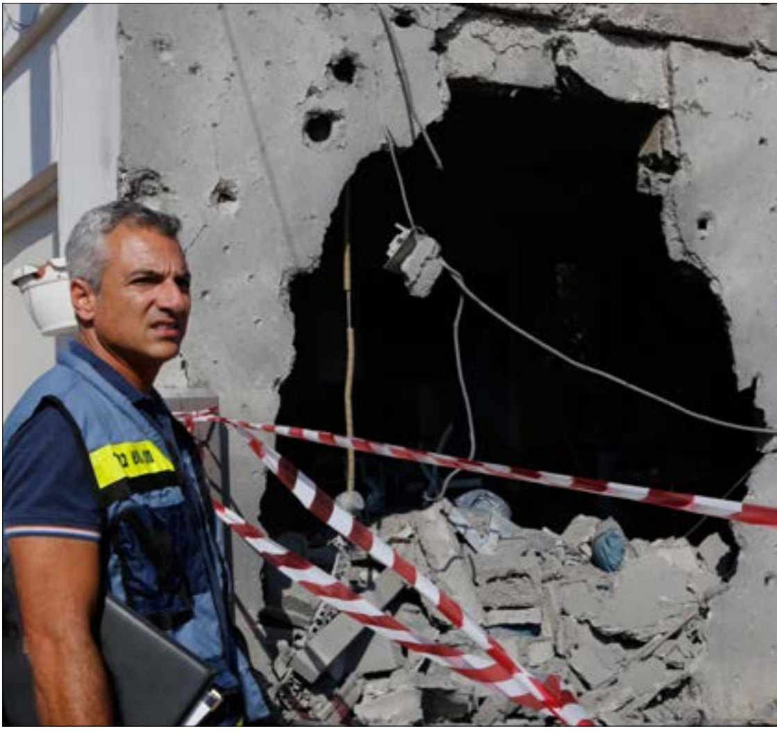
نتيجة للتصعيد: صورة انتصار فلسطينية بنسبة عالية جداً مقابل انكسار إسرائيلي واضح

في تأثير ساحات التهديد الأخرى على الموقف الإسرائيلي، قال عضو الوزاري الصغير، يوفال شتاينتس: «يبدو أن إطلاق النار تراجع، فنحن غير معنيين بالانجرار إلى حرب، وأناً لا أستطيع القول إن أحداً في إسرائيل لديه حل سحري لقطاع غزة». وأضاف: «المعركة التي نديرها مقابل تعاضل إيران وحزب الله في الشمال، أهم بأضعاف مما هو التهديد في قطاع غزة، ولدى الكابينت) رأي مشترك واحد، في منع الحرب والتدهور، سواء لدى المستوى السياسي أو المستوى العسكري». كلام الوزير صحيح، ولا يبعد أن يكون تهديد حزب الله في الشمال، في سوريا ولبنان، أحد أهم العوامل التي منعت حرب إسرائيلية شاملة ضد قطاع غزة، لكن في الوقت نفسه، لو لم تكن المواجهة مع غزة ذات غير محمول، مع غياب أيضاً للجدوى والقدرة على تحمل تبعاتها في مرحلة ما بعد الحرب، لكانت إسرائيل لجأت إلى العدوان الواسع بلا تردد، ليس فقط ضد الفلسطينيين وإنهاء تهديدهم، بل أيضاً في سياق التحضير والتأثير والردع على التهديد الشمالي، الهادف إلى تظهير القدرة والاقتدار، ومساعدة المساعي والجهود في مواجهة تهديد الساحتين، في سوريا ولبنان.