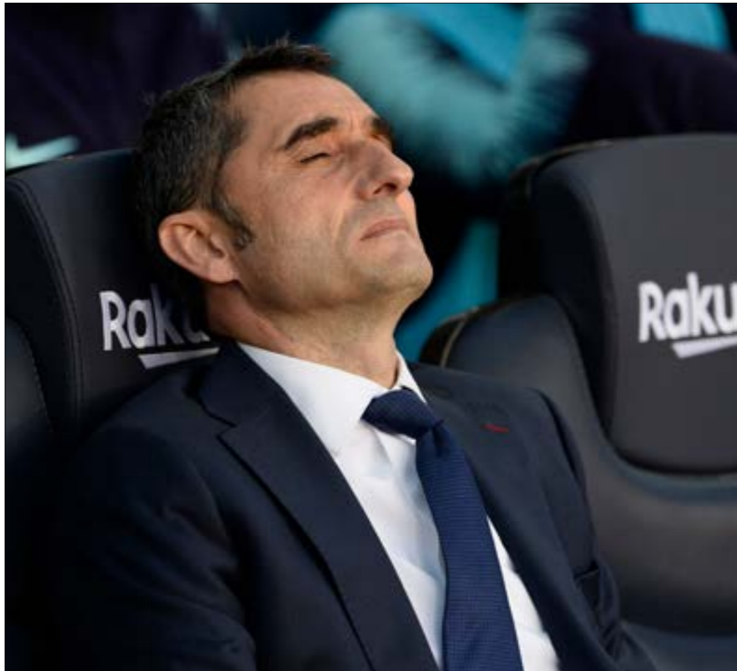
الصحف تتحدث عن إقالته

راكيتيتش، كان من بين نجوم بطولة كأس العالم الأخيرة في روسيا. إلا أن لكل سبب مسبق، وخط وسط المنتخب الكرواتي، إلى جانب راكيتيش، يضم أسماء مميزة تساعد لاعب برشلونة على أن يكون هو أيضاً نجماً في الفريق. أسماء كأفضل لاعب في العالم لوكا مودريتش، مارسيلو بروزوفيتش الالزامة في خط الوسط، يبقى الخيار الأول على حساب البرازيلي المتألق هذا الموسم ارثر ميلو. سيذهب الآن ماتيو كوفاسيتش، أسماء كبيرة في خط الوسط، لم يجدها الكرواتي في برشلونة؟