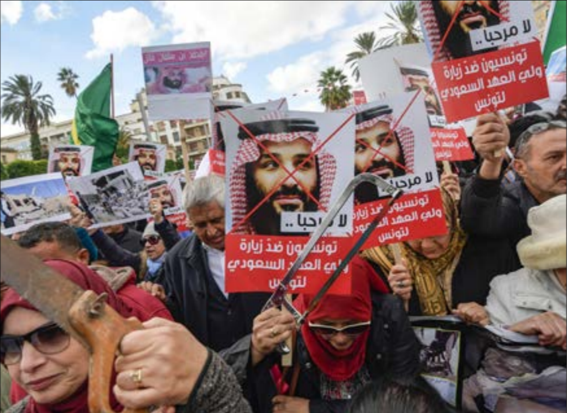
لم يجد السعوديون من سبيل للرد على المتجذبة إلا بإطلاق عنان «ذباب تويتر»، (اف ب)

إنجازات القنابل والأسلحة السعودية في اليمن، ودورها في مفاقمة الأزمة السورية، وتوقيع عريضة شعبية تخيدية، بالإضافة إلى مجموعة من «المهرجين الناشطين» ذكروا بالاغتال الوحشي لجمال خاشقجي، من خلال إعادة تمثيل الجريمة/المشهد، من أمام «المسرح البلدي»، وقد التقطت وسائل إعلام بولية صور العرض الفني/التشهيري، ما أسهم في تشديد زخم التنديد بالزيارة على الأرض، فيما لم يجد السعوديون من سبيل للرد، إلا بإطلاق عنان الذباب الإكثرتوني في محاولة لخلق زخم «افتراضي» مضاد تحت وسم «تونس تحرحب بـمحمد بن سلمان»، الذي