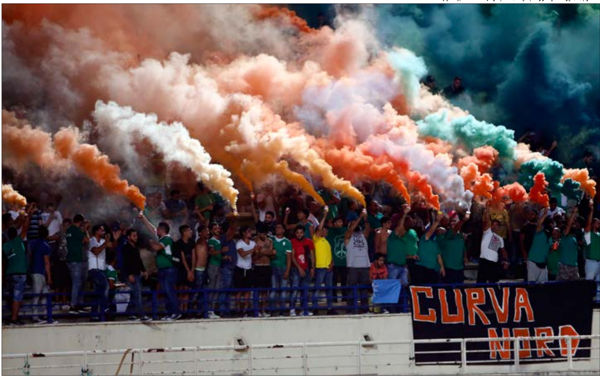
ينتظر جماهير النادي قرارات جديدة من الدارة (معدّات الحاج علي)