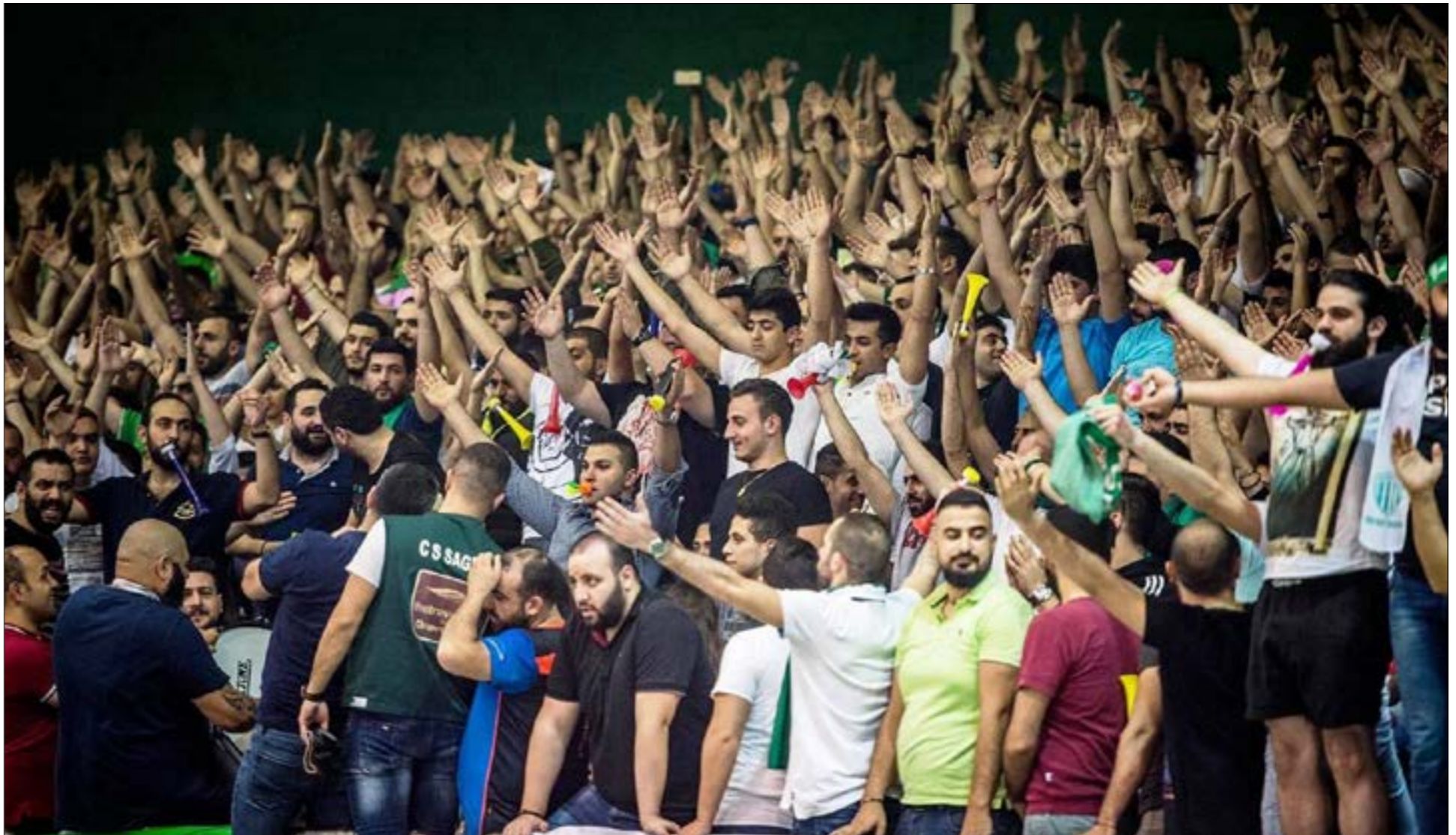
الجمامير خلفت من خسارة النادي

إذ كرة الثلج كبرت داخل الحكمة، وبات الجميع عاجزاً عن تلقيها، الإدارة الحالية والتي ترزح تحت ديون كبيرة، تقف شبه عاجزة عن مواجهة العقوبات، رغم الكلام الذي خرج مؤخراً عن تأمين مبلغ 600 ألف دولار أميركي سيتم دفعها كرواتب للاعبين ولكن هذا المبلغ سيؤجل المشكلة ولن يحلها بشكل نهائي، على اعتبار أن حجم الديون يرتفع كل يوم. وأكدت مصادر حكماوية أن شخصيات في الجمعية العمومية، وبعض الرؤساء والأعضاء السابقين في النادي، ومنهم من عمل مع الرئيس التاريخي للحكمة أنطوان الشويري، سيشاركون في هذه التظاهرة للمطالبة باستقالة الإدارة الحالية، وإعادة النادي إلى كنف مدرسة الحكمة، والمطرائية، حتى يتسلم الإدارة شخص قادر على إخراج الحكمة لير الأمان، وكانت جماهير الحكمة قد نظمت على مدار اليومين الماضيين مسيرات سيطرة في أكثر من منطقة لبنانية، وخاصة في بيروت للتعبير عن غضبها للظروف التي يمر بها النادي، وللمطالبة بإتخاذ قبل قوات الأمان خلال الساعات الماضية اصدر الاتحاد الدولي لكرة السلة «فيبا» قراراً يقضي بتغريم نادي الحكمة بمبلغ 30 ألف فرنك سويسري، بعدما لاحظ عدم وجود جدية من قبل إدارة الحكمة الحالية، في التعاطي مع ملف الديون، والعقوبات المفروضة على النادي، وكان الاتحاد الدولي قد أمهل إدارة النادي حتى نهاية الشهر الجاري حتى تدفع جزءاً من المستحقات المالية المترتبة للاعبين الذين تقدموا بشكاوى ضد النادي.