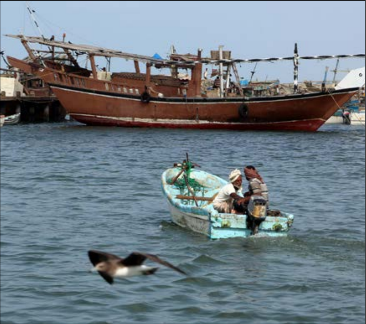
بزور مساعد الأمن العام للأمم المتحدة ميناء، الحديدة هذا الأسوم

استمرار الدفع الأممي في اتجاه تخبث ممدنة الحديدة، تمهيداً لإرساء وقف إطلاق نار شامل.