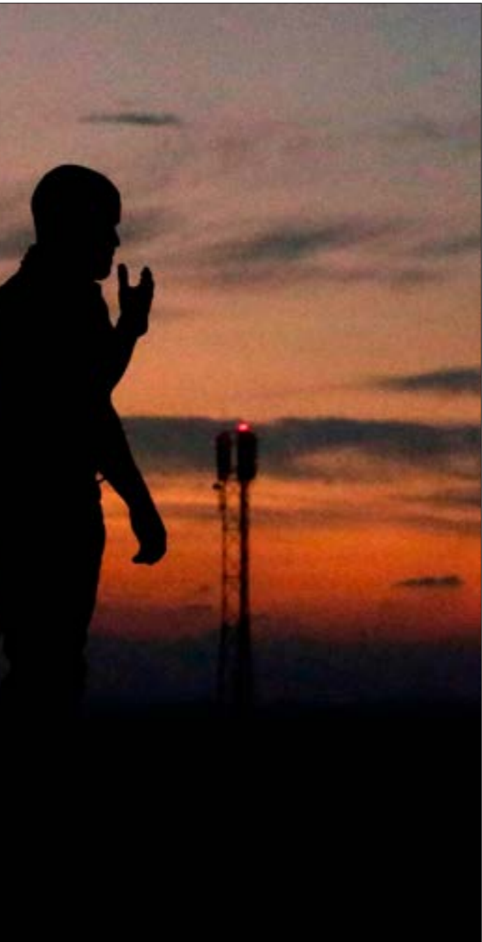
اسمعت معلومات منومة في كشف مسار القوة الخاصة ومهمات سابقة نفذنا

سابق، ورغم إطلاق جيش العدو عشرات الصواريخ على سيارة الوحدة الخاصة والمعدات التي حملين ساعدوهم داخل القطاع، ما مكن المقاومة من الحصول عليه، والتوصل إلى معلومات في غاية الثغرة، ثم مُزيت معيّناتهم الفنية من خلال «كرم ابو سالم» لمصلحة أحد العملاء، وإلى الآن، يمكن القول إن عناصر الوحدة وعرة العمليات