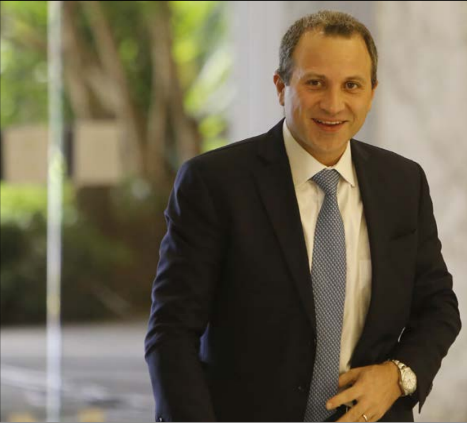
طرح باسيك ريف عدد الوزراء إلى 32 وزيراً، علو للحريري وقلبات للتيار

على 11 وزيراً أو الثلث المعطل في الحكومة، ما دام لدى التيار حلفاء موثوقون في الحكومة. كذلك ذكر رئيس المجلس وزير الخارجية بتنازل حركة أمل عن وزير شيعي لحساب الوزير النائب فيصل كرامي في حكومة الرئيس نجيب ميقاتي، معتبراً أن التيار الوطني الحرّ ورئيس الجمهورية يمكن أن يكونوا الطرف الذي يجمع القوى السياسية ويحضن القوى الصغيرة التي من حقها أن تمثل في الحكومة، وضمان عدم إقصاء أحد. كذلك استبعد رئيس المجلس خيار زيادة عدد الوزراء في الحكومة، وفي السياق، قال النائب عبد الرحيم مراد لـ«الأخبار» إن ما يحكى عن توزيع من يمثل النواب الستة، حل غير وارد، «فليشرح لنا دعاءة هذا الحل السبب في استبعادنا ونحن نمثّل شريحة معتبرة من اللبنانيين. هذا الطرح غير مقبول بالنسبة إلينا». وعلى هذا الأساس، استبعد أكثر من طرف سياسي معني أن ترى الحكومة النور في وقت قريب، ما دام الجميع متمسكين بعدم التنازل.