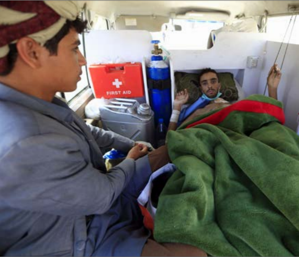
أقلت طائرة إيبوية تابعة للأمم المتحدة جرحى، «انصار الله» إلى عُمان

استئناف المشاورات، في ظلّ موافقة «التحالف» على تذليل العقبات التي أدت سابقاً إلى إفشال جولة «ينلور/ سبتمبر» قبل بدئها، لكن مجرد جلوس الأطراف إلى الطاولة لا يعني أن ما بعده سيكون مضموناً، بالنظر إلى وجود عدة معطيات تصعب خطوات السعودية والإمارات ورعايتهما الأميركي بطابع المناورة. وبعد مرور 20 يوماً على إعلان وزارة الخارجية البريطانية موافقة السفير الكويتي لدى اليمن، بحسب تأكيد نائب وزير الخارجية الكويتي، خالد الجار الله، الذي أعلن أن طائرة كويتية سقل مندوبي «انصار الله» وحلفائها. وعلى رغم أن العائق الرئيسي أمام مشاركة حكومة الإنقاذ في المفاوضات قد أزيل، إلا أن الأمم المتحدة ظلت حذرة من الإعلان رسمياً عن يوم انعقاد المشاورات خشية ظهور مفاجئ غير محسوبة. لكن مصادر من «انصار الله» أفادت، «الأخبار»، بأن المحادثات ستبدأ يوم الخميس المقبل في إحدى ضواحي استوكهولم، وستمتد حتى الـ 13 من الشهر الجاري، على أن يتم تمديدتها إلى السبت (15 كانون الأول/ ديسمبر) في حال الحاجة، وأوضحت