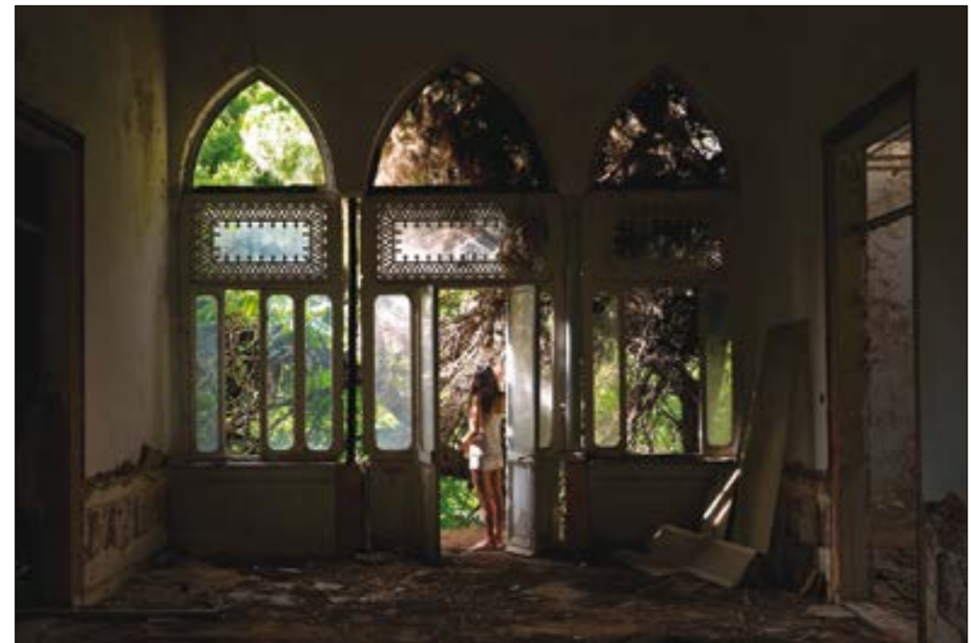
من المجموعة الفوتوغرافية لـ «مساكين مهجورة»

* «مساكين مهجورة: كشف أجهزة» حتى 11 شباط (فبراير) 2019 - «متحف سرسق» (الاشرفية - بيروت). للاستعلام: 01/202001