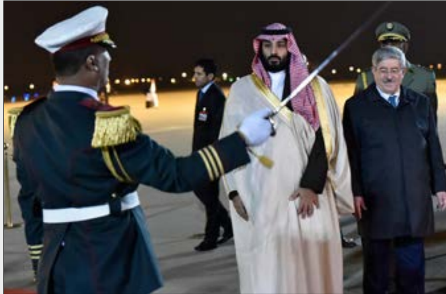
بحث وزير الطاقة الجزائري، مع نظيره السعودي قضية استقرار اسواق النفط

والتي جذّ الرئيس التركي، رجب طيب أردوغان، التعبير عن انزعاج بلاده منها، قائلًا إنه «لو سحخت لي الفرصة لكي أزد على ولي العهد السعودي في قمة العشرين لواجهته بالادلة»، وكّر أردوغان، في حديث إلى الصحافيين أثناء توجهه إلى فنزويلا، التلويح باللجوء إلى الأمم المتحدة لتحريك القضاء الدولي، مطالباً السعودية بالتوقف عن المعاملة، ومُوجّها إليها التساؤلات المعتادة حول حقيقة الأمر بقتل خاشقجي، ومكان جثة الأخير، وهوية المتعاون المحلي الذي تقول الرياض إنه تسلمها. (الأخبار)