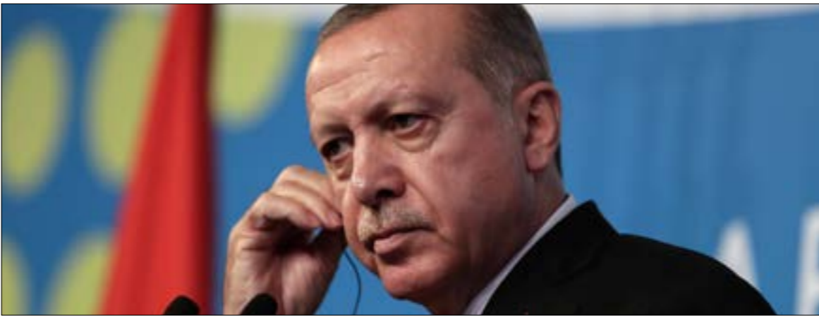
طالب اردوغان السعودية بالكف عن المعاملة، معبدا توجيه اسئلته المعتادة

الأزمة»، وداعية إلى «التسريع في وتيرة تقديم المساعدات الإنسانية». وعلى رغم تزايد الضغط العالمي في اتجاه إنهاء الحرب المتواصلة منذ أكثر من 3 سنوات ونصف سنة، إلا أن مريبط الفرس يظلّ في الولايات المتحدة، الراعية الرئيسية لتحالف العدوان، والتي يُختنظر أن يدرس مجلس الشيوخ فيها هذا الأسبوع قراراً بإنهاء الدعم الأميركي المقدم لـ«التحالف» بعدما كان قد صوّت على إحالته إلى لجنة الشؤون الخارجية. وفي حال نجاح المجلس في إمرار القرار، فسيشكل ذلك عنصر تضييق إضافي على إدارة دونالد ترامب، التي تدعي أنها تريد وقف ما تسميها «الحرب الأهلية» في اليمن. ادعاءات ستشكل مفاوضات السويد الاختبار الجدي والحقيقي لصداقتها، على اعتبار أن إحرار أي تقدم يظلّ مرهوناً بالضوء الأخضر الأميركي وفق ما أظهرته جميع الجولات التفاوضية السابقة.