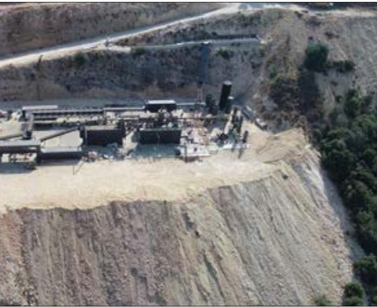
«وَفراج»: أزيلت التعديات التي كانت السبب في إيقاف العمل (الحركة البيئية اللبنانية)

وفي مراجعة الجداول التي سيضعها وزير المال لمعاشات المتقاعدين، وفق مندرجات بيانه الأخير، يظهر التفاوت الكبير وعدم المساواة في نسب الزيادات على المعاشات المتقاعدية للفئات الوظيفية المختلفة. وعليه سيصبح التفاوت بين الزيادات والمعدل الوسيط للزيادات للفئات الوظيفية المختلفة من المتقاعدين على الشكل الآتي: الفئة الرابعة 114.96 ٪، الفئة الثالثة 104.64 ٪، الفئة الثانية 138.00 ٪، الفئة الأولى 73.57 ٪، الاستاذة ثانياً اعتماد معيار موحد لجميع المتقاعدين من مختلف الأسلاك والملكات