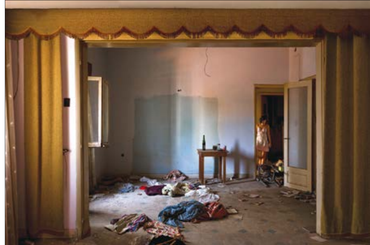
من المجموعة الفوتوغرافية لـ «مساكين مهجورة»

من ناحية ثانية، يخبرنا بجاقجيان أن اختيار النساء هو موقف مديني ونسوي بداية، يؤكد على أنهن جزء من المدينة لذلك حرص على أن تكون لويدياته علاقة مع البيوت التي صورن داخلها. في الصالة الأولى من المعرض، يطالعنا إطاراً رقمياً تتبدل فيها مئات الصور. هي جزء من التقسيمات التي أجراها غريغوري للمباني، وتضمنت أيضاً الحيوانات الحية للنباتات والحيوانات، والتصاميم الخارجية... على الشاشات نرى التصاميم الداخلية التي أخضعها غريغوري لتجزئة أخرى أيضاً تقوم على الممرات، والبلاط، وطلاء الجدران، والأبواب، والخوافض، والحمامات والطبخ والمداخل. هذا التوثيق الهستيري يبدو كما لو أنه محكوماً لمصائر المحفلة للابنية، وإن كان المصور منكباً على المباني بحالاتها الحالية. يصبح التآكل تراكمياً بدوره. تراكم يقوم على التبدل المادي في هذه الفضاءات، ما يحيل إلى أنماط استخداماتها في فترات زمنية مختلفة. إنه اعتراف بحياة أخرى تسير داخل هياكل منسنة. الحرب الأهلية ليست كل الذاكرة، إنها جزء منها. بعزو غريغوري حضورها كسبب مباشر أحياناً إلى قرب البيوت من وسط المدينة مثل عين المريسة والباشورة. في العقدين الفاتحين، شهدت المناطق البعيدة عن الوسط وعن خطوط التماس مثل راس بيروت والاشرفية، عمليات إخلاء كبيرة أيضاً بسبب المشاريع العمرانية والاستثمارات الكبيرة. هجرات تسبقها وتليها هجرات منذ الاحتلال العثماني، والانحداب الفرنسي والخمسينيات وصولاً إلى اليوم. تظهر الفترات الزمنية الحديدية والقوى العسكرية أن في تجهيز صفحه مارك بارود ومارك ديبه، وفق تقسيمات المناطق؛ الدور، عين المريسة، المرزعة، رفاق البلاط راس بيروت، الصيفي... يصنع بجاقجيان ما يشبه بطاقات هوياتية للبيوت تتخضن صورة خارجية للمبني، والحقبات الزمنية