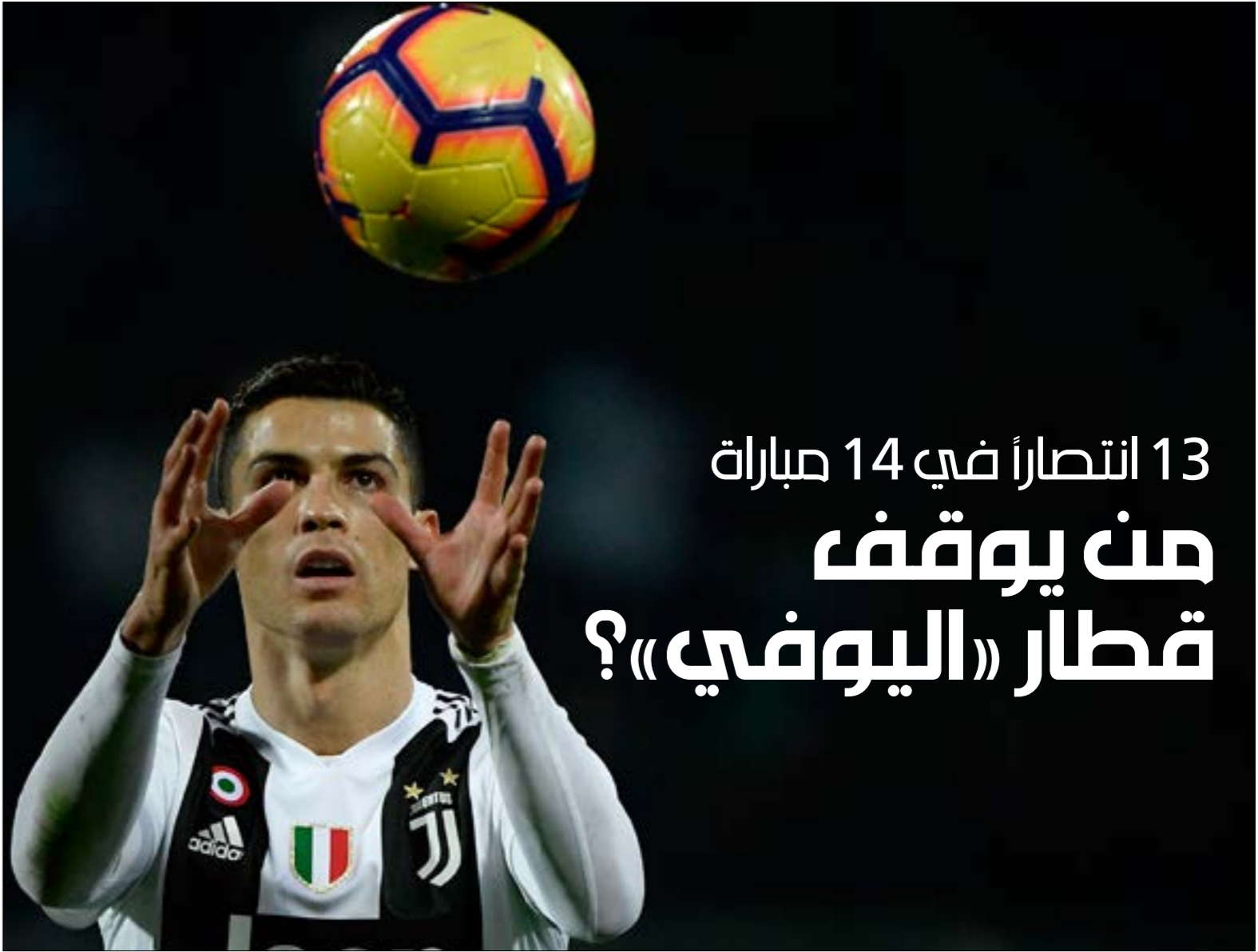
يقدم نجوم يوفنتوس أداءً مقلداً (فيليبو مونتيفورتزي - ا.ف.ب)