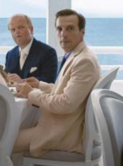
«نهاية سعيدة، للمعلم النمساوي مايكل مانيكه

احتفاءً ان خصاصن في مناسبة اليوبيل الضيق الأول بالشراكة مع «سينماتيك بيروت»، إذ يستعيد المهرجان عنوان من التعاون طويل الأمد بين اوروبا ولبنان. ثلاثة أفلام من إنتاج مشترك من كلّ من فرنسا والمانيا والسويد بعد الحرب الأهلية: «البحار بيروت» (1998 - 1/29، س: 22:15) لغسان سلهب، و«الشيخة» كتيبة، وخوف مرضي من حدوث همزة عساف (بحضور المخرجين)، و«كان يا ما كان بيروت» (1995 - 1/27، س: 22:00) للرائحة أخيراً جوسلين صعب. اللاتق أنها العروض الأولى منذ إطلاقها في تسعينات القرن الماضي، في تكريم الراحلين أيضاً، يُعرّض «أنا وأنت» (2012 - 103، د - 2/2، س: 22:15) آخر روايي بتوقيح الإيطالي الكبير برناردو برتولونشي (1941- 2018). الاحتفاء الثاني معرض في رومانيا على امتداد العقود الفائتة.