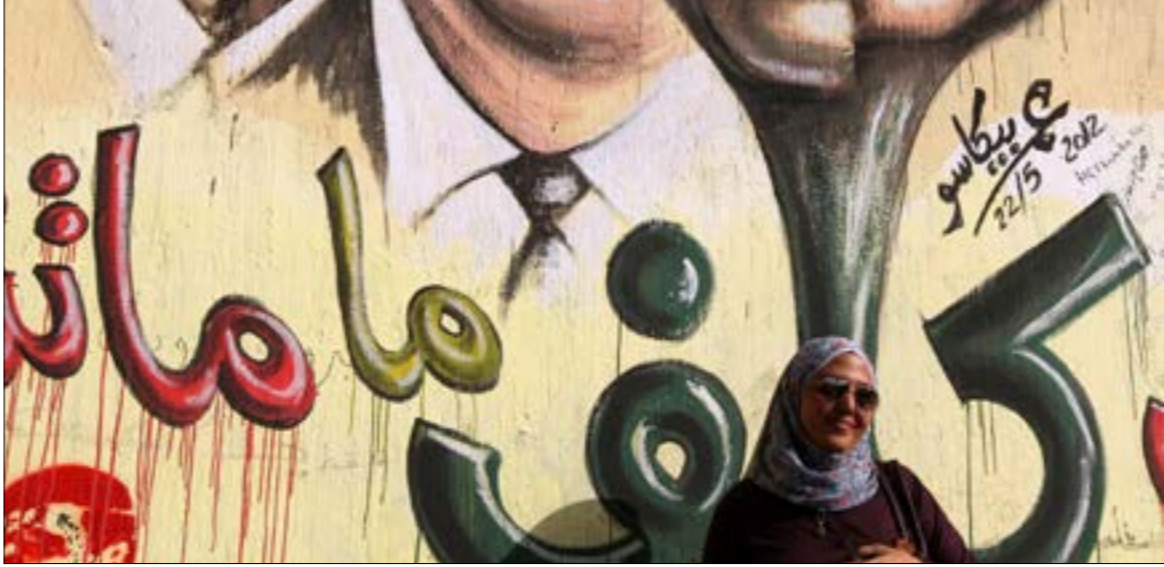
النظام الذي كان قد تفرّقه منهم في مراحل بات مستغنيا عنهم كليا (إم بي إيه)

على التحالف الذي سرعان ما تفكك بعد أسابيع. بخطرة سريعة، خسر الإسلاميون من «25 يناير» كل ما بنوه في عقود، وليس المقصود حصراً مصادرته أوائلهم وإيقاف مشاريعهم وانتقال إدارتها إلى الدولة، بل في ضعف الحضور السياسي والشعبي، والتعرّض للاعتقال المغطى قانوناً، بالإضافة إلى اضطراب عدد كبير منهم إلى الهرب خارج البلاد، ما بين «خروج شرعي» قبل إصدار قوانين المنع من السفر، أو غير الشرعي، لينتهي المطاف بمن سافروا غالباً إلى قطر أو بريطانيا. والآن، بعد ٨ سنوات من الثورة، لم يعد للخيار الإسلامي السياسي وجود، باستثناء حضور ضعيف لسلفي