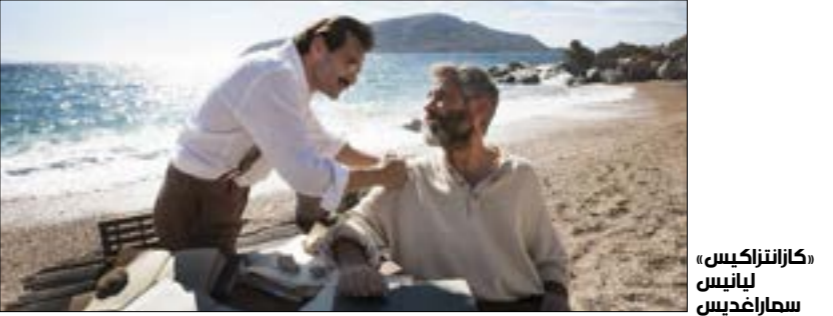
«كارانتراكيس» لثانيس سماراغديس

قادما من «برليناله»، كأفضل فيلم (الدب الكريستال)، في قسم «جيل» المخصّص للأطفال والبالغين، يصل ذاتية لأبناء مثل «كارانتراكيس» (1/25 - 1/25، س: 17:30) لثوبياس فيمان (1981). طفلة العيادة الطبية، لتعرّف من جسيم العيادة الطبية، لتعرّف إلى صديق جديد. الاثنان يقصدان قمة جبل، يُقال إنّه قادر على علاجها. حوار