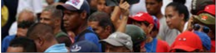
يعتقد ترامب، ان الفرصة أصبحت سانحة للتخلص من عبوه اللاتيني عمود الاتيني الأول، مادورو

مواجهة تشي بأن كراكاس طوت ملف التعاضل القسري، إذ إن البلاد لم تعد تتسع لمشروعين متناقضين في الشكل والضمون.