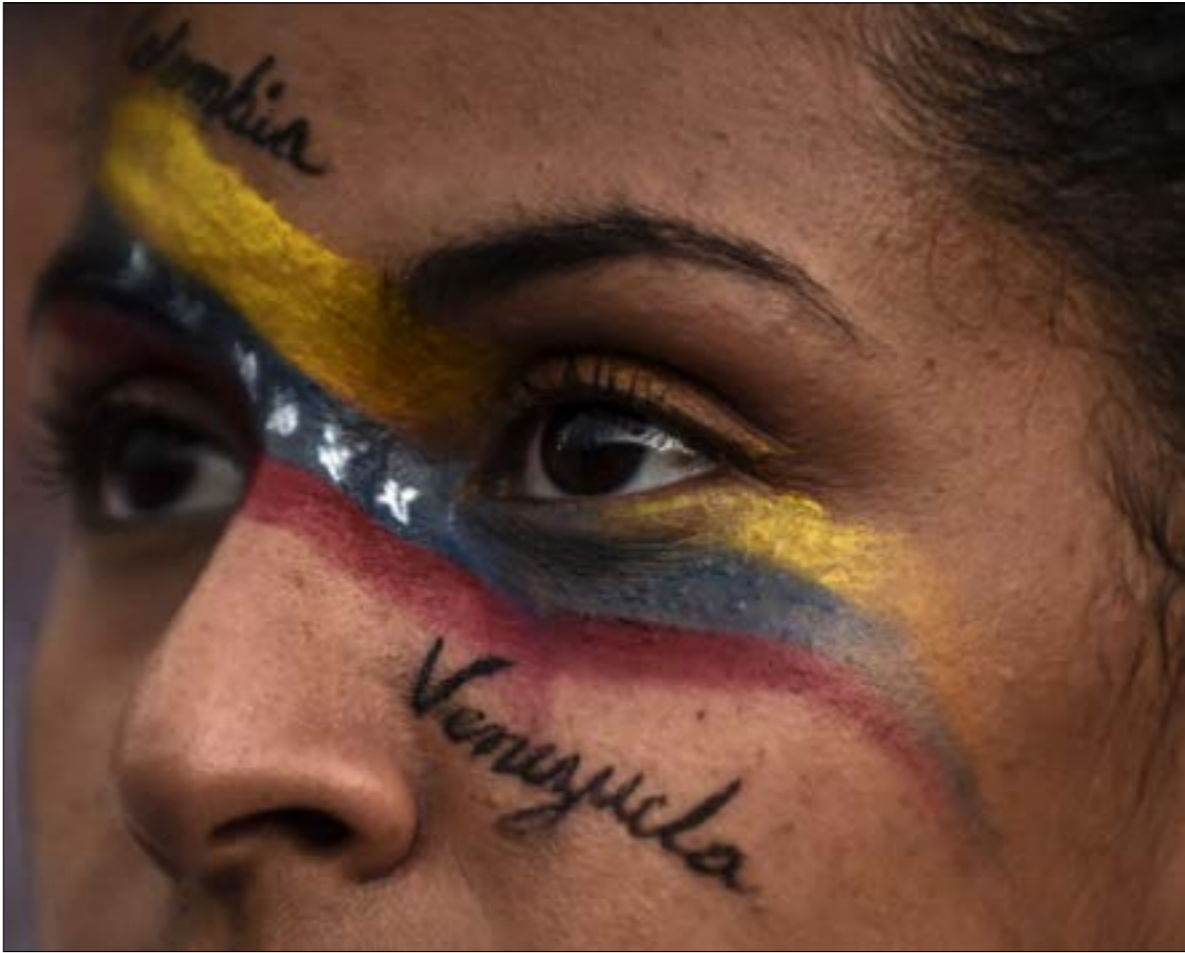
امرع بوتيت في االصالح مع مادورو عن دعمه السلطات الشرعية الثورية