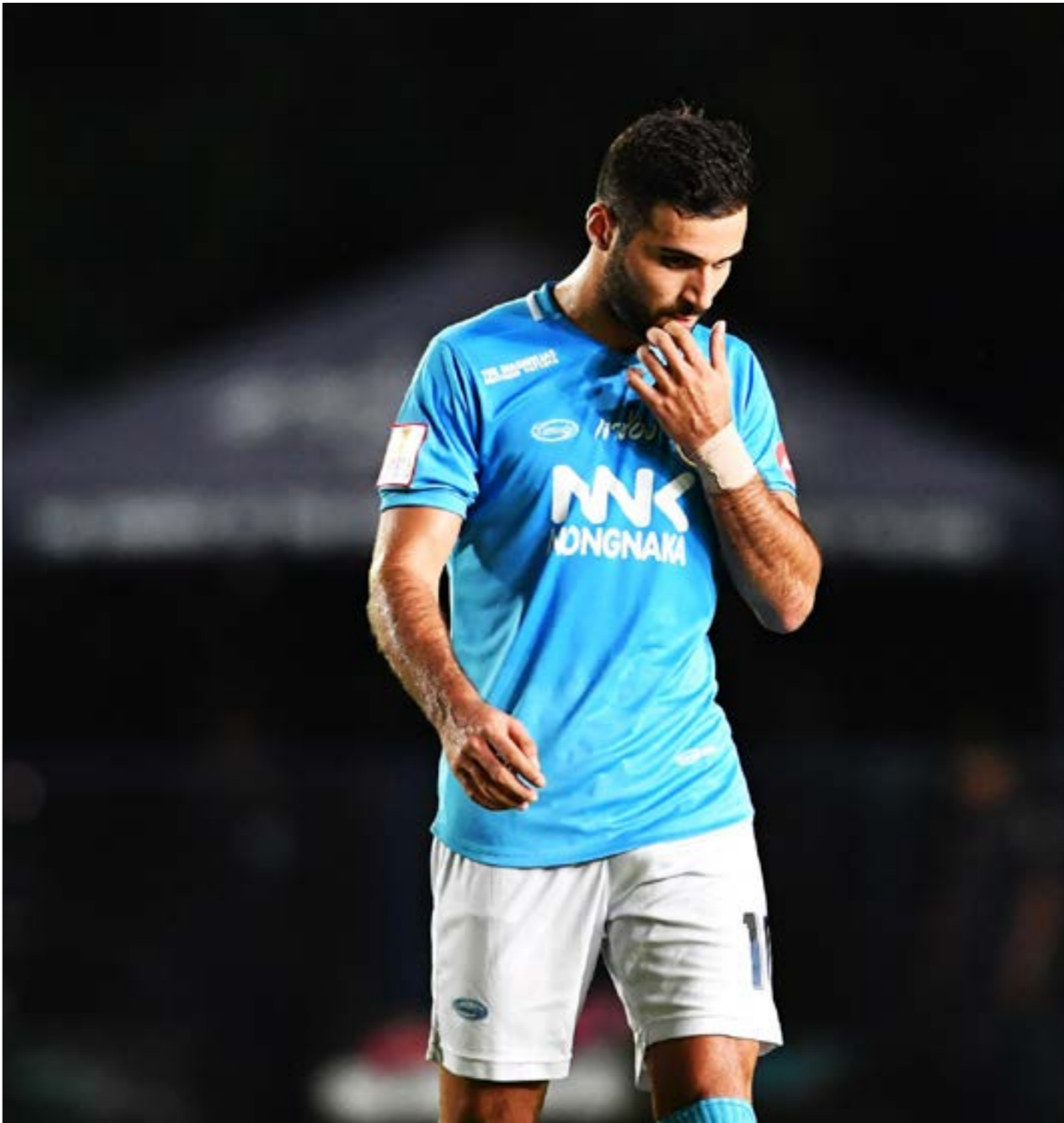
بعض المساحمين يرون خطوة سعد، ناقصة، (رائيف)