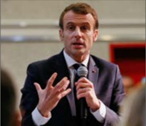
قلة خبرة ماكرون في الشؤون السياسية الداخلية تنسحب ايضا على السياسة الخارجية

لـ«الأخبار»، لم تعد فرنسا تكتفي بدور ساعي البريد لنقل التهديدات الإسرائيلية إلى لبنان، لقاء الرئيس الفرنسي والاسرائيلي خلال زيارة الأخير لها، تخلله بحث في اهتات تعاون ميداني، معلوماتي ولوجستي، بين البلدين في سوريا بعد الانسحاب الاميركي، تتمدد التفسيرات لخصيات التباحث حول هذا الخيار المحتمل، لكن لا خلاف على انه تداعياته ستكون شديدة الخطورة على مستقبل الدور الفرنسي في الإقليم