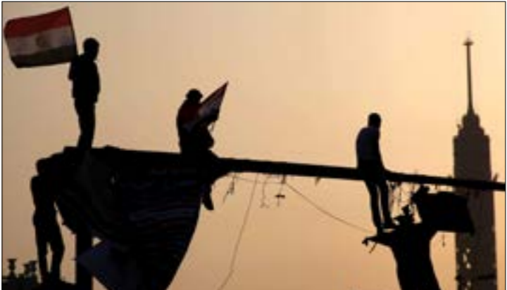
امان القضاء لشيوخهم الذبت انتموا إلى اللورة وشخموها (إم بي إيه)