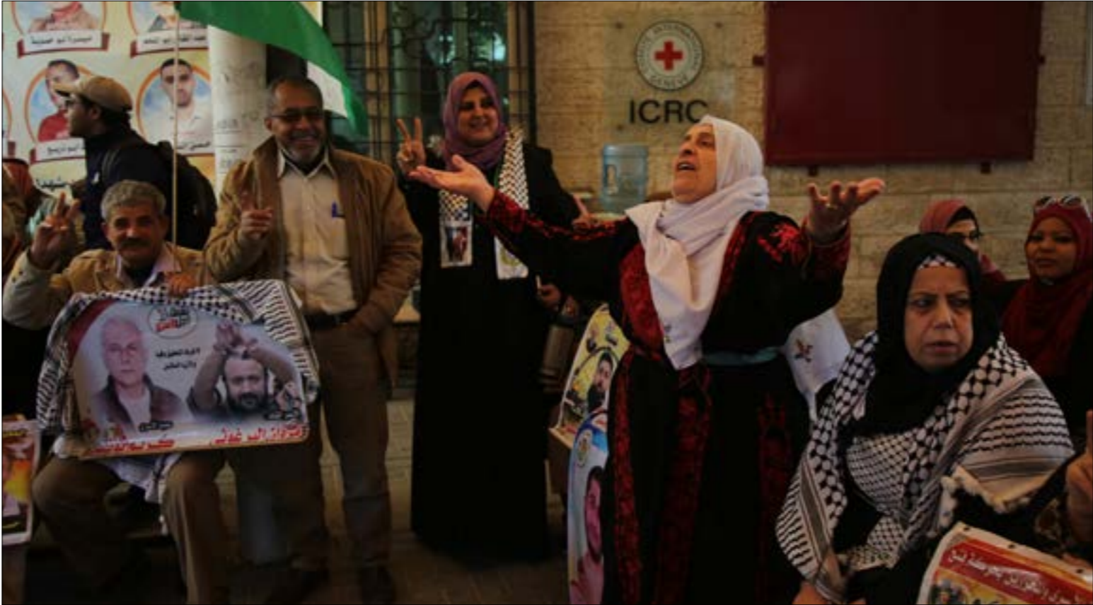
يخسر الأسرى في «القمعة»، كما ما يملكونه

وزير الامن جلعاد اردان الذي لا يمانع الذهاب في «مخيلته الشريرة» إلى ابعاد هذه من اجل حيازة اصوات حزبه «الليكود»، وحجز مكاتب له على قائمة الأخير الانتخابية، توصيات اردان «المتوحشة» تحدّ ذروة مسار «قانوني» قادته الاحزاب