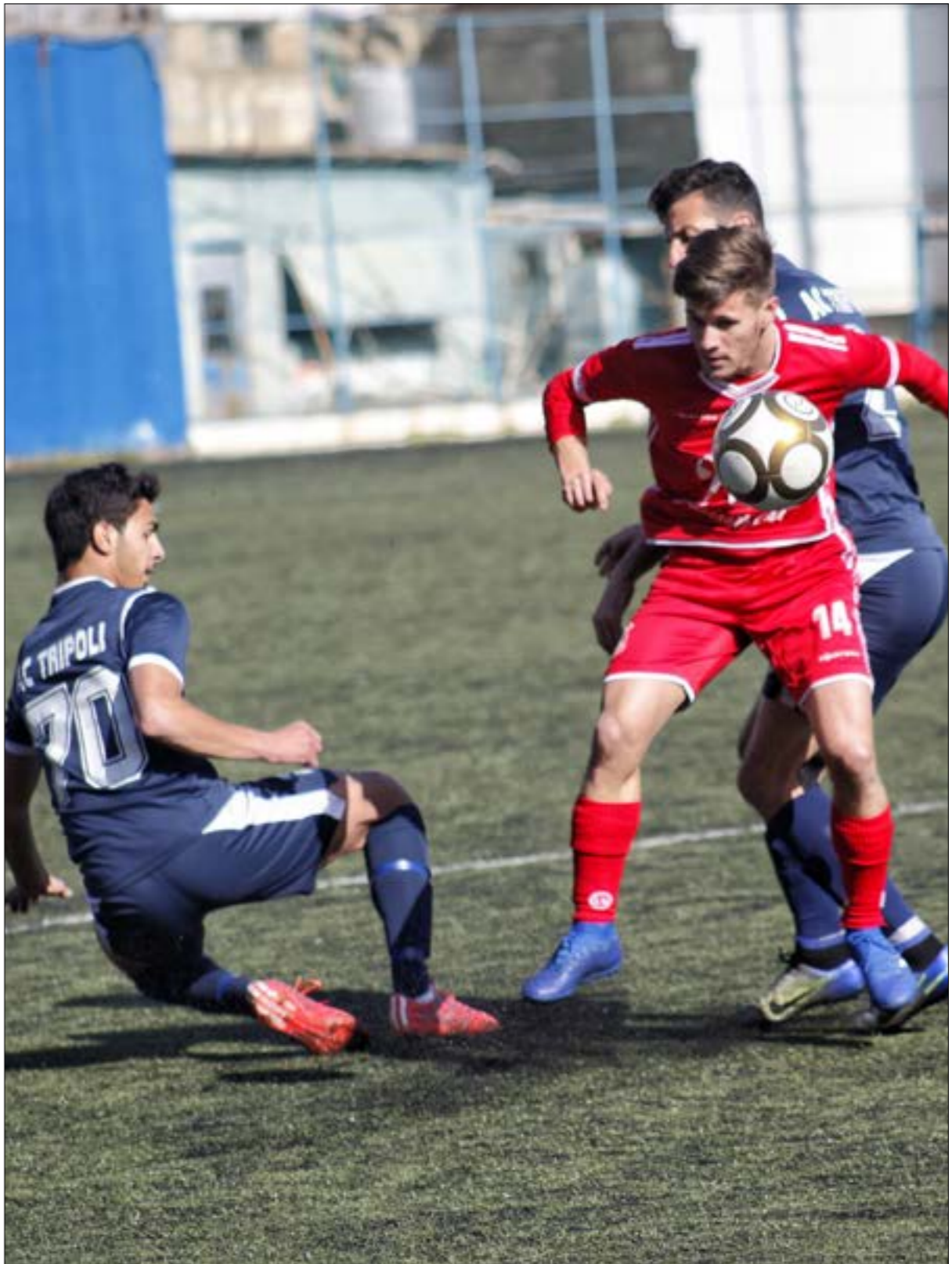
تأهل طرابلس على حساب التضامن صور لواجه الصفاء في المباراة التي لُعبت في مسابقة الكاس، ربح النهائي (الأخضر)

خلال الدوري، بعدما خاضت الجولة الأولى إيجاباً أيضاً، خاصة بعد اكتمال التحضيرات وتغيير بعض اللاعبين والوصول إلى الجاهزية البدنية المطلوبة، المنافسة على اللقب لن تخرج عن الثلاثي العهد والنجمة والانتصار، في حين تتصارع ستة فرق على الأقل للبقاء. لم يتغير شكل العهد كثيراً عن مرحلة الذهاب الفريق هو عينه، والإصابات لا تزال تلاحق اللاعبين. هذه المشكلة، إذا ما دامت، لن يكون التعامل معها سهلاً ابتداءً من أواخر شباط/فبراير المقبل، حين تبدأ مهمة الظفر بلفق كاس الاتحاد الآسيوي. بعد المباراة الآسيوية الأولى، يلعب العهد خارج أرضه مع السلام، ويتخطره مباريات محلية صعبة مع التضامن في صور والإخاء في بحدون والانتصار والنجمة. حامل لقب كاس لبنان تخطى قطوع الساحل وفاز عليه