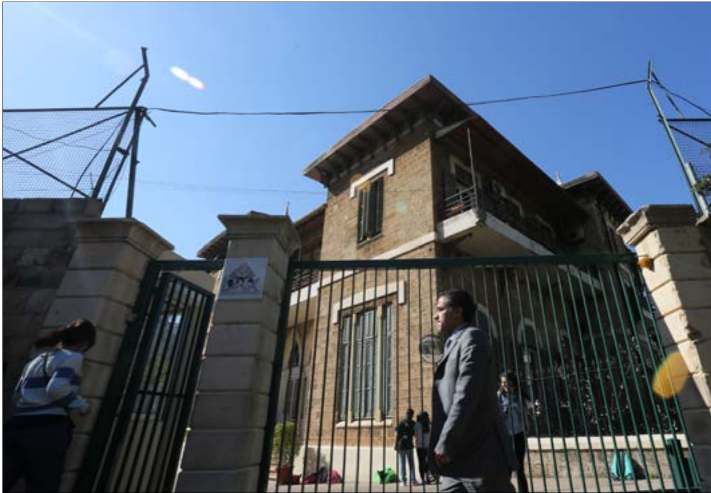
لم تسخّل ليسيه حتى اليوم أي تلميذ في صفوف الروضات الولد للسنة المقبلة