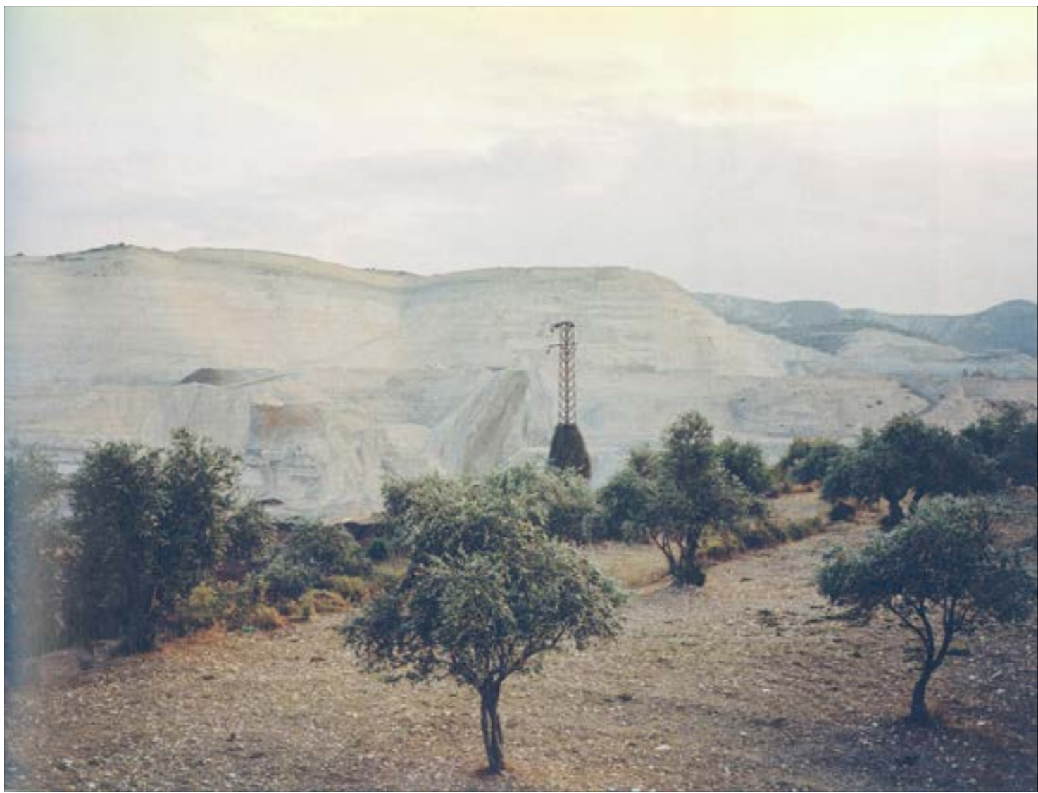
«حوار مع صديقتي، لكارولين ثابت وجوانا اندراوس (2015) _ ولا يزال قيد التطوير