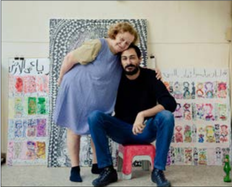
بدا الثنائي تعاونهما الفني عام 2006 عبر رسومات حول عدوان تموز