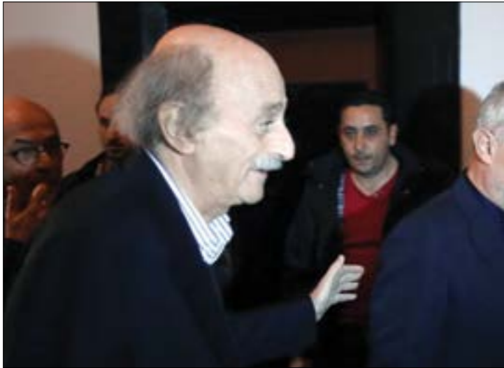
جنبلاط، إذا أرادوا الصنامة أو التريفة... فليوفقوا حكومة من دوني (مروان طحطح)

الضمد لم يحسما موافقتهما على هذا الطرح، ولا يزالان يعترضان على حضور الوزير اجتماعات تكفل لبنان القوي وهذا الأمر كان مدار بحث أسس واستكمال للجلسة التي عقدها أعضاء اللقاء التشاوري مع معاون السياسي للأمن العام لحزب الله السيد حسن نصرالله، الحاج حسن خليل ليل أوّل من أمس، وشهدت نقاشاً طويلاً. لكن مطلقين على المشاورات أكدوا لـ«الإخبار» أن العقدة انتهت، ومن المتوقع أن تحسم الوجهة اليوم أو غداً، وما لم تحسم بعد هو اسم وزير «التشاوري». فرئيس الجمهورية يفضل حسن عبد الرحيم مراد، فيما يضع الحريري فيتو على الأخير، مقترحاً اسم عثمان مجذوب، وقالت مصادر قريبة من الحريري إنه سيتمكّن بالفيتو، مريحة، في حال إصرار عون على مراد، أن يعدد رئيس الحكومة إلى منح الوزير جمال الجراح حقيبة الداخلية، ليتمكن خدمتها من مواجهة مراد في البقاع الغربي. أما على صعيد أزمة توزيع الحقائق، فأكد أكثر من مصدر أن الحلّ المرخّج هو ما يعمل عليه الرئيس المكلف سعد الحريري، بحصول حركة أمل على وزارة الصناعة من حصة الحزب الاشتراكي أو وزارة الثقافة من حصة حزب القوات اللبنانية، وإعطاء القوات بدلاً منها حقيبة وزارة الشؤون الإدارية من حصة تيار المستقبل وحصول المستقبل على حقيبة الإعلام، وقالت مصادر عين التينة لـ«الإخبار» إن «حركة أمل لا تمناع الحصول على وزارة الثقافة، لكن حتى الآن لم يُطرح هذا الأمر معنا رسمياً»، وفيما تردد أن النائب السابق وليد جنبلاط منزعج من مسار التحالف الحكومي، قالت مصادرهن إن «أحد لم ي طرح معنا مسألة التخلي عن حقيبة الصناعة، لكننا نؤكد أننا لسنا في وارد التنازل عن حقيبة الصناعة ولا القريبة، وأنه في حال حرماننا إحداها، فليشكّوا حكومة من دوننا. تنازلاً كثيراً من دون مقابل. فليحلوا مشكلتهم على حساب غيرنا».