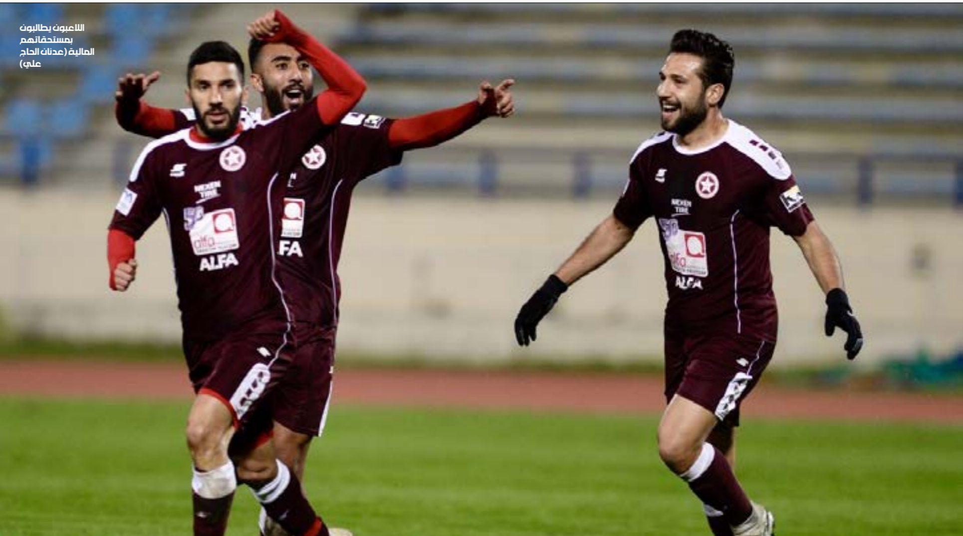
اللاعبون يطالبون بتسديداتهم المالية (معدّن الحاج علي)