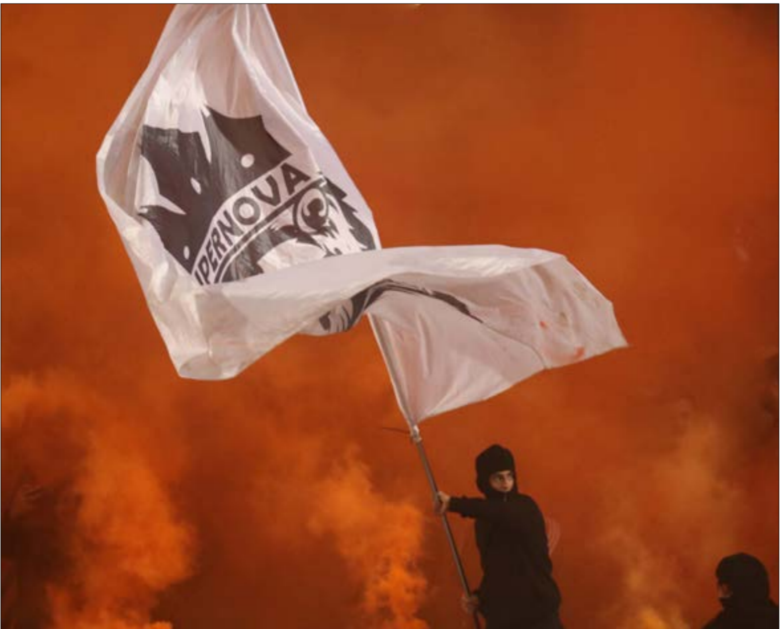
يضفي الأتراس صورة جميلة على المدرج (معدّن الحاج علي)

أو للفريق الطرابلسي. لا يُمكن ضبط هذه الأمور، بل ربما، ليس هناك من داع لضبطها. هكذا هي كرة القدم وهكذا يكون الجمهور ينظر الكخربين. الشتائم تأتي نتيجة انفعالات أحياناً، وأحياناً أخرى بسبب ترديد ما يُسمع، فالجمهور صوتٌ واحد، والاكتماء بتشجيع الفريق دون الالتفات إلى المنافسين يُفقد شيئاً من متعة الحضور على المدرجات. «مش قاعدين بجامع/ كنيسة»، عبارة تردها الجماهير كأنّما سُئلوا عن شتمتة (مسبة) سمعت من على المدرجات، لكن المشكلة هي في نسيان السبب الأساسي للوجود على المدرجات، وهو التشجيع. المفارقة هي أن الأتراس يلتزم بمساندة فريقه سواء كان متقدماً بالنتيجة أو متخلفاً. لديه اعتباراته الخاصة ووجهه المختلف عن من هم حوله، بل يفرد باقي المشجعين أحياناً، هذا لا يعني أن الشتائم غائبة، «بتمرق» لكنها لا تطغى على التشجيع.