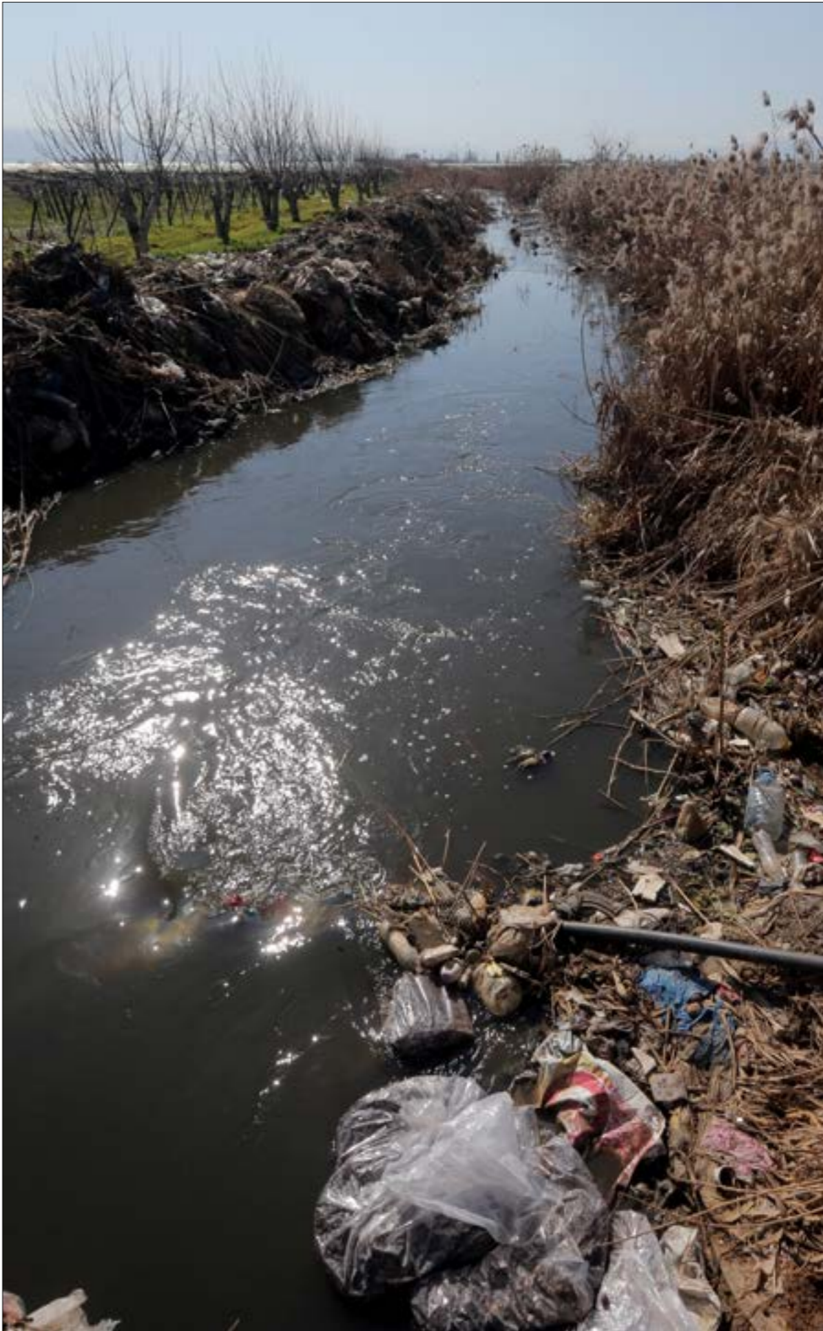
775 من الأمراض المعدية في المناطق القريبة من المسالخ ناجمة عن المخلفات أو المنتجات الحيوانية