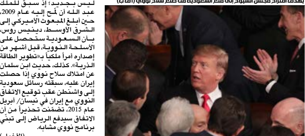
بهدف اقتران مجلس الشيوخ الى منع السعودية من صنع سلاح نووي( اف بى)

بموجبه أي اتفاق أميركي للتعاون النووي المدني مع السعودية لتخصيب اليورانيوم أو إعادة معالجة البلوتونيوم، وهما وسيلتان تُستخدمان في صنع أسلحة نووية، وعلى رغم أن الرياض رفضت في محادثات سابقة توقيع اتفاق مع واشنطن بحرم السعودية تخصيب اليورانيوم، إلا أنها تدّعي أنها غير مهتمة بحويل التكنولوجيا النووية إلى الاستخدام العسكري، وأنها تريد تحقيق الاكتفاء الذاتي في إنتاج الوقود النووي، لكن حديث ابن سلمان عن أن بلاده