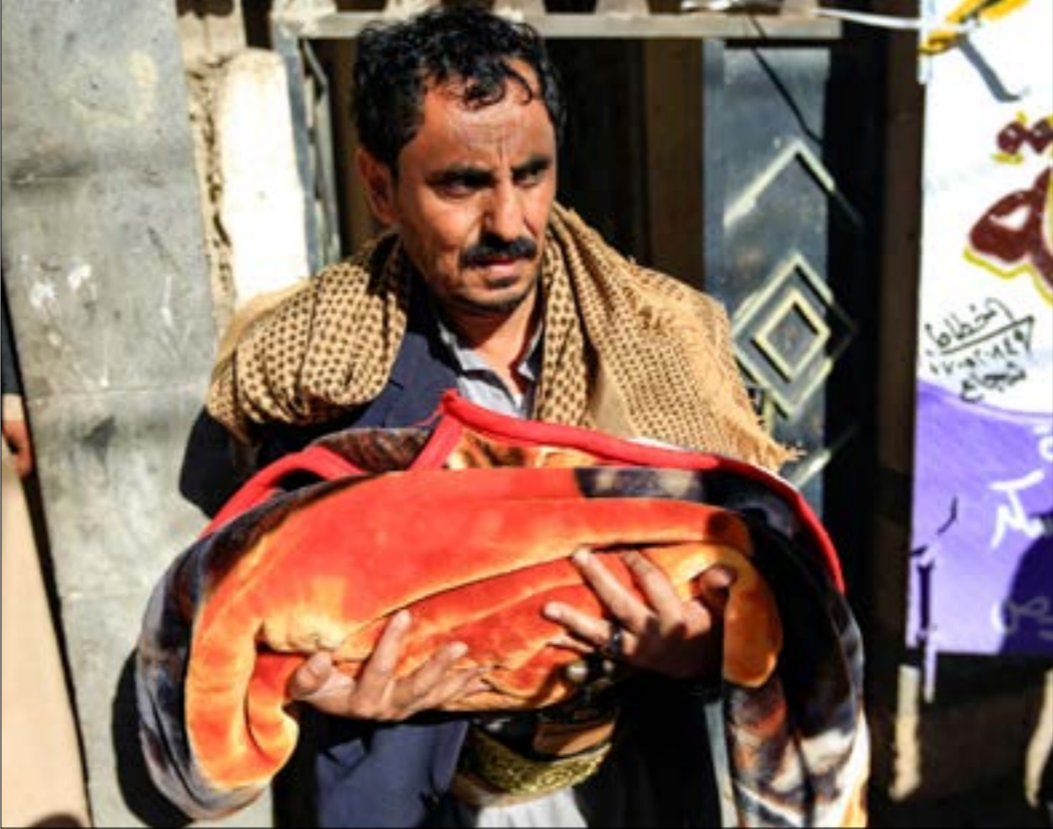
حذرت الامم المتحدة من احكام عقوبات جبهه باكملها بسبب استمرار سوء التفقيه

في إطار الصراع مع البيت الأبيض، بسبب موقف الرئيس دونالد ترامب، الداعم لولي العهد السعودي محمد بن سلمان، في قضية اغتيال جمال خاشقجي، تُبدو مشاريع أعضاء الكونغرس ممنهجة أكثر من أي وقت مضى. ففيما يجري وزير الطاقة، ريك بيري، محادثات مع مسؤولين من السعودية بشأن