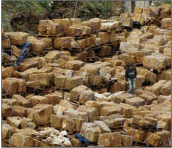
الحملة سبغها لها مسير الري لإنقاذ السور الروماني (مروان طحطح)

أيضاً، على أن تكون هذه التحركات مجرد بداية تأسسية للحملة التي تستهدف تصحيح مسار صان نهجاً في وزارة الثقافة، أساسه التعدي على صلاحيات المديرية العامة للأثار التي لها الحق في تقرير مصير المكتشفات الأثرية. وفي ما يتعلق بقضية السور الروماني والمراجعة المرفوعة أمام مجلس شوري الدولة، لا شيء جديداً يمكن التعويل عليه، إذ إن الدولة لم تقدّم جوابها بعد، ولا حتى الملف الإداري للحفّرة الذي «يكشف» عن المراسلات التي جرت في هذا الصدد، ولا سيما تقرير المديرية العامة للأثار الذي قضى بمنع فك السور وإعادة دمجها فيما قُدمت شركة «عالية»، التي تقدمت سابقاً طلب تدخل في الدعوى، جوابها إلى «الشورى».