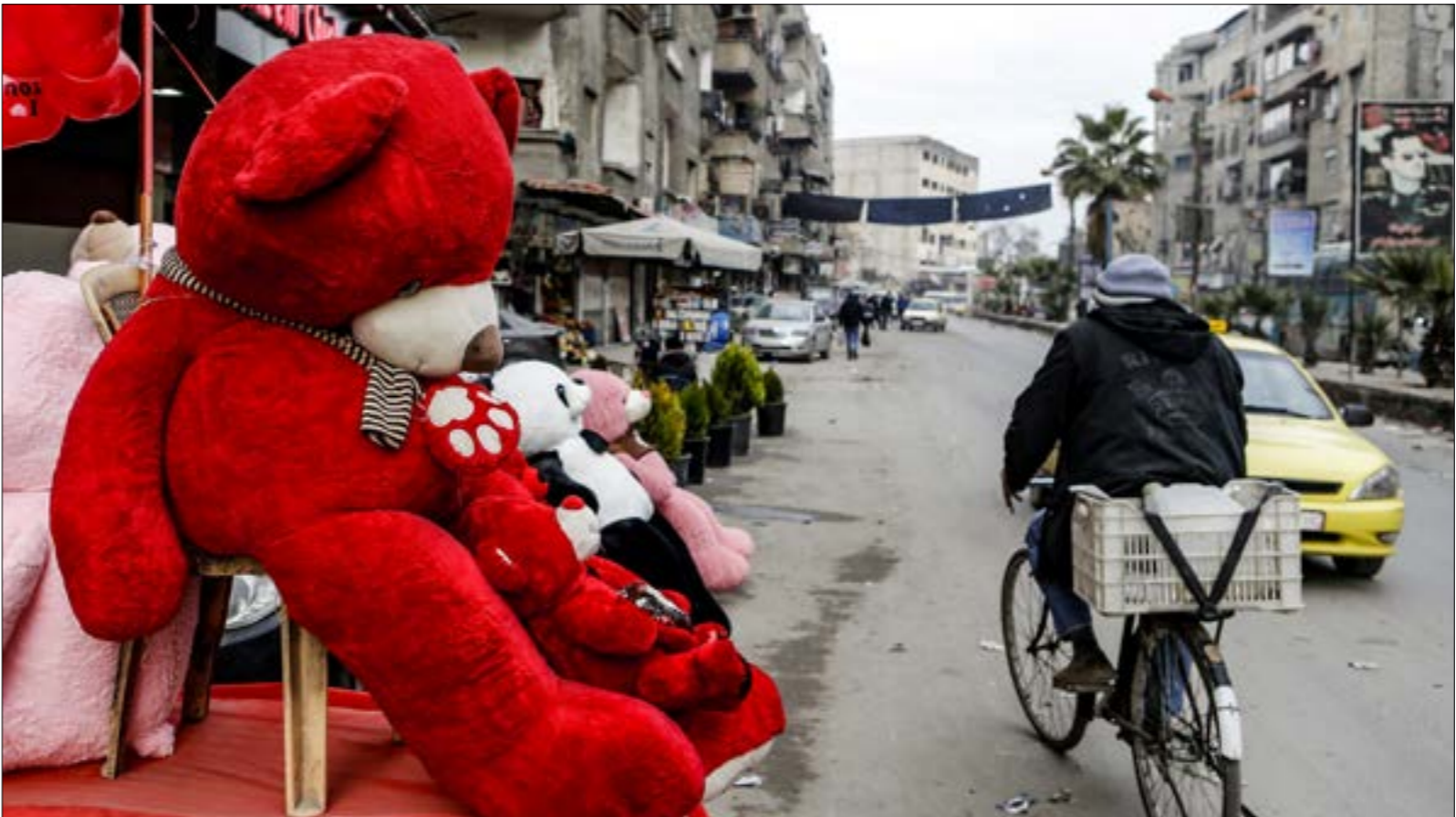
من أحد شوارع مدينة جزمنا أمس

الولايات المتحدة في العراق. تقول المصادر إن الأميركيين يحاولون «تطريب الأجواء» المتشججة بين بغداد وواشنطن، ويسعون في تفسير مواقف ترامب على أنها «لا تمس السيادة العراقية»، وعلى رغم كثرة المواقف الراضية لتلك التصريحات، إلا أن الجانب الرسمي، وإحدى الحكومات، في حديثي، في إطار السعي للقضاء على «داعش»، تعاوناً مع واشنطن. المعلومات حول الصفقة الأميركية مع «قسد»، في ما يتعلق بانتقال عوائل مسلحي التنظيم إلى العراق، لا تزال ضبابية. مصادر متعددة تشير، في حديثها إلى «الأخبار»، إلى أن انتقال العوائل، والتي يبلغ عددها أكثر من 13 ألف شخص، إلى الداخل العراقي، وتحديدأ إلى منطقة غرب الأنبار، بدأ فعلياً قبل ثلاثة أسابيع. وفي السياق نفسه، توضح مصادر حكومية عراقية عن هذه «الهجرة» هي مطلب عراقي، إلا أن الجانب الأميركي «رحب» إتمامها أكثر من مرة»، رابحاً ذلك بنية وواشنطن الإعلان عن