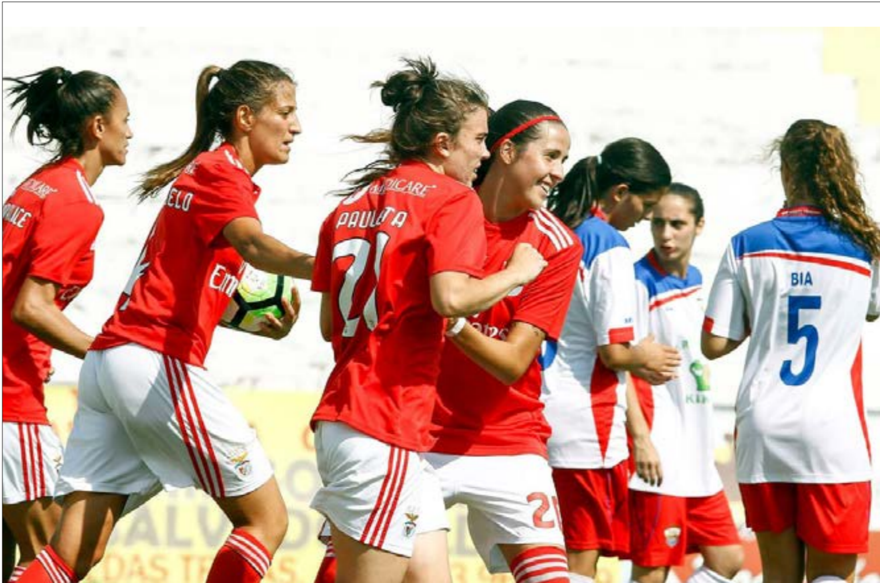
بنشاط في دوري الدرجة الثانية (السيف)