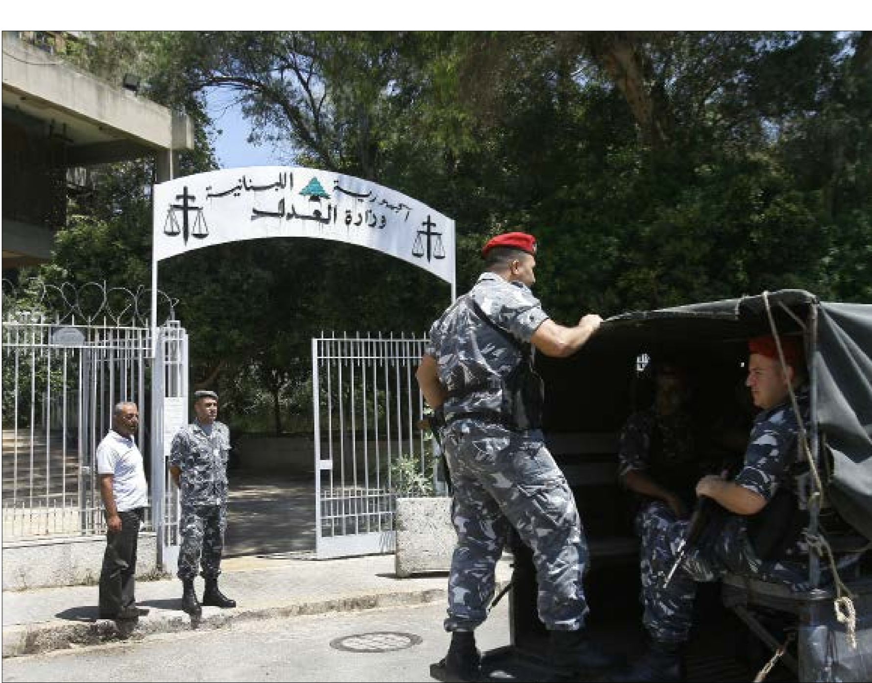
من غير عمد القاضي جرمانوس يده إلى ملصقات امام محكمة المطبوعات (مراتب طحترم)

يسعى القضاء العسكري إلى خنق حرية الراي والتعبير. يسير مفوض الحكومة لدى المحكمة العسكرية بيتر جرمانوس بخطى ثابتة لكتم أنفاس الصحافيين منحت له الفرصة. يخالف القانون بدمج لا سابق لها. كان يذم على صحافيين امام القضاء العدلي بصفته مدعياً عاماً عسكرياً. ويفر محاكمة صحافيين آخرين امام «الحاكم العسكري»!