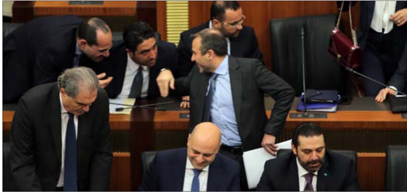
القوات لا ترحح حلولاً للزمة الاقتصادية إلا من زاوية التخصص (مهلب الموسوي)

نجم المؤتمن على الأملاك البحرية بوصفه رئيس لجنة الأشغال العامة. أنفعل بطريقة غير مفهومة وهو يقول: تبينّ أنه (إيدن باي) حصل على كل التراخيص اللازمة، هل هكذا ستواكب لجنة الأشغال حوكمة «إلى العمل»، التي تضع مكافحة الفساد في سلم أولوياتها؟ العرض متواصل، ليس في الخارج فقط بل في الداخل أيضاً. بعد كل ما قيل في المجلس، لن يستطيع الفساد