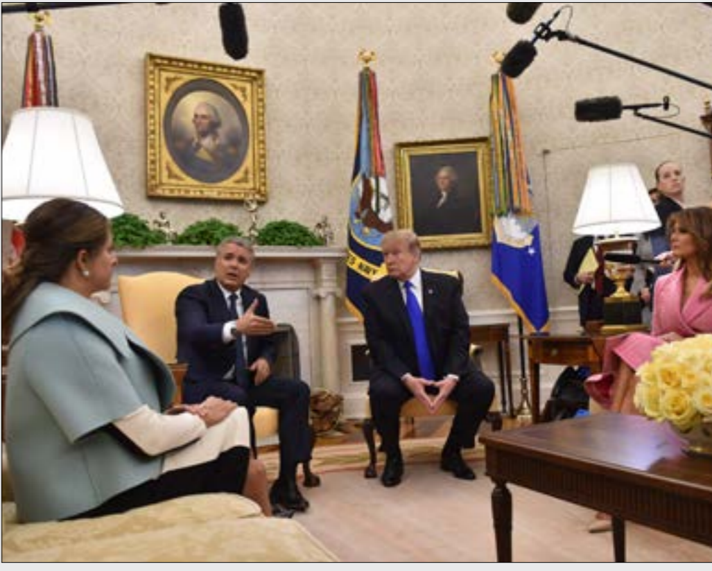
دعا الرئيس الكولومبي خلك لثابت ترامب إلى إبقاء الضغوط على نظام مادورو (أف ب)

به واشنطن والذي يمثل انتهاكاً للقانون الدولي». الاعتراض على التدخل العسكري جاء من الداخل أيضاً، إذ أعلن رئيس لجنة الشؤون الخارجية في مجلس النواب، إليوت إنجل، أن الكونغرس لن يدعم تدخلًا عسكرياً أميركياً في فنزويلا، ما بنى بمواجهة جديدة سيخوضها ترامب مع تريد الحوار والتفاهم والاحترام». ونحو الخيار العسكري. وقال إن «الرئيس النائب الديموقراطي، في مستهل جلسة بشأن الوضع السياسي المضطرب في البلد العضو في منظمة «أوبك»، «شعر بالقلق إزاء تهديد الرئيس باستخدام