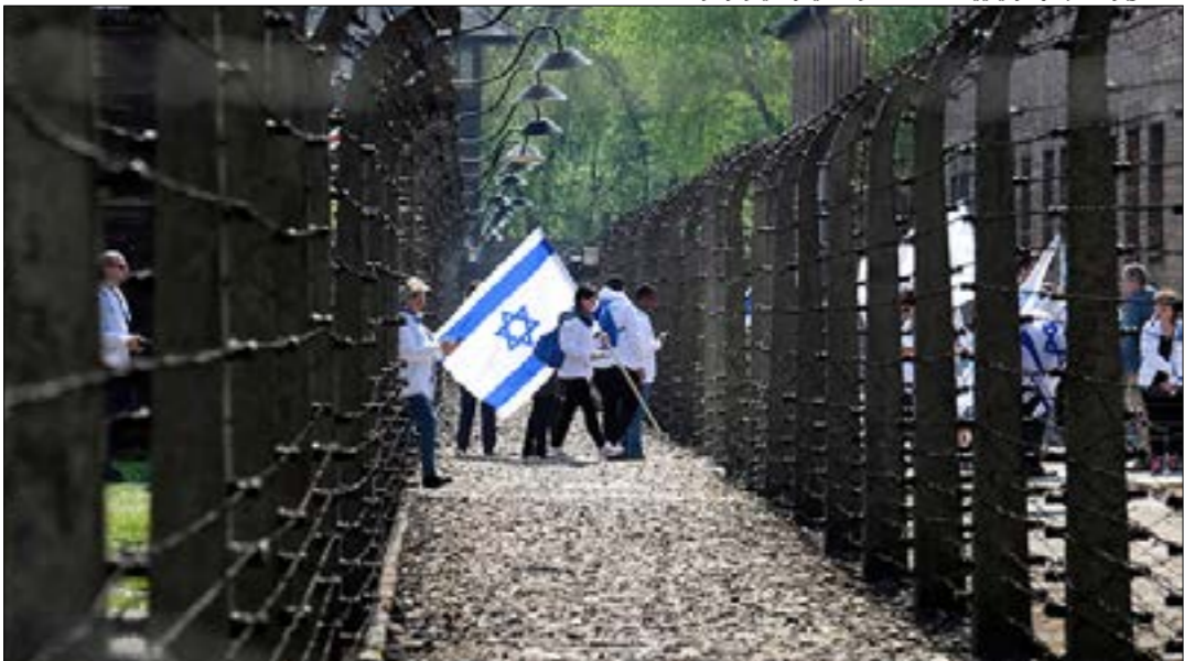
خلال زيارة طلبة اسرإيليين لمصفق أوشفيتز في وارسو

الموضوع إلى مناهج التعليم، وحتى نهاية الحسينيات، كان سموحاً للمدرّسين الإسرائيليّين استخدام كُتّيبات صغيرة للتحدّث عن ذلك، التطور حدث عندما اختلف جهاز «هارتس» الإسرائيلي، أودولف أنخمان، أحد المسؤولين الكبار في البوليس السري في الرايخ الثالث، وبعد محاكمة أيخمن وإعدامه شنقاً في مدينة اللد المحتلة، أدخل موضوع المحرقة رسمياً إلى المدرسة، تحدث عن «التفوق العرقي لليهود»، في مقابل «العيوب الخلقية التي يحملها العرب في جيناتهم»، ولذلك على هؤلاء (العرب) «بحسب نظريته، أن «يخدموا اليهود».