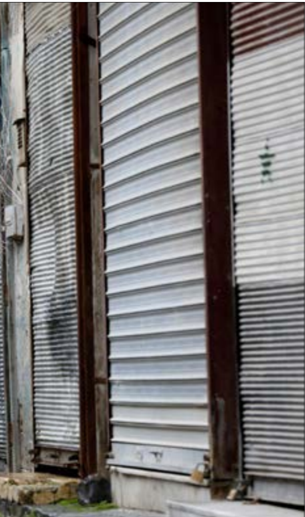
غياب السهولة النقدية فرض حظر تجوال ذاتيا في الأسواق