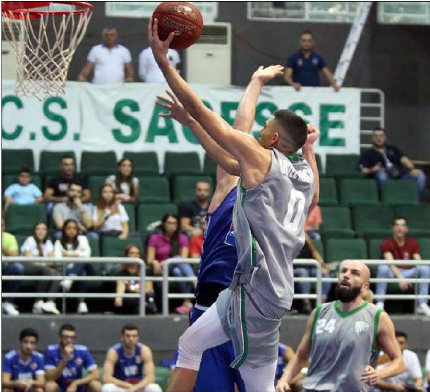
ناهر ديتن نادي الحكمة يلعب مباريات دور