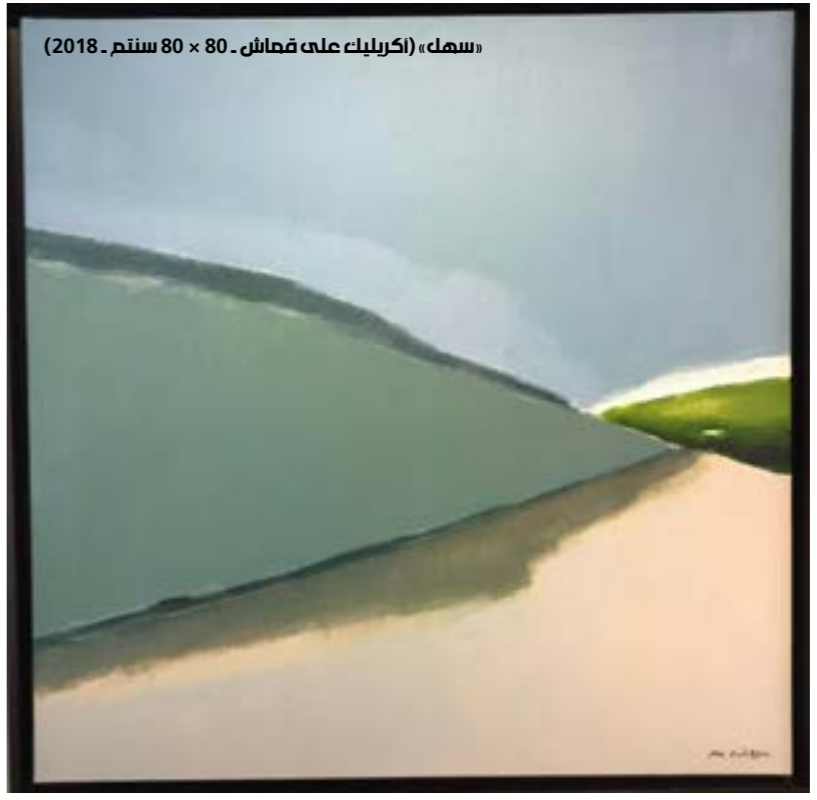
«سهل» (اكريليك على قماش، 80 × 80 سنتم، 2018)

«هَيْك... السهول» حتى 25 أيار (مايو) - «غاليري أجيال» (الحمرا). للاستعلام: 01/345213