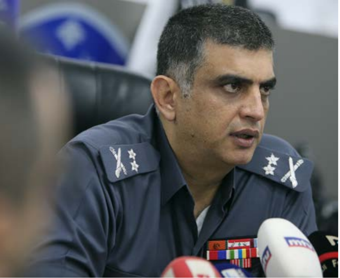
عثمان لم يستجيب للاستنابات القضائية لأنه المسؤول الأول عن المخالفات (هيلم الموسوي)

من جهة ثانية، استمرت الحكومة أمس في نقاش مواء مشروع الموازنة، ووصل النقاش أمس إلى المادة 25، وجرى نقاش عدّة نقاط