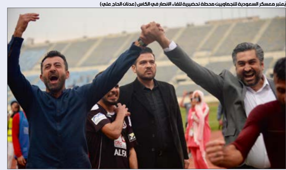
تعتبر معسكر السعودية للتحضير للقاء النصر في كأس (عبدالحاج علي)

إسباني، أربعة كأوس سوپر إسبانية وكاسي سوپر أوروبي. بدأت مسيرة كاسياس بالإنحدار على إثر مشاكل شخصية مع المدرب الأسبق جوزيه مورينيو، انتهت بجلوس الحارس الإسباني على مقاعد البدلاء ليقفد المركز الأساسي الذي طالما لفته بين أسوار سانتياغو بيرنابيو. على إثر ذلك، انتقل من ريال مدريد إلى بورتو البرتغالي عام 2015 عن عمر يناهز 36 عاماً، وأحرز في صفوفه بطولة الدوري المحلي الموسم الماضي. على الصعيد الدولي، شغل كاسياس المركز الأساسي في حراسة مرمرى المنتخب الإسباني، رغم وجود منافسة شديدة من حارس برشلونة السابق فيكتور فالدينز، وحارس مانشستر يونايتد الحالي يفيد دي خيا. هكذا، أصبح كاسياس أكثر لاعب إسباني مشاركة مع المنتخب، برصيد 167 مباراة دولية. توجّ القديس خلال تلك الفترة بلقب كأس