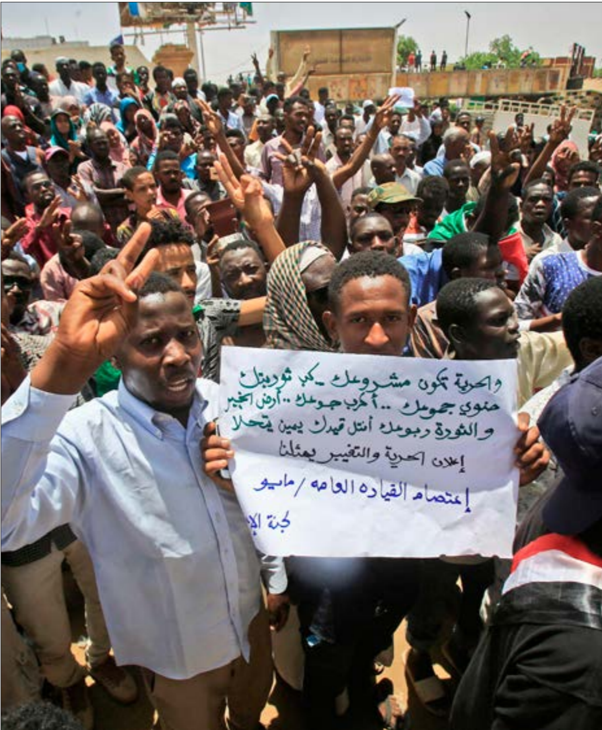
حصرت الوثيقة تأسيس مجلس الوزراء والبرلمان بيد قوه «الحرية والتغيير» (فا رص)

الافتان أن الحديث عن انقسامات في صفوف القوات السودانية يتراقف مع تصاعد وصول الآلاف من المهاجرين الأفارقة، بتسهيل إماراتي، إلى سواحل اليمن، في وقت سُتهدف فيه قوارب الصيد اليمنية، في عمليات أصرت بـ249 قارباً خلال العامين الماضيين، وقتلت 260 صياداً، وأصابت 214 آخرين. ويحسب مصادر محلية في منطقة رأس العارة في محافظة حج، القريبة من مضيق باب المندب، «لم تعترض القوات الإماراتية البحرية ما يزيد على 15 ألف مهاجر إفريقي، معظمهم من الجنسية الإثيوبية، خلال الأسبوعين الماضيين»، وتوضح المصادر أن «اللاجئين الأفارقة قدموا عبر باب المندب من شمال جيبوتي،