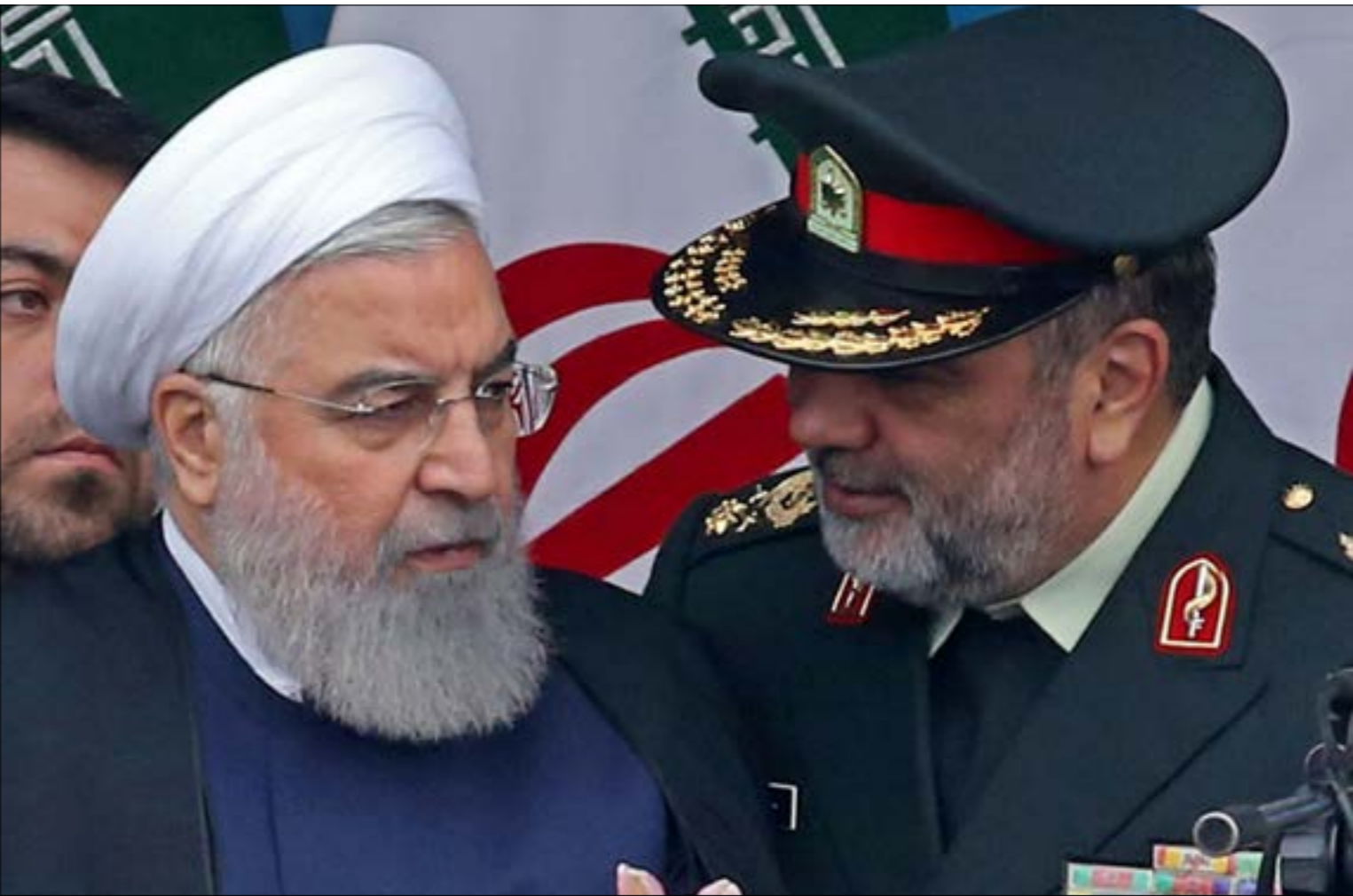
بداسليماني في موقفه في تناغم مع الحكومة الوسطية ورئيسهاوزير خارجيتها

المفاوضات بالمطلق، بل تثبيت معادلة اللاءات الثلاث التي لطالما تمسّكت بها طهران، لا إساءات، لا تفاوض تحت الضغط، لا تفاوض على أصل الحقوق السيادية. والطريق لتثبيت هذه المعادلة لآت ثلاث أخرى هي برنامج عمل المرحلة، لا «تصفيّر» لصادرات النفط، ولا تفاوض مع واشنطن الآن، ولا ذهاب نحو حرب بريدها مسفور داخل الإدارة الأميركية. تؤمن طهران بأن استراتيجيةجتها، يجد مسارها الإيجابي، ببأسائه ونخبه ومواظنيه، نفسه أمام أكثر الطرق المتضاعفان وسط الضغوط لا العس. في المواقف الإيرانية، تتوزع النوجهات إلى مسكرين اثنين. الأول لا يرغب في أي مفاوضات مع الغرب ولا يؤمن بجداولها، يمثّله فريق المحافظين بشكل رئيس. أما الثاني، الذي يمثّله تيار الوسط أو «الاعتدال» برعاية الرئيس حسن روحاني، وقريب منه موقف الإصلاحين، فيرى في التفاوض ضرورة لتثبيت حقوق إيران دولياً وحفظ مكانتها ومكتسباتها وتحديد الذرائع لاستهدافها. ما بات معروفاً أن الجمع في إيران اليوم، بفضل الهزيمة الخارجية، باتوا ينقاطعون عند موقف واحد مؤكّد: «لا تفاوض في هذه المرحلة» فريده الإدارة الأميركية من بوابة الضغط الاقتصادية لصياغة اتفاق نووي جديد يشمل الملف الصاروخي والدور الإقليمي. قاعدة نتتها قائد «قوة القدس» في الحرس الثوري اللواء قاسم سلیمانی، حين نته قبل يومين إلى أن الأميركيين «يحاولون جز إيران إلى طاولة المفاوضات عبر العقوبات الاقتصادية»، متحزراً أن التفاوض مع الولايات المتحدة في ظل الظروف الحالية يعّد بمثابة «استسلام». من يمكن عدّه رأس «المختشدين» ببعيون