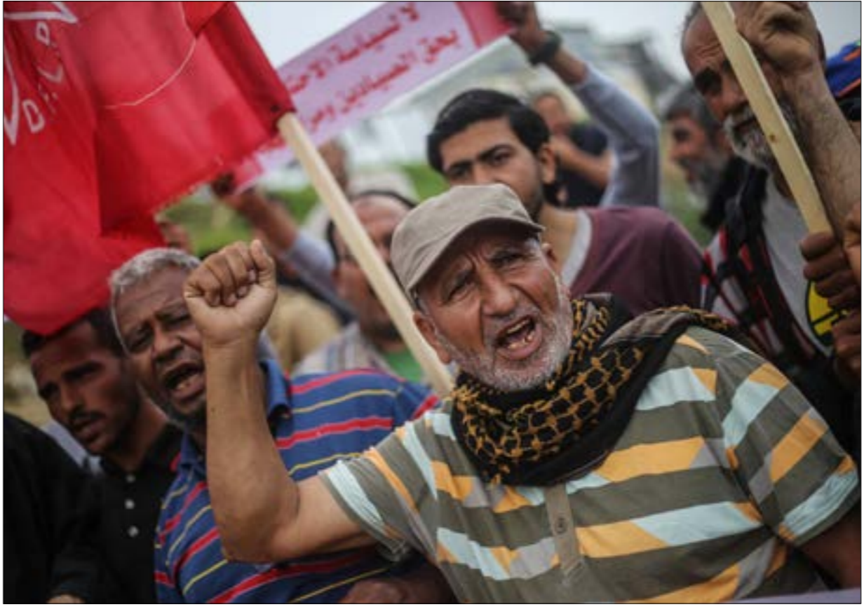
وقفه لصنادي غزة امسن، للمطالبة بوقف الانتهاكات الإسرائيلية بحقهم

بغض النظر عن أي تفاهات أبرمت أو سوف تبرم، ولن تكون أمام المقاومة أي خطوط حمراء»، وتنفيذ التفاهات، ومن المحتمل جداً أنه يحاول التوصل منها، فهو لم يتخذ بشكل جدي أيًا منها، مضافاً أن الحصار لا يزال مفروضاً على القطاع وهو بمغاية عدوان مستمر. وعلى رغم تخمينه الجهد المصرية في منع العدوان، إلا أنه أشار إلى أن الاحتلال لا يضع اعتباراً جدياً وحقيقياً