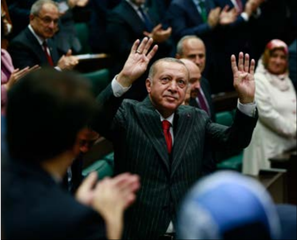
يصعد اردوغان لإيحاء «الشعوب» عن إمام اوغلو مقابل العودة إلى مباحثات السلام بين القرة والصمك الكردستاني، (الناقد)

في الوقت نفسه، صدر رؤساء بلديات المدن الساحية على طول شواطئ بحر إيجه والأبيض المتوسط (حيث فاز الأخير بالسياسي الجمهوري) «بيانات ناشدوا