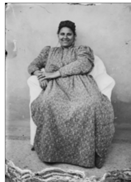
بورنير امرأة، سليم أبو عر الدين، مصر القرن العشرين، تصوير رقمي لبيانييف، علي زجاج، مجموعة هبة ابو عز الدين