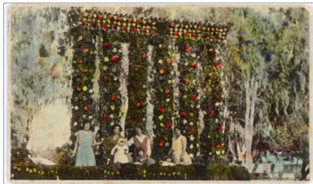
تركيب صوري، زحلة، لبنان، 1936، طيبة تظهر بالجلاليت