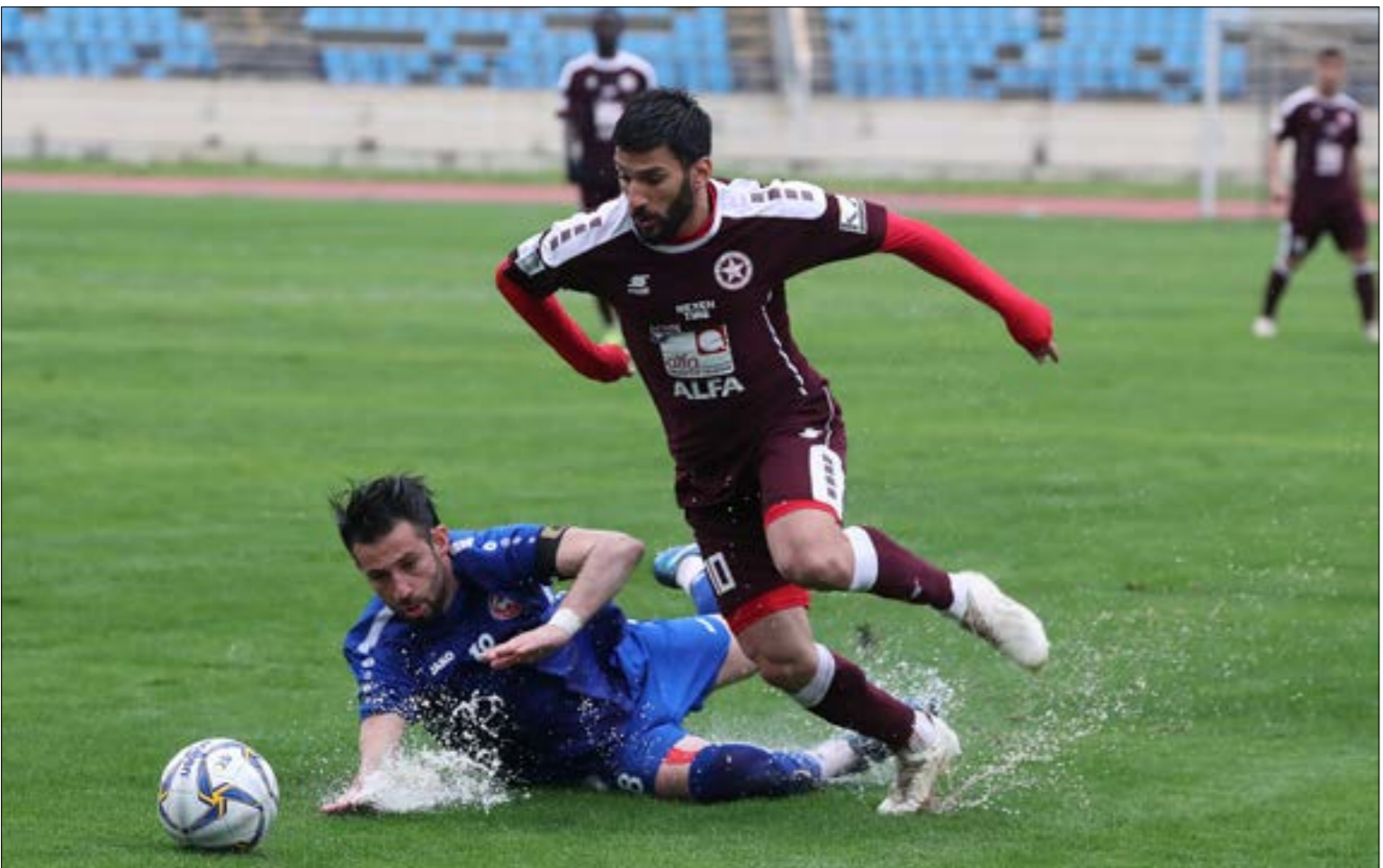
الجمعية العمومية للتصويت على قرار إلغاء الهبوط