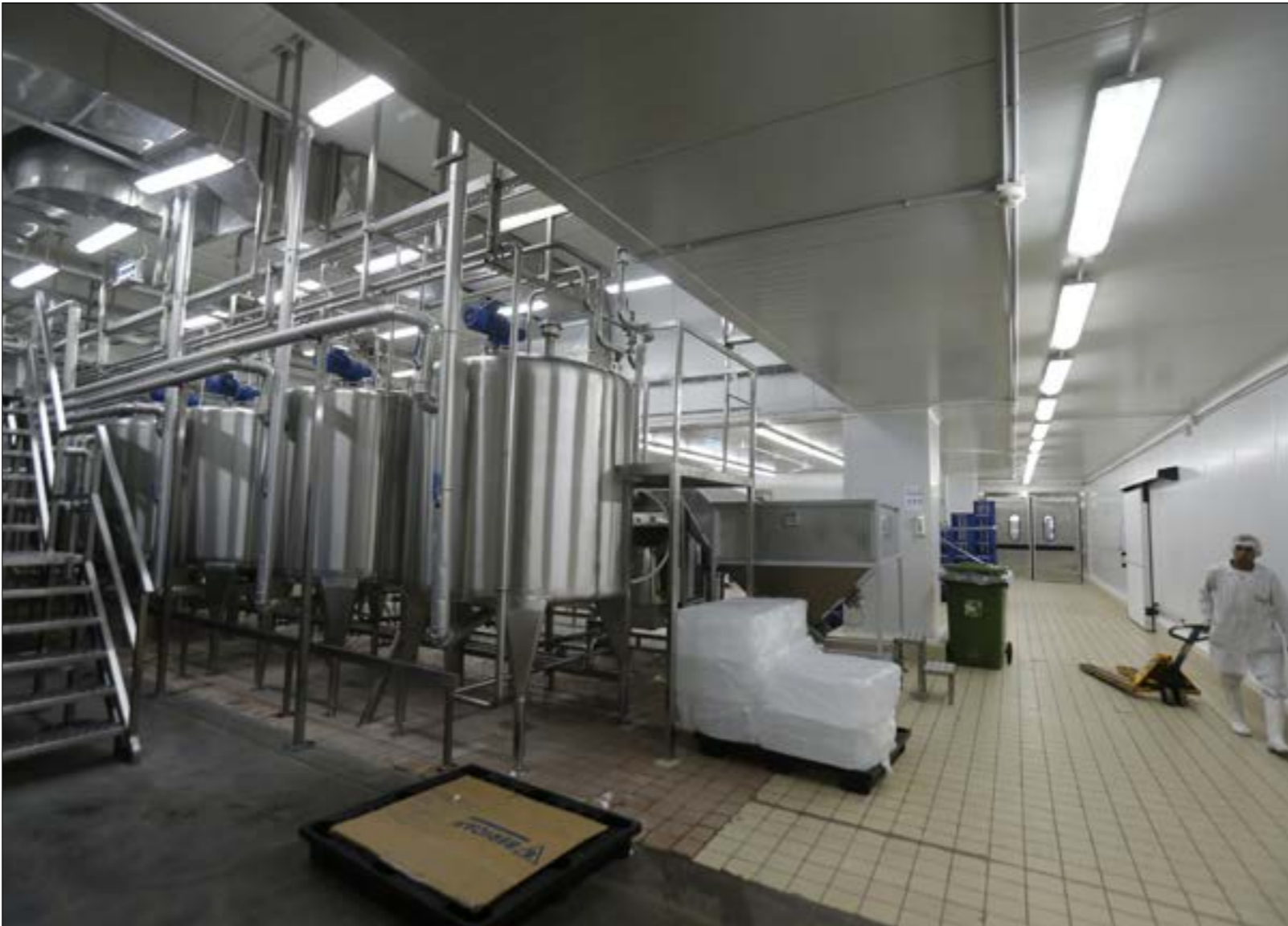
الصاميون مع رسم جمالي يعلو 10 في المئة على الاستيراد من الشرق الأقصى

بحسب دراسة أجرتها لجنة الإعلام والاتصالات، يتبين أن 2018 شهد