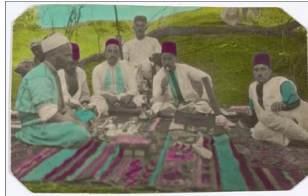
زهرة، المصرية، غير مؤرخة، طيبة تظهر بالجلاليت

تحتوي «المؤسسة العربية للصورة» 500 ألف وثيقة بصرية من صور، وفيديوهات، وثائق، وأقلام، وأغراض من استديوهات فوتوغرافية ووثائق أخرى جغرافياً، تجاوزت المجموعة حدود لبنان، لتشمل المنطقة العربية، وشمال أفريقيا وبلدان الشتات العربي منذ ستينيات القرن الثامن عشر إلى اليوم. مع ذلك، لا يمكن فصل هذه التجربة عن مرحلة ما بعد الحرب، إذ إنها لم تنصر النور ربما إلا بفضل أسئلة تلك المرحلة، ضمن التوجه للمخالفين والباحثين نحو الذاكرة، ذاكرة الحرب تحديداً. لعل الصورة الفوتوغرافية كانت المجال الأمثل للعودة إلى التاريخ وفهمه، بصفتها وثيقة منه، إلى جانب قدرتها على تولد المعلومات والمعاني إلى ما لا نهاية مع مرور الزمن. أدى الأرشيف البصري والكتابة، بما يحويه من أحداث تاريخية بين الواقع والمختل دوراً أساسياً في هذه التجارب الفنية، التي أقامت قطيعتها مع تجارب الماضي لتعود إليه بطريقة. المؤسسة كانت واحدة