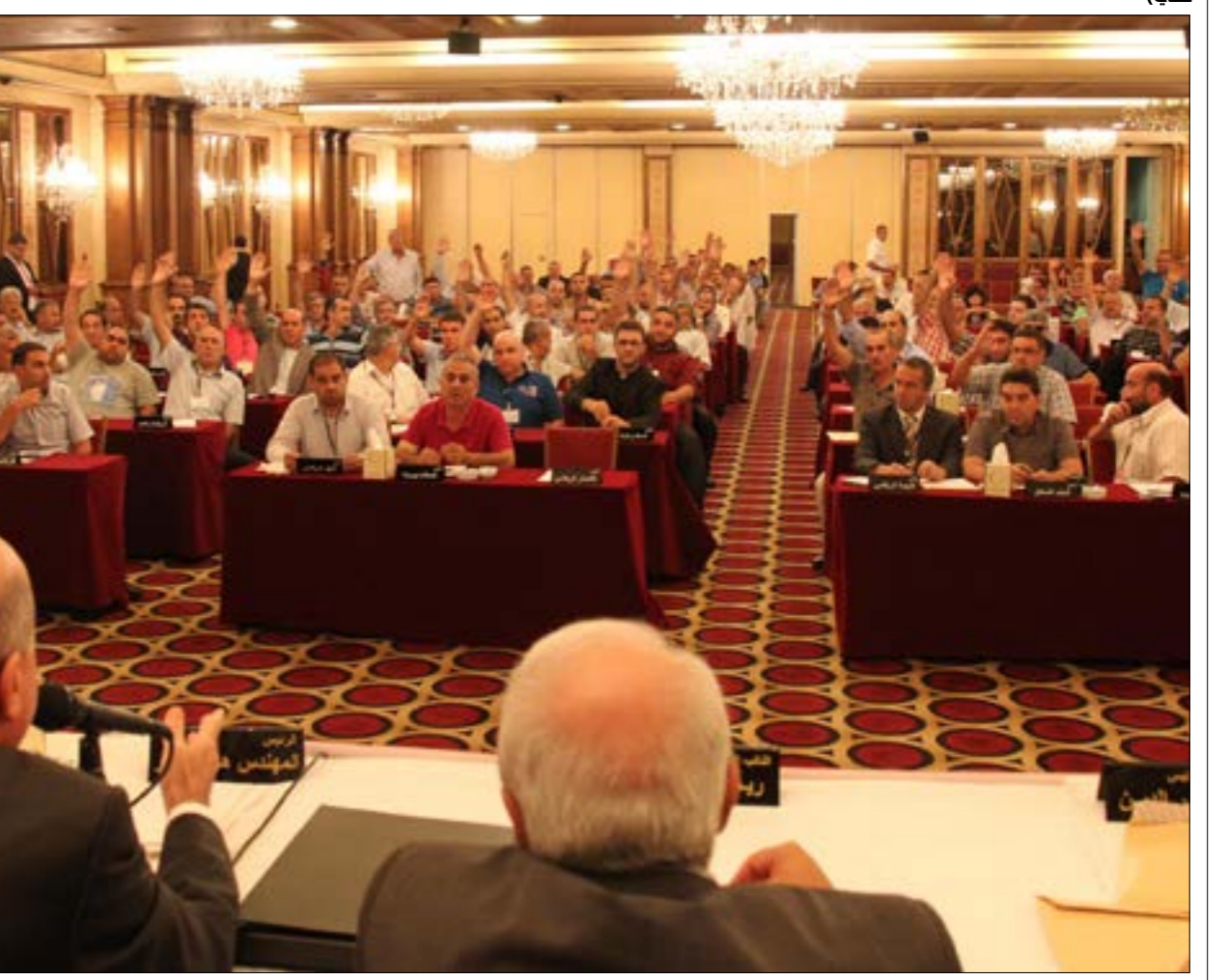
الجمعية العمومية للتصويت على قرار إلغاء الهبوط (عدنان الحاج علي)

الاتحاد الدولي. كما أن الكتاب تضمن الرئيس الموسوي لم يكن على علم بالكتاب المرسل. «الشياب في النادي هم من أرسلوه، لعلهم يشكل جرس إنذار لإيقاظ الأشخاص النائمين في الاتحاد»، يقول له «الأخبار».