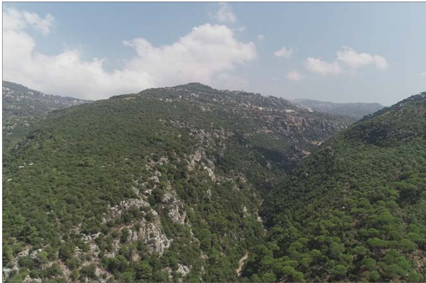
رئيس البلدية، حرش المتين لا يخضع للحاكم قانون حماية الغابات (الخار)