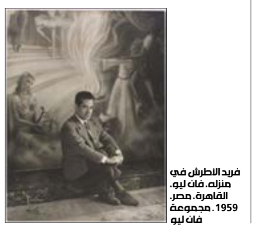
فريد الأطرش في منزله، فائق لوب، القاهرة، مصر، 1959، مجموعة فائق لوب