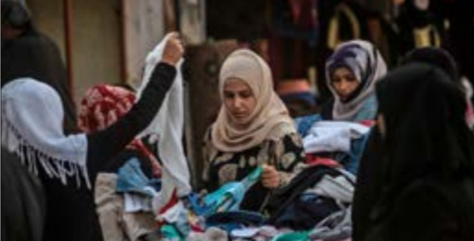
معظم الألبسة التي تباعها محال «البالة» تأتي من معامل في دول شرق آسيا

أصبحت تضمّ محال «بالة» أكثر من تلك التي تباع لمبوسات جديدة، وشامية والضحكة على وجهها: «شي بيشتي»، وتخرّج سوسن الموبدلات وأرخص الأسعار... اليوم، نقلت السوق كلّ ولا نجد قطعة مثل الخلق والعالم، والأسعار نار».