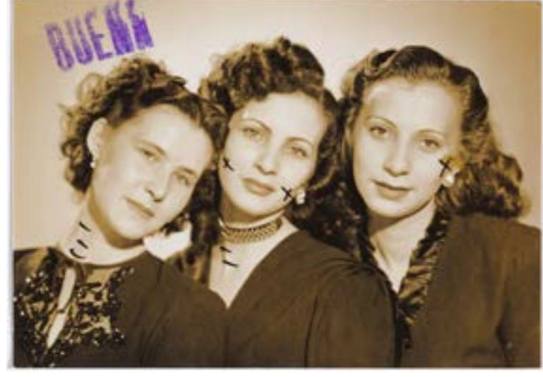
صورة دعائية تظهر تعديلات الرضا للصورة، الفرجو بريك، الكسكس، مؤرخة مجموعة الفرجو بريك