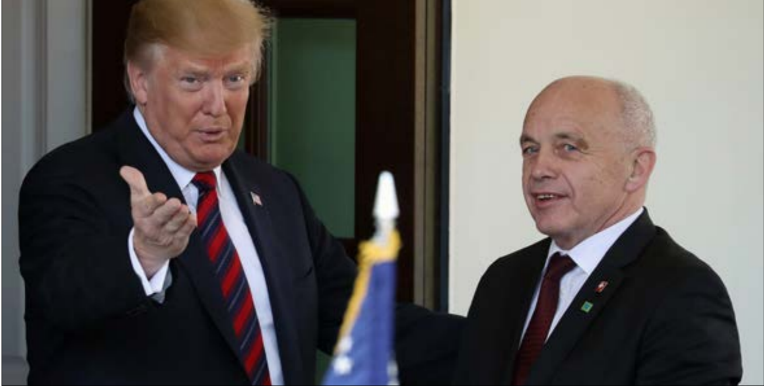
ملك ترامب نحو المناطخ الدبلوماسية تجلّى في لقائه الرئيس السويدي

على زوارق تقليدية خشبية في مياه الخليج كانت من بين التهديدات التي استندت إليها إدارة ترامب لتجريب الانتشار