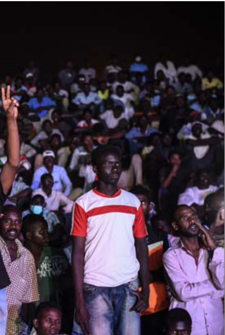
أكدت «قوى التغيير، استمرار الاعتصام امام القيادة العامة وفي الميادين كافة