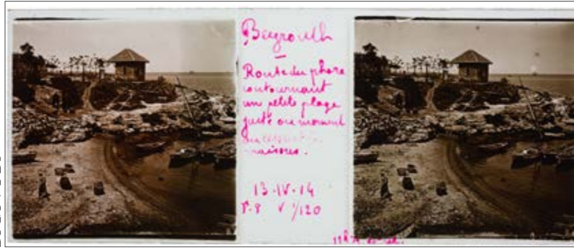
طريف العنارة، اوجيت كوتار، بيروت، لبنان، 1914، صورة مجسدة زجاجية