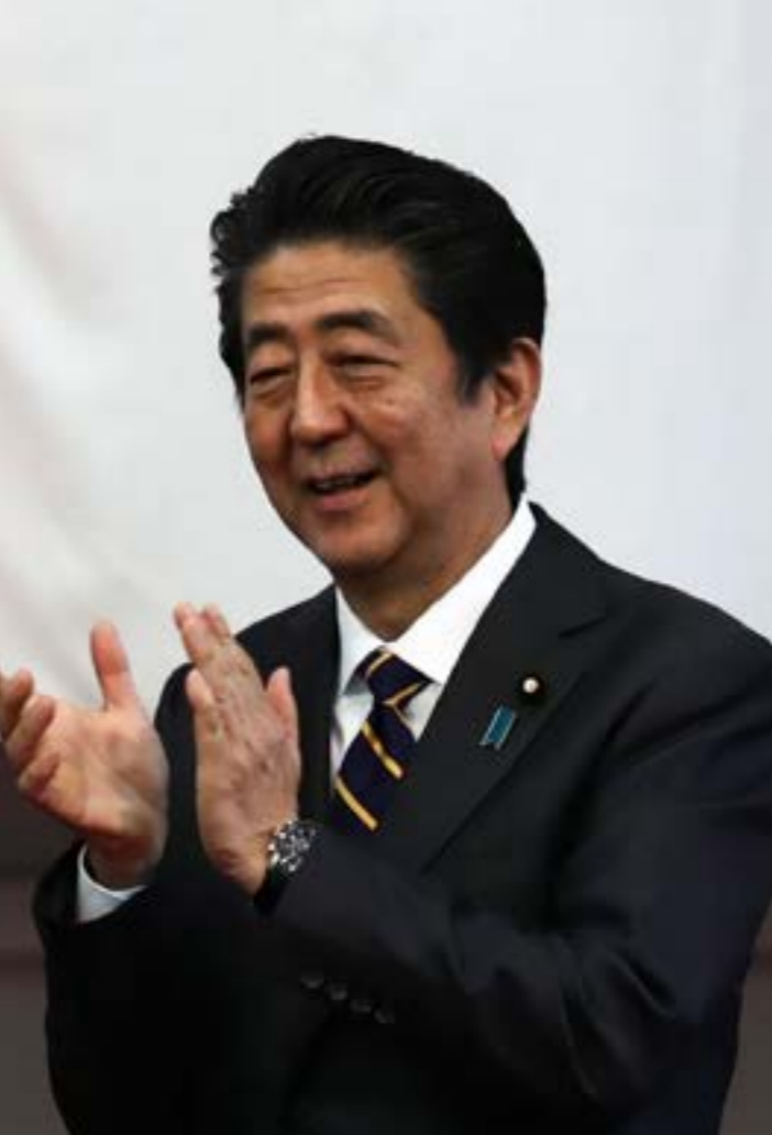
صوء ترابه الاخر لزيارة ابي ياتي بهدف تكثيف الضغط السياسي الهزازي للعقوبات

أثارت زيارة سياح إسرائيليين جدلاً واسعاً في تونس، فضيها كانت ياتي هؤلاء في الاعوام الماضية للمشاركة في تجمع سنوي بكينيس «الغربية»، وسط تكتم على هويتائهم، شملت جولاتهم هذا العام مناطق أخرى، في ظلّ تغطية إعلامية من القناة ال12 الإسرائيلية التي وافقت وقدأ زار معيد «الغربية» في جزيرة جربة الواقعة جنوب البلاد، وتحوّل في ضاحية سيدي بوسعيد بالعاصمة، حيث توقف بقرب المنزل الذي اغتيل فيه القيادي الفلسطيني خليل الوزير (أبو جهاد)