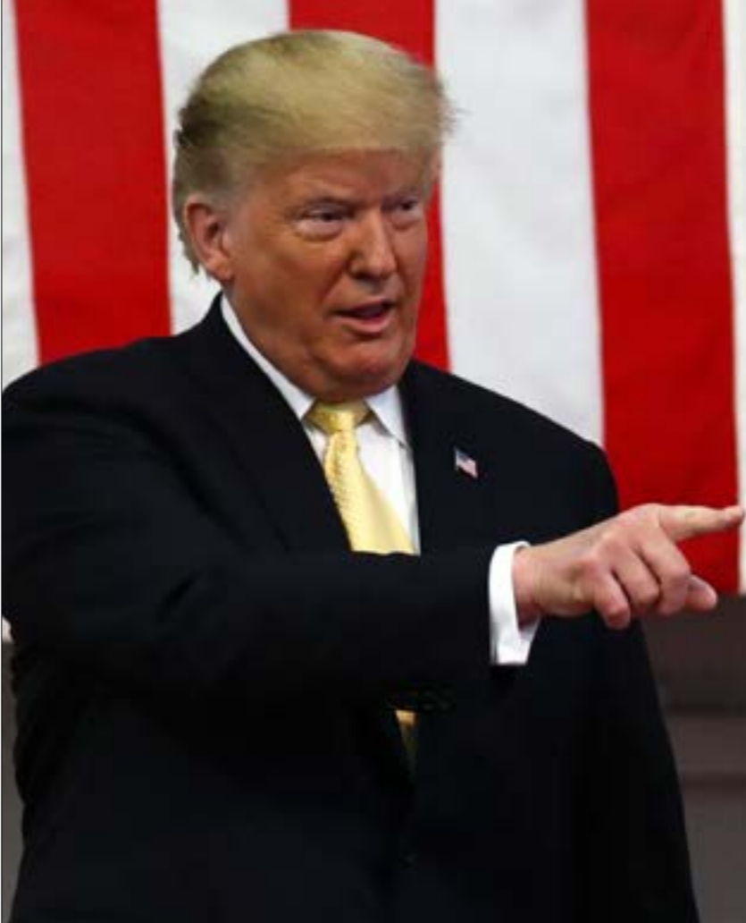
صوء ترابه الاخر لزيارة ابي ياتي بهدف تكثيف الضغط السياسي الهزازي للعقوبات

من الواضح أنّ الطرابلسي له علاقات جيدة بدوائر إسرائيلية، سمحت له سابقاً بتنظيم رحلات نحو تونس، ورغم أنه لا يقر بوجود هذا النوع من التواصل، فإنه تحدث سابقاً بلسان الخبير عن الظروف التي يعيش فيها الإسرائيليون من أصل تونسيّ. فضلاً عن ذلك، سبق له إجراء مداخلة منقولة مع قناة «إي 24» المتحدثة بالفرنسية المتعاقبة فرصة لتسويق صورة «التواضع»، وكذلك بوابة لتحشد دعم جماعات الضغط الصهيونية في الغرب. ومنذ تعيين الرجل العام الماضي، صارت تصدر تصريحات إيجابية حول تونس من وسائل إعلام وساسية في إسرائيل، كما أوقفت الأخيرة تحذيراتها السابقة لمواطنيها من زيارة تونس.