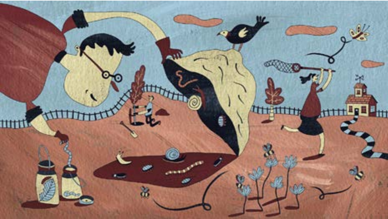
(فيليب الاستريشات - كوربيس)