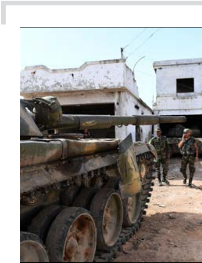
تمكّن الجيش من إسقاط طائرة مسيرة كانت تحاول استهداف قواته في محيط تل ملح (أ ف ب)

ذكرت «القناة الـ13» العبرية، أمس، أن إسرائيل بلورت خطة جديدة لإخراج القوات الإيرانية من سوريا، يستعد على عرضها على الجانب الروسي في القمة الأمنية التي ستعقد نهاية الشهر الحالي في تل أبيب، بين مستشاري الأمن القومي لكلّ من إسرائيل والولايات المتحدة وروسيا. لكن لا يبدو، إلى الآن، أن الخطة الجديدة تحمل جديداً، أو في حدّ أدنى تغييراً ملحوظاً قياساً بـ«العروض الإسرائيلية» الأميركية التي تمت بلورتها في الماضي، ورفضها الجانب الروسي، أو تعدّر عليه تنفيذها. وفي هذا الإطار، أشار تقرير القناة العبرية إلى أن ثمة تشككاً في تل أبيب، في أن الخطة الإسرائيلية الجديدة، التي لم تُعلن تفاصيلها بعد، ستلقى قبولاً روسياً.