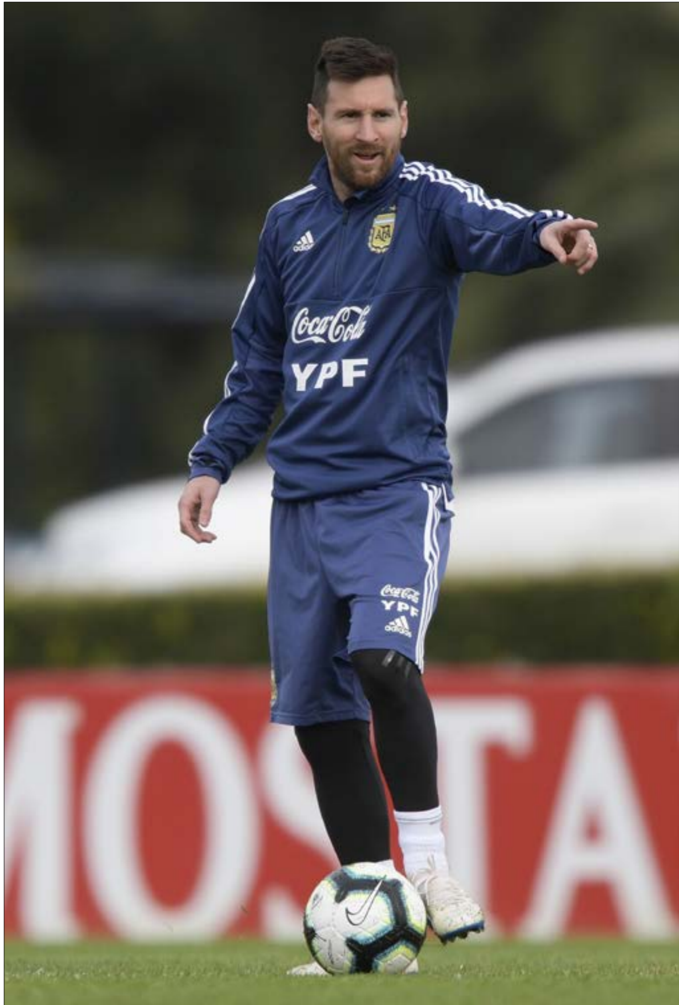
تشكك هذه البطولة فرصه ليمسي (خوان مارينولانا ـ افراء)

يقال «كل زمن رجاله». بالنسبة إلى مشجّع ارجنتيني، حضر في ملعب أزينكا المكسيكي في 22 حزيران 1986، برفقة أكثر من 100 ألف مشجّع اخر. وشاهد لاعبا يمرّ عن مدافع ويُسقط آخر لئسجّل هدفين في مرعى المنتخب الإنكليزي ويقود الأرجنتين إلى نصف نهائي كأس العالم، قبل أن يسجّل هدفين آخرين في مرعى بلجيكا، ثم يرفع من بعدها الكأس الذهبية أمام أنظار الفرنسيين، لم يريدها الأرجنتينيون أن تخرج من هذه البلاد أكثر ممّا أن تذهب إلى بلادهم، وهذه المهجة أوكلت إلى ليونيل ميسي، الساعي بدوره ليكون