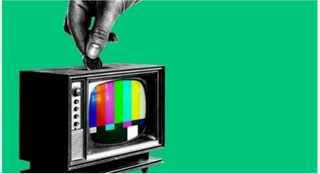
(للازوار غامبو - Axios)