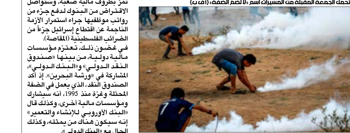
تحمّل الجمعة المقبلة من المسيرات اسم «لا لضرّ الضفّة» (ف ب)

تقريب موعدها، نقلت مصادر إعلامية عبرية نية كل من مصر والأردن والمغرب وحتى قطر المشاركة، بعدما كانت الإمارات ثم السعودية قد أعلنتا اعتقالهم.