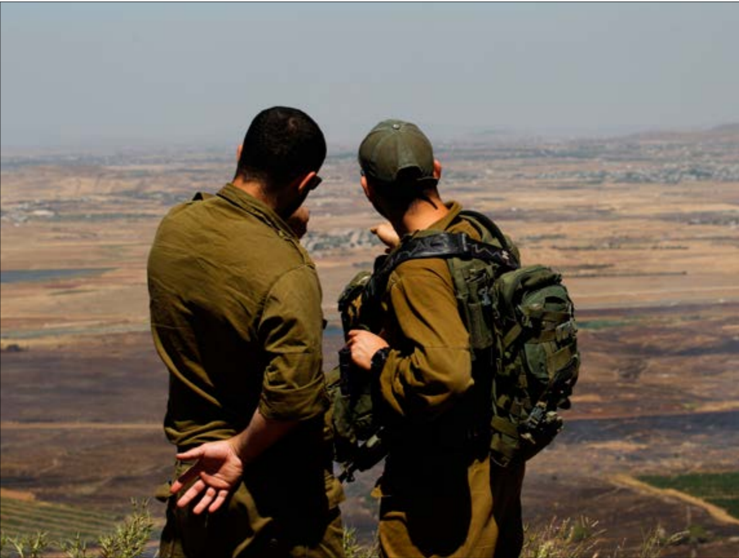
تُرَكِّز «تسريات» المؤسسة العسكرية الإسرائيلية على أن القمة دليل على المكانة الإسرائيلية لدى روسيا

على إمكانية عقد صفقة موضعية وثيق وتدهور علاقات البلدان الثلاثة مع الولايات المتحدة، بل قد يكون للجم تطويرها لقدرات محور المقاومة