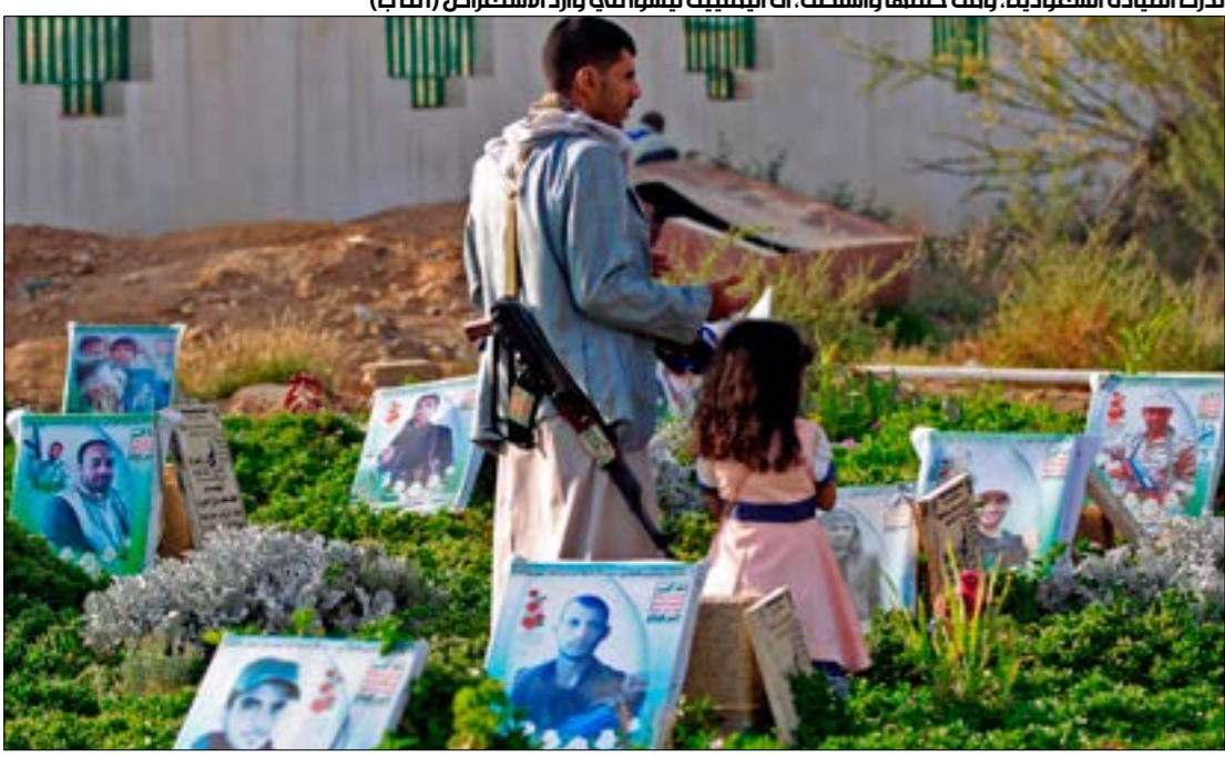
تدرك القيادة السعودية، ومث خلفها والسنط، أن العنيت ليسوا في وارد الاستعراض

لا يبدو حديث المسؤولين اليمنيين عن إن إغلاق مطارات دول العدوان أو إصابتها بشلل تام «هو أقرب الطرق لفك الحصار عن مطار صنعاء» وبقية المطارات والموانئ اليمنية، مجرد كلام في الهواء، وإن كان من المبكر الجزم بوجود ارتباط بينه وبين الهجمات المستتقة والمركزة على مطارات جنوب المملكة (نجران وجيزان).