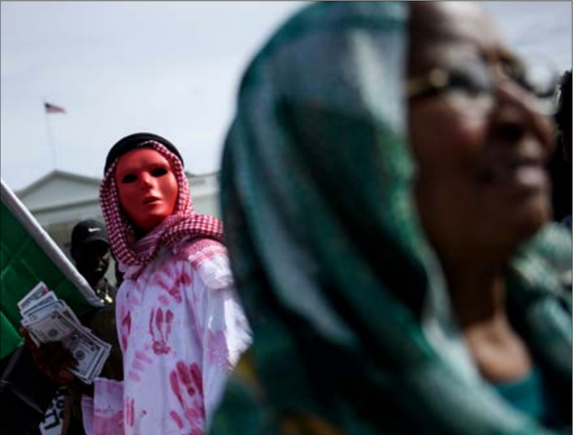
يعتمد «المسكري» على وصاية من محور السعودية في «الثورة المضادة» (ف ب)

أما عن الشروط المتبقية، فالتحقّ «العسكري» على أحدها وهو إطلاق سراح المعتقلين السياسيين، بترجيل قادة «الحركة الشعبية لتحرير السودان - قطاع شمال» التي تنضوي في تحالف «الحرية والتغيير»، إلى جوبا. ما سبق يشي بأن «الحرية والتغيير» أن تجرّه على أي تنازل، في حين يلوح المسكر بإجراء انتخابات قريباً. وقد ذهبت قوى الحراك بالفعل لفتح أوراقها لاستكمال المفاوضات، بوصول مكوناتها إلى توافق كبير حول مرشحها لـ«مجلس السيادة»