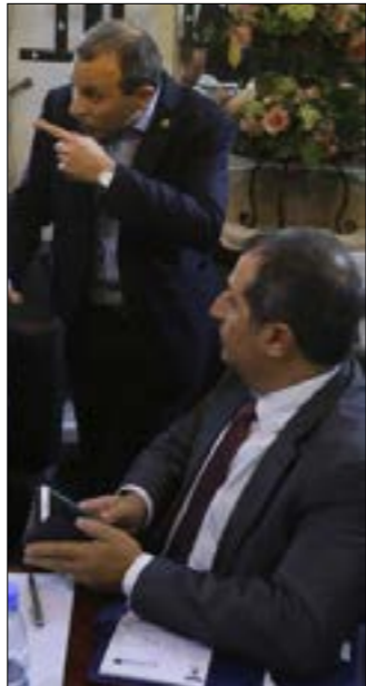
باسيك، ملتصق كل الموازنة إذا كان الأمر كذلك