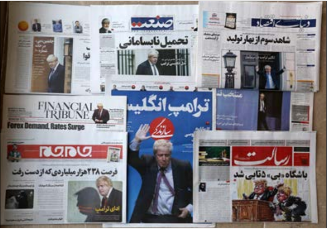
اهتمت الصحف الإيرانية بوصول جونسون إلى الحكم في ظلّ الأزمة بين البلدين

باعتبارها الخيار الوحيد المتاح في مواجهة صمود إيران وتصميمها. إذ رأى أن «الأمر الثلاثة التي علينا القيام بها في مواجهة العدوانية الإيرانية، هي الضغط، ثم الضغط، ثم الضغط. دعوة تشي بان