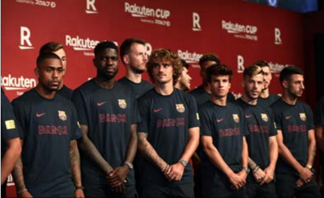
انصف برشلونه المليئ عى التعاطف

أعلن نادي برشلونه بطل الدوري الإسباني لكرة القدم، أن عائداته السنوية لموسم (2018 - 2019) بلغت 990 مليون يورو، وهو رقم قياسي في تاريخ النادي الكاتالوني الساعي