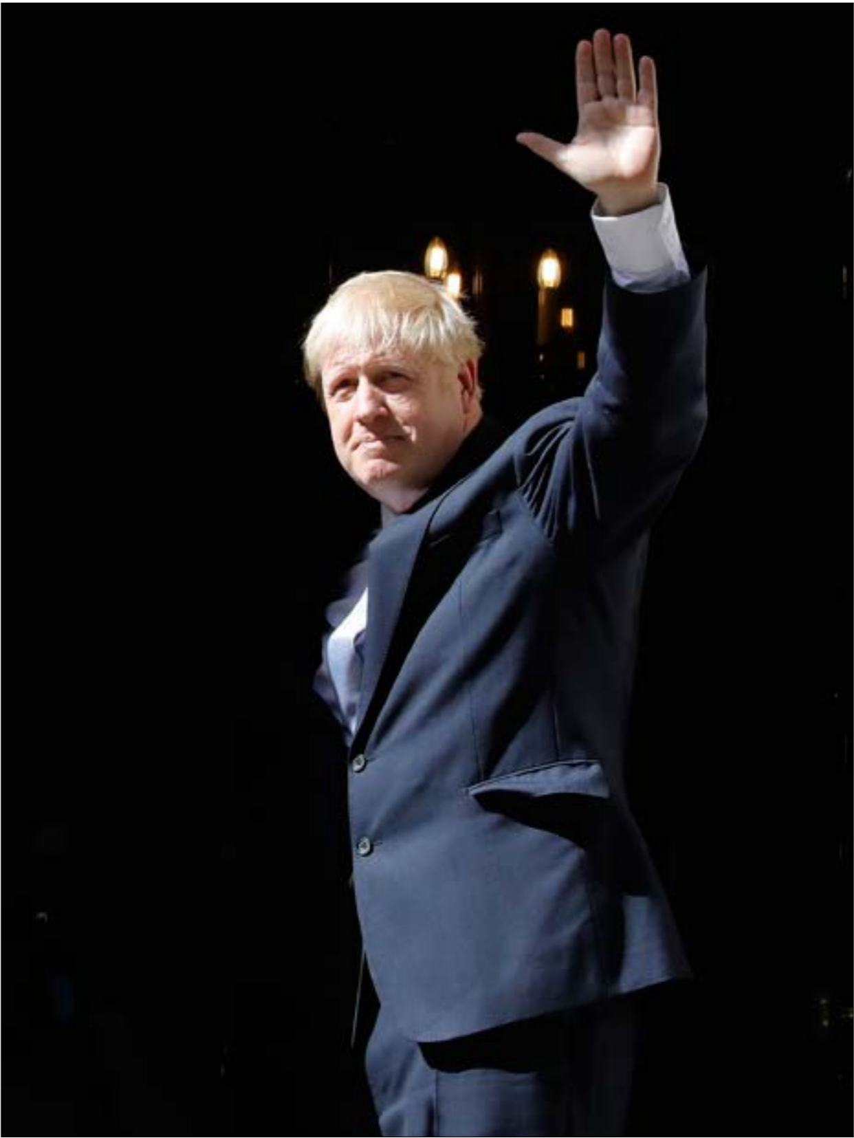
قد بلحا جونسون إلى الشيك اقتصاديا هم الولايات المتحدة لتعويض غياب الشركاء الأوروبيين (ف ب)

الكبيرين: «المحافظين» الحاكم (يمين الوسط) و«العمال» (يسار الوسط)، من معارضي مشروع خروج بريطانيا من الاتحاد الأوروبي، وهلع اليمين من إمكانية تولي جيريمي كوربن المنصب التنفيذي الأرفع في البلاد، كما اندمام ثقة البرلمان بنفسه لتولي القيادة، تسببت جميعها في تقويت فرصة تاريخية أخيرة لوقف التدرج البريطاني المحتمّ نحو كارثة سياسية واقتصادية، وربما عسكرية، نتيجة تسلّم جونسون مفاتيح «10 داونينغ ستريت»، لا إرّ ذلك غير ماسوف لرئاسة الوزراء. وقد اختارت الملكة العجوز (93 عاماً)، بدورها، الاكتفاء بتنفيذ نصائح مستشاريها، وتكليف جونسون بتأليف الوزارة، على رغم أن شرعية تخيله لا تتجاوز ربع النقطة المئوية الواحدة، وأن الانقسام الذي يعصف بالبلاد حول مسألة «بريكست» لا يزال متصاعداً، مع أنه كان بإمكانها دستورياً لعب دور المرجعية الوطنية الجامعة، على الأقلّ من خلال اشتراط حصول جونسون على ثقة البرلمان قبل تكليفه، لكنها بحكم العمر المديد والمناخ المحيط بها استكتفت، والتزمت بالإجراءات الدستورية للبرلمان. على الرغم من ذلك، فإن ثورات ظهرت مبكراً بين قيادات «المحافظين» حول تقاسم المناصب، لا سيما مع جيريمي هانت، وزير الخارجية الحالي، الذي يتعمّد بمنصبه، رافضاً منصب وزير الدفاع الذي عُرض عليه، وايضاً فليب هاموند، وزير الخزانة، الذي استقال لرفضه الخدمة مع جونسون، كما عدّه وزراء ثانويين آخرين في الحكومة من الذين أدركوا أن ساعاتهم باتت محدودة في مناصبهم، وفضلوا الاستقالة على دلّ الصرف العلمي. جاء ذلك في الوقت الذي تكدت فيه عودة براتي باتل (التي أقبلت من منصب وزارتي سابقا بسبب فضيحة دعمها لإسرائيل من دون الرجوع إلى الحكومة، علماً بأنها كانت من منتظري تعاون الكيان الصهيوني