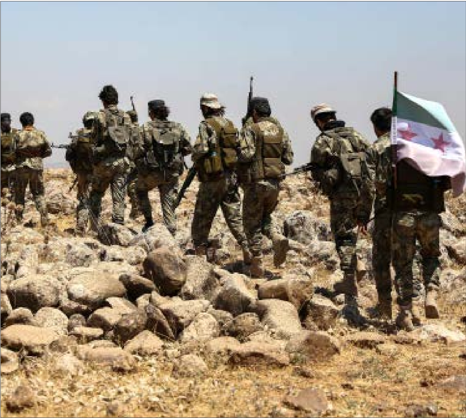
تدفع خطوات واشنطن المتسامرة شرقاً الفرات انقرة إلى استخدام ورقة التهديد بالتصعيد العسكري

لكن في الواقع، وبحسب روايات السوريين تواصلت معهم «الأخبار»، منهم صحافيون وتجار ورجال أعمال وطلاب، فإن قرار الحكومة التركية المفاجئ حسّس ملف