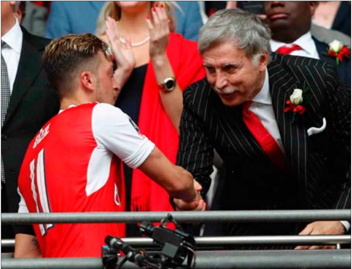
خسر آرسنال معظم نجومه