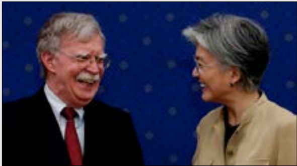
تزازمت زيارة جوت بولتون للبيانات وكوريا الجنوبية مع تزايد التوتر في منطقة شرق آسيا