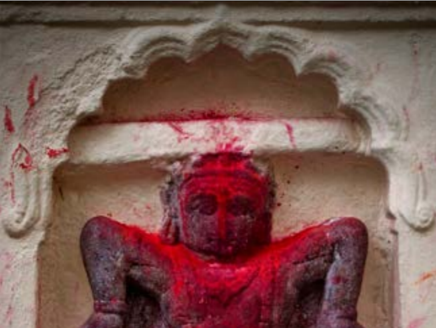
كخطابا الة الرضة صي الهيماليا