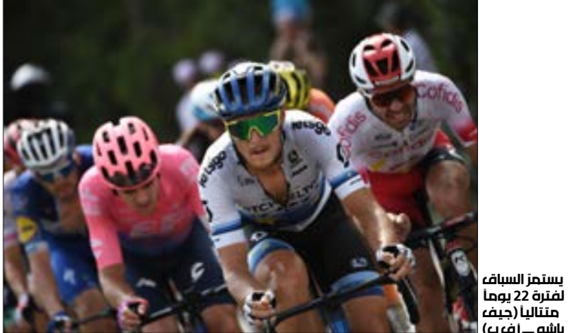
يستمر السباق لفترة 22 يوماً متتالياً

إيامٌ قليلة ويُسد الستار على طواف الدراجات الأشهر في العالم «Tour de France» بنسخته السادسة بعد المئة. الطواف الذي يعدّ الأبرز سنوياً في رومانه سباقات الدراجات الهوائية، يتخطّه كونه ضماية رياضية ينتظرها ملايين المتفرجين حول العالم. يشتهر السباق الأقدم في العالم كونه حدثاً سياحياً وتجارياً يقدّم للمتابعين والزائرين جولة تمتد على مسافة 3460 كيلومتراً، تضم أجمل المعالم الطبيعية والتاريخية المبهرة في فرنسا