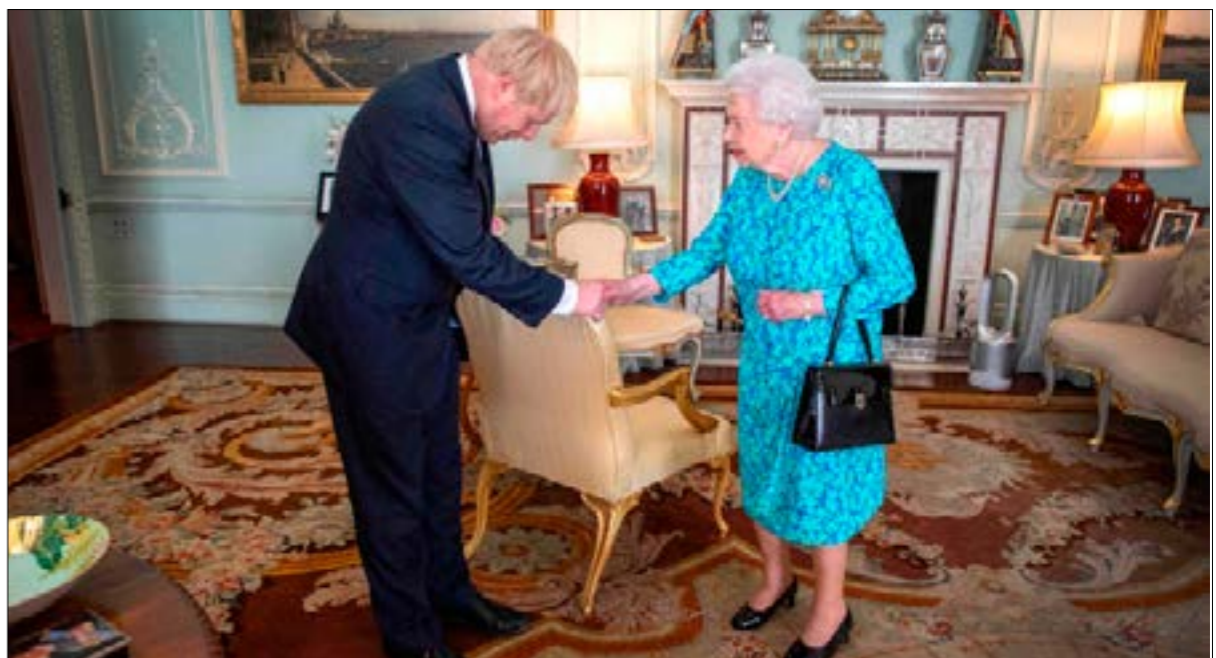
اختارت الملكة المجرز الاكتفاء بتنفيذ تعاهد مستشاريها، وتكليف جونسون بتأليف الوزارة

لنَدّت – سعيد محمد – كُلفت ملكة بريطانيا، إليزابيث الثانية، رئيس حزب «المحافظين» الجديد، بوريس جونسون، بتأليف حكومة بريطانية جديدة، بعدما تقدّمت إليها تيريزا ماي باستقالة بروتوكولية. الرئيسة المغادرة لم تقوّت، في آخر ظهور لها أمام البرلمان وقبل توجيهها إلى قصر بكنغهام، فرصة شنّ هجوم شديد على زعيم المعارضة اليساري جيريمي كوربن، الذي دعت إلى الاقتداء بها والاستقالة من منصبه، لتسحب إثر ذلك غير ماسوف عليها من أحد تقريباً، إلى مقرّ إقامتها في دائرتها الانتخابية (مادياتهيد شمال غرب لندن). في تلك الأثناء، كان جونسون قد شرع بالفعل في تأليف حكومته، حتى قبل مشوّه أمام الملكة مساء أمس وقبوله التكليف الملكي. وعلى رغم انتشائه الظاهر بتحقيق حلم شخصي راوده طويلاً، وخطابه الحماسي أمام بوابة مقرّ رئاسة الوزراء حيث نثر أحلاماً ووعدواً وريدياً، فإن جونسون ربح معظم نهار أمس تحت كابوس أن يتحكّم مجلس العموم في يومه الأخير من دورة انعقاده العادية الحالية – قبل الإجازة الصيفية التي تنتهي نظرياً في الثاني من ايلول/ سبتمبر المقبل –، ويصوّت على طرح الثقة بجونسون فور تكليفه، لكن الشكوك المزمّنة المتبادلة بين نواب الحزبين