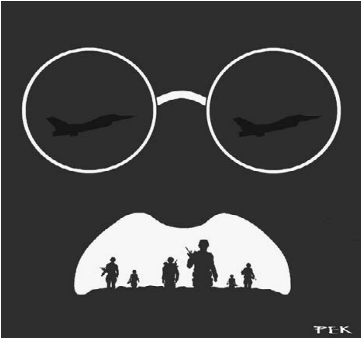
«حمل جون بولتون، (بيت كرينر)

أيضا، تشير وكالة «ستراتفور» في تقرير لها إلى أنه «إذا اختار ترامب التوغّل في إيران، فمن المحتمل أن يحتاج إلى حوالي 1.6 مليون جندي للسيطرة على العاصمة، والبلد، وهي قوة كبيرة جدا تفوق قدرة أميركا على توريضها في قواعدها الإقليمية». وفي السياق نفسه، لفتت صحيفة «واشنطن بوست» في آيار الماضي، إلى أن أميركا تفكر لخيار واقعي على الأرض في إيران، فهي أكبر بكثير من العراق (يبلغ عدد سكان إيران 83 مليوناً، وتقدّر مساحتها بحوالي 617.000 ميل مربع، في حين كان عدد سكان العراق في عام 2003 ما يقرب من 30 مليون نسمة، ومساحتها حوالي 170.000 ميل مربع)، تضيف الصحيفة «استنادا إلى معادلة «ثأفة القوة» التي خلص إليها المحلل في مؤسسة «راند» جايمس كوينليغان ونشرها خلال الفترة التي سبقت غزو العراق، كان النجاح في معالحة الاستقرار بالعراق، يتطلب 20 جنديا لكل 1000 نسمة، وبالتالي فإن الولايات المتحدة وحلفاءها يحتاجوا آنذاك فعليا، إلى حوالي 600000 جندي في العراق، بينما لم يكن هناك أكثر من 180 ألفا». وإذا أردنا تطبيق هذه المعادلة على إيران بحسب الصحيفة، فالسيطرة عليها ستحتاج إلى أكثر من 1,6 مليون جندي. وهذا أكثر من ضعف القوة الفعلية للخدمة