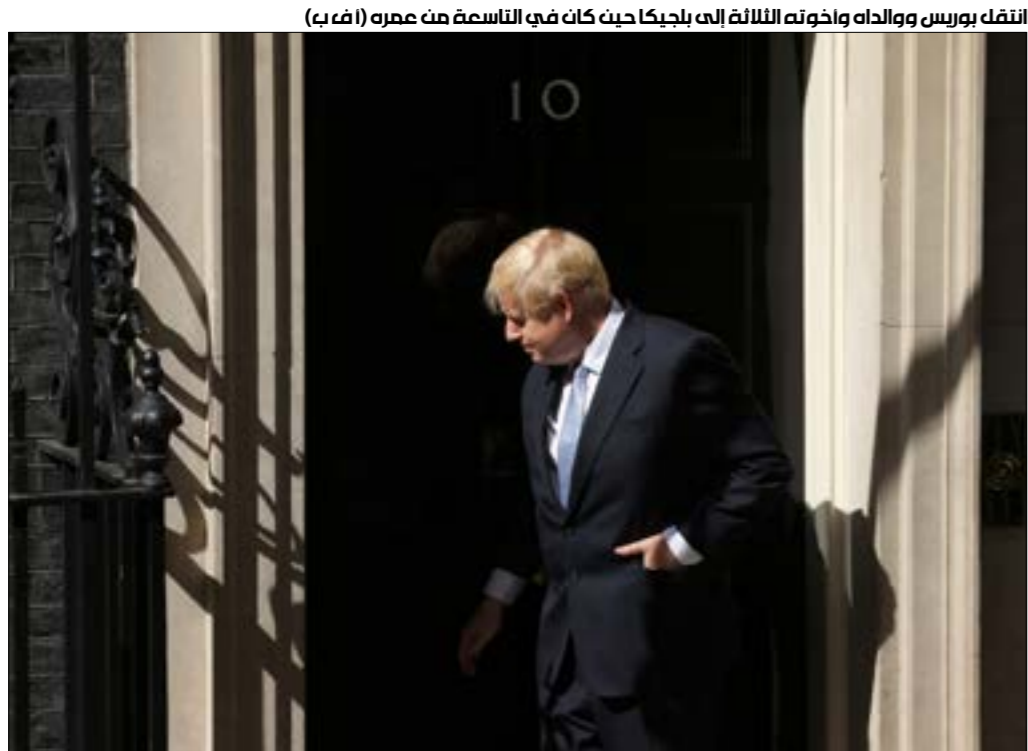
انتقل بوريس ووالده وأخوته الثلاثة إلى بلجيكا حيث كان في التاسعة من عمره (ا ف ب)

يتناولان المشروبات وعندما وصلت سيارة أجرة تقلّ بوريس.. لم تكن نتوّج أيّ شخص آخر... لن أنسى ذلك اليوم أبداً»، وفق ما تنقل سونيا بورنيل عن ميد، في سيرتها الثانية لجونسون: «بوريس: قصة الطموح الأشقر» (2011)، التي تروي سيرة الرجل الذي أصبح رئيساً للوزراء في بريطانيا. عملت بورنيل نائبة لجونسون في مكتب «تلغراف» في بروكسل، وصورتها للسياسي، كمراسل شاب، خلقت لديها «انطباعاً لا تُحسى». في بداية مسيرته المهنية، أُقيل بوريس من صحيفة «التايمز» بعد اتهامه بعدم الدقة في نقل التصريحات، فهو كان يفتقر إلى «مهارات إعداد التقارير». ولكن شخصيته «الكاريكاتورية» لطالما كانت محلّ جدل وانتباه. في مجموعته الصحافية «أقرضني أذنك» (2003)، مثلاً، يصف جونسون نهج السوق الحرة، بالآتي: «سيكون هناك دائماً شخص ما على استعداد للتغلب على الحكمة التقليدية، وسيكون جاهزاً للشراء عندما تكون السوق راكدة». أدرك جونسون أن التقارير البريطانية التقليدية في شأن إجراءات «السوق الأوروبية المشتركة» (أعيدت تسميتها «الاتحاد الأوروبي» في عام 1993) كانت تبغيبية وممّلة، لذا، قرّر الذهاب في الاتجاه الآخر. في مقالة لمحلة «نيويوركر»، يرى سام نايت صعوبة في عدم ملاحظة الدافع النفسي وراء هجوم جونسون العنيف على الاتحاد الأوروبي، يقول إخوته: «كانت بروكسل مكاناً