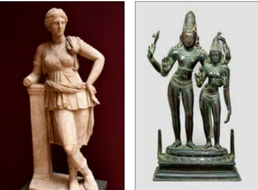
الأمّة شيغا تحضنت فرينها المة الصبد الإفريقية أرتيميس

وينتقد الكاتب التضليل في إعلانات الفوط الصحية المصنعة وسردها المعاصر الذي يفضي إلى أن استخدام المتاديل الصحية المتاحة تجارياً هو معيار حصري تقريباً لتحديد حالة صحة الطمث والنظافة في الهند. هنا يشير إلى فعالية وصحة المواد الماصة الأخرى مثل الأقمشة القطننية عند غسلها وتحفيظها بشكل الشمس بشكل صحيح، ولأنها قابلة لإعادة الأستخدام فإنها صديقة للبيئة كذلك. علماً أنّ فتيات المناطق الريفية ونساءهن يفضلن استخدام الأقمشة التي هن أكثر دراية بها. يستعين الكاتب بدراسات متخصصة في مجال صحة المرأة تتفق على