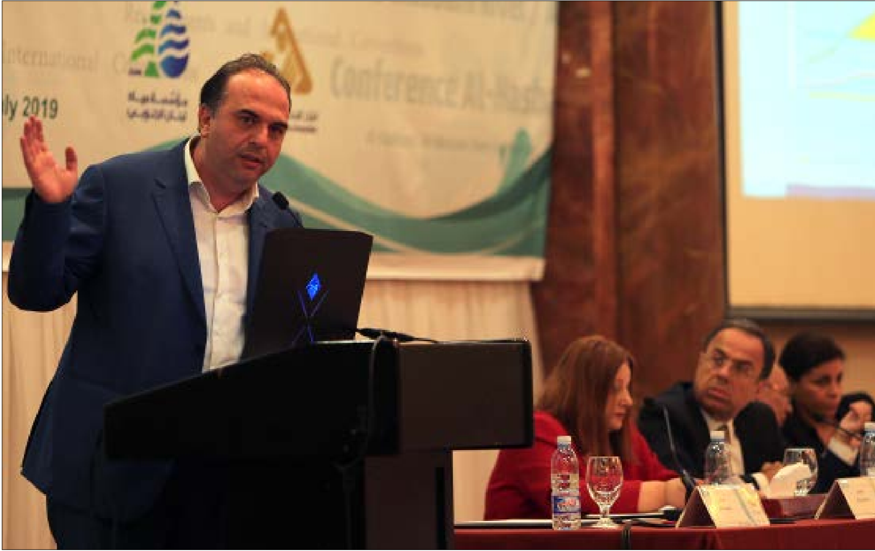
خامر: استنار حفرة لبنان تحت النهريين يحتاج إلى قاعدة مبنية لتؤمّن دعماً سياسياً من جميع الفرقاء (هيلم الموسوي)

الوزاني، الحاجات والحقوق في ضوء متطلبات التنمية والاتفاقيات الدولية» أطلقت بالتعاون مع المركز الاستشاري للدراسات والتوثيق، معركة انتزاع حق لبنان بالمياه الاولى: الأحواض المائية الجوفية والسطحية في جنوب لبنان، امس، في مؤتمر «نهر الحاصباني -