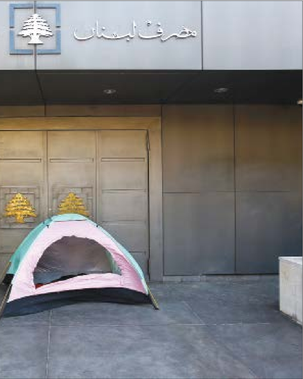
تمّ رسيها، جانب أي مصرف، أو يربط صاحبه إذا طبّف العقوبات الأميركية على أي مواطن روسي أو شركة روسية (موان حطّطح)

القانون الأميركي في إطار «البنائات» التي بنى عليها قراره، إلى جانب قوانين لبنانية وقرارات وتعاميم صادرة عنه وعن المجلس المركزي لمصرف لبنان، وربما تكون هذه سابقة، لجهة التعامل مع الكونغرس الأميركي بصفته سلطة تشريع في لبنان، ما يعني عملياً معاقبة اللبنانيين والرعايا المموّدين على الأراضي اللبنانيّة، في حال مخالفتهم لقانون أصدرته سلطة لا يرى فيها الدستور اللبناني ولا القوانين الرعية لإجراء سلطة تشريع.