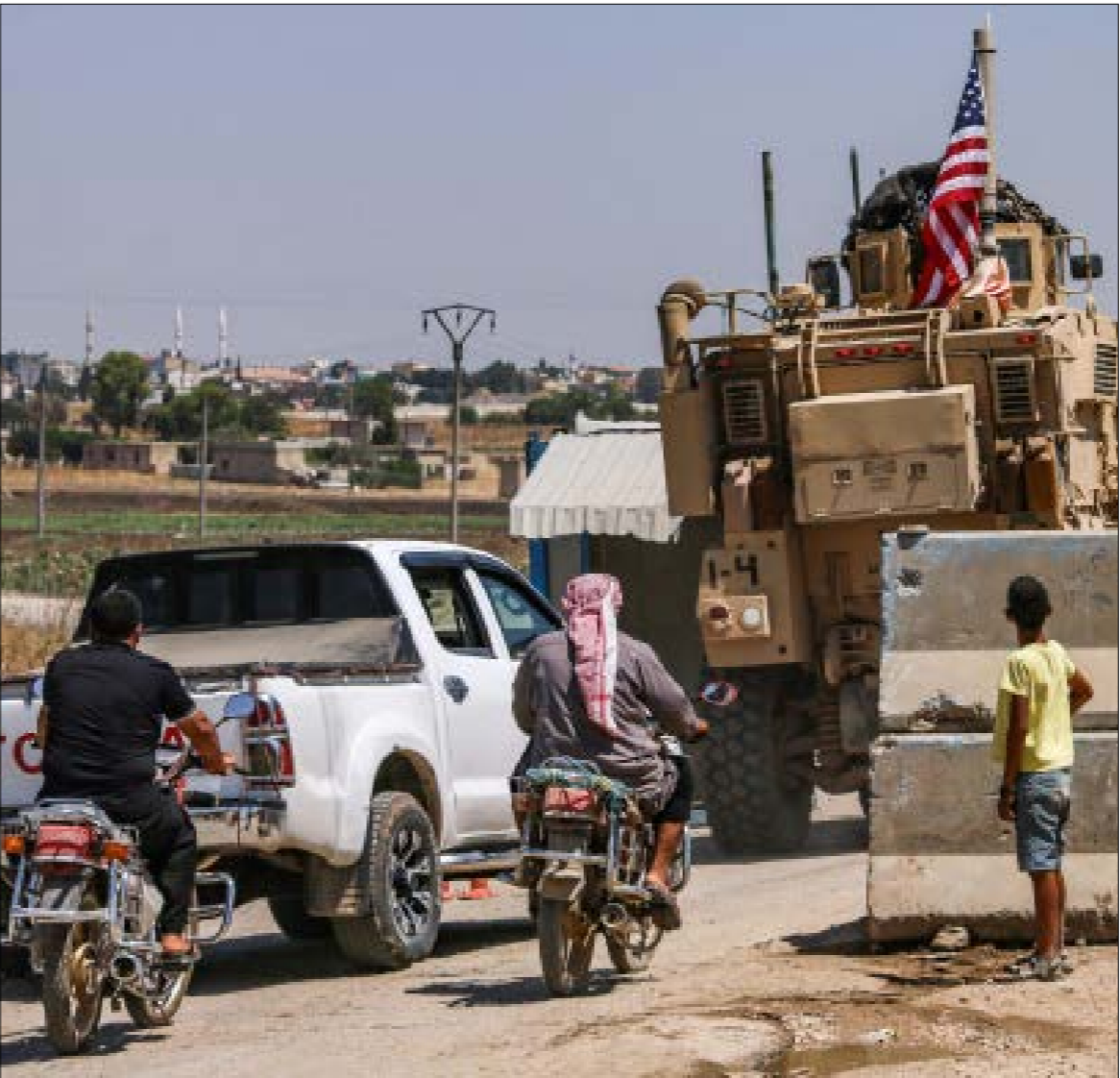
ألهمت موسكو الميركيب باستخدام إرادات تهريب النفط لدعم تشكيلات مسلحة وشرطة شيوخ القبائل

أن شركات عسكرية خاصة أميركية يزيد عدد عناصرها على 3500، إلى الآن تعمل على تدريب جماعات مسلّحة، وتنتشر في مواقع إنتاج النفط شرقي الفرات، بهدف تصدير إنتاجها إلى خارج الحدود. وأشار