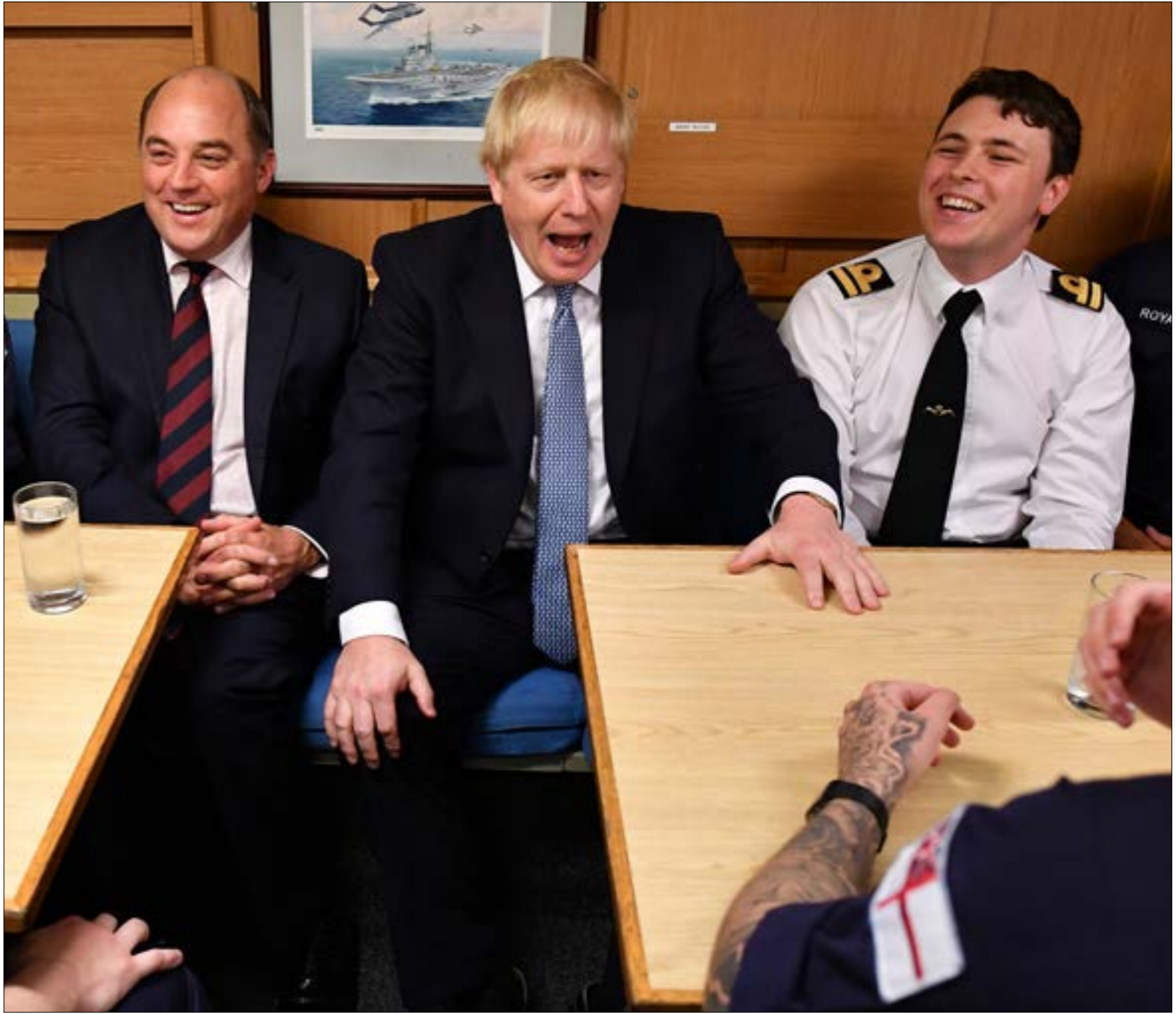
زار جونسون قاعدة فاسليت العسكرية النووية التي تم تبر (مزا) بجسد الهيمنة الانكليزية على اسكتلندا (ا ف ب)

لم يكذب بوريس جونسون يستكمل جمع صقور اقصى يمين حزب «المحافظين» الحاكم لتشكيل حكومته الجديدة، حتى بدأت الملفات كافة تتجمع على مكتبه دفعة واحدة: من مضيق هرمز إلى بلفاست، ومن إدنبرة إلى كارديف، إضافة إليها مجازات علنية مع بروكسل، وإطلاق نار مستمر على المعارضة «العمالية»، بقيادة جيريمي كوربن