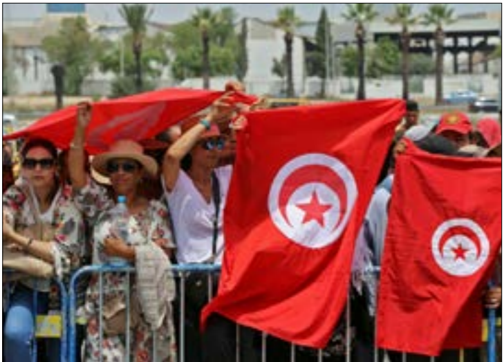
تجري الانتخابات الرئاسية فيه، «التشريعية، بثلاثة أسابيع