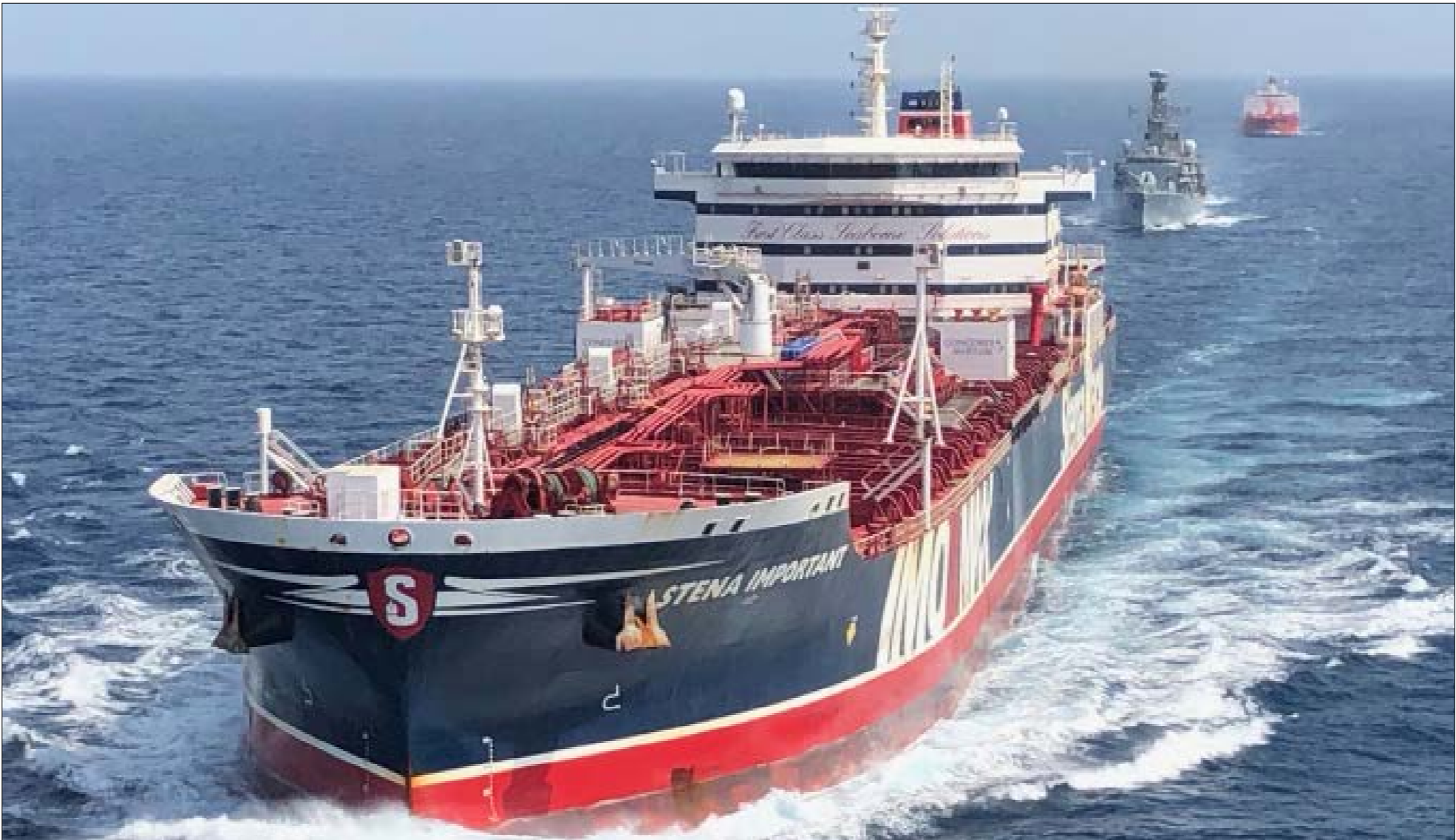
يظهر التسجيل توجهه البحرية الإيرانية تحذيرات للسفينة الحربية لعدم التدخل في احتجاز ناقله النفط

بحرية اجنبية إلى المنطقه، وجهت أمس، في المقابل، ضربة معنوية جديدة للبريطانيين ومن خلفهم الولايات المتحدة وحلفاؤها، حين نشرت شريطاً مصوراً لكيفية تعامل بحرية الحرس الثوري مع سفينة حربية بريطانية. ويظهر التسجيل توجيهه البحرية الإيرانية تحذيرات للسفينة الحربية لعدم التدخل في عملية احتجاز ناقله النفط. يقول ممثل بحرية «الحرس» «مطلوب