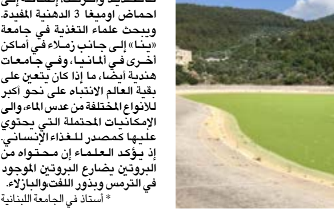
ينمو عدس الماء، بكثرة في بركة انان وبحيرة الجبونة

يتكاثر «عدس الماء» بسرعة وخلال وقت قصير، وهو الأسرع نمواً بين النباتات الزهرية في العالم، ويحمل أن يغطي كامل سطح الماء ويحوّل المسطحات المائية إلى ما يشبه مرجاً أخضر. وعندما كان يعتبر سابقاً من الأعشاب الضارة، أصبح اليوم من