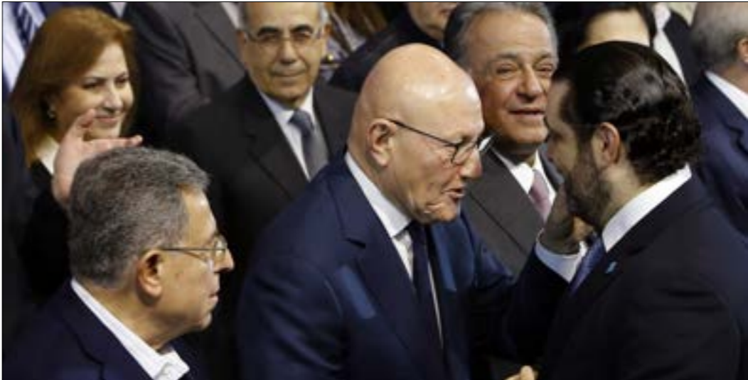
لا يريد الحريري الوصول بمجلس الوزراء إلى لحظة 15 ضد 15

لذلك، كان «الرهان» الجنبلاطي على أن يصوت فرنجية ضدّ إحالة «البساتين» على المجلس العدلي. أما على القلب «الديمقراطي»، فالزيارة إلى بنشعي عتاب فرنجية لهما، فخلال اللقاء مع وفد الحزب الديمقراطي، أبدى رئيس تيار المرده ملاحظاته على علاقة الأول مع التيار الوطني الحرّ. قال لهم، بما معناه، «إيجين ليعيد معو، وهالشئ مش منجح لمسير (النائب طلال أرسلان)». موضوع الحديث، أوجب على فرنجية التذكير بأنّ أرسلان «صديقي منذ مدة طويلة، وعلاقتي به جيّدة». تفنّي مصادر بنشعي أنّ يكون فرنجية قد «عاتب» وفد الحزب الديمقراطي، بأنهم «عادوا وتذكروه أخيراً، بعد تحالفهم مع التيار العلوي»، موضحة أنّ نائب زغرّتا السابق أعضاء على «الطريقة التي خطب بها التحالف، وأسلوب تظهير العلاقة بينهما». في الشكل، هناك أمورٌ مش زابطة، وليست لمصلحة أرسلان، رغم ذلك، «أجواء الزيارة كانت إيجابية». العدلي مع الديمقراطي، «ضبيعة أنهم