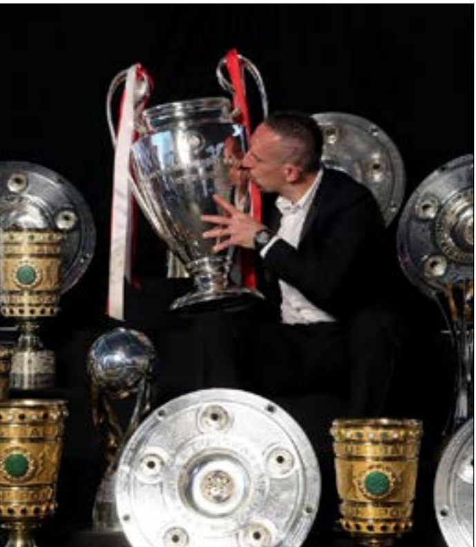
اصبر ريبيري، عن سعادته بالتوقيع مع فيورنتينا