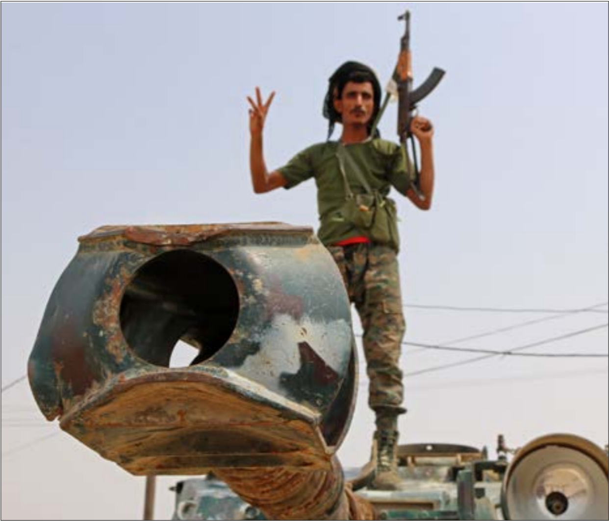
وصف السبارو نفسه الذي سيطر بموجبه «الانتقالي» على عدن، يقوم بإسقاط مدبلي أبين وشبوة

قبل أقل من شهر على الانتخابات الإسرائيلية، يبدو واضحاً أن حزب «الليكود»، سيفوز من دون أدنى شك، ولكن السؤال: أيّ «ليكود»؟ الذي يترأسه بنيامين نتنياهو، أو هذا الذي يترأسه بني غانتس؟ هذا التوصيف الوارد في أحد التقارير العبرية قبل أيام، وإن بدا ساخرًا، إلا أنه توصيف دقيق، إذ إن المشهد الانتخابي الإسرائيلي يشير إلى تقلص الخلافات بين المتنافسين، في نتيجة لمحدودية خيارات إسرائيل تجاه معظم الملفات التي كانت تدفع الأحزاب الوازنة إلى بلورة برامجها السياسية عبر رؤى مختلفة أو متباينة، وفي المقدمة الموقف من القضية الفلسطينية. هذه المرة، مثلما كان عليه الوضع القضية الفلسطينية، في دورة نيسان/ أبريل الماضية، ثمة شبه تطابق بين البرامج الانتخابية للأحزاب الإسرائيلية على اختلافها، وهو تطابق سلمي، بمعنى غياب البرامج، فالقضية الفلسطينية، التي كانت تتصدّر برامج الأحزاب ووعودها