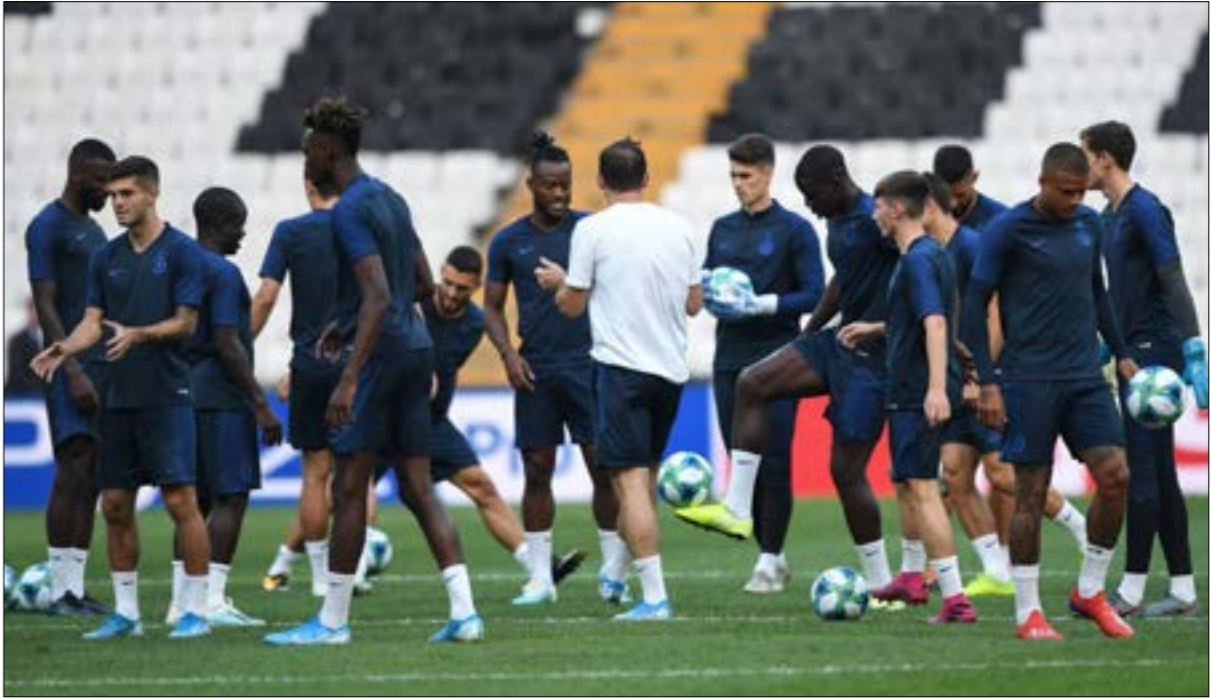
افضل لامبارد عددا كبيرا ليكسونه الى

ثلاث مباريات مرت منذ بداية الموسم، لم يحقق فيها المدرب الإنكليزي فرانك لامبارد أي انتصار برفقة نادي تشلسي. تعادلان وخسارة «قاسية» هي حصيلة المدرب الشاب حتى الآن، وهو ما جعله يحتل المركز الخامس عشر على نادي نورويتش سيتي السبت (14:30 بتوقيت بيروت). ظروف صعبة عصفت بنادي تشلسي الصيف الماضي، تغييرات إدارية