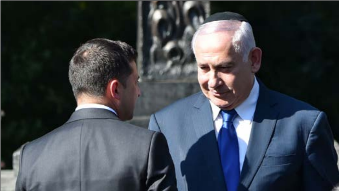
يحاول نتنتاهو تخفيف صورته وتظهير تأثيره في الخارج

بالعودة إلى الأحزاب الوازنة التي تُطلق عليها توصيفات يمنٍ ويمنٍ متطرف ووسط ويمينٍ وسط ويمسار ووسط، لا توجد خلافات مفاهيمية بينها حول الملفات الحيوية لإسرائيل في ما يرتبط بالامن والسياسة الخارجية. غيابٌ يدفع البعض إلى القول إن الانتخابات تدور بين «الليكود أ» برئاسة نتنتاهو والتابعين له إلى الآن في لائحة حزبه، و«الليكود ب»، برئاسة بني غانتس ويانير لايبند وموشيه يعلون، في حين أن غابى اشكنازي من الحزب نفسه ضابط بلا جنود، إضافة