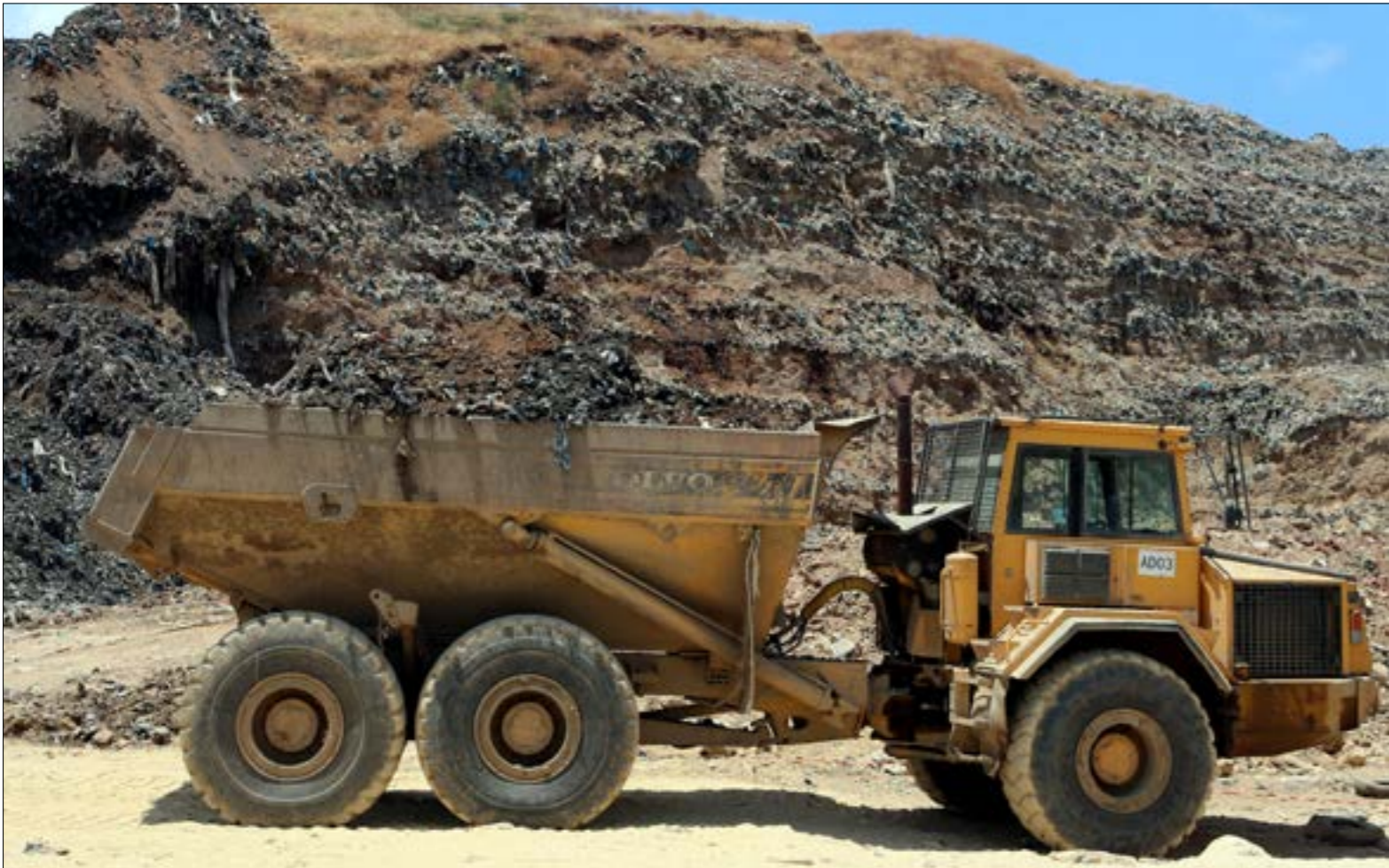
إقرار التخفيف والفرز يلقى عن القسم الأكبر من المطامر الـ 25 المطروحة ومن خار الحرافة نهاريا

بعض المعلمين يدافعون عن نمط جديد من الفروض الصيفية بدأ يعتمده عدد من المدارس ولا يشبه الفروض المتربلية خلال العام الدراسي، وهو عبارة عن أحجيات رياضية ولغوية وقراءة قصص بنجزها التلميذ عبر هاتفه الذكي أو الأيباد، بحسب النظام المتبع بأخذ شكل القلمة المبنية هي أقرب إلى نشاط فكري ترفيهي يشبّه ذاكرته ويقوّي معلوماته، عن طريق اللعب. إلا أنّ معلمين آخرين يدركون أنّ معظم إدارات المدارس لا تختار الفروض من باب أنها تهتمّ بأعداد تلميذ يسائل وينتقد، وخصوصاً حين يكون سقّف مخرجات التعليم لديها هو تسجيل معدلات مرتفعة في الامتحانات الرسمية؛