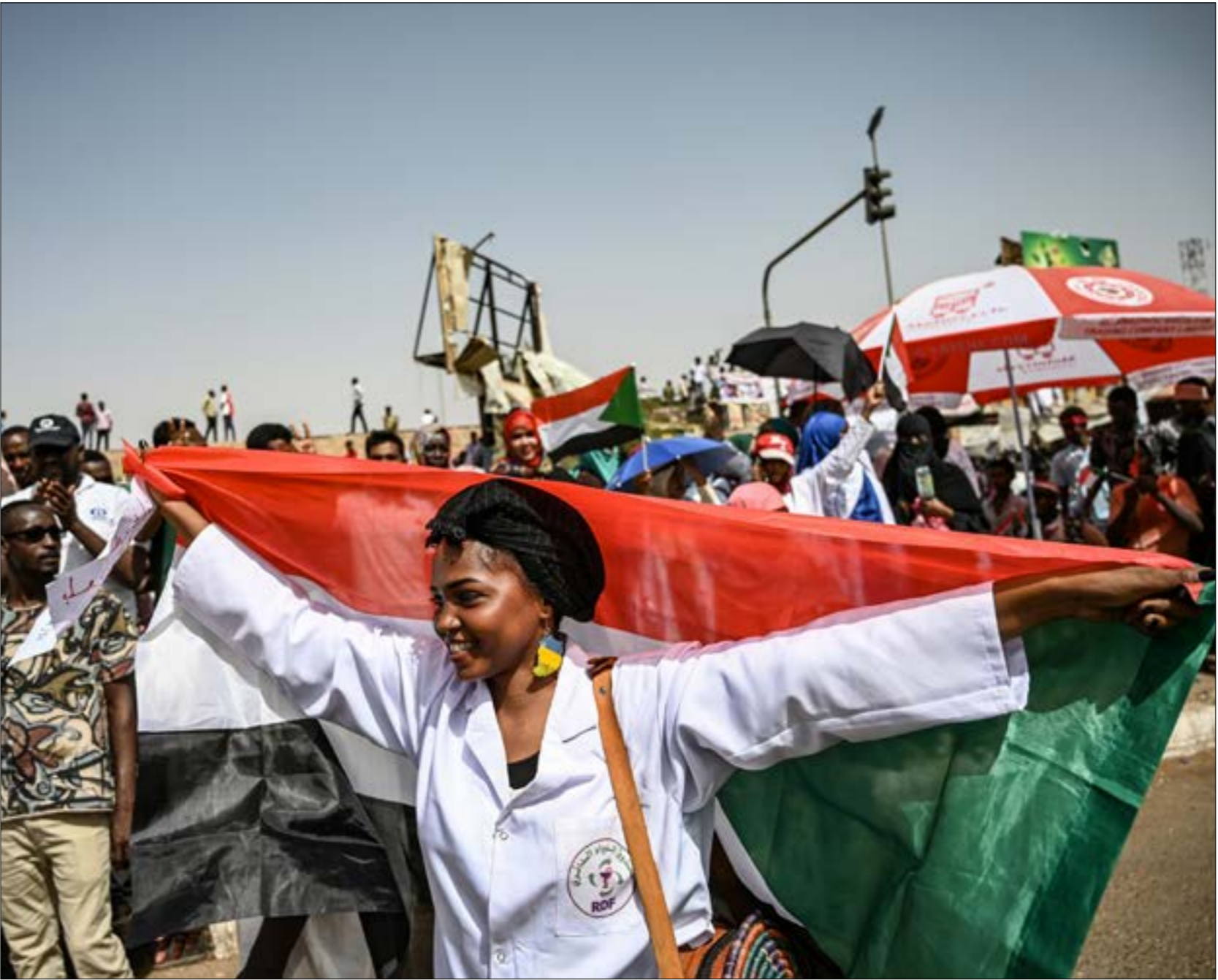
الخرطوم (مت الويبي)

الذي كان ان يتعرض للتصفية في زمن النميري ثم تعرض لقمع شديد في زمن البشير، ومن دون تفسير لعدم قدرة البشير على خلال ثلاثة عقود على تحويل السودان إلى مملكة الصمت» رغم محاولته ذلك من خلال استناده إلى تنظيم الحركة الإسلامية الذي تمكن من التغلغل في مفاصل الدولة كافة وأزاح الآخرين منها وأنشأ مليشيات