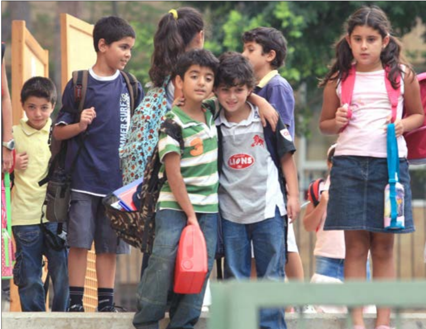
لا يتفاعل الأولاد مع الفروض بجدية لانهم يعرفون انها لا تصح (الرشيف - بلاك جاويش)

المواد المفروزة من منتجها وتحديد ساعات محددة لمروهم لا تقل عن خمسة أيام في الأسبوع، وهي الطريقة الأفضل والأعدل، خصوصاً اذا كانت الضريبة على وزن النفايات وليست على مساحة المسكن.