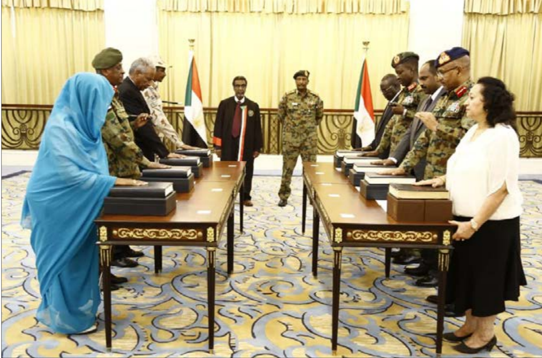
بيجو الفلك في المجلس حاليا لكشفه المكربت كما تظهره عسكرهم وعائلاتهم (الناظر)