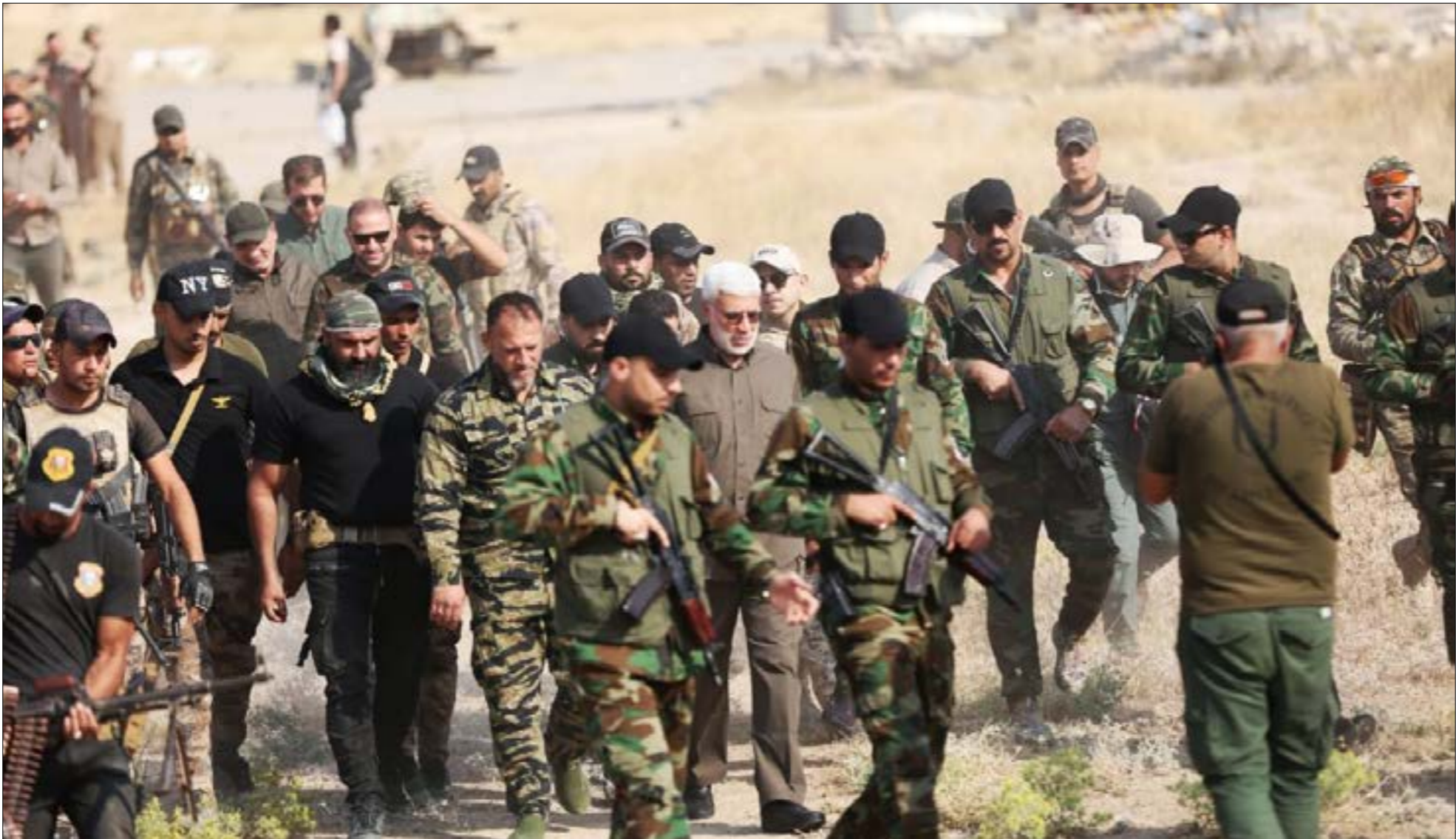
المهندس، اي طرانب اجنبي بحلف موقف مقاترنا، هو طيران عماد، وسردمه

أولّ، عجز الحكومة الاتحادية عن تحديد الجهة المتفدّة، وعليه كان من الأفضل «غضّ النظر»، حتى بيان نتائج التحقيقات كاملة. ثانياً، خشية رئاسة الوزراء منج أي جهة عراقية «الذريعة» لهجمة المصالح الأميركية في البلاد، في هذا الوقت الحساس على حلّها، ثمة الجهات سياسية - أمنية عراقية تعمل على ذلك؛ جهات منخرطة/ متوتّرة في هذا المشروع الأميركي،