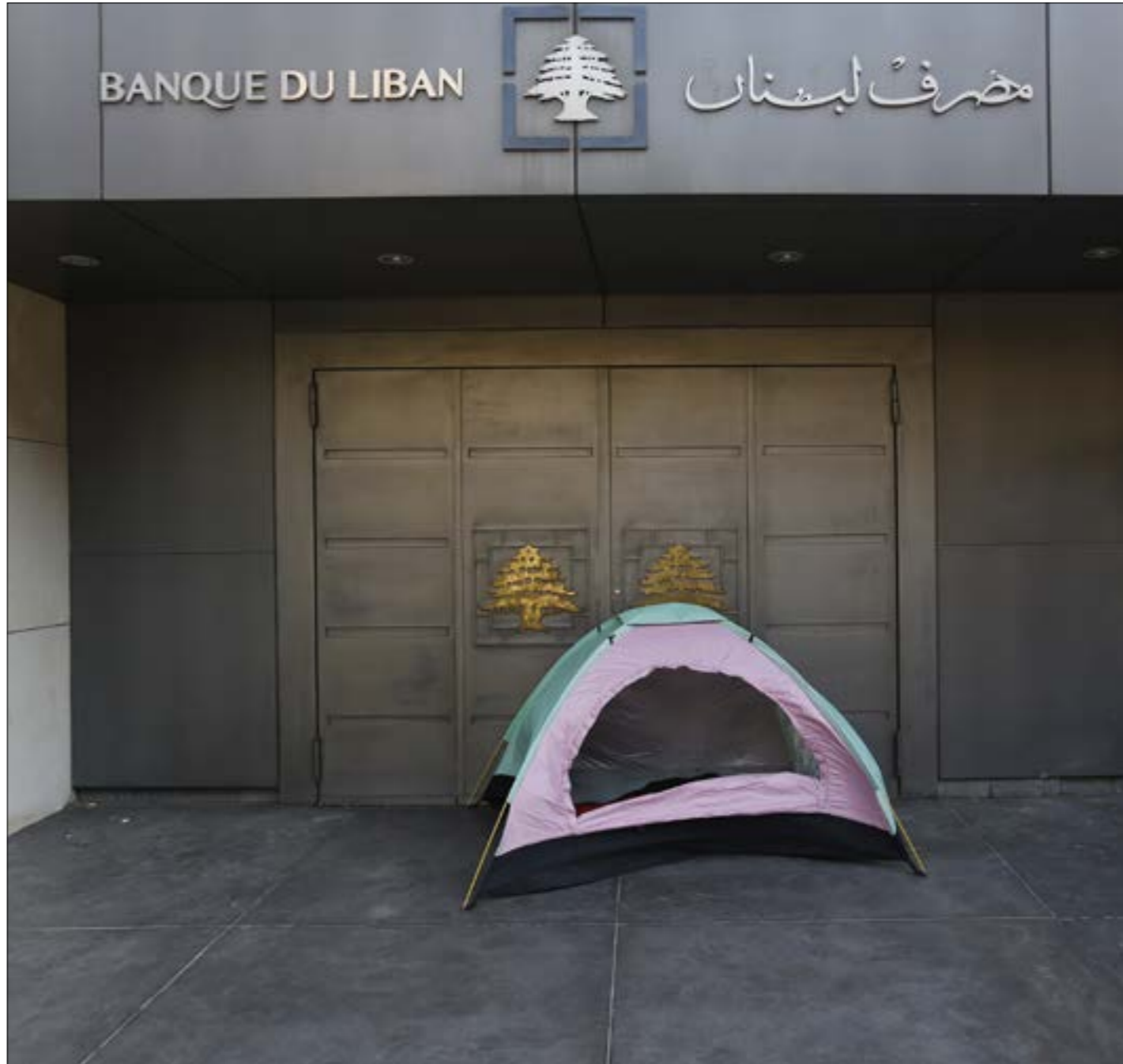
مصرف لبنان فتلط في بيم سندات تستحق في 2037 (مروان طحطح)

رغم كل هذه الإشارات إلى أن خفض التصنيف بات بحكم المَوْجَّل، إلا أن السوق الدولية حيث تتداول سندات اليوروبون्ड اللبناني، لم يكن لديها الثقة بأن ما يقال صحيح. «فمن الصعب التصديق أن وكالة تصنيف محترمة مثل ستاندر أند بورز، قد