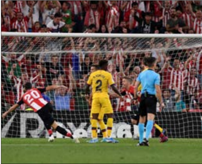
يملك بلباو العديد من السماس المهمة (أف ب)

يسعى ألتليك بلباو لانتزاع صدارة الدوري الإسباني لكرة القدم موقتاً عندما يحل ضيفاً على مايوركا اليوم في افتتاح المرحلة الرابعة