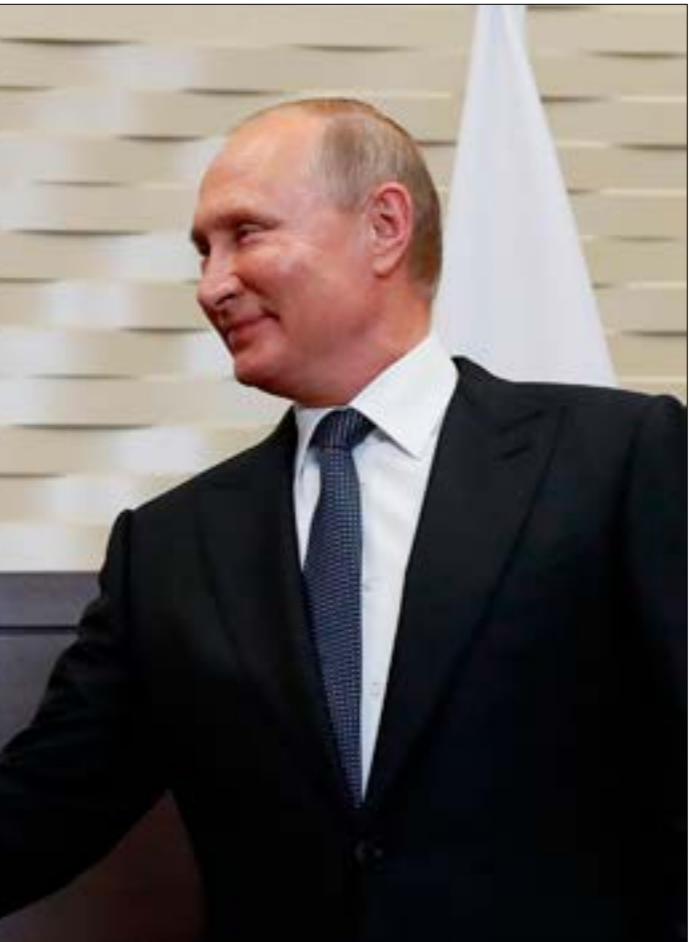
الزيارة استكمالاً لمحاولة نتياهو تظهير اقتداره عبر علاقته مع زعماء الدوق الوزاية (الف ب)

ضد محور المقاومة، وإن جاء في سياق الإصرار عليها، وتحديداً ما يرتبط بإخراج طهران من الساحة السورية، في المقابل، تأتي الزيارة