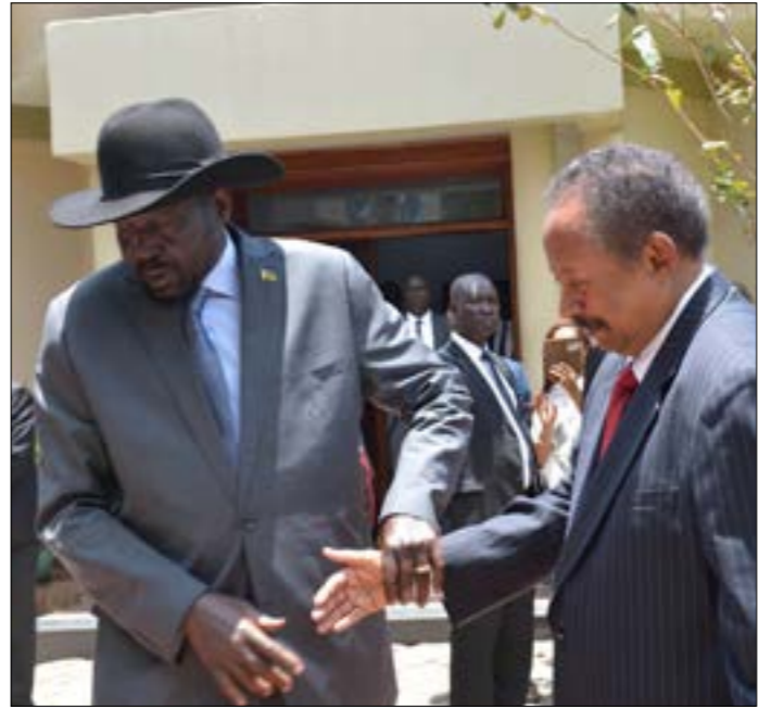
حمدوك (يمين) خلال زيارته لجوبا ولاقته سلفاكبر امس (أ ف ب)

وتأتي هذه الزيارة بعد يوم واحد من التوقيع على «اتفاق إعلان مبادئ وبناء الثقة» بين الحكومة السودانية وحرية الحركة والبضائع. وقال: «سعيد بكوني في وطني الثاني جنوب السودان، كما وعدت بأن أول زيارة لي بعد تمهّدان للتفاوض في الشهر المقبل.