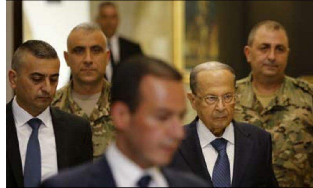
أكد عون ان الجماعات اللبنانية المختصة نكفت في مسألة المواجهات ولم تثبت صحة ادعاءات إسرائيل (عمران طحطم)

على رغم انها جولة استطلاعية، إلا أن مساعد وزير الخارجية الأميركي لشؤون الشرق الأدنى ديفيد شينكر استغلها لنقل رسائل عدة عكست موقف بلاده وتطرئتها الى عدد من الملفات السياسية والأمنية في لبنان. ووفق مصدر مطلع، أكد الموفد الأميركي، خلال لقائه رئيس الجمهورية العماد ميشال عون، «مناة العلاقات الأميركية - اللبنانية والسعي الدائم لتعزيزها وتطورها في كل المجالات»، وقال إن الولايات المتحدة «استثمرت في الجيش اللبناني منذ عام 2005 بأكثر من ثلاثة مليارات دولار في مختلف المجالات، ولا سيما التدريب والتجهيز والتسلح، ونحن مستعدون في تعزيز قدرات الجيش اللبناني الذي أثبت في كل المراحل والمواجهات التي خاضها قدرة وكفاءة عاليتين». ورداً على سؤال عون عن متابعة واشنطن لوساطتها بشأن الحدود البرية والبحرية، أكد شينكر « استعداد بلاده لاستئناف نشاطها في هذا الملف، وخصوصاً إن الاقتراحات التي سبق وقدمت من الجانبين جديرة بالمتابعة»، قائلاً إن «موضوع المهلة الزمنية ممكن تجاوزه، وإذا أردتم كجانب لبناني تلامز المسارين فلا مشكلة لدينا، وإذا رفضتم إسرائيل يمكن البحث عن حل وساطة، وتعليقاً على الأحداث الأمنية الأخيرة في الضاحية والجنوب، عبر شينكر «عن مخاوف