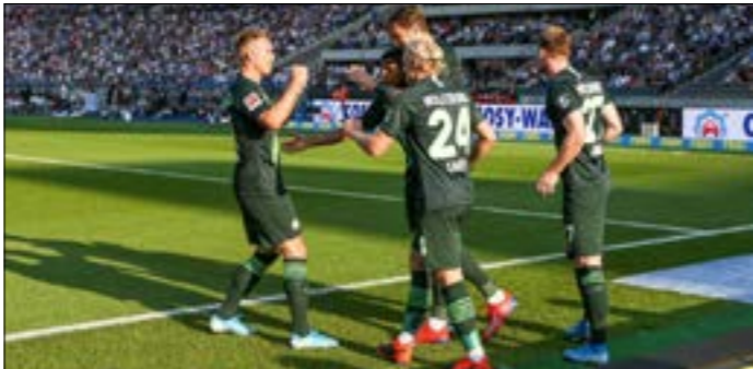
بدا فولفسبورغ موسمهم بقورتين متقابلتين وتعادله

المعنويات المهزوزة للاعبى فورتونا دوسلدورف بعد خسارتين متتاليتين، وكسب النقاط الثلاث لتكون أفضل وأكسندريا الأوكراني الخميس المقبل، في الجولة الأولى من منافسات المجموعة التاسعة من دور