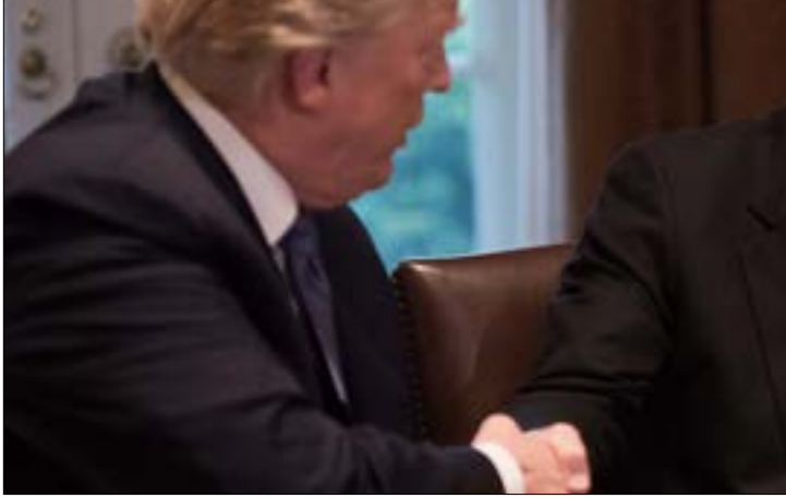
اشارةب تراهب إلى خمسة أشخاص مُحتملين و«مؤهلين جداً» لخلافة بولتون