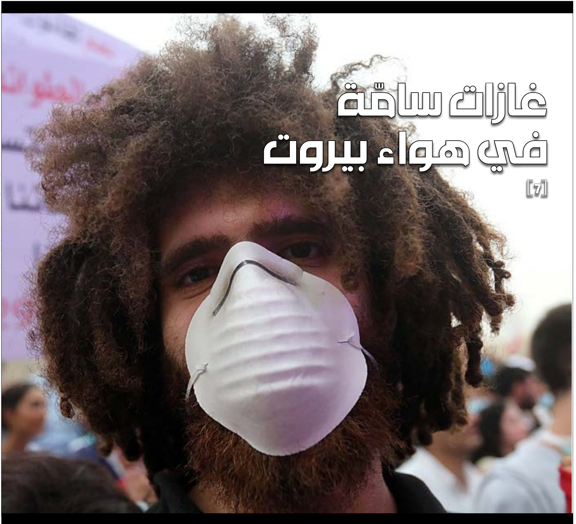
الرواح الكريهة التي انتشرت في بيروت أخيراً ناجمة عن تسرب عالية من غاز H2S السام في الهواء، تتجاوز الحد المسموح وفقاً للمعايير الدولية (هيلن الموسوي)