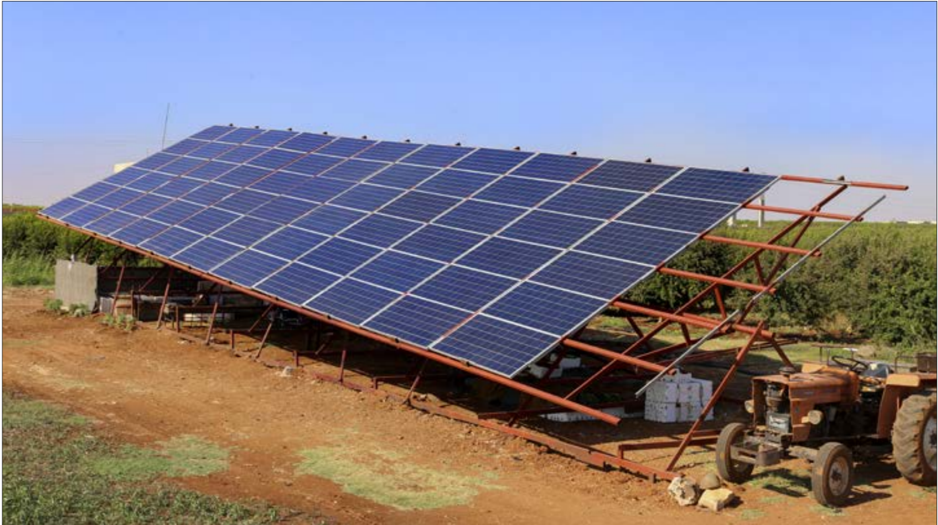
مزرعة تستخدم الواح الطاقة الشمسية في مدينة طفس في ريف درعا (محمد يوسف الحريدث)