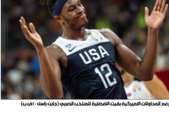
رغم المحاولات المبركة، بقيت المفصلة للمنتخب الصربي