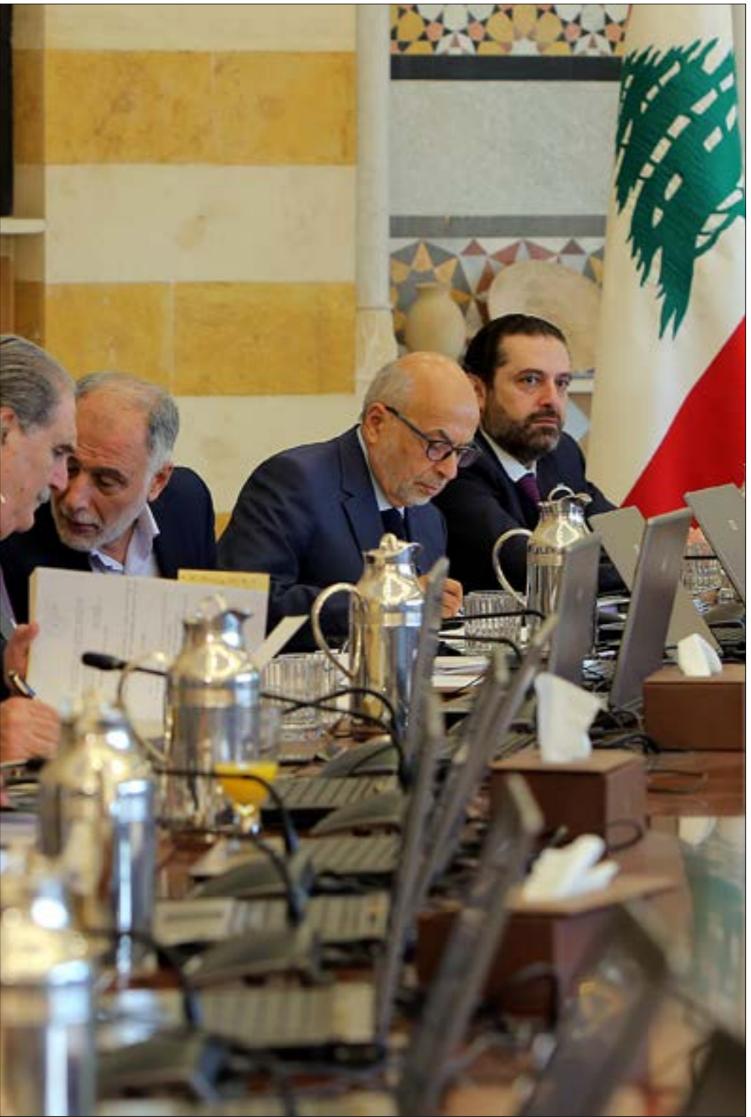
رئيس الجمهورية يسأل عن المتأخرات المالية كثيراً

البياب أمام تعقبات أخرى من وزير الاقتصاد منصور بطيش، ومن وزير الدولة لشؤون التكنولوجيا عادل أفيوني. بطيش أشار إلى أن المصارف تمتنع عن الإكتتاب بسندات الخزينة بالليرة اللبنانية التي تصدرها وزارة المال أسبوعياً، لافتاً إلى أن السبب يعزى إلى أنها تفضل إيداع السيولة بالليرة لدى مصرف لبنان حيث تستطيع من عوائد أعلى، مطالباً بأن يتوقف مصرف لبنان عن إصدار شهادات الإيداع بالليرة (امتصاص الأموال بالليرة اللبنانية) ليخّيج للخزينة الحصول على السيولة اللازمة لدفع المستحقات. أما أفيوني، فقد تحدّث عن كلفة التمويل الباهظة التي يدفعها لبنان للحصول على التمويل بالعملاء الأجنبية، مشيراً إلى أن الجهة الوحيدة التي تحصل على التمويل في مصرف