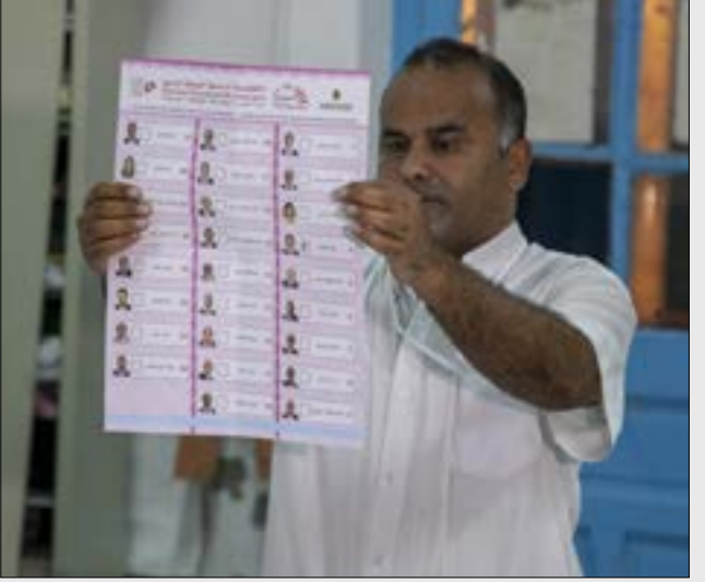
بلغت نسبة التصويت فيه الداخله 45,2% والخارج 19,7% (الناضول)