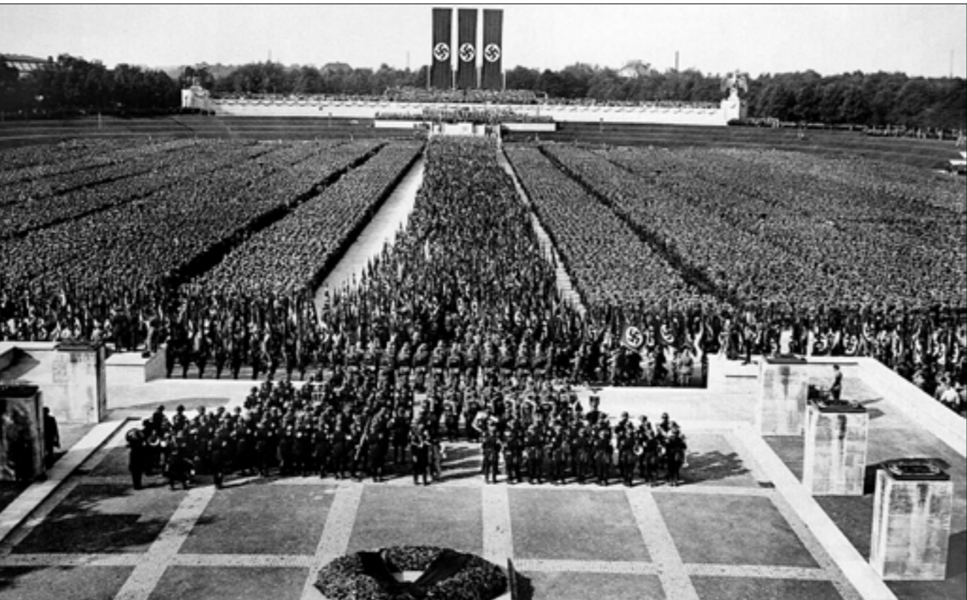
من فيلم «انتصار الإرادة» (1935) للينين رنستانا