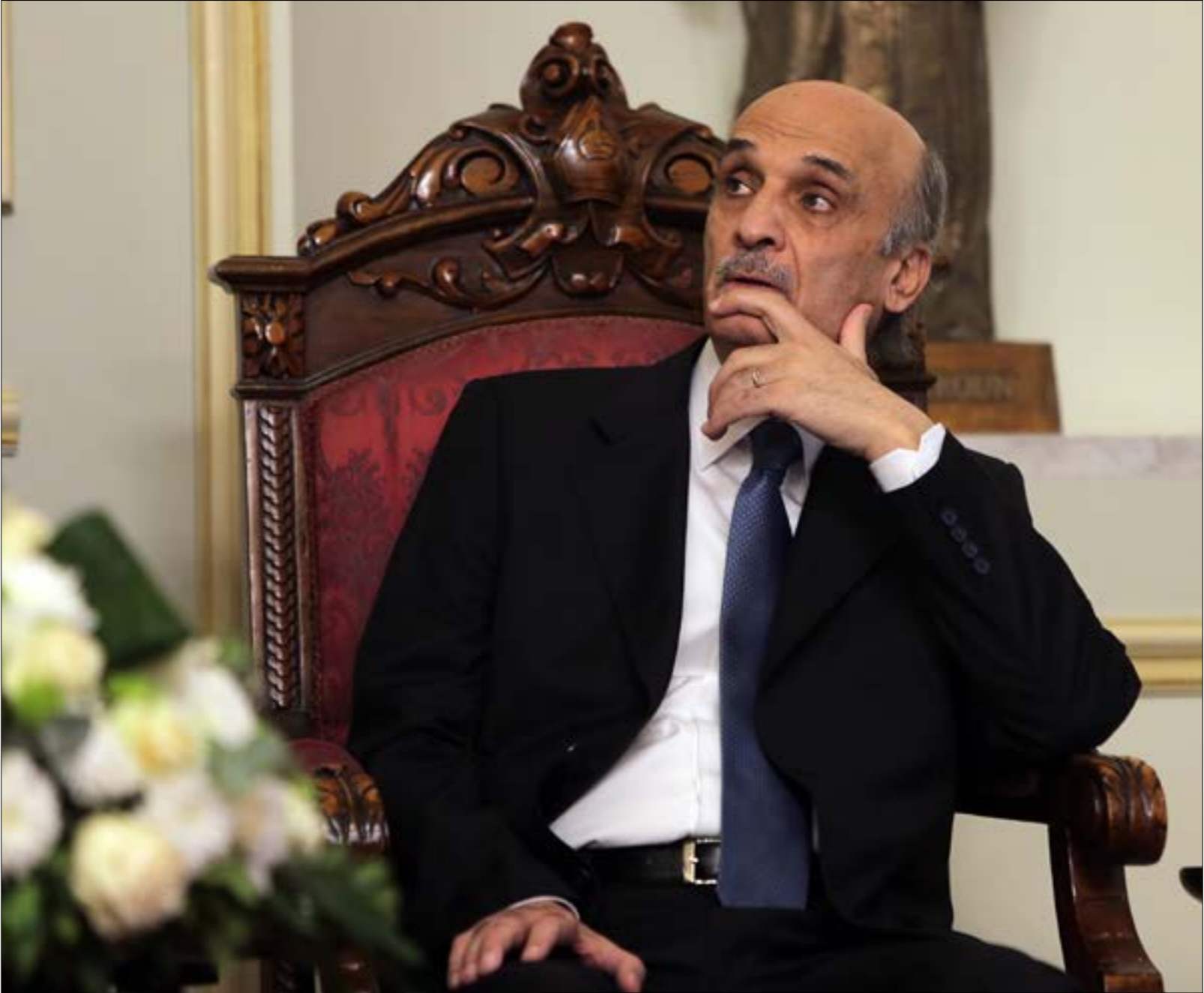
ماضي الرجل بطارحه ويحرمه الحلفاء الفعليين (هيلم الموسوي)

يوم تصالح عون وجمعع في «إعلان النيات» في 2 حزيران 2015، قيل انهما تخلفا من ماضيهما الدامي والمدمر الذي خلف مئات الضحايا. اتفاق معراب في 18 كانون الثاني 2016 اتى استكمالاً للمصالحة بينهما اكثر منها بين التيار الوطني الحر والقوات اللبنانية كون صدامهما عام 1990 نشأ عنهما بالذات، شخصياً، كمتنافسين على السلطة في المناطق الشرقية. اقترن اتفاق معراب بترشيح جمعع لعون للرئاسة، فبدوا انهما على طريق