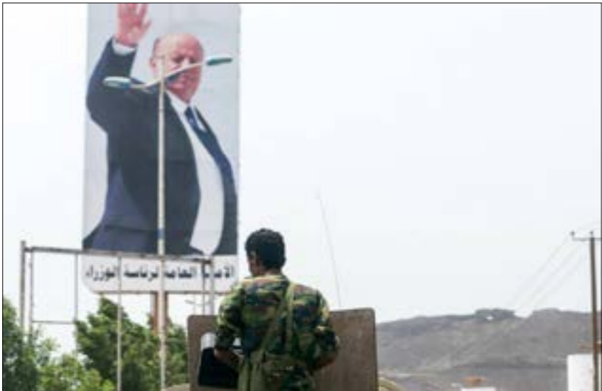
لا يستبعد متابعون الخبار هدنة حدة، وإن ينكر مشهد الاتفاق في عدن (اف ر ب)

الجنوب عن تحول العمل مع «الهلال الأحمر» إلى مدخل للتجنيد الأمني، على أن أبرز ما قامت به الإمارات جنوب اليمن، هو تأسيس «المجلس الانتقالي الجنوبي» الذي يضم قيادات ميدانية وسياسية من حوالي 27 قبائلاً لديهم مكتب سياسي ومجلس نيابي، إضافة إلى مجلس تنفيذي ومجالس فرعية، مع الحرص الدائم من جانب ابوظبي على استضافة قيادات «المجلس الانتقالي» البارزة في داخل الإمارات، لا سيما عبدالرسول الزبيدي وهادي بن بريك، وتنفق عليهم مبالغ طائلة في ما بات يعرف في الجنوب بـ«الصفيات الخفية»، من دون إغفال اتفاق الإمارات ملايين الدولارات على وسائل إعلامية ومواقع إخبارية رقمية ومنصات التواصل الاجتماعي، إضافة إلى مواقع إلكترونية، وإذاعات، وفضائيات، أبرزها «الغد المشرق» التي تبث من ابوظبي.