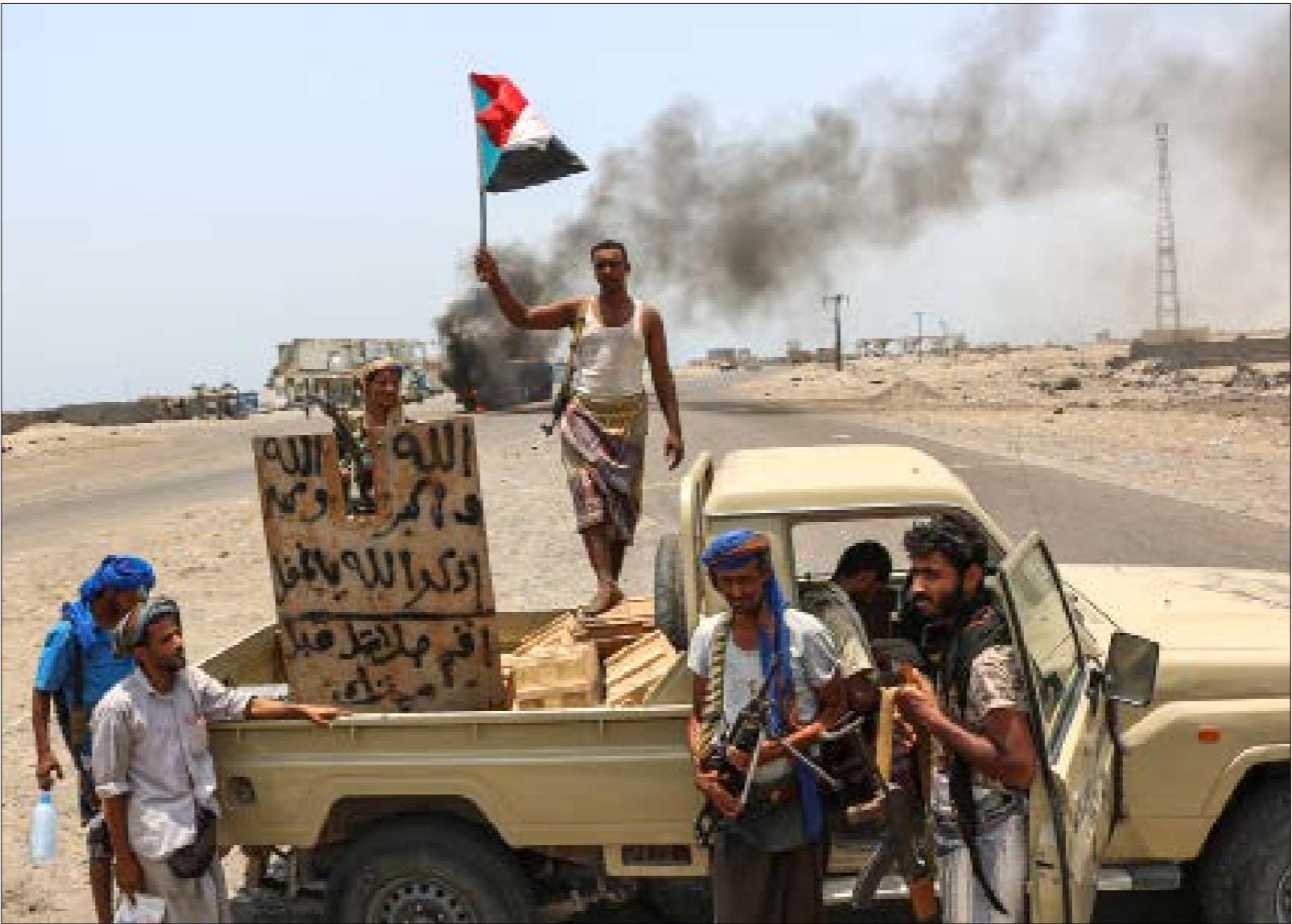
فصيلة حرة يشتد فيها الخناق لتلج الإمارات الى إشاعة مناخات ومعلومات عن مياشرتها إعادة التمويم (اف ر ب)

جماعتها وأعوانها من داخل اليمن، وإلى وسائل الإعلام التابعة لها في المنطقة، لإشاعة مناخات ومعلومات عن مياشرتها إعادة التوضع وبدء الانسحاب من اليمن. لكن المراقبين والمتابعين على الأرض يتفون بصورة مطلقة حصول أي تطور له قيمة سياسية أو أمنية أو عسكرية حتى الآن.