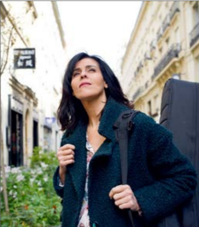
قدمت سعاد ماسي الدعوة للصبية الخيرة في بلدما الجزائر. من ذلك المشاركة في التظاهرات التضامنية في فرنسا

إنني كشاهد من أهله، أؤكد أنه، لم يُطلب في يوم من