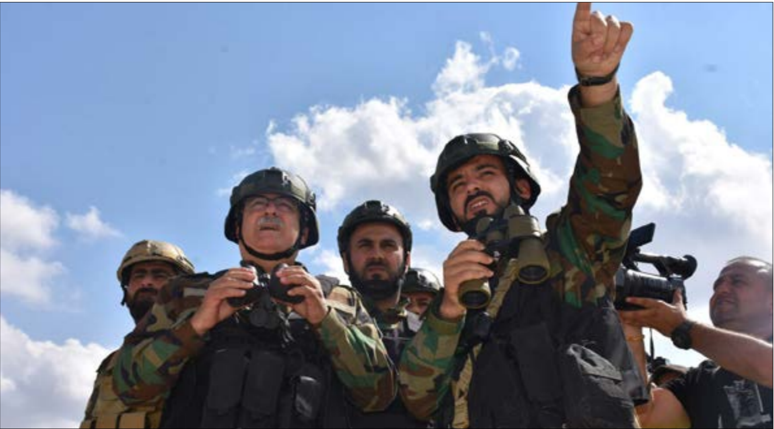
نداء «الجيش الوطني» مناوره قرب مدينة عفرين في إطار الاستعداد للعملية العسكرية شرق الفرات (الناضور)

ومحيطها، وانسحب المقاتلون الاكراد منها نحو هنج وشرق الفرات. في نهاية الهجوم . تردّد ان القوات التركية وفصائل «الجيش الحر» ستدخل مدينة تل رفعت الواقعة شرق عفرين، في إطار عملية «غصن الزيتون».، ذلك اليوم ، كان كافياً أن تتوجه بضم آليات، على هنتها عسكريون سوريون يرفعون