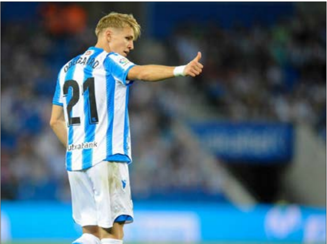
يقدم أودينغار موسماً مميزاً مع سوسيداد (عنا الويد)

مكاناً أساسياً له في «قلعة البرنابيو». انتقل الشاب النرويجي إلى نادي فينكس الهولندي أيضاً، والحديث هنا عن موسم 2018/2019، أي الموسم الماضي. في فينكس، أكد أودينغار