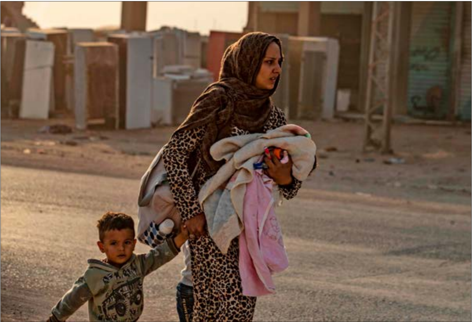
القصف التركي طاول مناطق واسعة على امتداد الشريط الحدودي

ولنظام التركي والحشود العسكرية على الحدود، لافتة إلى أنها «تشكّل انتهاكاً قاضحاً للقانون الدولي» مجددة تصميمها على «التصدي للعدوان التركي بكل الوسائل المشروعة»، ونقلت «سانا» عن سوريا، إذ دانت هي الأخرى «باشد