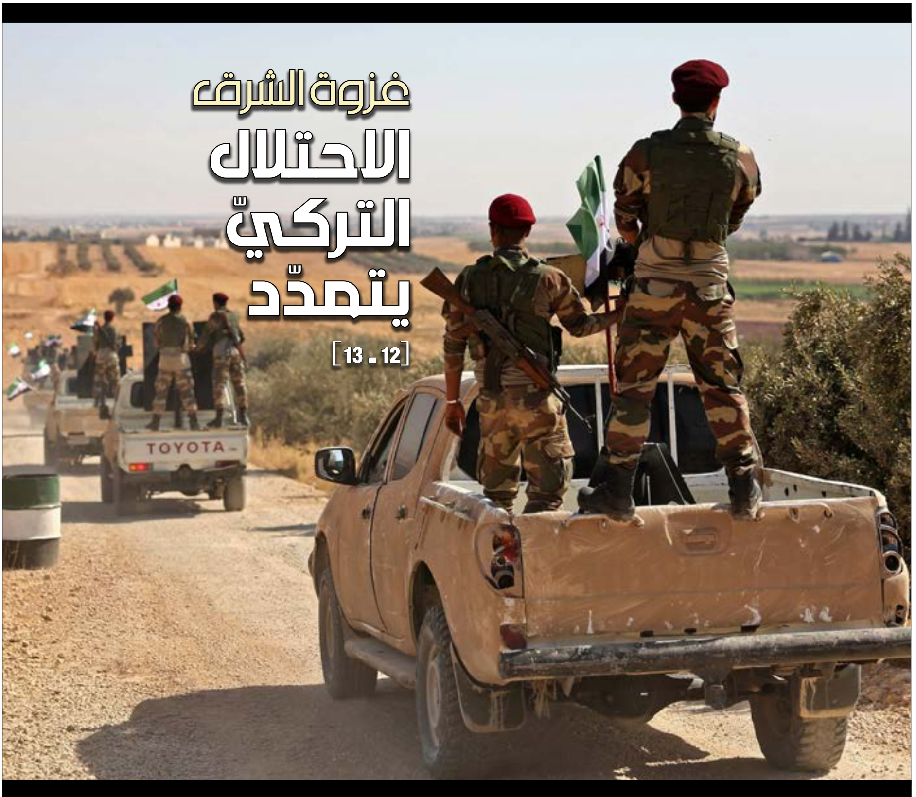
بداية أمس الهجوم البري التركي في شرقي سوريا، واقتحام جندائي كردي لـالأخبار، ان «قرار الحزام محسوم حتى الانتصار على الصواعق» (إف ب)