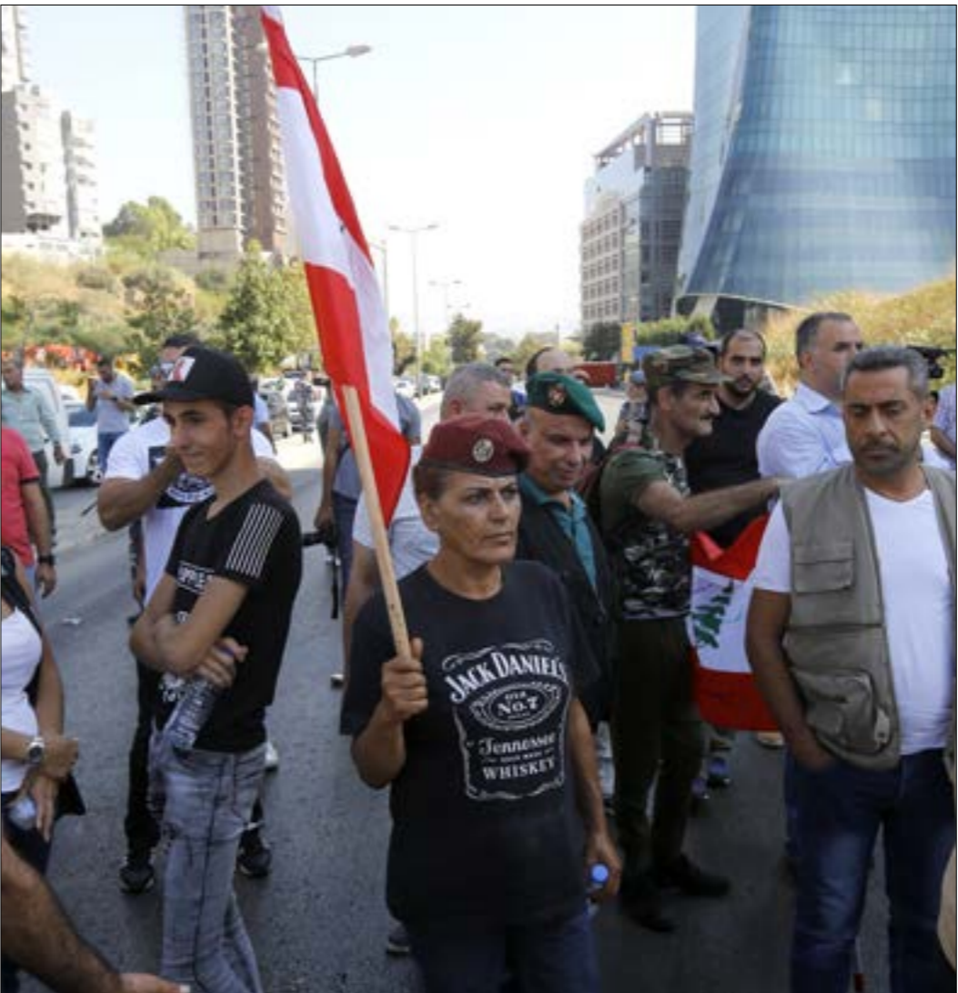
من اعتصام العسكريين المتقاعدين امام مبنى TVAN أمس احتجاجا على عدم صرف مستحقات المتقاعدين حديثا والسعي للمسن بنظام التقاعد

على ضلّة، في مجلس الوزراء اليوم، إن لا همّ يعلو على همّ تحويل الموازنة إلى مجلس النواب في المهلة الدستورية التي لم تحترم منذ ما قبل