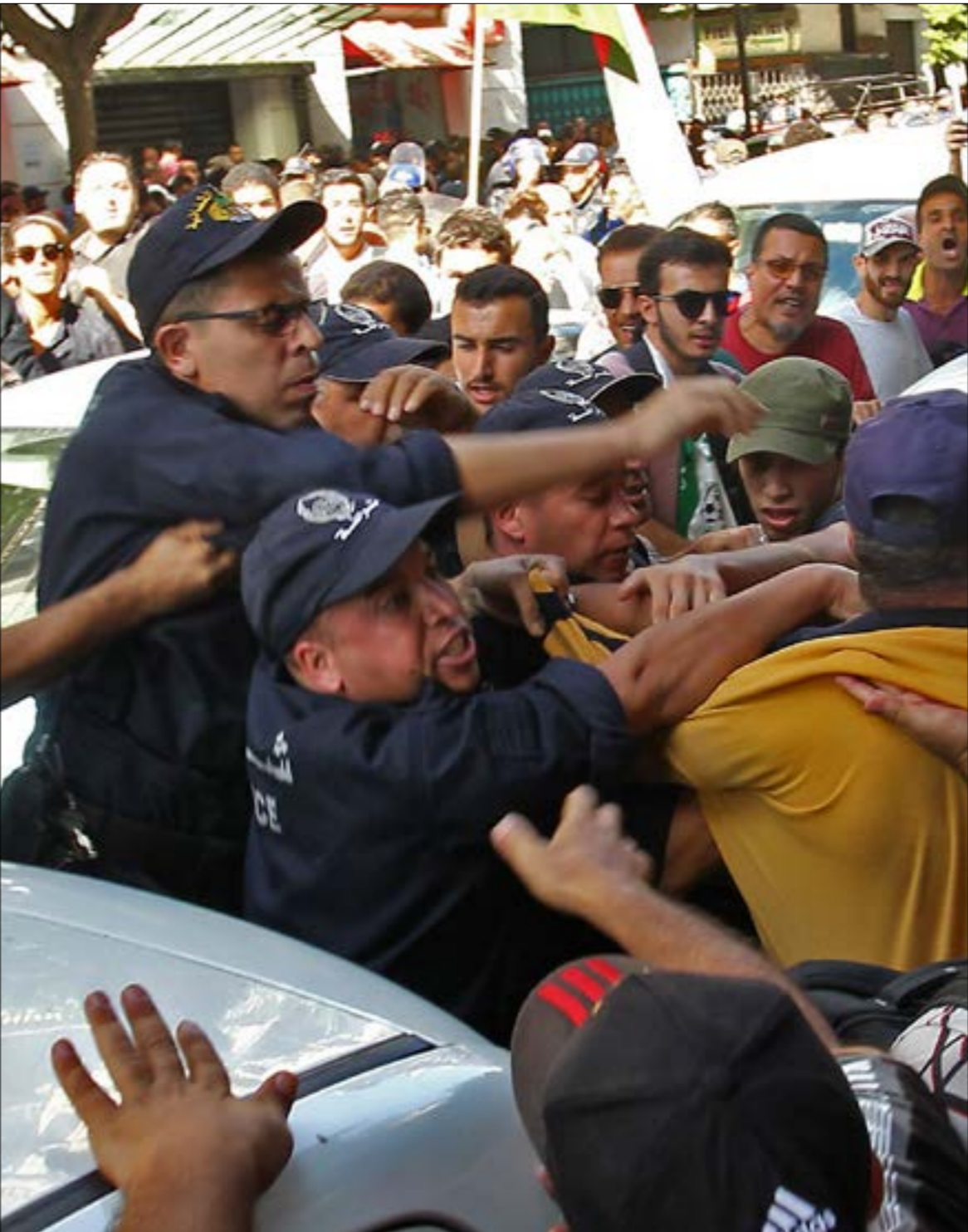
كانت تظاهرات يوم اللالا، ساحة لاعتقال العشرات من الطلبة وبعض الصحافيين والنشاشطين (أ ف ب)

نجحت هيئة الدفاع عن المرشّح الرئاسي نبيل القروي، في إخلاء سبيله من السجن الذي يقبع فيه منذ نهاية الشهر الماضي، يتهم تهرب ضريبي وتبييض أموال عبر شركات إعلامية يملكها. وعلى عكس المنهج الذي توخّته سابقاً في تقديم مطالب إفراج، طعنت هيئة الدفاع أمس في إجراءات إيقاف القروي، الذي تمّ أثناء عودته من نشاط حزبي شمالي البلاد. ويأتي هذا القرار القضائي بعد موجة إشاعات حول نية القروي إعلان انسحابه من السباق الرئاسي، فدّها حزب «قلب تونس» في بيان أصدره أول من أمس. وبينما نفى الحزب فكير القروي في الانسحاب، أكد أنّه يرفض الإدلاء بتصريحات