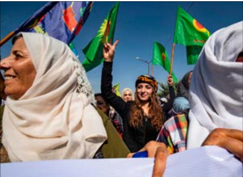
تظاهر عدد من سكان المنطقة الحدودية في مدينة رأس العين (رفضا للعدوان التركي)

وكانت أنقرة استجبت الهجوم بإعلان عن دمج الفصائل التابعة لها في «الجيش الوطني» في ريف حلب، مع فصائل «الجبهة الوطنية للتحرير» المنتشرة في إدلب، ضمن جسم عسكري أطلقت عليه اسم «الجيش الوطني»، يتألف من 7 فيالق، وتشكّل رأس حربة العملية