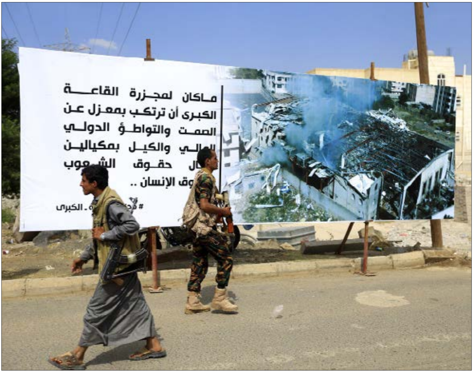
مخ عمليات إحياء الذكرى السنوية لمجزرة القاعة الكبرى في صنعاء