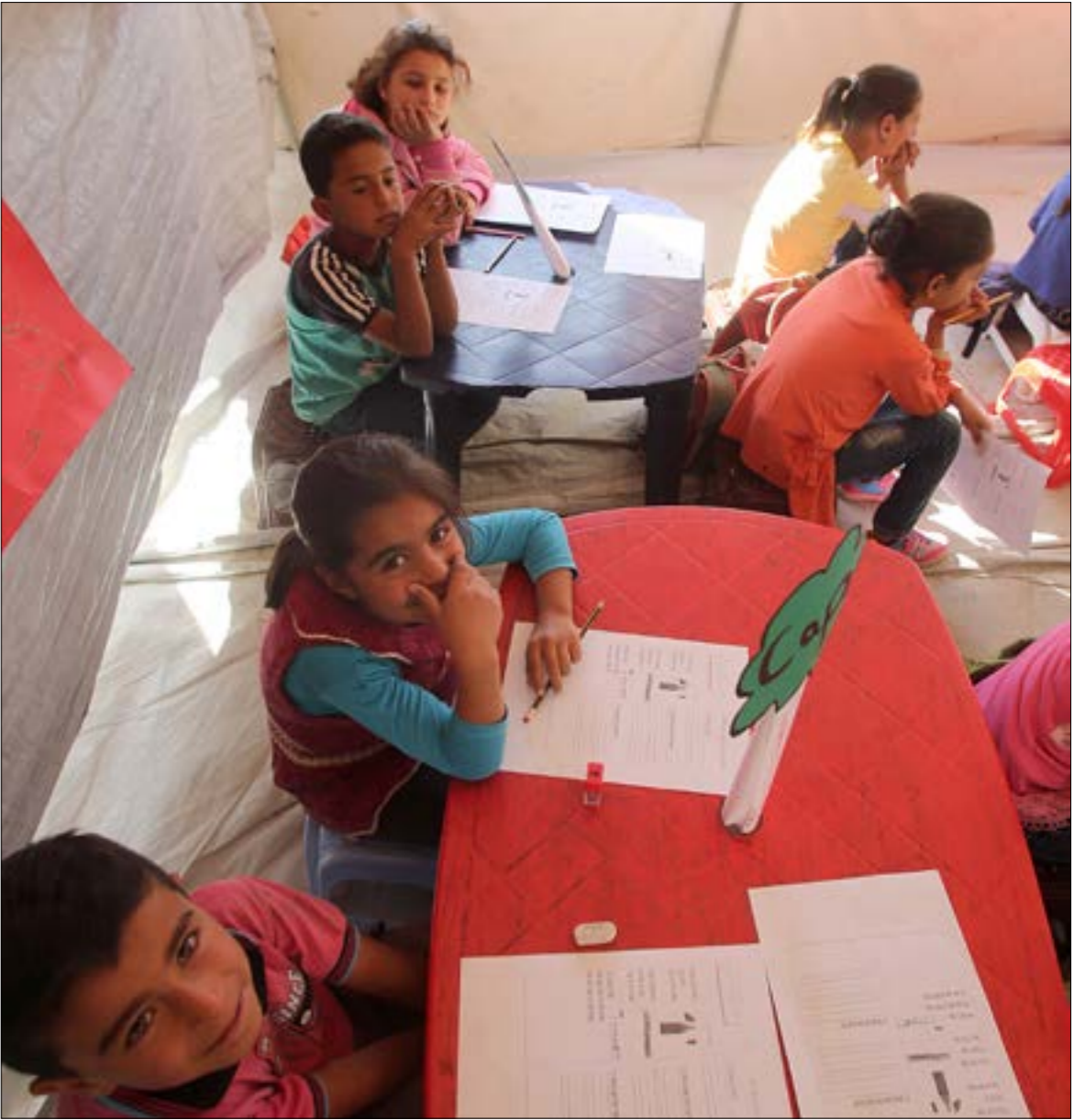
طلب التفقيش التربوي استصدار تكليف تروبو ومالي للتخفيف في الأهوال (ميلام الموسوي)