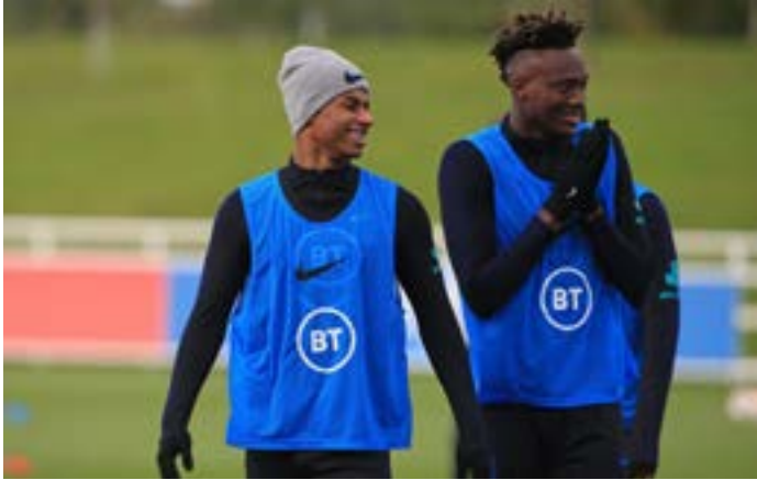
يتصدر المنتخب الإنكليزي المجموعة الأولى

نقاط عن المتصدرين بعد خسارتها الأخيرة المفاجئة على أرض ألمانيا التي تحل على تركيا في مباراة قوية. إنكلترا الضمان التامه في المجموعة الأولى التي تتصدرها إنكلترا بارحيجة، عبر لاعبو المدرب غاريت ساوثغيت عن جهوزيتهم لترك مباراة تشيكية الليلة (الساعة 21:45) ليس كافياً على الصعيد البدني. لا يمكنه الوصول إلى أعلى مستوياته إذا لم يحصل على فرصة للعب. وقبل أيام من المواجهة، أعلن الاتحاد الفرنسي غياب النجم الشاب مبابي بتوقيت بيروت أو بلغاريا الثلاثاء المقبل بحال صدور أية هتافات عنصرية بحقهم. وتعدّ المباراة الثانية على ملعب فاسيل ليفسكي