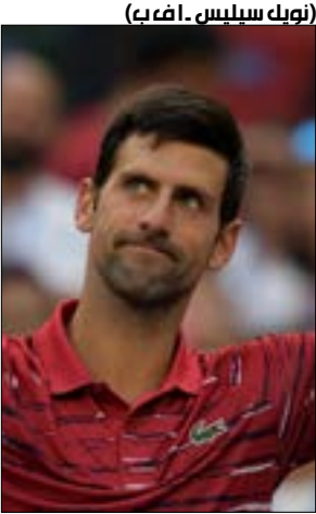
(نوك سيليس ا ا ف ب)

احتوى الصربي نوفاك ديوكوفيتش المصنّف أول عالميا إرسالات المعلق الأميركي جون إيسنر، وبلغ يوم أسس الخميس ريع نهائي دورة شنغهاي الصينية، ثامنة دورات الماسترز للافز بنتيجة 6-7 (7-9) و7-5. واحتاج مديفيد، المصنّف ثالثا في الدورة، إلى رفع مستوى لعبه للتغلب على بوسبيسل المصنّف 248 عالمياً والمتأهل من التصفيات. وفُضرب مديفيد (23 عاماً) موعداً في الدور التالي مع الإيطالي فاييو فونييني الفائز على الروسي