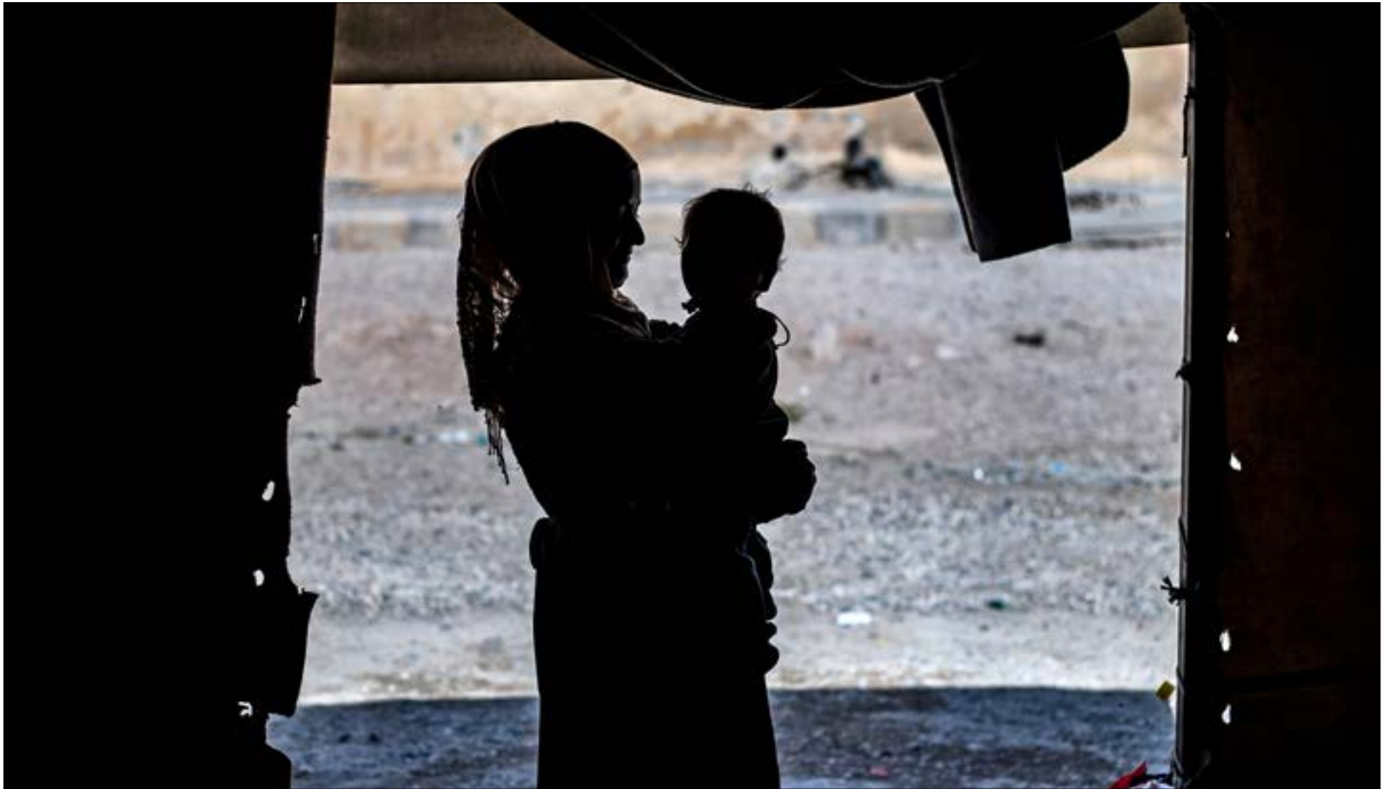
نيفه الزوجة من دون اي وليقةً تلبث زواجها او نسب ابنتها