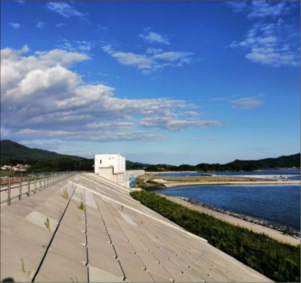
يمكن القول بيقين تام ان المنظومة الأخلاقية هي من يحكم اليابان (الاحبار)

مثيراً للفضول بدوره، لا سيما أنه يبدو أشبه بإداء سلوكي أكثر من كونه سبّحية. من الصعب تماماً أن تعرف ما الذي يشعر به ياباني من المشروعات الإنسانية عبر الأمم المتحدة. في أواخر شباط 2018، أعلنت طوكيو عن أزمة مساعدات إنسانية جديدة بقيمة 12 مليون دولار التخفيف معاناة الفئات الضعيفة في حلب والمناطق المجاورة». على أن يتم تقديمها عبر برنامج مشترك بين «برنامج الأمم المتحدة الإنساني / UNDP» و«منظمة الصحة العالمية»، و«مفوضية شؤون اللاجئين». وخلفه في مهمته أكيرا إندو أن سياسة بلاده تجاه سوريا تتمايز عن الحليف الأمريكي. يؤكد ماتسوموتو أن سياسة بلاده «لا تتّصف بالفوقية»، ويضيف بلغة عربية جيدة أن اليابان تعتمد مبدأ «نظرة من فوق، نظرة من تحت». كل ما حصل في سوريا يمكن فهمه بالنسبة إلى ماتسوموتو، باستثناء تفصيل شديد الأهمية، خلاصته: «كيف سمح السوريون بتدخل كل هذه الدول في شؤونهم؟»