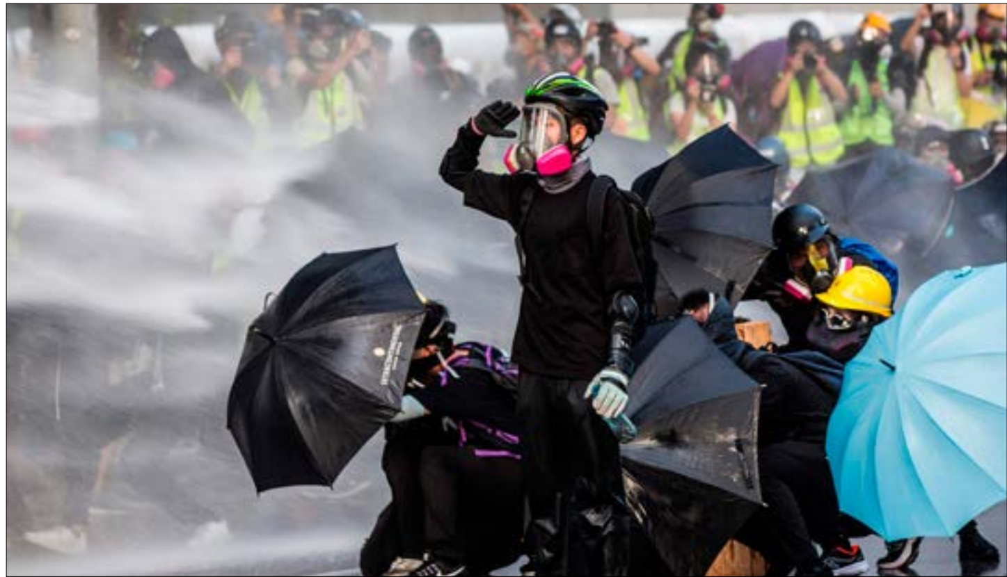
أخذت الصين ان هونغ كونغ هي جزء منها «مهما يحدث»

واقبادة في المدينة، والتحقيق في ما يعتبرونه «وحشية» الشرطة في التعامل مع المحتجين. دعوتها لانسحابه إلى قانمة المطالب الحكومة من خمس نقاط، والتي تشمل: إجراء انتخابات مبشرة للهيئة التشريعية الرئيسية التنفيذية تفاصيل عن أي خطوات تالية يمكن أن تعتمدها حكومتها، سارع المعارضون إلى على غرار مسارات الحافلات وجمع القمامة، إلا أن النتيجة عُدتّ بمثابة تعبير عن رفض الناخبين للحكومة التي أسّست غالباً بالغنف. تعليقاً على هذا التطور غير المتوقّع، تعهّدت حاكمة هونغ كونغ، كاري لام، التي قالت مراراً إن غالبية صامتة من السكان تدعم إدارتها وتعارض حركة الاحتجاج، «الإصغاء بتواضع» إلى الناخبين، عازية نتائج الانتخابات إلى «عدة تحليلات وتفسيرات في المجتمع، قلة منها فقط تشير إلى أنها تعكس عدم رضى الناس عن الوضع الراهن والمشكلات المتأصلة