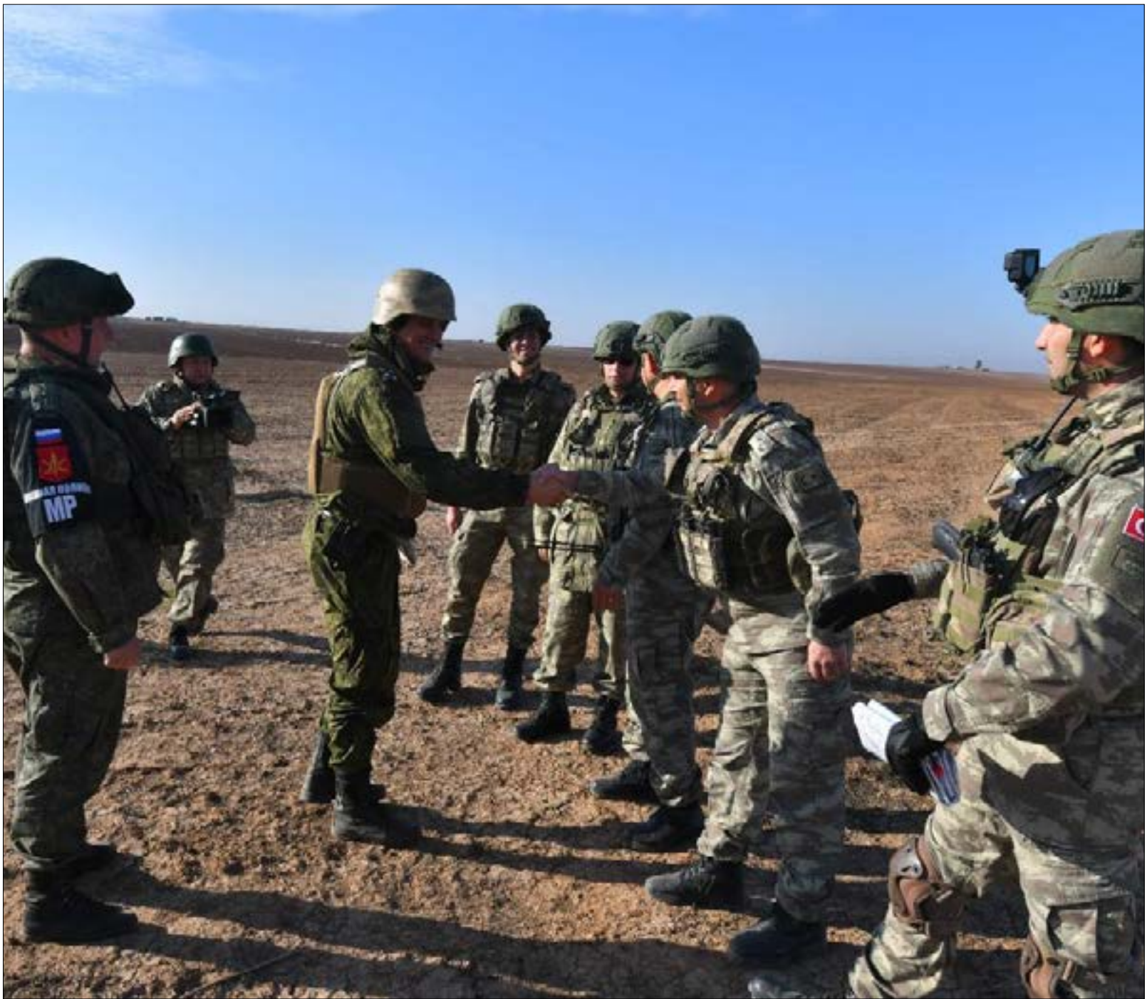
الهجوم على عين عيسى كان هدفه إرباز جذبة التهديدات التركية بخصوص الطريق الدولي (الأضول)

مقرب من «قصد»، من جهته، إلى أن «قصد» عن الدفع بتعزيزات عسكرية إضافية إلى جبهة عين عيسى لإبراز تمسّكها بالاحتفاظ بنقاط تفتيش على كامل الطريق الدولي من منبج وحتى عين عيسى. ولم تكثف «قصد» بذلك، بل أصدرت بياناً حلّلت فيه روسيا «مسؤولية الهجمات التركية الأخيرة على عين عيسى». واعتبر البيان أن «الهجوم يثير شكوكاً حول دور روسيا كضامن للحل السياسي في شمال سوريا». وإشار مصدر