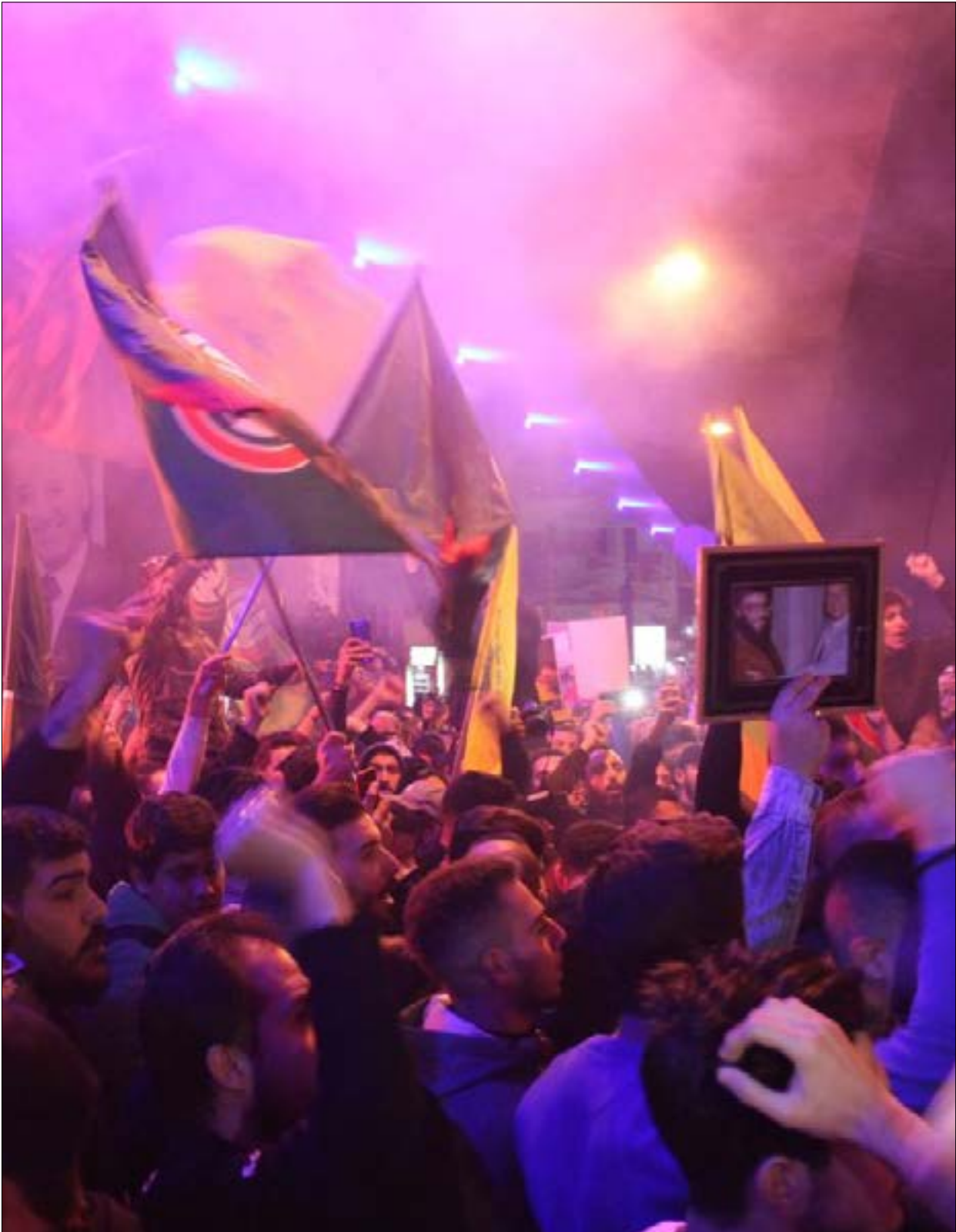
من اعتماد دماء اليه، التسيقية، في المشرقية بضاحية بيروت الجنوبية