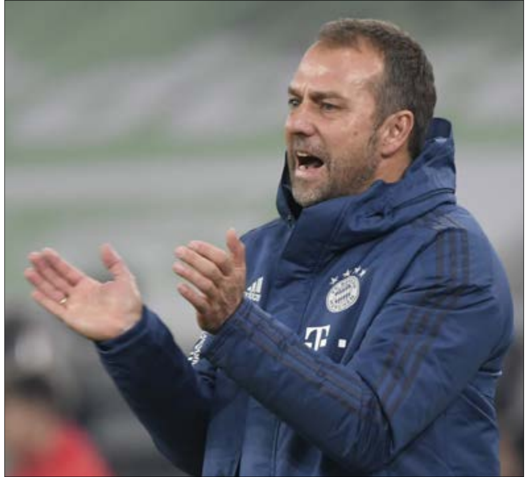
حقق فليك ثلاثة انتصارات متتالية مع البايرن

بـ«تريبيل دابل»، وسكّل هارندن نقطة مع 11 تمريرة حاسمة وتسع متابعات، وأضاف وستبروك 27 نقطة.