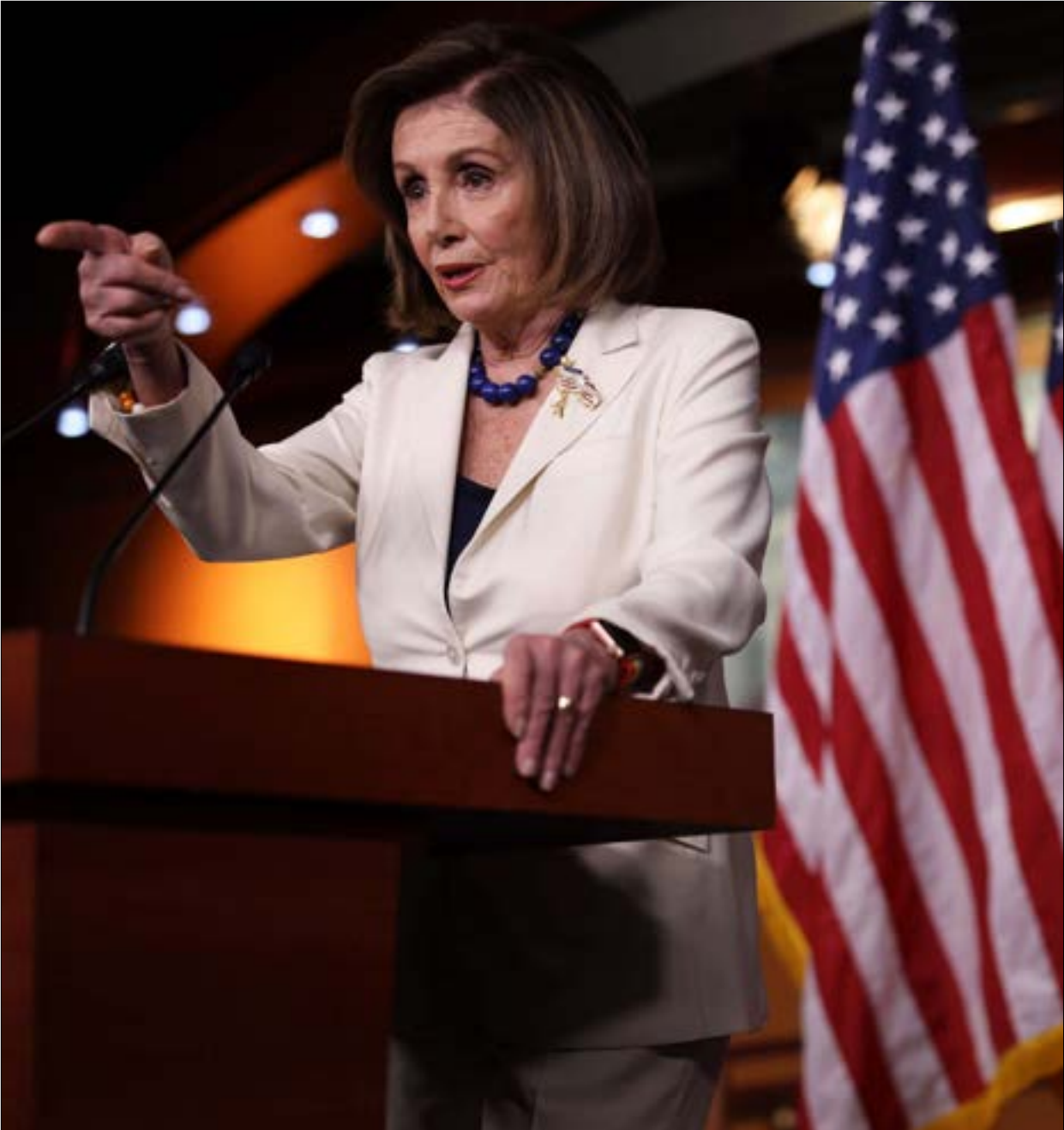
بيلوسي، الرئيس اساء استخدام سلطته لتحقيق منافع سياسية على حساب امتنا القومي

في المقابل ذلك، عبّر معظم أعضاء مجلس النواب الذي يهيمن دعم هذه العملية، الأمر الذي يرجّح أن يصبح ترامب ثالث رئيس في تاريخ الولايات المتحدة يُحاكم بهدف عزله. وفيما لم تعلن بيلوسي عن التهم، إلا أن ترامب يمكّن أن يواجه العزل في تهم الرشوة وإساءة استخدام السلطة، وعرقلة عمل الكونغرس وإعاقة العدالة. وقد أكدت بيلوسي