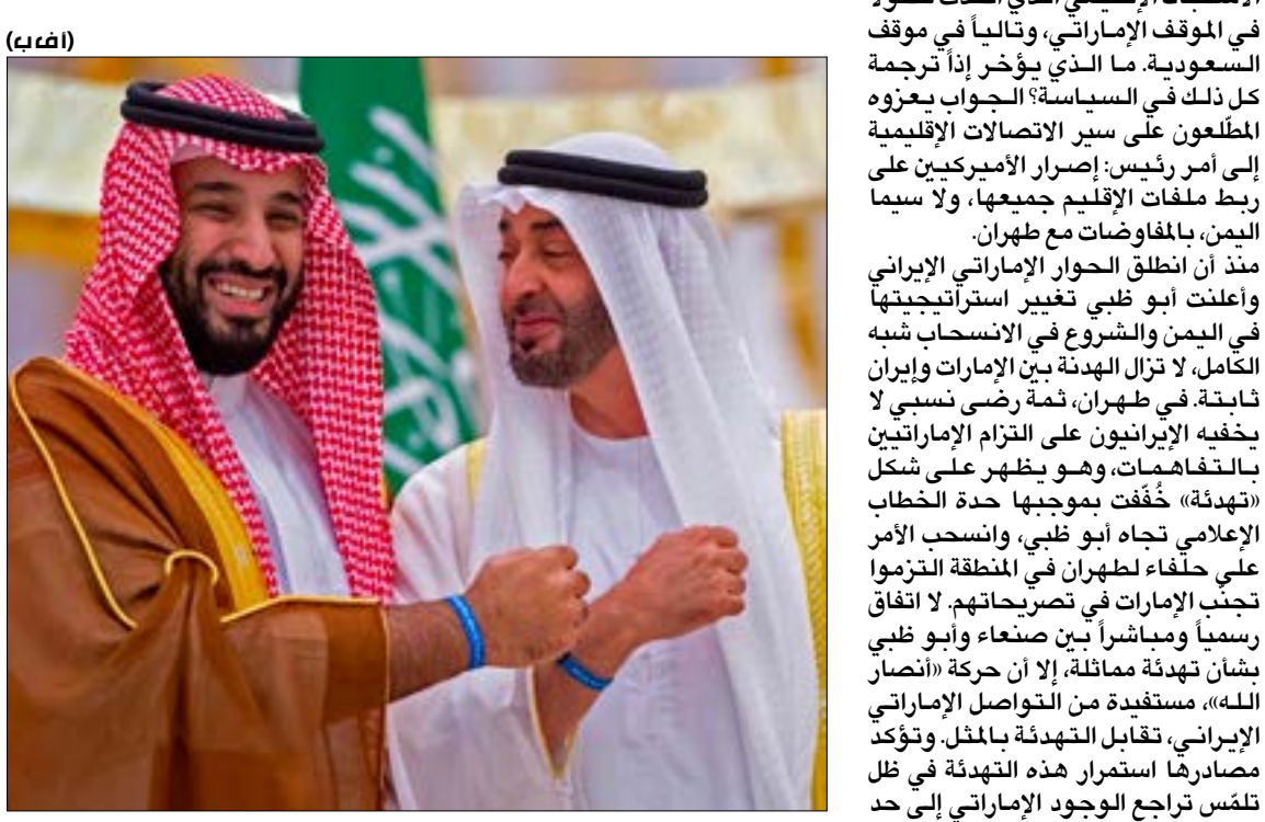
منذ أن انطلق الحوار الإماراتي الإيراني

تكاك تبدو الحرب في اليمن أنها بلغت النهاية، لإنهاء جدواها على الأقل، لكنها بانتظار إعلان «رسمي» بالأسر. يؤكد طرفا الحرب تقديرات نفد بان 80% على الأقل من العنف، من اشتباكات وغارات بالاستراتيجية الجديدة لولي عهد أبو ظبي محمد بن زايد. اقتناع رشخه اتفاق المشهد الراهن رسمته معادلات المواجهات في الأشهر الماضية، والتي بلغت ذروتها مع ضربة «أرامكو»، وكذلك ارتدادات الاشتباك الإقليمي الذي أحدث تحولاً في الموقف الإماراتي، وتالياً في موقف السعودية. ما الذي يؤخر إذا ترجمة كل ذلك في السياسة؟ الجواب يعزوه المطلعون على سير الاتصالات الإقليمية إلى امر رئيس: إصرار الأميركيين على ربط ملفات الأقليم جميعها، ولا سيما اليمن، بالمفاوضات مع طهران.