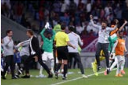
البحرين والسمودية في النهائي

انحصر لقب كأس الخليج لكرة القدم بين منتخبَي البحرين والسعودية بعد فوز البحرينيين على العراقيين بركلات الترجيح 3-5 بعد تعادل المنتخبين في الوقتين الأصلي والإضافي 2-2. أمس، في نصف نهائي البطولة التي تقام في قطر. سجل للعراق مهند علي (6) وإبراهيم بايش (18)، وهندي البحرين عبد الله الهزاع (14) ومحمد جاسم مرهون (2445). وفشل المنتخب العراقي بالتالي في الثأر لخسارته أمام البحرين في نهائي بطولة غرب آسيا الصيف الماضي، علماً بأن اللقب الخليجي يغيب عن خزائنه منذ عام 1988. وأشاد مدرب البحرين البرتغالي هيلو سوزا بأداء لاعبيه، معتبراً أنهم «كتبوا تاريخاً جديداً بوصولهم إلى المباراة النهائية. عودة الفريق والتعامل مع العراق مرتين كان أمراً جيداً، واللاعبون قدّموا مستوى كبيراً وأنا سعيد بالمستوى والنتيجة. ولدنيا