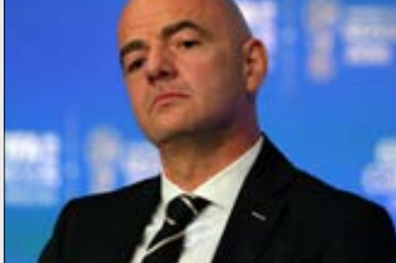
عضو في اللجنة الدولية لكرة القدم (فيفا)، سيصبح عضواً في اللجنة على إثر الدورة المقبلة للهيئة المقررة في كانون الثاني/يناير 2020. وأشار باخ إلى أنه سيتم طرح ترشيح إنفانتينو في كانون الثاني/يناير على التصويت أمام أعضاء اللجنة الأولمبية الدولية. إلى جانب بطل الجودو الياباني السابق، ياسوهيرو ياماشيتا، رئيس اللجنة الأولمبية اليابانية، والأميركي ديفيد هاغبرتي، رئيس الاتحاد الدولي لكرة المضرب. ولغث إلى أن ترشيح البريطاني سيباستيان كو، رئيس الاتحاد الدولي لألعاب القوى، لم يُقترح للدورة المقبلة بسبب «مخاطر تضارب المصالح». وقال «الباب لا يزال مفتوحاً أمام سيباستيان كو لطوكيو». حيث يمكنه الانضمام إلى اللجنة الأولمبية الدولية في الجلسة التي تسبق افتتاح أولمبياد طوكيو 2020.

انحصر لقب كأس الخليج لكرة القدم بين منتخبَي البحرين والسعودية بعد فوز البحرينيين على العراقيين بركلات الترجيح 3-5 بعد تعادل المنتخبين في الوقتين الأصلي والإضافي 2-2. أمس، في نصف نهائي البطولة التي تقام في قطر. سجل للعراق مهند علي (6) وإبراهيم بايش (18)، وهندي البحرين عبد الله الهزاع (14) ومحمد جاسم مرهون (2445). وفشل المنتخب العراقي بالتالي في الثأر لخسارته أمام البحرين في نهائي بطولة غرب آسيا الصيف الماضي، علماً بأن اللقب الخليجي يغيب عن خزائنه منذ عام 1988. وأشاد مدرب البحرين البرتغالي هيلو سوزا بأداء لاعبيه، معتبراً أنهم «كتبوا تاريخاً جديداً بوصولهم إلى المباراة النهائية. عودة الفريق والتعامل مع العراق مرتين كان أمراً جيداً، واللاعبون قدّموا مستوى كبيراً وأنا سعيد بالمستوى والنتيجة. ولدنيا