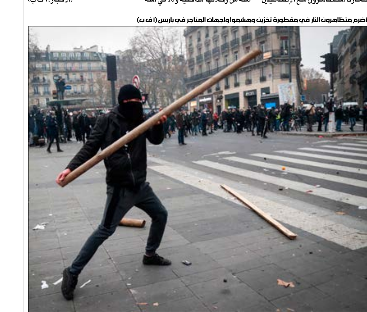
اضرم مظاهرات البار في مقطورة تخزين وهشّموا واجهات المتاجر في باريس

واعتبرت أن ماكرون «ومن خلال تعديل نظام التقاعد، يدرس مدى قدرته على مواصلة حركة الإصلاحية». (الأخبار، أ ف ب)