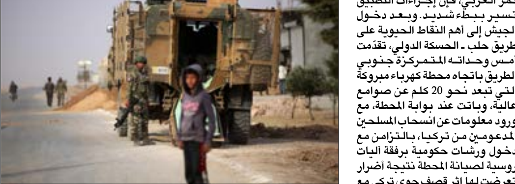
طيارين تركيين مع المجموعة التابعة لها انسحاب من «كربلاء مبروكة» ليحلها الجيش السوري