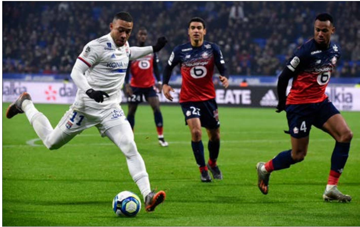
خسر ليون مباراة الأخيرة أمام ليد في الدوري

يسعى نادي ليون لاستعادة توازنه بسرعة عندما يحل ضيفاً على نادي نيم الجريح (اليوم 21:45 بتوقيت بيروت) في افتتاح المرحلة السابعة عشرة من بطولة فرنسا في كرة القدم. وسقط ليون أمام ضيفه ليل (صفر-1) الثلاثاء الماضي في افتتاح المرحلة السادسة عشرة، وهو يعوّل مع مديره رودي غارسيا على مواجهة نيم خاصة من الناحية المعنوية. كون الفريق تنتظره قمة حاسمة الثلاثاء المقبل أمام ضيفه لايبزيغ الألماني في الجولة السادسة والأخيرة من دور المجموعات لمسابقة دوري أبطال أوروبا. وكان ليون يمئى النفس بتحقيق فوزه الثالث على التوالي في الدوري