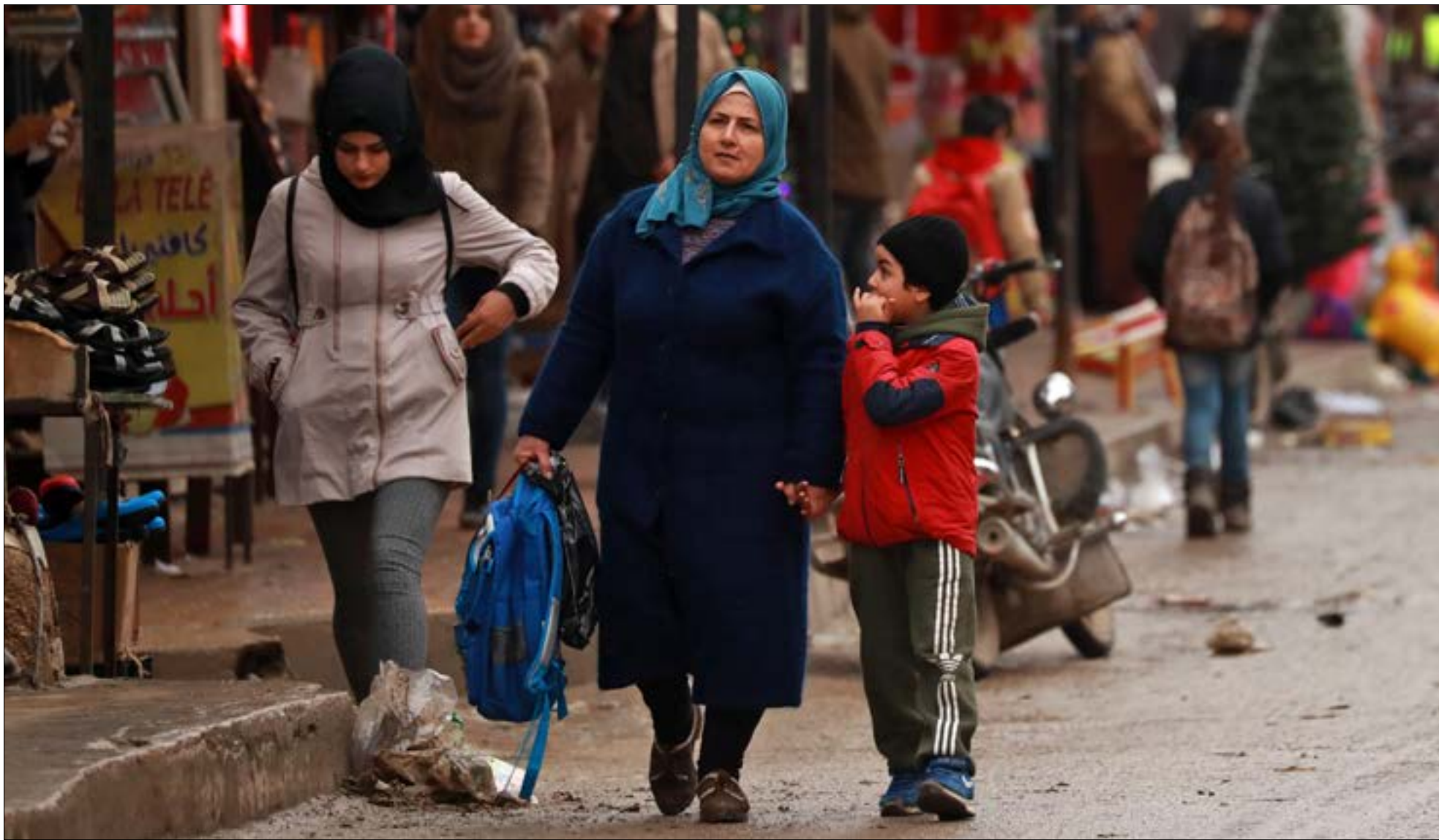
يحاول كبير من المعلمين والمعلمات إيجاد أعمال إضافية لسد احتياجاتهم اليومية

يعاني معظم مدارس القنيطرة من نقص في المدرسين. ووصل الأمر بمدير إحدى المدارس الابتدائية