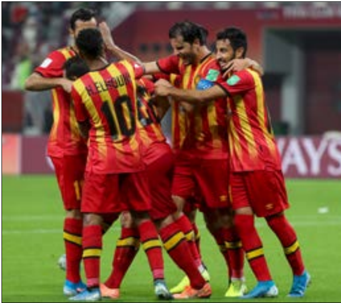
يستضيف الترجي فينا كلوب الكونغوليديمقراطي

الإصرار لديهم حاضراً لخوض فرقتهم مبارياتها على أرضها بعيداً من العاصمة. وفي طرابلس يمكن لمس هذا الأمر بوضوح، هناك على مقربة من ساحة النور حيث يحتشد المحتجون يومياً، يمزّ لاعب طرابلسي يدافع عن ألوان النجمة، هو لم يكن في المكان لمواكبة الاحتجاجات بل من لإلقاء التحية على أحد أصدقائه القادم من