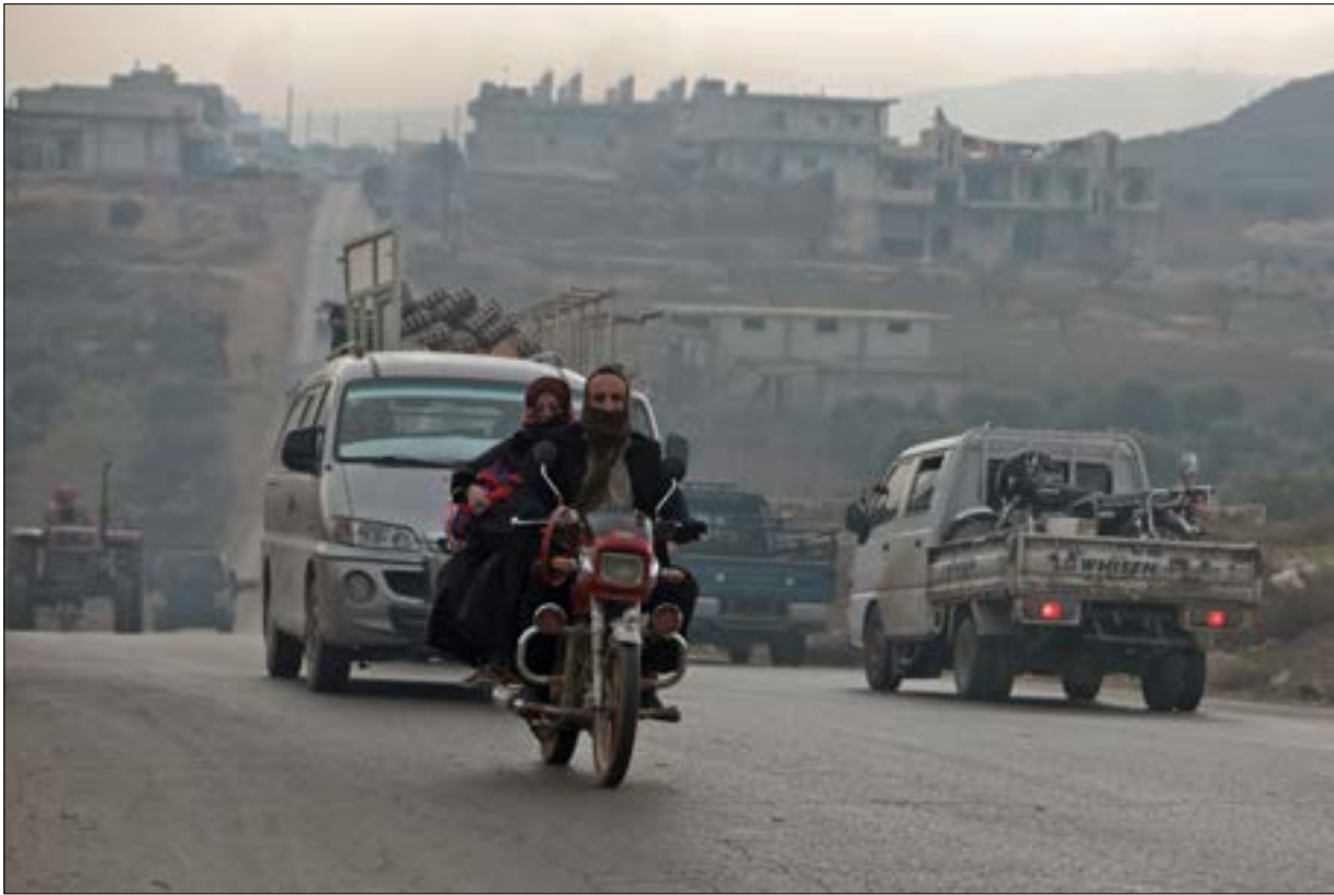
العمل: كلما لمست تركيا ان عناصرها من الإرهابيين يعانون الهزيمة تأتي إلى موسكو

على رغم الهدوء الذي سيطر اوله من امس على جبهات القتال في ريف إدلب الجنوبي، عقب إجتماع العسكري الذي عُقد في موسكو بين عسكريّين أتراك وآخرين روس لبحث وقف العمليات، عادت المعارك لتنشّد يوم امس، حيث سيطر الجيش على قرية وبلدات جديدة، وتمكّن من حدّ هجمات عديدة للمسلحين