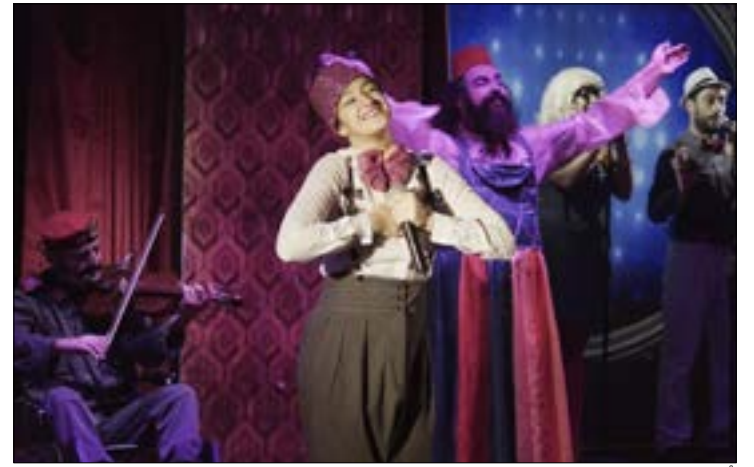
فُذم العرض في «المهرجان الدولي بالحمامات» في تونس