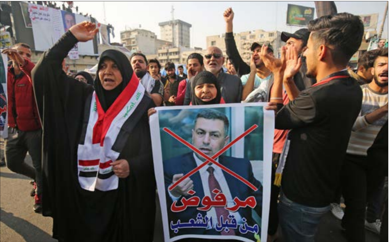
وصف قيس الخزعلي ترشيح اسعد العبداني لرئاسة الوزراء، بالكارهي، (اف ب)

ختمت المقاومة الفلسطينية عام 2019 بتكرار إهانتها رئيس الوزراء الإسرائيلي، بنيامين نتنياهو، الذي عبّر عن غضبه من ذلك بقصف مواقع المقاومة في قطاع غزة، ملحقاً إياه بمزيد من التهديدات والتوعدّ بالعودة إلى سياسة الاغتيالات، في وقت أعلنت فيه «الهيئة العليا لمسيرات العودة» تعبير دورية المسيرات خلال العام المقبل. وفي ليلة أول من أمس، أحلّ الأمن الإسرائيلي، نتنياهو، من منضمة انتخابية لحزب «الليكود» في مدينة عسقلان المحتلة، في تكرار لما حدث قبل ثلاثة أشهر، عندما أطلق صاروخ من غزة تجاه المدينة نفسها عند الساعة التاسعة مساءً، وهو التوقيت عينه الذي يتكرر فيه إطلاق الصواريخ بصورة متقطعة منذ أشهر. وكان نتنياهو، في المرة الأخيرة، برفقة كبار المسؤولين في «الليكود»، ومن ضمنهم الوزراء ميري ريغيف وأمير أوحانا وغيل غمليئييل،