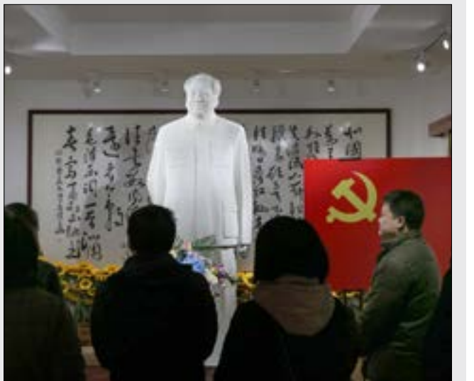
متحف لمانو سبي تونغ احتفالاً بعيد ميلاده الـ 126 في نانونغ شرقاً إقليم جيانغسو