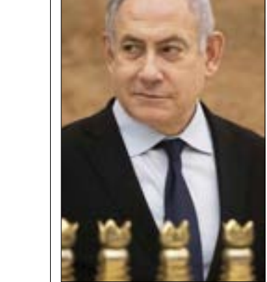
سوزور نتنياهو والسنط لتحمها على جميع التضخعات والبورر الاستيطانية

في المقابل، لم يُخفِ نتنياهو حقيقة أنه يحاول انتزاع شرعية شعبية في مقابل الشرعية القضائية، وهو ما أفصح عنه في مقابلة مع إذاعة الجيش، قال فيها إن «الشعب هو من يقرر من الذي سيقود الحكومة المقبلة... من يقرر من سيقود الليكود هم أعضاء الليكود فقط»، وفي الاتجاه نفسه، سخر مكتبه، امس، من اقتراح ساعر تعيين نتنياهو رئيساً للدولة، معتبراً أن «مناورة ساعر تشير إلى أنه يسير مع خط الإعلام واليسار للتخلص من رئيس الحكومة برئاسة البلاد، هذا ليس الوقت للانسحاب في الليكود وإنما للوحدة حول نتنياهو». أيضاً، توجّه رئيس حكومة العدو إلى الحكمة العليا كي تترفّع عن هذه النقاشات حول أهليته لتشكيل الحكومة المقبلة، مستعيناً بآراء من سّهام «كبار الفقهاء الدستوريين من غير المؤيدين لليكود، والذين شددوا على أنه يجب الوثوق بالديموقراطية. في الديموقراطية، الشعب من يقرر». كما لم تفته الإشارة إلى عزمه على ضمّ غور الأردن وشمال البحر الميت، حيث جدّد نيته التوجّه إلى الولايات المتحدة وحثّها على الاعتراف بالسيادة الإسرائيلية على جميع التجمعات والبورر الاستيطانية في الضفة المحتلة. وهو بذلك يريد استمالة قاعدة «الليكود» المتطرفة.