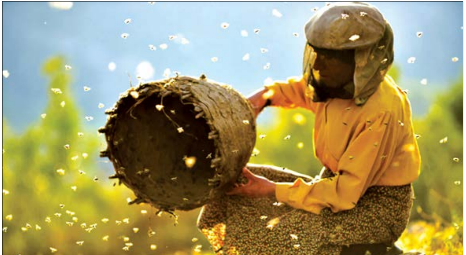
«أرض العسل» تحفة بصرية عن الحياة في الطبيعة

وعسله. مناظر الطبيعة في شمال مقدونيا عند الصباح وعند الغسق وفي الليل. لا يمكن الهروب من الجو الشعاعي في الفيلم، وقصته المؤثرة حول ضرورة معاملة الطبيعة باحترام وعناية، خاصة في هذه الأوقات التي تعلق فيها الحناجر في أكثر من مكان من أجل الحفاظ على الطبيعة. يظهر الوثائقي بوضوح ما يجب القيام به للعودة إلى الطبيعة، موضحاً أنه خيار لا يمكن تجاهله. فالعسل ليس مجرد منتج نأخذ من رف السوبرماركت. العسل هنا شيء رومانسي ومرير تقدمه لنا الطبيعة من أجل التوازن. يذكرنا بأن الطبيعة أصبحت منزعة منا، لكنها أيضاً تنادينا للعودة إليها.