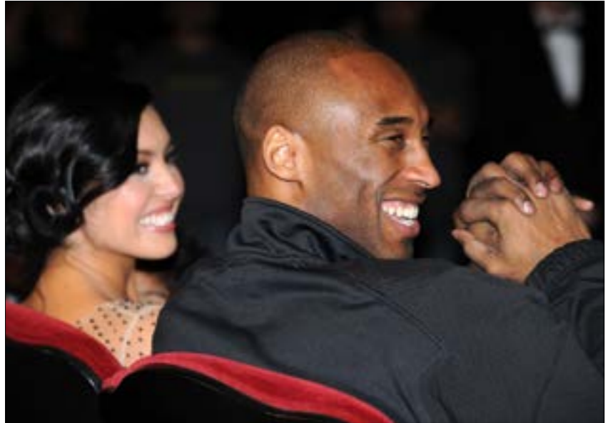
توفي النجم الأميركي عمّ عمر 41 عاماً

النجم الأول الكامبروني جويل امبييد للمرة السادسة عشرة توالياً، لإصابة في إصبع يده. إضافة إلى غياب جوش ريتشاردسون لإصابته بالتهمة بليكرز في آخر ست مباريات، الساق.