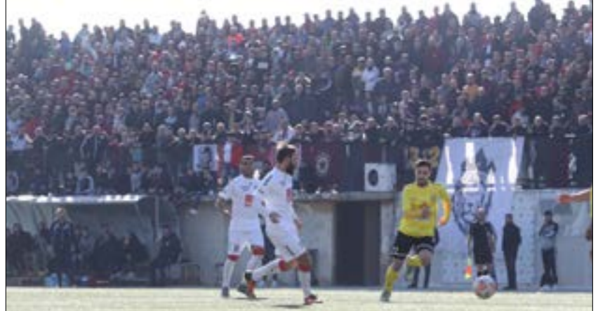
أحدث أحداث مباراة النجمة والبرج صصوية إقامة ابي مباراة دون حدث قوه املية (عدنان الحاج علي)

الناشئين لاحقاً، أما المشهد الثاني فأنجبت أن إقامة دوري بحضور الجمهور أمر صعب جداً بعد المشهد المؤسف الذي انتهت إليه مباراة النجمة والبرج يوم السبت. بين ملاعب العهد والأمنصار وبحمدون والنجمة كانت كرة القدم اللبنانية تنصدر المشهد الكروي الذي لا يزال يحاول أن يحافظ على ما تبقى منه في ظل الأزمة الخائفة التي يمر