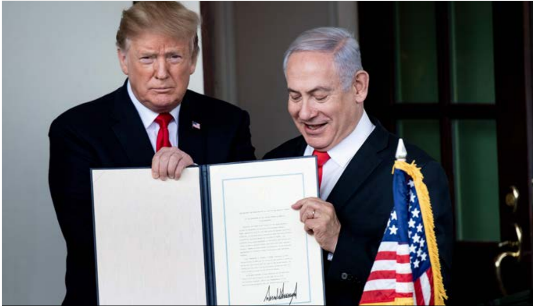
راهب تراهب على فوزه بولاية ثانية كمن يمدّ خالها له الضبط على الفلسطينيين (أضرب)

الثلاث الماضية، بوصفها هدايا مجانية لكيان الاحتلال. من هنا، فإن عودة الصفقة إلى واجهة الأحداث عالمياً، ولا سيما في هذا التوقيت، تؤشّر إلى المساعي المتجددة لتعويم نتيناهو ومعه ترامب نفسه. تفاصيل هذا الإعلان الإسرائيلي، والتي أكثر من مرة ولأكثر من سبع، ستخرج يوم غد الثلاثاء إلى الضوء، وستطرح الجانب السياسي من الصفقة بعدما تمّ الكشف عن جانبها الاقتصادي منه إلى انتشار حليفه بنيامين نتيناهو من إزماته الداخلية. لم يحدّ طرح الصفقة غايية في حدّ ذاته. اجتذات القضية الفلسطينية بدءاً، عملياً، منذ وطلتّ قديما دونالد ترامب البيت الأبيض، بداية بإعلانه الموقف المحتلة عاصمة لإسرائيل ونقل سفارة واشنطن إليها، وصولاً إلى مصادقة على ضمّ الجولان السوري المحتلّ وما تاله من شرعة الإدارة للاستيطان، وغيرها من الخدمات التي جرى تقسيطها على مدى السنوات