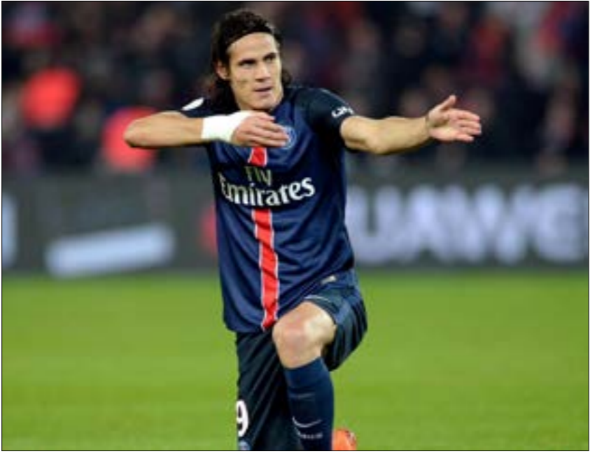
كافاني لا يريد البقاء في باريس

صفات البطل في ظلّ النتائج والأداء اللافين. يُعرف بواش في الوسط الكروي بتفضيله العنصر الشباب على