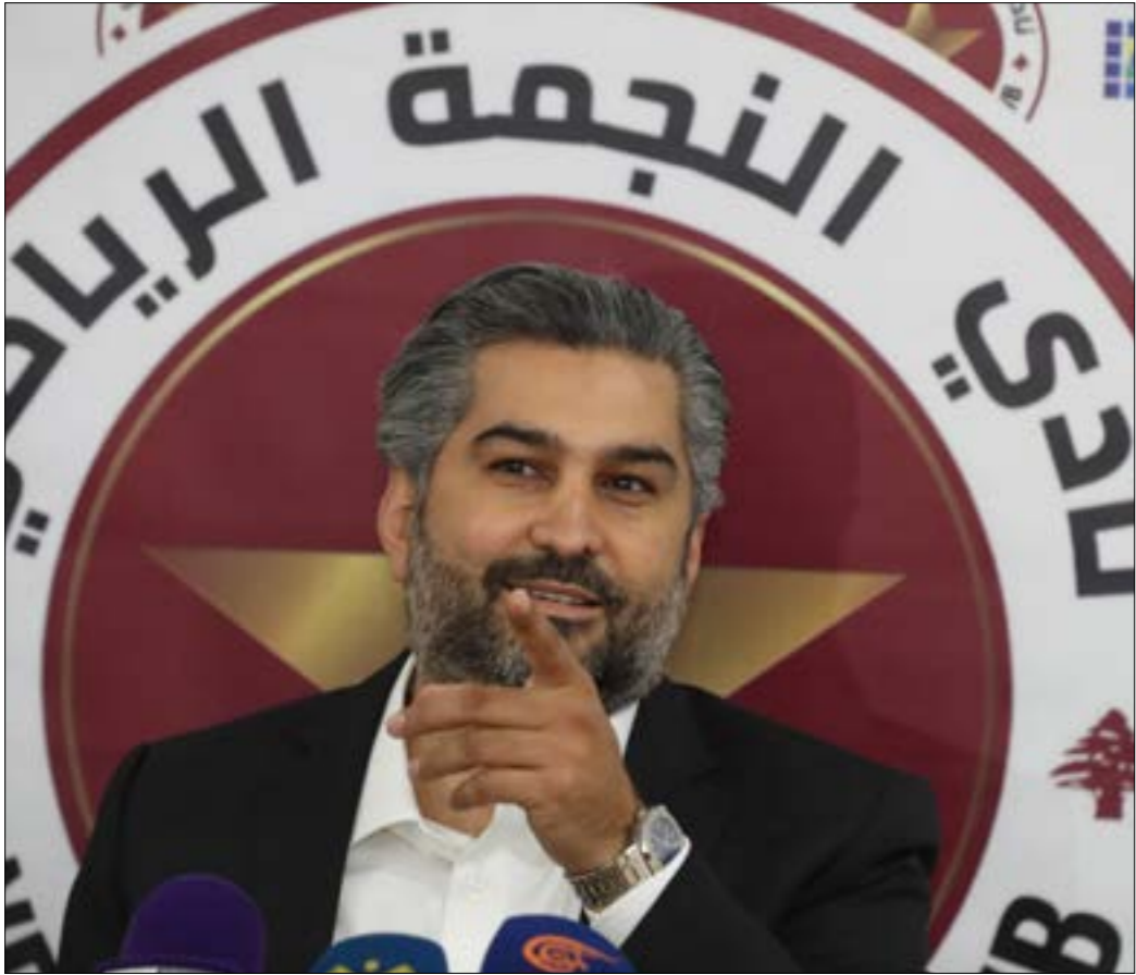
(معدّات الحاج علي)