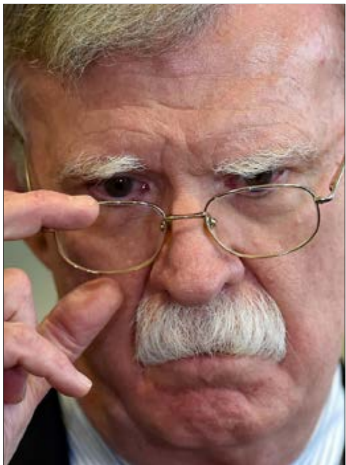
أكد بولتون أن ترامب أراد تجنيد مساعدة عسكرية لوكراييا التي لن تفتح تحقيقاً بشأن إبادة

القيادة الجمهوريون منع استدعاء أي شاهد جديد، يبدو أن الديموقراطيين قد يلجأون إلى سلوك طريق آخر ربما يسمح بالاستماع إلى الإفادات. فقد أفادت صحيفة «نيويورك تايمز»، بيان الجمهوريين لا يملكون الحق في اتخاذ قرار بهذا الشأن. وأشار أستاذنا القانون في جامعة «جورجتاون»، نيل كاتنال وجوشوا جيلتزر، وعضو الكونغرس السابق ميكي إيوارد، في مقال مشترك، إلى أن رئيس المحكمة العليا جون روبرتس الذي يدير محاكمة ترامب أمام مجلس الشيوخ يملك هذه الصلاحيات. بالتالي، لم يعد يتعلّق الأمر بحاجة الديموقراطيين إلى جمهوريين «معتدين» للتصويت على استدعاء الشهود، بحسب ما كان يدعي محامو ترامب، وبدلاً من ذلك، تمنح قواعد محاكمة العزل - مثل غيرها من أنظمة المحاكمة - صلاحية كبيرة للقاضي، تسمح له بإصدار الاستدعاءات. أما الأمر الأكثر أهمية، فهو أن الأمر يتطلب ثلثي الأصوات - وليس الأغلبية - في مجلس الشيوخ، لإلغاء كل ذلك، وهو ما لا يمكن للجمهوريين تحصيله في الوقت الحالي» (الأخبار)