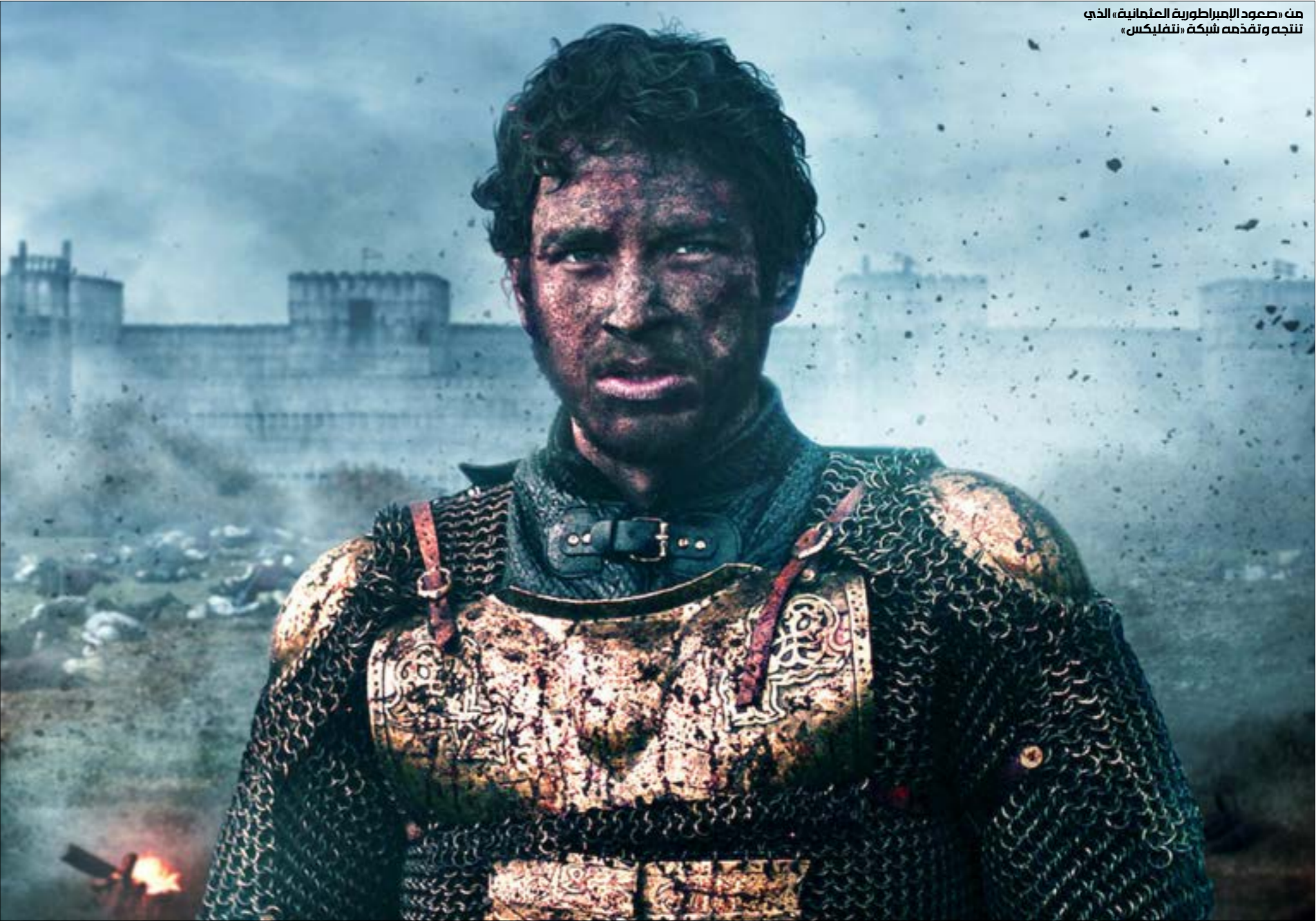
من صعود الإمبراطورية العثمانية، الذي نتجته وتقدمه شبكة نتفليكس،