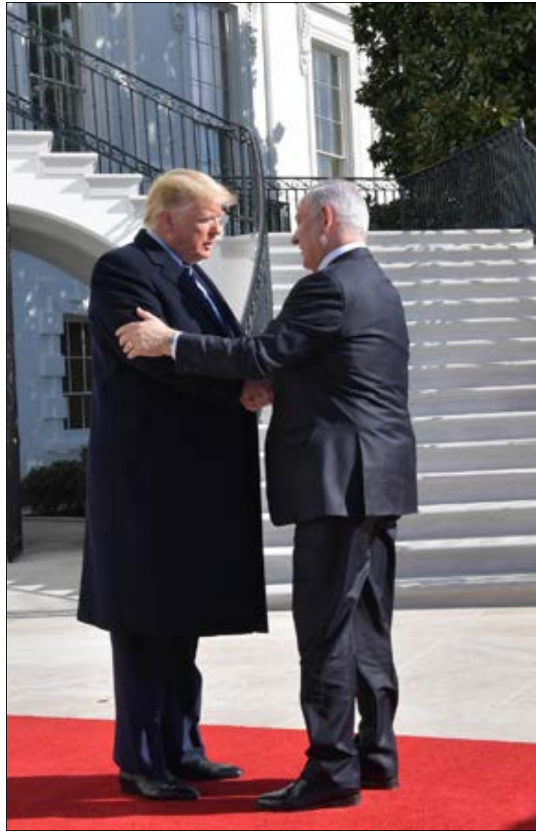
ترامب: هي خطة مهمة للشرف الأوسط سيجبما نلتقيها وخصم (غانس) (الناضول)