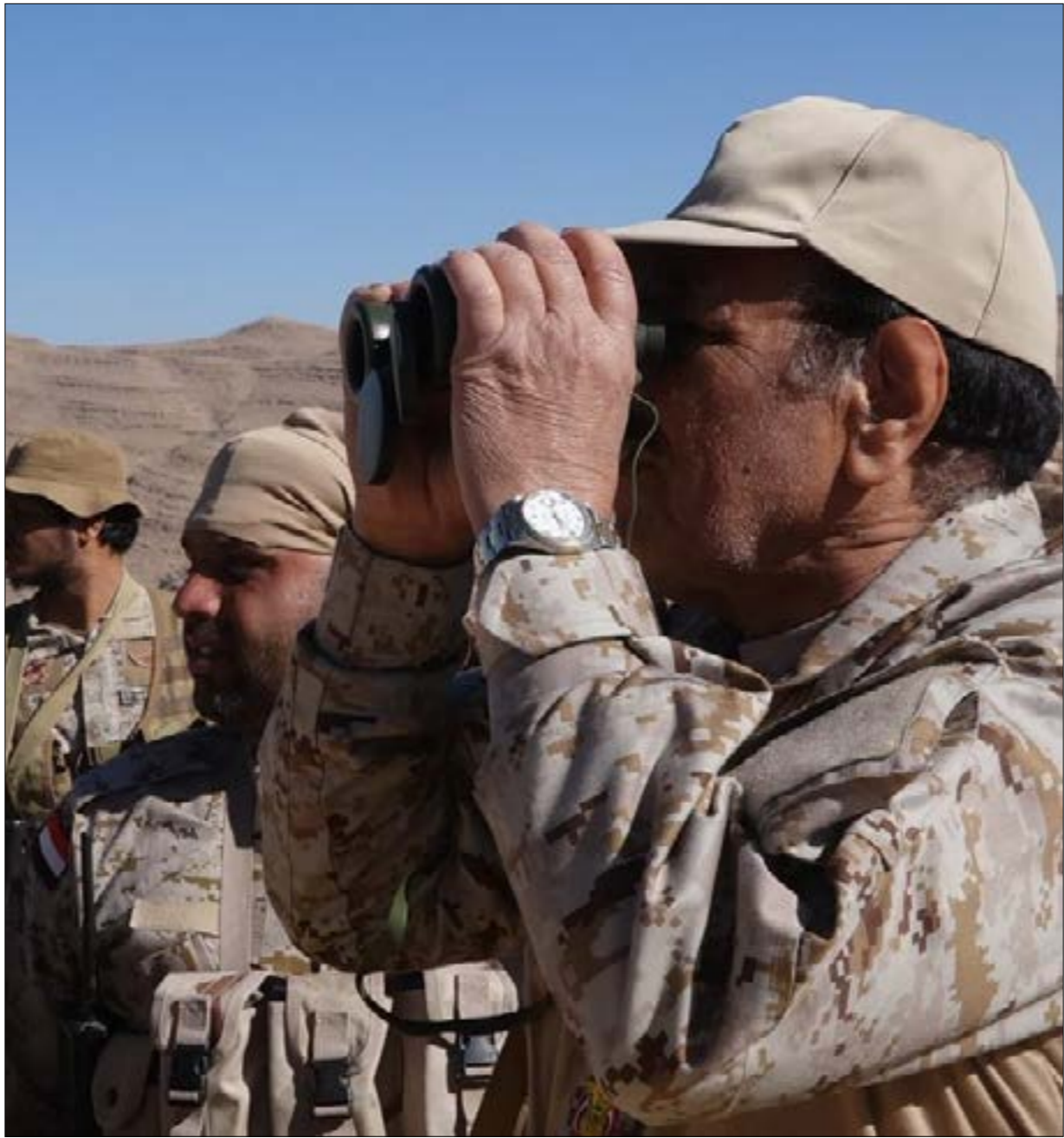
صه الجنرال علي محسن الأحمر مدينة مارب أمس فاقاما من الرياض (الرياض)

مارب والبيضاء. وكان «داعش» أعلن الأربعاء تبنيه عملية هجومية على مواقع تابعة لقوات صنعاء، وتمكّنه من قتل عدد منهم وتدمير مزرعة. وقالت وكالة هادي، المتهممة من قبل حركة الأخير هاجموا موقعاً عسكرياً تابعاً لـ«الحوثيين» في منطقة حمة البقر في قيفة بالبيضاء، وذكرت الوكالة على «تويتر» أن التنظيم في