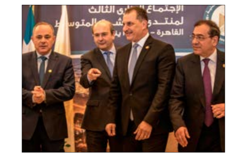
السياسة المصرية... الإسرائيلي في ملفات عدة والسياسة الطائفية بيني موقفاً بارداً للقاهرة من الصفقة (ف ب)

المتحدة دور الوسيط في الأزمة بين القاهرة وأبيس أبايا، ما جعل الموقف المصري حكماً مكبلاً، خاصة أن الحديث الدبلوماسي المصري هو عن «ضغوط أميركية كبيرة» على إثيوبيا التي هددت بفرض سياسة الأمر الواقع في بدء تخزين المياه من دون اتفاق. ولذلك، من السهولة أن تقول مصر إنها لا ترغب في إثارة أزمات مع واشنطن، خاصة مع ترتيب زيارة للسياسي إلى العاصمة الأميركية قريباً. من جراً هذا، تنقل المصادر أن الإجماع هو على تخريج أي تحرك للاعتراض «في إطار عربي لا مصري منفرد» مع «التنسيق مع باقي الدول العربية، خاصة السعودية والإمارات». ورغم حدوث مشاورات مع السلطة الفلسطينية في الأيام الماضية، تقول المصادر إن القاهرة «سترتخب بأي اتفاق من شأنه إنهاء الصراع العربي - الإسرائيلي في إطار سلمي، مع الحفاظ على حقوق الفلسطينيين»، وهو ما يفترض أن يتضمنه البيان الرسمي المتوقع صدوره من الخارجية المصرية بعد إعلان تفاصيل الصفقة.