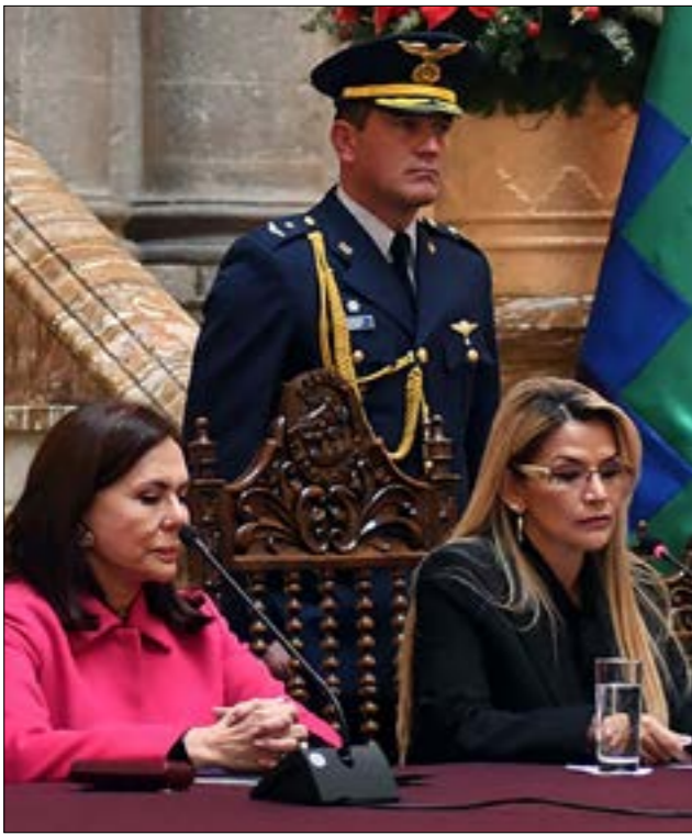
ميسا: أنيز لم تُعيّن لترشّح نفسها في الانتخابات الرئاسية