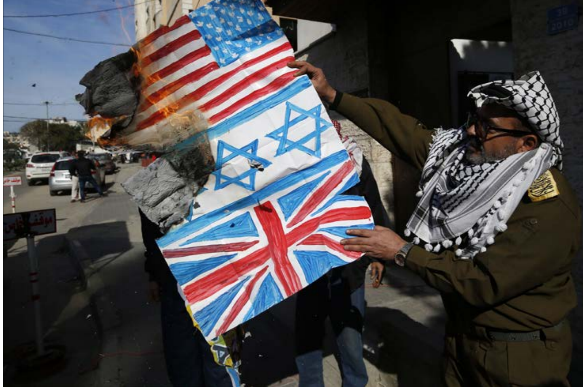
دعت الفصائل إلى اعتبار الثلاثاء والاربعاء «أيام غضب في جميع الساحات والشبابك ميداني وأسم» (ف ب)

لم يكن إعلان دونالد ترامب قراره نشر خطته لتسوية القضية الفلسطينية، «صفقة القرن»، مساء اليوم (الثلاثاء)، مفاجئاً للفلسطينيين الذين قرروا التصعيد في مواجهة الخطة ومنع تمريرها، مع انه تغيب عنهم، رسمياً وشعبياً، الرؤية الواضحة لكيفية المواجهة بعيداً عن الاقتصار على الرفض والاستنكار