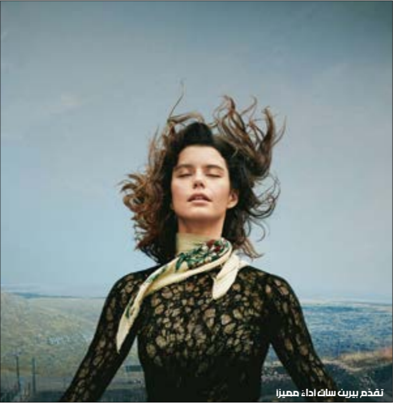
تقدم بيريت سلك أداء مهيما

بعد فترة وجيزة من إطلاق مسلسل Masum (البريء - ثماني حلقات)، كشفت نتفليكس عن أول إنتاجاتها الأصلية الناطقة بالتركية: Hakam Muhafiz، المعروف دولياً باسم The Protector. على الرغم من اختلاف الأراء حول هذا العمل، غير أنه لا يمكن نكران نجاحه بعد عرضه في 190 بلداً وبلغات مختلفة. عشر حلقات تنتج شابا يعمل في «الغاز الكبير»، في إسطنبول، يذهب في مهمة لإنقاذ المدينة من عدو خالد. ولعل شعبية هذا النوع من