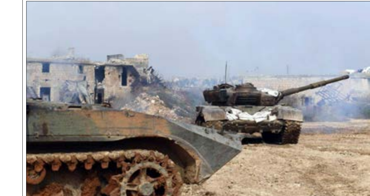
سعت الجيش الي تثبيت المسلحين عبر فتح 3 محاور هجومية، تقدم في واحد منها باتجاه معرة النعمان

البحر الأحمر، فقد نسفت الإنجازات الحالية في الجوف ومارب مشروع الأقاليم الذي هدف إلى تقسيم اليمن فدرالياً إلى ستة أقاليم هي: أزال، الجند، تهامة، سبأ، حضرموت، عدن. المشروع مزرّ عام 2014 خلّسة بعد أن دبر بليل أثناء الحوار الوطني في صنعاء من دون موافقة وتوقيع «أنصار الله» و«الحراك الجنوبي». تعمّد مُعدّو المشروع (الأميركيون والسعوديون) فرض المشروع عبر الرئيس المنتهية ولايته عبد ربه منصور هادي، من دون نقاش مع المكثّون اليمنية. المشروع حصر «أنصار الله» في إقليم أزال المتكوّن من محافظات: صنعاء، عمران، صعدة، نزار. وهو من أكثر الأقاليم كثافة سكانية (زيد) ولكنه حرم بشك متعمّد، على عكس باقي الأقاليم، من الإطالة على البحر الأحمر ومن الاستفادة من الموارد النفطية والغازية، سواء المستخرجة من مارب أو تلك المكتشفة في الجوف.