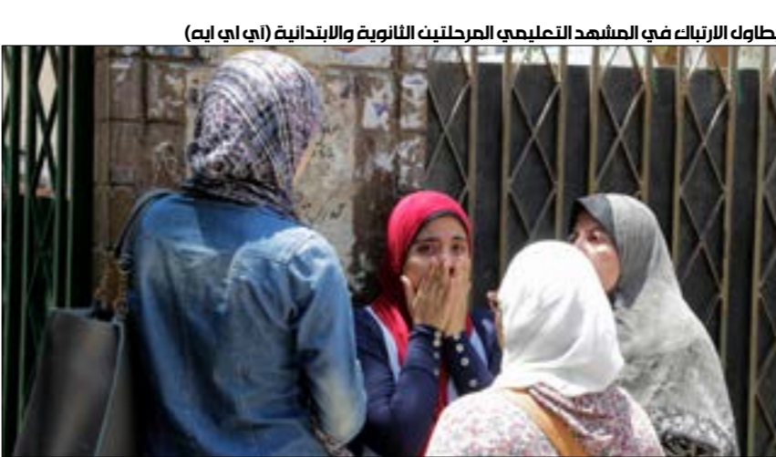
يتاول الأرباب في المشهد التعليمي المرططين الثانوية والابتدائية (أي إن إيه)

يكن يُعرف هل هذه النتائج ستكون ضمن التقييمات التي تحدد الكلمة التي يلتحق بها الطالب أم لا. فمَ عدل