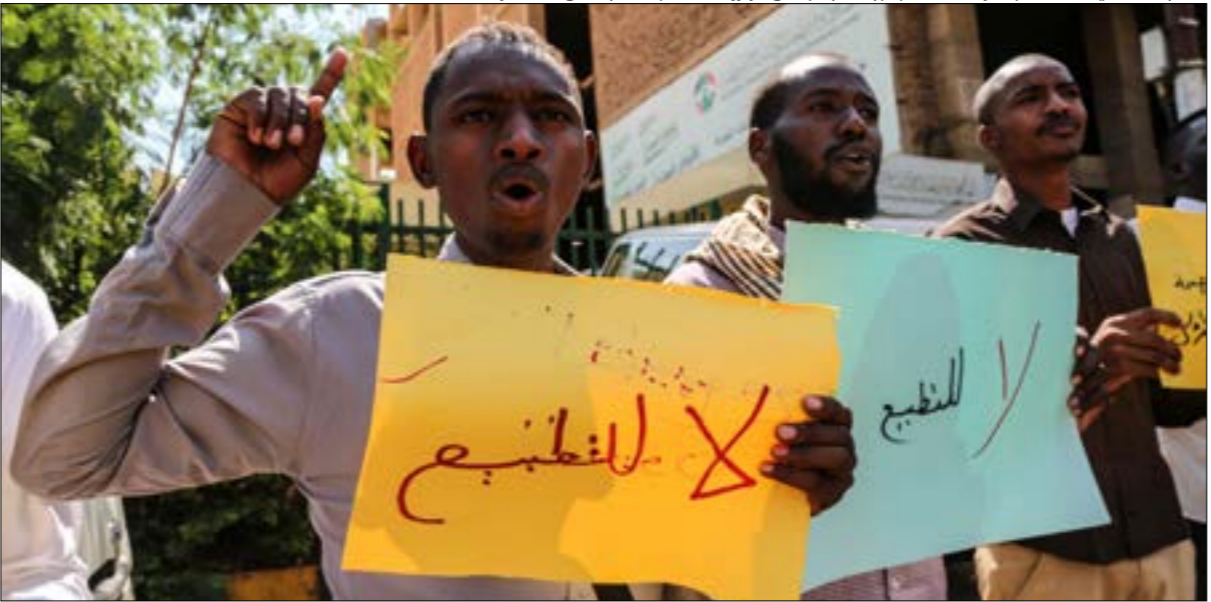
نظم عدد قليل من الشباب وقفة احتجاج امام مجلس الوزراء، خلال اجتماع امس

التي حددت مهام المجلس السيادي، التي ليس منها قطعاً إدارة العلاقات الخارجية التي صنفتها الوثيقة أنها ضمن مهام الجهاز التنفيذي، أي الحكومة». كما رأوا أن خروج مشتهين سلوك البرهان بسمار عبد الفتاح السيسي قبل وصوله إلى كرسي الرئاسة في مصر. ويستدلون على ذلك بأن اللقاء السري وبحث مستغلين الوضع الاقتصادي المتآزم،