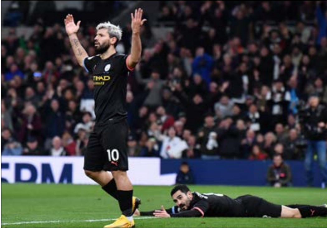
خسر سيتي 6 مرات

هو الموسم الاسوء للبيب غوارديولا في الدوري الإنكليزي الممتاز. المدرب الذي حوِّله بطولته البريميرليغ إلى تحصيل حاصل بـعقل اسلوبه الهجومى وبذخه في استخدام اللاعبين. يحل هذا الموسم المركز الثاني مبتعداً عن المتصدر ليفربول بـ22 نقطة حتى الجولة 25. مشاكل فنية وإدارية عديدة عصفت بالنادي. أصعب «ظرياً» حظوظ سيتي في تحفيّف اللقب بالنظر إلى أداء ليفربول الاستثنائي. فيما عأقت الامال على كأس الاتحاد الإنكليزي ودوري الابطال رغم صعوبة المهمة. سيتي يفرغ ومعه غوارديولا