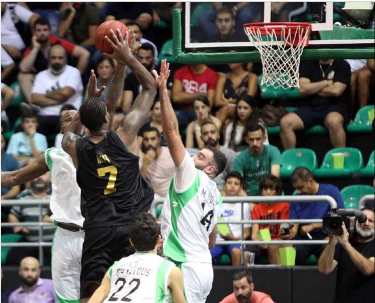
ينظر الجمهور السلوي ما سينتج من اجتماعات الأندية مع لاعبيها