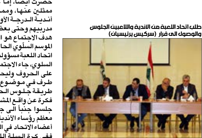
طلب اتحاد اللمبة من الأندية واللاعبين الجلوس والوصول الى قرار (سركيس برتيسان)

اجتمعت عائلة كرة السلة اللبنانية اهنس في فندق «لقاء» الحالي. اتحدّ وندية ولاعبون وإعلام حضروا جلسة حوار دامت ما يقارب الساعتين، وانتهت الى تحديد يوم 14 شباط المقبل موعداً لتقديم الأندية الجواب حول السؤال: هل تريدون اللعب هذا الموسم؟