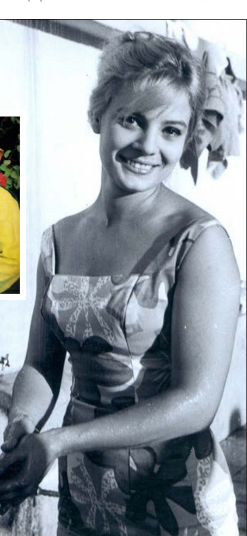
نادية لطفي في فيلم «المومياء»

كانت نادية لطفي بخصار واحدة من أجمل وأبرع نجمات العصر الذهبي للسينما المصرية خلال الخمسينيات والستينيات والسبعينيات، بالإضافة إلى ذلك كانت واحدة من أرقى هؤلاء المصريين كلها، يسحره وجزائريته وغوضه الروحاني، في تكرر لما