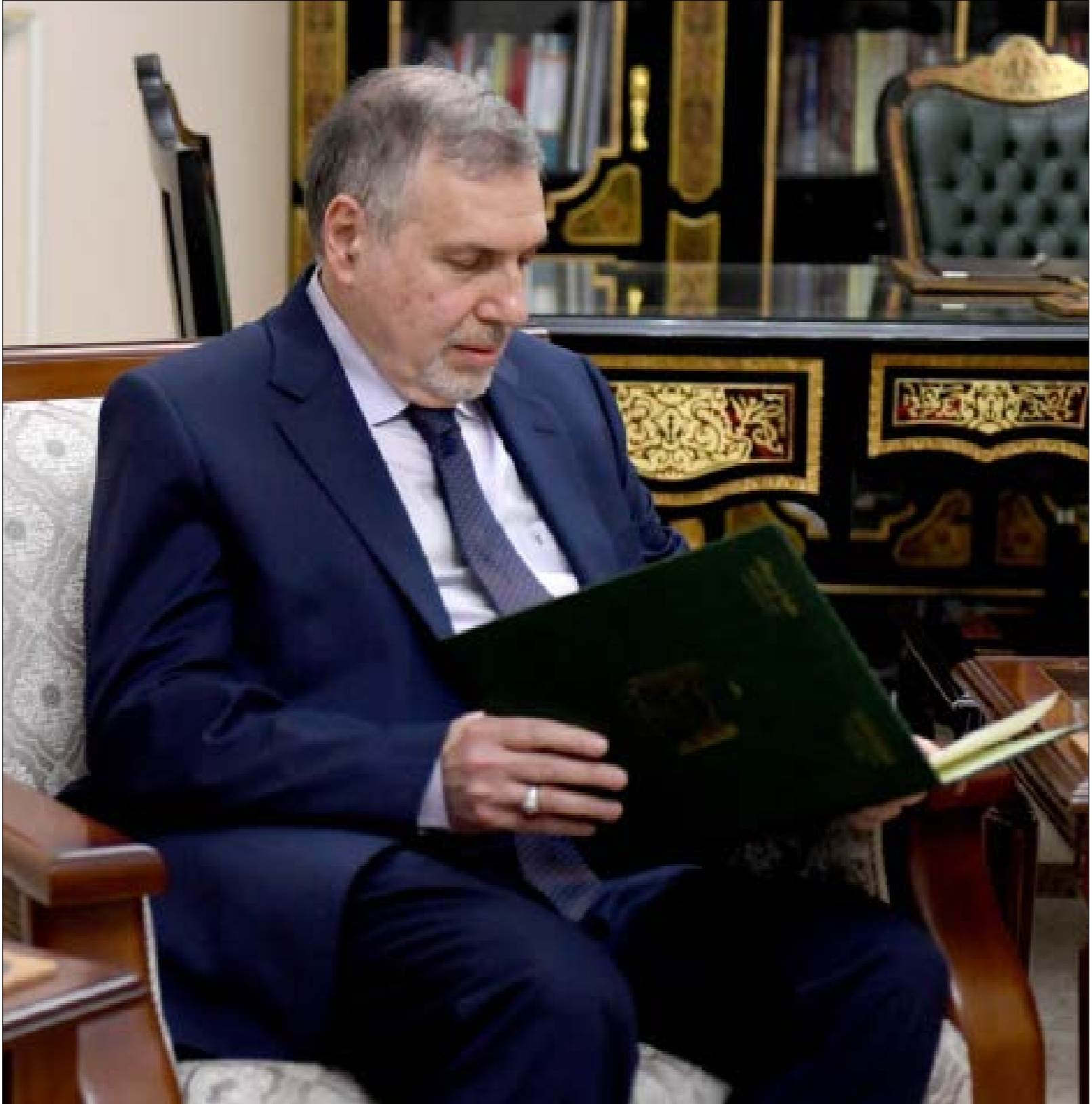
أية تأليف علاوي لحكومة العديدة ستكون «مشابهة»، للآية تأليف حشوات دياب لحكومة في لبنان (الأسواه)

وتسهيل مسار اختيار وزراء تكنوقراط، ورفض «تجديد الثقة» لأي وزير سابق. وذلك إضافة إلى تعزيز الحضور السنوي في الفريق الحكومي التركيبي، وبناء مساكّن من الطُوب للنازحين». وقال: «أردنا إنشاء منطقة آمنة من أجل النازحين، وهذا ما نفعله بخسائر». وردا على سؤال في ما إذا كانت تركيا تخطط للقيام بعملية واسعة في إدلب، ذات اسم محدّد، على غرار عملية «منع السلام»؟ قال إدوغان: «تقوم الآن بالمرحلة الأولى من عملية إدلب، وكما تعلمون تحدثت عن ذلك الجمعة، رأس العين وتل فرودس على محور أبو الظهور. كذلك سيطر على بلدة مردبخ، وتل مردبخ، جنوبي مدينة سراقب. وتمتدّ غرب الطريق الدولي