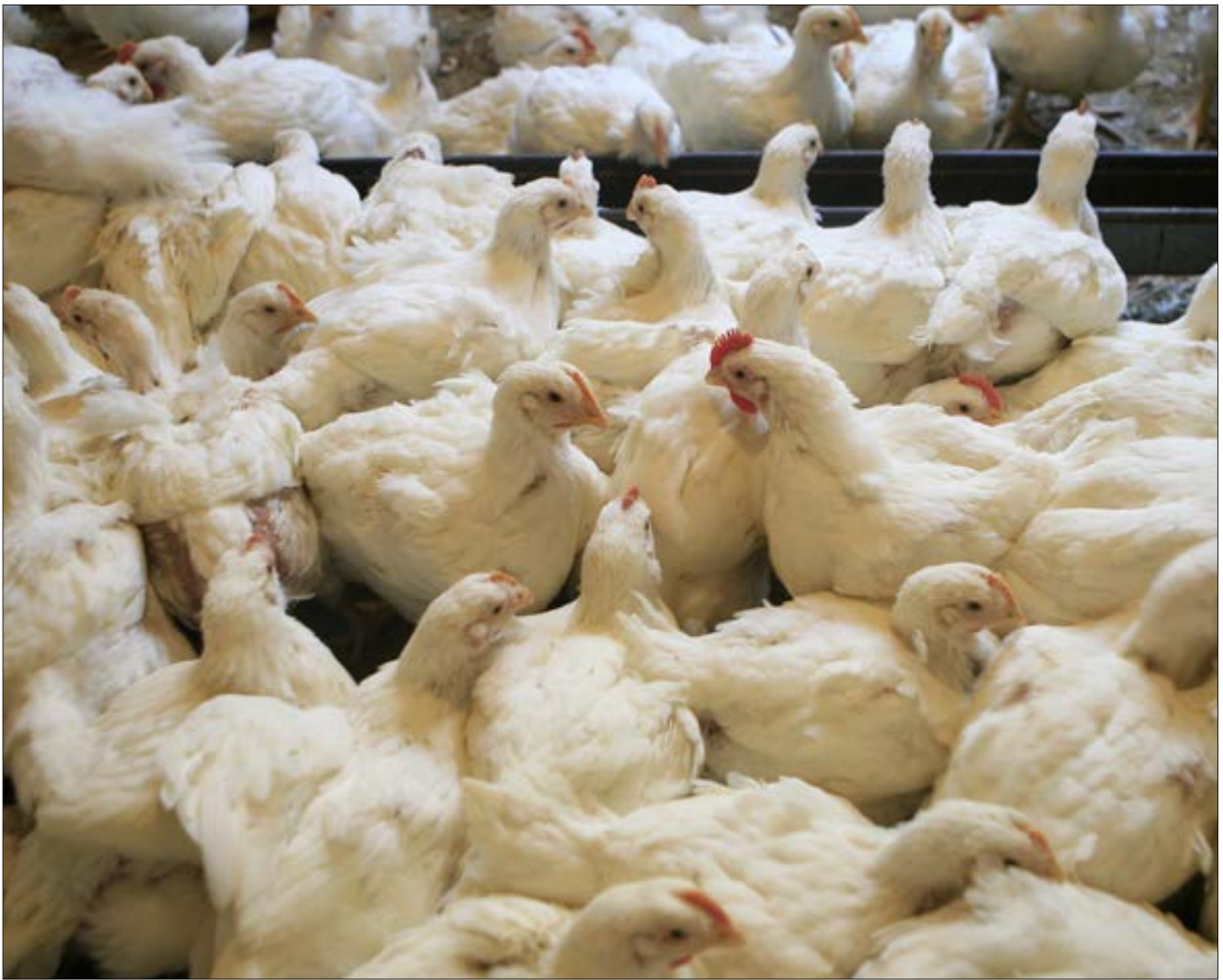
من المفترض أن تبين نتائج العينات حدود استخدام الكولستين، في مزارع الدواجن (مروان بو حيدر)