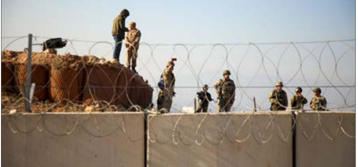
كشفت إدوغان أن «تركية سعت من التقدم إلى عمق 30 – 40 كلم عن الشريط الحدودي داخل سوريا»

المصادر، إن الخيار النهائي كان محصوراً بين علاوي ورئيس جهاز الاستخبارات مصطفى الكاظمي. أحد «الأساسيين» في مكتب عبد المهدي، سعي، ولـ«مصلحة» خاصة، إلى الترويج للكاظمي لدى الإدارة الإيرانية، لكنّه فشل في ذلك. بادئ الأمر، كانت طهران «فلكة» إزاء ترشيح علاوي، في ظل غياب «رجلها الأول» قائد «قوة القدس» في «الحرس الثوري» قاسم سلیماني، الذي اغتالته قوات الاحتلال الأميركي مع نائب رئيس «هيئة الحشد الشعبي» أبو مهدي المهندس، ورفاقهما، في بغداد مطلع العام الحالي. ثمّ عادت الإدارة الإيرانية و«مشّت» بخيار علاوي، على قاعدة أنّه «الأنسب... والمسار الأفضل للخروج من الأزمة الراهنة»، فـ«هو مخرج بصناعة عراقية، ونتيجة تقارب العراقيين في الأسابيع القليلة الماضية»، وفق المصادر التي تقصد هنا المصدر وزعيم «الفتح» هادي العامري.