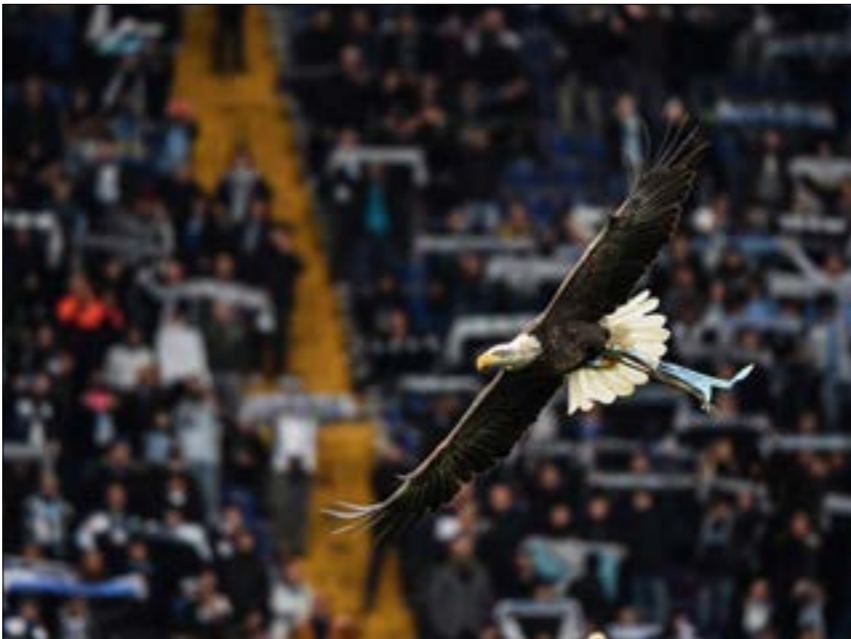
لم يبق لاتسيو باللقب منذ عام 2000 (ف)

الـ25 بعد 21 مرحلة في إنجاز لم يتحقّق منذ الأرجنتيني الإيطالي أنتونيو فالنتن أنجيلو عام 1959 (سجل 25 أيضاً لصالح إنتر ميلان). وتابع مودجي «رؤية لاتسيو في هذا المكان المتقدّم في الدوري لنس وليد الصدفة، بل نتيجة العمل الدؤوب الرابع الذي قام به على مدى أعوام المدير الرياضي (الألماني) إيليتي تازي من خلال استخدام موارد، متواضعة مقارنة بالأندية الأخرى. لقد بنى فريقاً منافساً وحتى أنه يقارع على لقب الدوري، وعاد لاتسيو الأول الماضي إلى نخلة الانتصارات التي