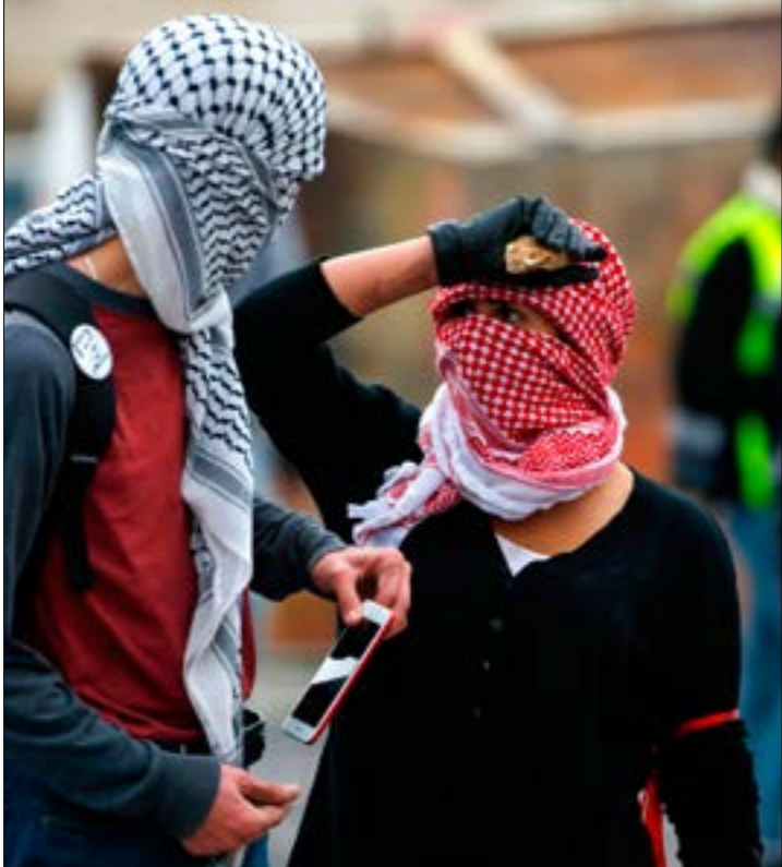
باتت قضية مواجهة الخطة المبريكة في علم الغيب فلسطينيا (ا ف ب)

التفخيزية لمنظمة التحرير، لكن وصلتنا معلومات من الإخوة في غزة أن حماس حتى الآن غير جاهزة»، رغم أن برنامج الزيارة كان يتضمن