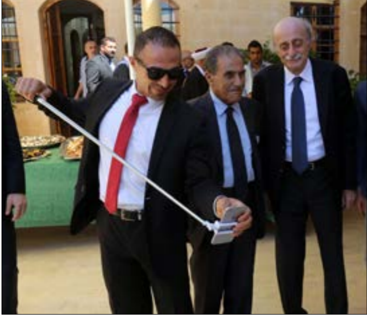
جنبلاط الممك في الحكومة معارض لها (مروان طحطح)

المطلقة من النواب، هما حكومتا الرئيسين عمر كرامي عام 2004 عندما حازت الرقم الأدنى بين نظيراتها هو 59 صوتاً، وحكومة الرئيس نجيب ميقاتي عام 2011 عندما حازت 63 صوتاً. أما الحكومة التي حازت العدد الأكبر من الأصوات، فهي حكومة الرئيس سعد الحريري عام 2009