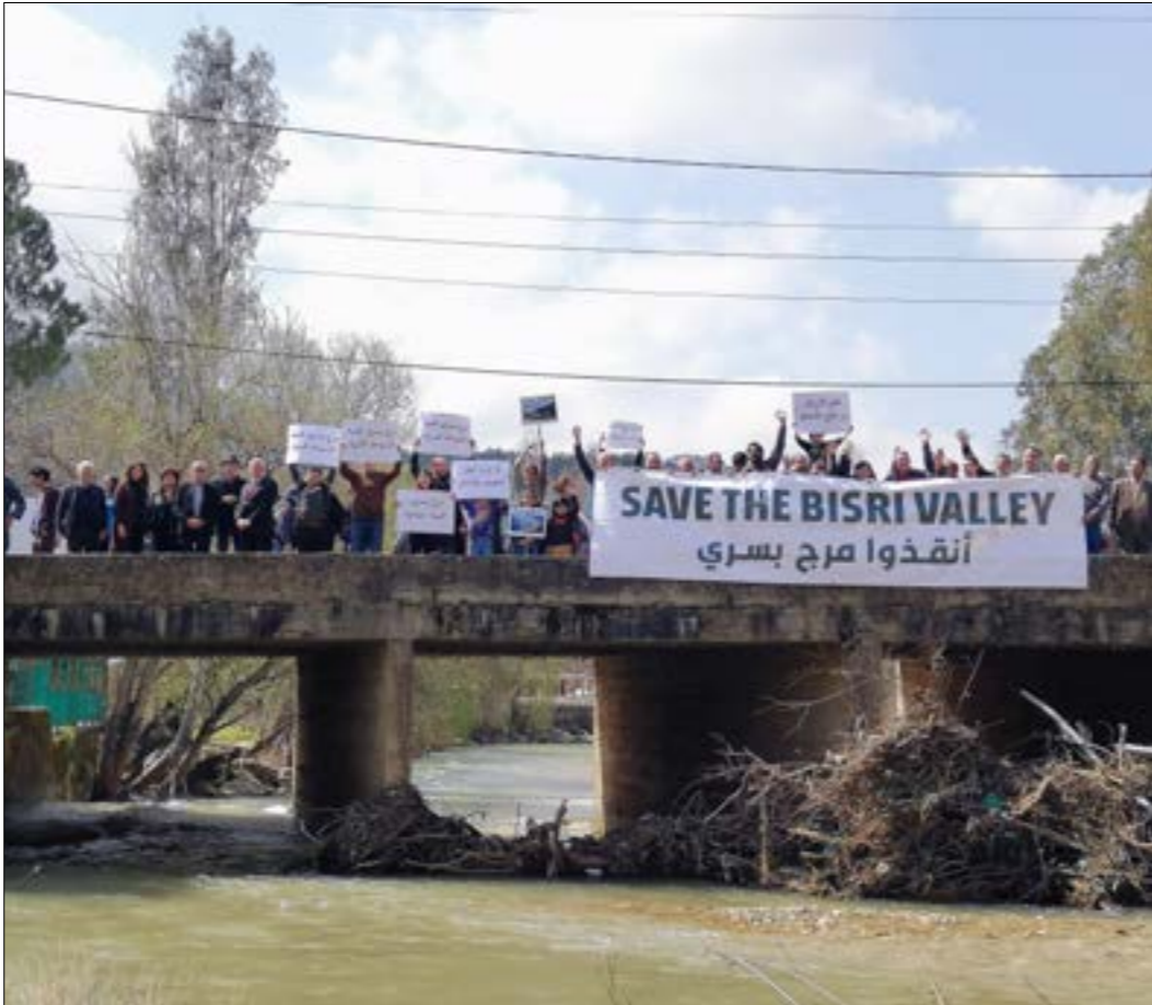
نواب المان دعوا إلى نقاش جدي مع اهالي الوادي للتوصل الى مشاريع مجدية

فهل هذا المنطق لا يزال قائماً بعد الثورة ومع الحكومة الجديدة؟ أم أن تغييراً ما سيحصل في المنطلقات الأساسية والرؤية البيئية والاقتصادية... فيتم تبني منطق التخفيف والتوفير بدل منطق الدين والاستثمار والتحصيل؟! ألا يفترض بعد كل ما حصل، والأزمة المالية الخطيرة التي وقعنا فيها، أن نتوقف عن الاستدانة من أجل مشاريع مكلفة جداً كالمحارق والسدود؟