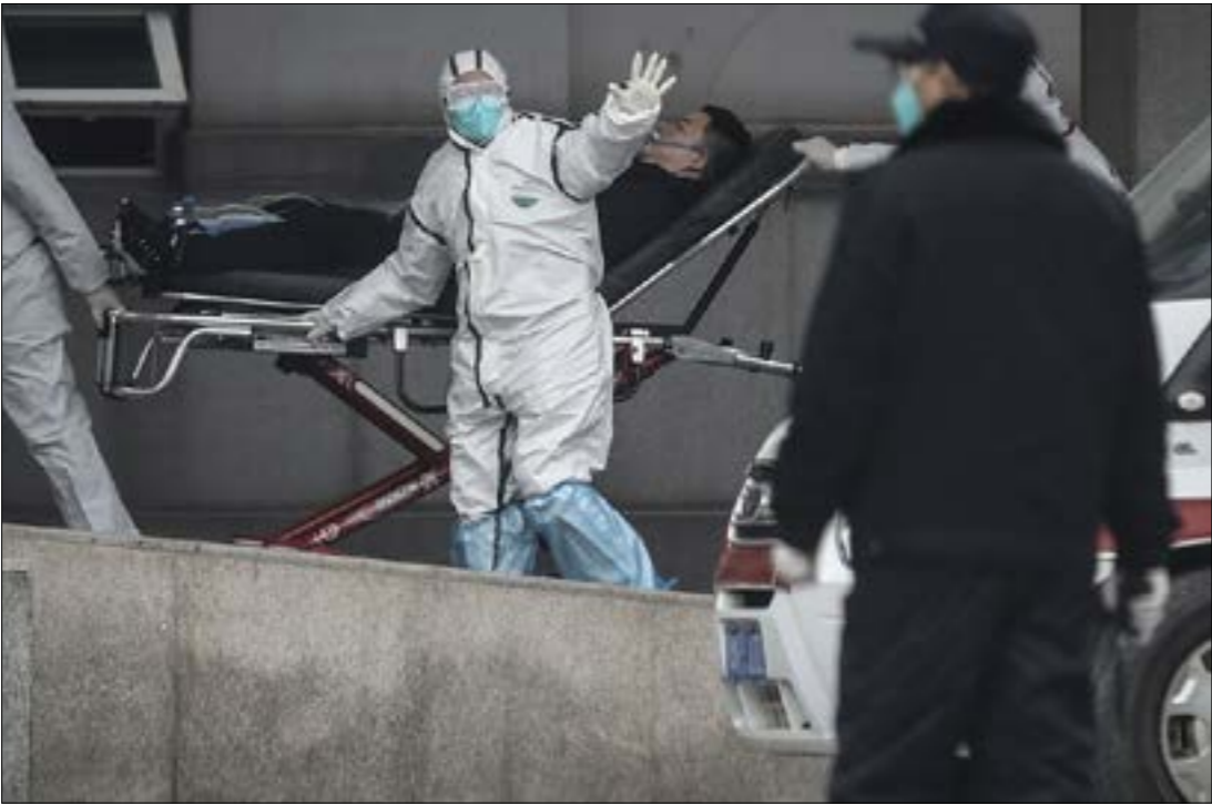
مئات الملايين جزءا الفيروس حتى الآن (اف ب)

غضون سنوات قليلة وجهة معتمدة للعديد من المواهب الشابة، والنجوم المقبلة على الاعتزال، ما ساهم في ارتفاع أسهم هذا الدوري ليقارع دوريات أخرى مثل الدوري الأميركي، البرازيلي أو حتى الفرنسي. رغم تحسّن هذه الرياضة في زمن قياسي، قد تتراجع كرة القدم الصينية مجدداً إثر تفشي فيروس كورونا في البلاد. فقد قرّر الاتحاد الصيني لكرة القدم تجميد نشاط كرة القدم، معلناً في بيان رسمي تأجيل مباريات الدوري الصيني بمختلف درجاته إلى أجل غير مسمّى. وأضاف البيان الصادر عن الاتحاد أنه سيتم تحديد مواعيد المناسبات الرسمية في وقت لاحق. مع الأخذ في الاعتبار كلّ التدابير الأمنية والصحية. وكان من المقرّر انطلاق الدوري في 22 فبراير/شباط المقبل، على أن ينتهي في 31 أكتوبر/تشرين الأول لعام 2020، كما كان من المقرّر أن تلعب مباراة كأس السوبر الصيني بين بطلي الدوري (غوانزو) والكأس (شانغهاي) يوم 15 فبراير/شباط المقبل، قبل أن يصدر قرار التأجيل لأجل غير مسمّى. إضافة إلى ذلك، قرّر الاتحاد الآسيوي تأجيل مباريات الأندية الصينية في دوري أبطال آسيا وإلغاء مسابقة الملاحة في الصين المؤهّلة لدورة الألعاب الأولمبية ونقلها إلى الأردن.