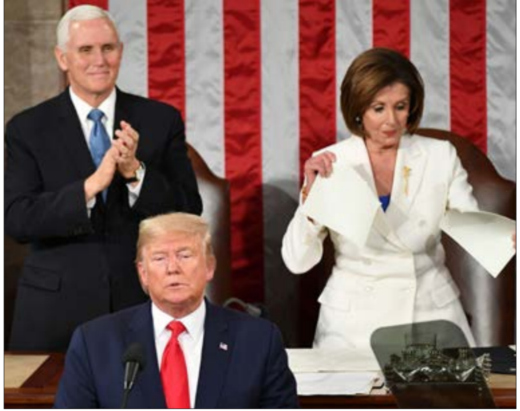
في نهاية كلمة تراحم وفضت بيلوسى ومرّضت نسخة الخطاب

ظهر «المدمّم عليه»، أخيراً ليقول كلماته. لم ينطق تراحم مطلقاً بكلمة «عمل» أو «مساءلة»، ولكنه جمع، في خطاب انتخابي عن حال الاتحاد، بين الاحتفال بالافتتاح الأميركي، وإعلانات السياسة المتشدّدة والمفاجآت على طريقة تلفزيون الواقع. بقدر ما استطاع، جعل من رئاسته، على مدى ساعة و18 دقيقة، الحدث الأبرز في الحفل السنوي. تخّضه الرئيس الأميركي، منذ فترة ولايته الأولى، وركز على تأمين فترة ثانية، عبر التوجّه مباشرة إلى قاعدته السياسية والانتخابية