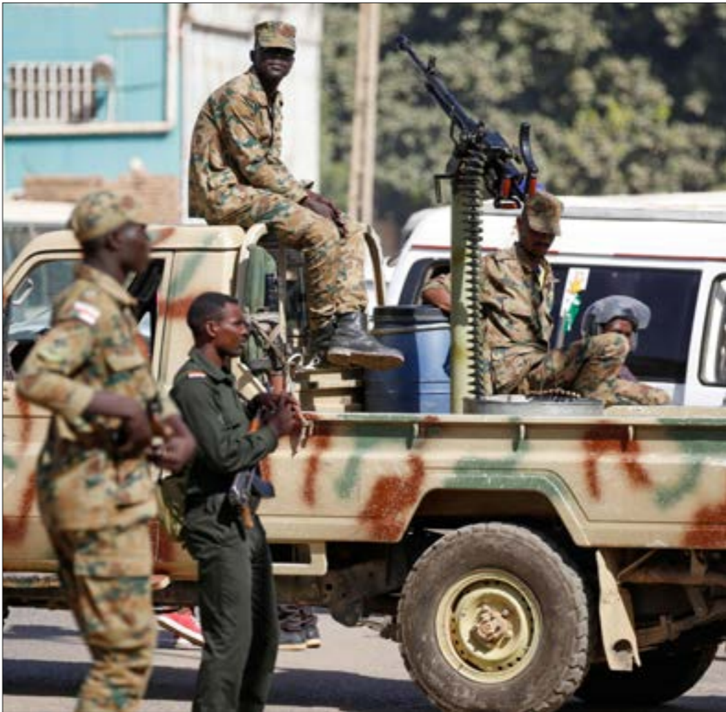
حسم الجيش موقفه سرعاً بتأييد خطوة البرهان واعتبارها لنحزم الاعتد القومي (ف ر ب)

واصل رئيس «مجلس السيادة» في السودان، الفريق عبد الفتاح البرهان، أمس، سرد تبريراته للقائه لرئيس وزراء العدو، بنيامين نتنياهو، في أوغندا، مع جرعة أكبر من الصلافة، جراه عليها موقف رئيس الوزراء، عبد الله حمدوك، الذي وفر ما يشبه الغطاء السياسي لخطوته بإعلانه «أننا» نرحب بالتعميم الصحافي... للبرهان حول اجتماعه مع رئيس الوزراء الإسرائيلي، ونظّل ملتزمين المضي من أجل إنجاز مستحقّات المرحلة الانتقالية»، وأيضاً هشاشة موقف قوى «الثورة»، والذي انبثى على أساس أن البرهان «خالف الوثيقة الدستورية»، وتجاوز مهّمات المجلس في شأن العلاقات الخارجية وإدارتها، فضلاً عن أنها لم يكن لديها علم بخطوته. أوحث هذه القوى وكانها كانت تنتظر استشارتها في هذا الشأن، وهي التي لم تتوصل إلى اتفاق مع العسكر إلا بعد مخاض صعب ظلّت في نهايته الكلمة الأولى لرياحات العامة للجيش في علاقاتهم الإقليمية المشبوهة، كما أن تطيحها خلف «الشكليات» في لحظة