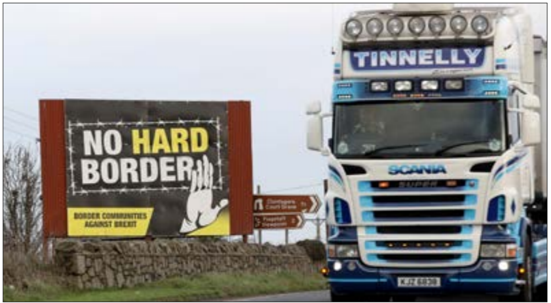
ملصق على الحدود بين إيرلندا الشمالية وإيرلندا يرفض فكرة الحدود بين شطري الجزيرة

بتّجه الناخبون في جمهورية إيرلندا، نهاية هذا الأسبوع، إلى صناديق الاقتراع للإدلاء بأصواتهم، في أجواء لت تسمح بتمكّن حزب واحد من الانفراد بالسلطة، لكن تصاعد شعبية «الحزب القومي الإيرلندي» («شين فين»). على خلفية «بريكست»، قد يمنحه دور «صانع الملوك» المقلد، ويحوّله فرض طلبه إجراء استفتاء، على توحيد شطري الجزيرة