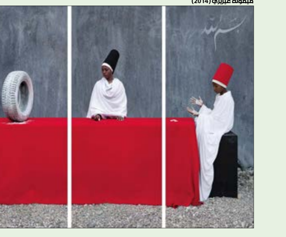
ميخونة غيريزيا (2014)

لماذا نستعير النقاش الذي دار محصوراً بين حدي العلم والجهل للفكر الإسلامي؟ أولاً، في تصريحاته، التزم الخشت بالإطار الإسلامي في عمله «التجديدي» على حد وصفه، وشدد على كونه مسلماً مدافعاً عن القرآن والسنة. ولذلك نستبعد فرضية الطرح الملطاني، فالملطوب ليس إقصاء الدين من الحياة بالدراسة الفكرية اللائكية الفرنسية أو تحييده عن الحياة وبناء إطار مواز له كالدرسة الفكرية الأنطروميكية. بل إننا ملتزمون بقراءة فكر الخشت في ضوء المفاهيم والبيئة الاجتماعية والسياسية والاقتصادية والتاريخية الإسلامية.