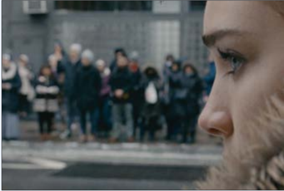
من شريط «أبدأ نادراً أحياناً دائماً» للمخرجة الأميركية إليزا هتمان