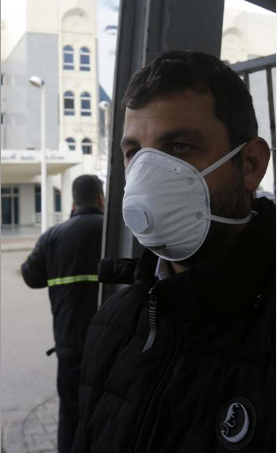
فوضه إجراء، الفحوصات وعدم خضوعها للرقابة يوديّان إلى نتائج مغلوطه

لا تزال هناك حالات عدم يقين حول حركة إفراز الفيروس (...) وبالتالي فإن توقيت الاختبار قد يؤثر على النتيجة». كما أنه «من غير المؤكد حتى الساعة ما هي أفضل العينات التي يجب أخذها من المصابين ليتم تثبت من إصابتهم بالفيروس بشكل قاطع وسريع ومن المرة الأولى (على سبيل المثال، عينات البلعوم الأنفي التي أخذت من المصابين قدمت نتائج أكثر دقة من عينات البلغم)». هذه الوقائع تعني، عملياً، ضرورة إعادة الفحوصات التي تمّت بشكل دوري في مستشفى رفيق الحريري، نظراً إلى طبيعتها الحساسة، وهو أمر يترجم فعلياً عبر إعادة الفحص لعدة مرضى في الحجر الصحي في المستشفى.