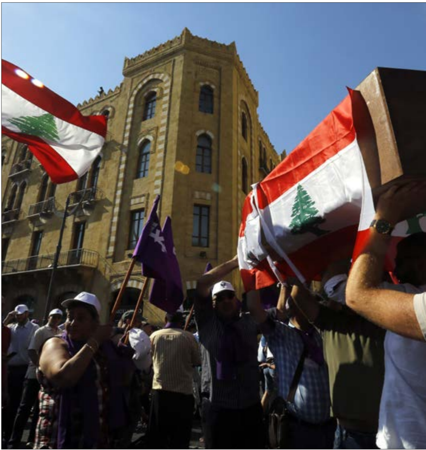
صفقة الحصص الغذائية جرم جزائي يفترض أن يدفع بالديوان إلى تحويله إلى النيابة العامة (مروان طحطح)

سبب، تبيّن فيه أنها فازت بالمناقصة كصاحبة أدنى عرض (مليار و199 مليون ليرة)، وتعلن فيه سحب عرضها وانسحابها من المناقصة. الشركة، في حين أنّ قرارها، أشارت الى تأجيل فضّ العروض ثلاث مرات متتالية بسبب «عدم تأمين المستندات القانونية المطلوبة لأغلبية الشركات»، ففي 2020/2/18 حضرت 3 شركات فقط المناقصة، وفازت «شركة مكية» بالعرض الأدنى، إلا أنه «لم يتمّ