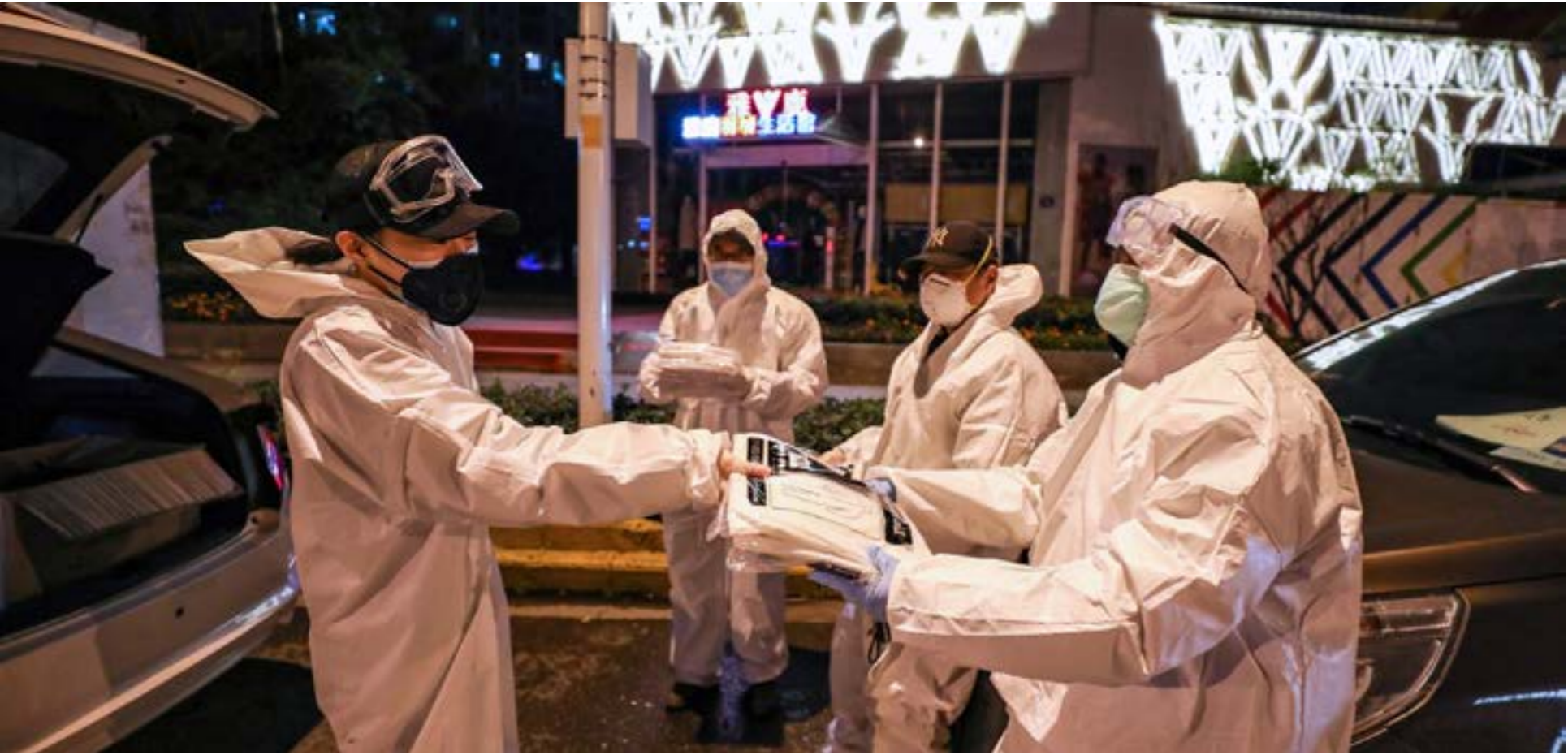
تركيز إعلامي عربي وغربي على إيران في نقل العدوى وتجاهل كوريا الجنوبية وإيطاليا

ببناء على الطريقة التي نتعامل بها معه». وإلى وقت قصير، كانت مدينة ووهان الصينية المركز العالمي الوحيد للوباء. لكن ظهور حالات إصابة جديدة في كوريا الجنوبية وإيطاليا وإيران زاد المخاوف من تحولها إلى بؤر انتشار إضافية، وعملياً، باتت كوريا الجنوبية المركز الرئيسي للفيروس خارج الصين. إذ يزداد عدد الإصابات في هذا البلد بشكل كبير. وأوضحت السلطات أن عدد الإصابات اليومية الإضافية فاق 500 إصابة أمس. والأمر نفسه ينطبق على إيطاليا التي تتجه لأن تصبح بؤرة لتفشي الفيروس أيضاً، إذ وصل الفيروس، عبرها، إلى البرازيل بواسطة برازيلي عائد منها. كذلك