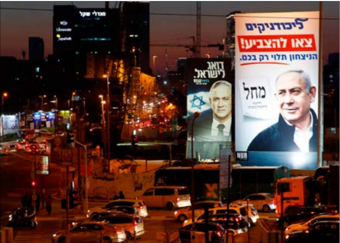
لافتة من الحملة الانتخابية تقول: «الانتصار مرهون بكم فقط»

مقابل الحضور الهزيل، نظم عشرات الفلسطينيين تظاهرة في «شارع 70» ضد مجيء نتنياهو إلى المدينة رافعين شعارات: «انتخبناهو غير مرحب بك» و«نتنياهو القاتل اخرج