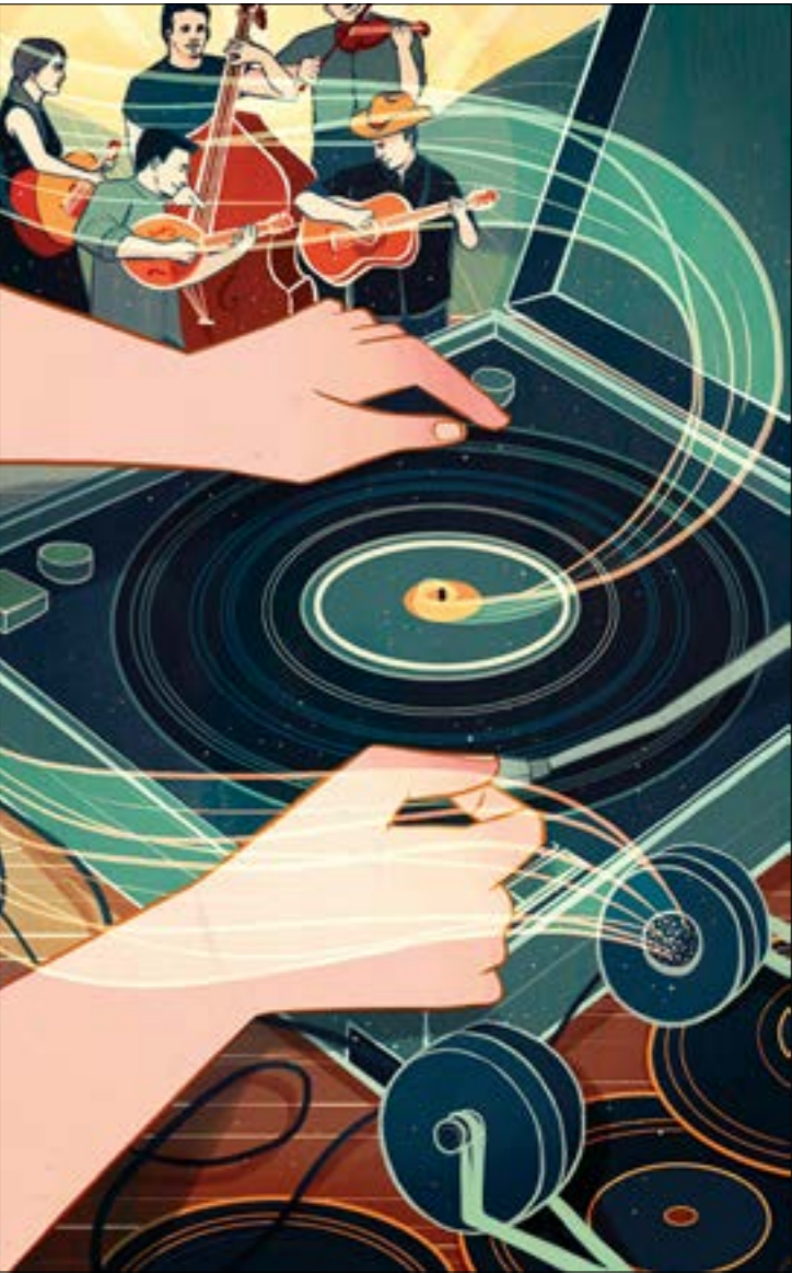
(كلايڤ وينت - الولايات المتحد)