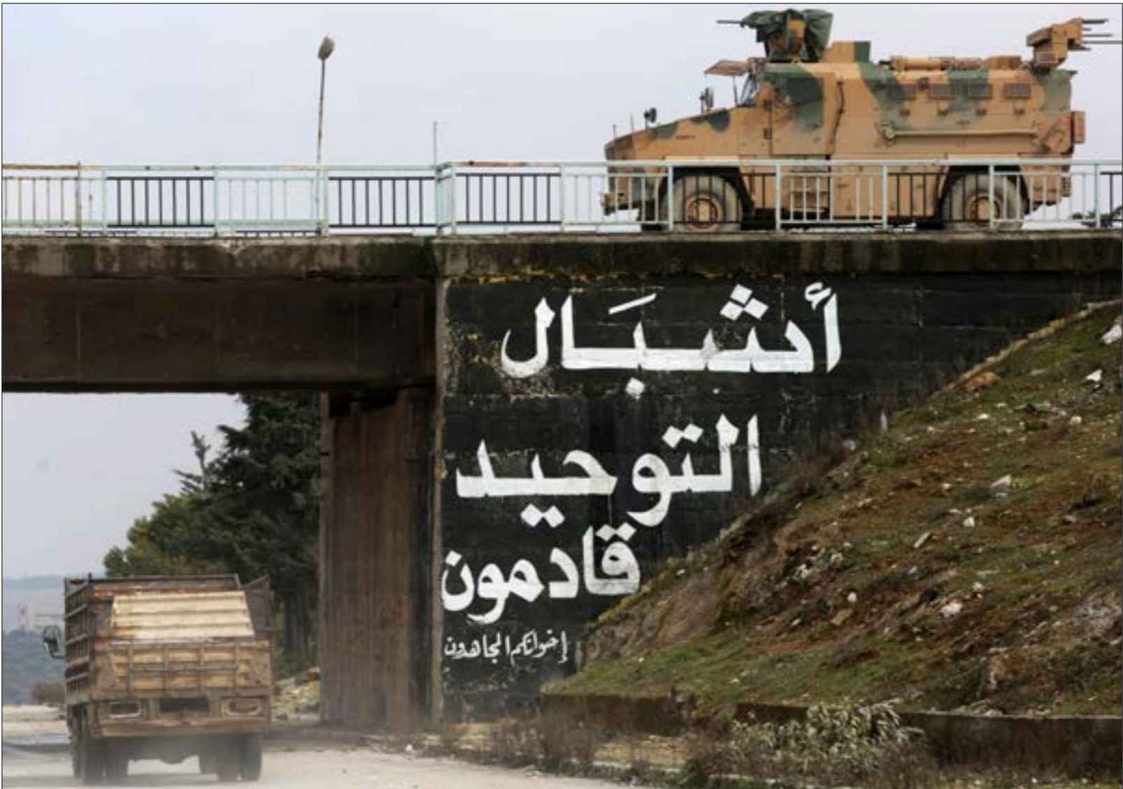
قالت تركيا إنها اجلت جنودها عبر الممر البري لا بواسطة المروحيات كالعادة (أ ف ب)

إلى مستوي» آخر، موقف الرئاسة التركية الذي خرج امس عقب اجتماع مجلس الأمن القومي، ركن إلى تحميل دمشق مسؤولية قتل المسكربين الأتراك، وتحييد موسكو عن الواجهة، لينبئ على ذلك أن الرد يجب أن يكون «بالمثل» ضد قوات الحكومة السورية ومواقعها. في تكرار لما جرى في الاسابيع الماضية في ارياف ادلب وحلب، إخراج المواجهة (إعلامياً) من الملعب الروسي، وحصرها بـ«نار»، مع الجارة الجنوبية، يكشف هشاشة السند «الاطلسي» الذي راهنت عليه تركيا في مناورتها الأخيرة، بمعنى آخر، لم يحصل الرئيس رجب طيب اردوغان - حتى الآن - على وعود اميركية عملية بالدعم في شمال غربي سوريا، واوله ذلك كان حجب منظومة