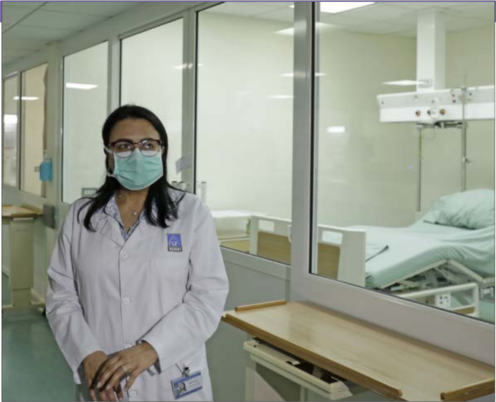
تراجم ونيرة العملة في المستشفى الحكومي الخاصة هي الرابطة في نهاية المطاف

ومحدّدة للمستشفيات التي ستخصّص للعزل، مع استعداد كامل لاستخدام أي مستشفى خاص. إلا أن معلومات «الأخبار» تُشير إلى احتمال تخصيص مستشفيات كانت «مُجمّدة» ولم تُفتح بعد، كمستشفى مشرفة الحكومي في البقاع، والمستشفى «التركي» في صيدا (مستشفى حكومي تمّ تجهيزه بموحد هبات قدّمتها الحكومة التركية ولم يتم افتتاحه بعد). وتسعى وزارة الصحة، ومن خلفها خلية الأزمة الوزارية، إلى تركيز جهودها على تحديد المستشفيات، «تحسباً للازمة التي قد تشنّد حتى الآن، لا تسميات واضحة