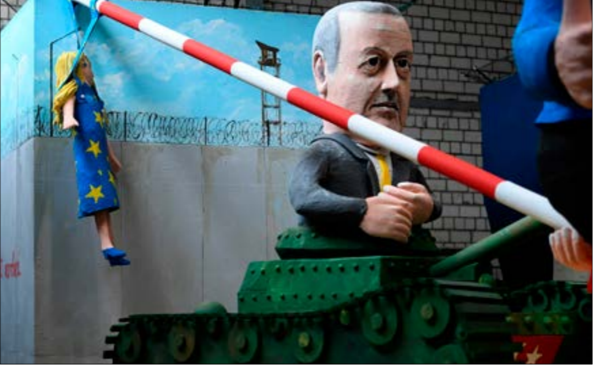
ذهب إردوغان إلى خطوة أخرى عليه بفرض أوروبا والغرب بالوقوف معه من خلال فتح الباب أمام تحقق اللاجئين

الجارية في إدلب. وكانت أرسلت موسكو، عقب اشتداد التطورات في إدلب، وفداً إلى أنقرة للاجتماع بالمسؤولين الأتراك. وأعلنت وزارة الخارجية التركية، أمس، أن تلك المحادثات انتهت، وأن «الوفد الروسي في الطريق إلى بلاده»، وأشارت