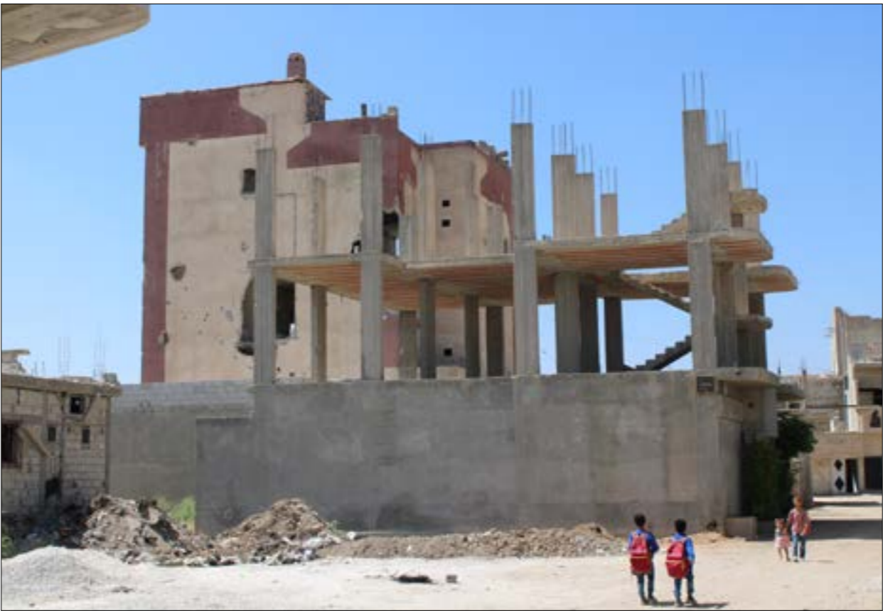
وضعت الحكومة خططا بالتعاون مع منظمات ملك، يونيسف، لترميم بعض المدارس (الأخبار)

من حيث نقص الكوادر، وتضرر المباني، وصعوبة الوصول من جزء الظروف العامة، والظك في توافر مياه الشرب والصرف الصحي؛ فيما تبرز تعازيات بيت منطقة وأخرى، تلك ما يتعلق بنظرة المجتمعات المحلية إلى تعليم الفتيات، من بيت أبرز التحديات، تعويض الأطفال الذين خرموا من التعليم في سنوات