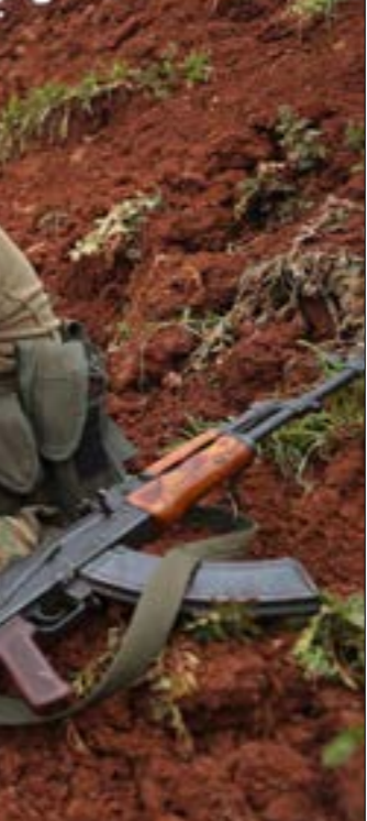
بات الجيش السوري على مقربة من طرف حلب - اللاذقية من جهة أقصى ريف حماة الشمالي الغربي

وأصرّ على انسحاب الجيش السوري من المناطق التي حرّزها، متوغداً «العدو» (يستخدم المسؤولون الأتراك هذا المصطلح) السوري بالاستعداد للموت من أجل إدلب. عندما أمهل إردوغان - قبل 20 يوماً، الجيش السوري حتى نهاية شباط للاستفحاح، كان واضحاً أنه يحتاج إلى بعض الوقت للتشديد اللوجستي لعملية عسكرية واسعة في إدلب، من جهة، وأنه يتهيّب الدخول في صدام مباشر مع سوريا وروسيا من جهة أخرى. في هذه الأثناء، كان يواصل اللعب