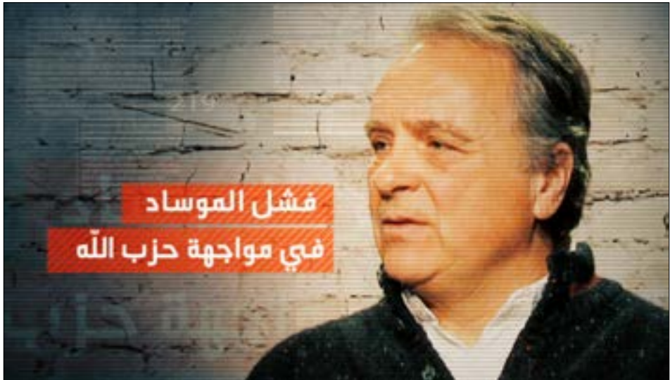
من شريط «برتبة عميل»