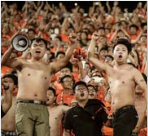
جعد انطلاق الدوري الصيني بسبب «كورونا» (عن الوبس)

لا يزال فيروس «كورونا» يحصد الضحايا في القارات المختلفة، مخلفاً وراءه خسائر جقة لا ترتبط فقط بالأرواح، ففي الجانب الخاص بالأحداث الرياضية الكبرى، تلقى عدد من الدول ضربات غير متوقّعة تترك أثرها السلبي بلا شك على اتّحاداتها من الناحية العالية، وعلى البلدان المتضررة من الفيروس إذا ما أخذنا ارتباط الرياضة بتنشيط الاقتصاد في كلّ منها