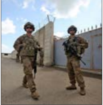
استمدت بغداد أمن الموقع الذي كانت يشله «التحالف»، في قيادة نينوى

بعيداً عن حديث الحكومة ومستجدات تاليها، نشي المعطيات بأن العراق مقلّب على جولة من المواجهات بين قوات الاحتلال الأميركي وفصائل المقاومة، خاصة ان واشنطن عمدت إلى «تسريب» بعض «التفاصيل المغلقة» الدائرة في ضلّة «التضخّر لحملة عسكريّة... لتدمير مجموعات تدعمها إيران، بعدما هدت بضربات ضد القوات الأميركية، المنتشرة هناك