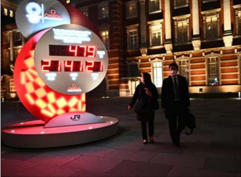
يعلنه تأجيل أولمبياد طوكيو تحدياً لوجستياً كبيراً للمنظمين (أ ف ب)

وحدد التأجيل أولمبياد طوكيو تحدياً لوجستياً كبيراً للمنظمين أيضاً لجهة معضلة أساسية تتعلق بالقرية الأولمبية التي سيقطنها 11 ألف رياضي قبل أن يتم تحويلها إلى شقق سكنية وتسليمها لمالكها الجدد. وتم بيع المئات من هذه الشقق، وكان من المفترض أن يسلمها أصحابها بعد الأولمبياد. وستعتمد على شركة التطوير العقارية، التي نفذت المشروع، الاتفاق مع هؤلاء لتنظيم تأجيل انتقالهم للسكن.