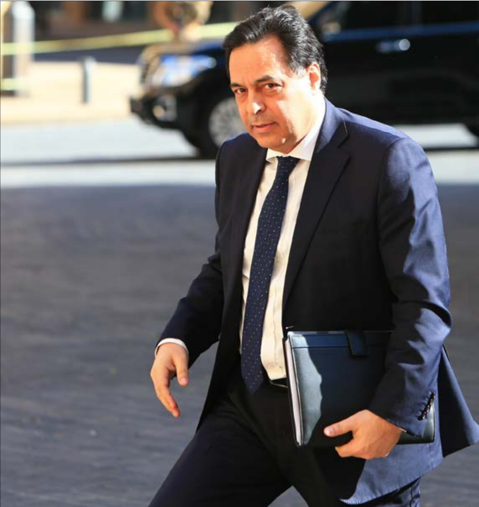
من الشروط شطب نصف الودائع وبيع الذهب وخصخصة كهرباء لبنان والهاتف مورا (هيلم الموسوي)

لنعد إلى لبنان اليوم، حيث المشكلة ليست محصورة بسلكو الأغبياء. تظهر النتائج المتعلقة بالتربعات المعلنة أو عمليات التكاليف الاجتماعية، أقل من واحد في المئة من ثروات الأغبياء تستخدم اليوم لمواجهة تداعيات المرض. الأسواق المحلية ليست في وضع انهيار حتى اللحظة. لكن حجم التراجع في الاستيراد لا يتعلق بالكماليات فقط، بل حتى بالحاجات الأساسية للناس. وإذا لم يحصل تغيير كبير في الاسباب قررت المصارف إقفال هذه الحسابات الثلاثة المغلقة، فإن لبنان يقفل على أزمة مواد غذائية مطلع حزيران المقبل. وهذه الأزمة لا علاج لها بغير