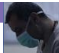
مستشفى ستارك بارك في نيويورك