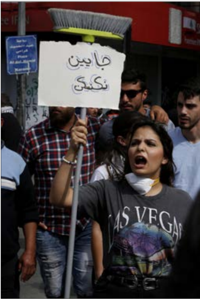
موظفو «ناشر»، لم يناقشوا رواتبهم بعد والشركة تفحصهم في خلافاً مع الدولة اللبنانية (صروح حططم)

الطوائف المسيحية على الحصص والدولة؟». ولتحدّ التي أن اجتماعاً كهذا «إذا سلّمنا جدلاً بأن هناك اعتداءً على حقوق الطائفة، ينبغي أن يعقد على مستوى ارتوذكسي عام، وبرعاية بطريركية أنطاكيا وسائر المشرق لا مطرانية بيروت، وتراعى فيه مصالح الارتوذكس في كل الأقطار التي ينتشرون فيها، فلا يكون الموقف الارتوذكسي البيروتي، مثلاً، مؤذياً للارتوذكس في سوريا والعراق أو غيرهما». ولتحدّ التي أن هناك عدم رضا من البطريركية عن اللقاء، وتمتدّ لو أن المجتمعين «تفردوا بموقف وطني في شأن الإجحاف، ويدعو في الوقت عينه إلى رص الصفوف في وجه الحرب الاقتصادية والحصار، ويقف إلى جانب الحكومة في مواجعتها».