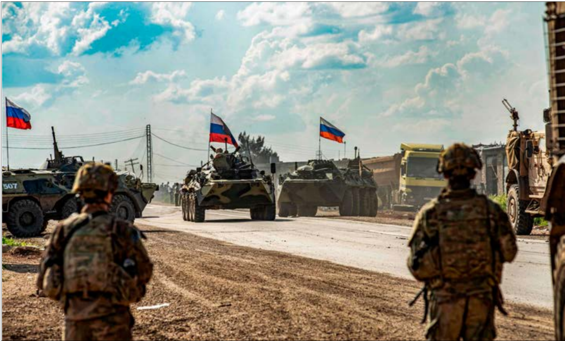
تدبكون الهجوم الاعلامي للتأثير في الانتخابات السورية، او تشويه صورة رجاك اعماك سورين

بالعلاقة الوثيقة مع الإصدقاء والحلفاء من الدول وأولها سوريا، معتبراً أنها «شأن أساسي لوقف روسي قوي في أي حوار مقبل». ولا ينسى زاسبيكين التذكير بالحملة الإعلامية من خلال «منظمة حظر الأسلحة الكيميائية» التي تمارس ضد روسيا وسوريا في وقت واحد، مؤكداً أن «الموقف الروسي ـ السوري موحد في وجه الداساس».