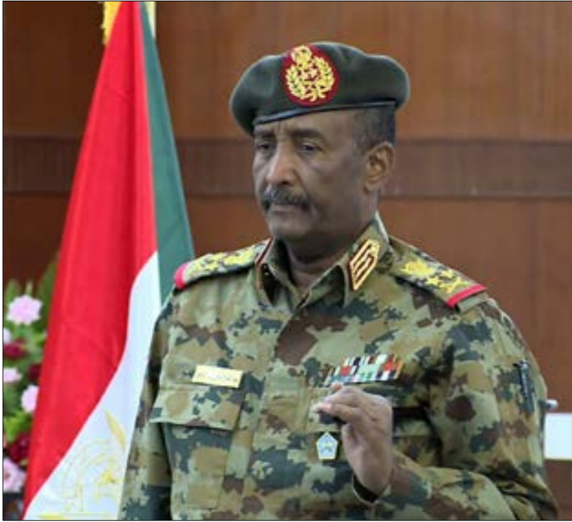
إبراهيم البرهان إلى جهات رسمية بحث تفصيلي لتطوير العلاقات مع إسرائيل (صنع الوები)

لمرة الأولى منذ 25 سنة، انتهت جولة التطبيع السوداني - الأمريكي - الإسرائيلي في نتائجها الأولية إلى إعلان الخرطوم تعيين سفير لها في الولايات المتحدة بعد عشاء استمر عشرات السنين وقالت الخارجية السودانية إنها اختارت «الدبلوماسي المخضرم نور الدين ساتي سفيراً لدى واشنطن»، وإن السلطات الأمريكية وافقت على ترشيحه، علماً بأن الخارجية الأمريكية لم تعلق على القضية حتى كتابة النص، وطوال ربع قرن، كان هناك قائم بأعمال فظ إدارة سفارتي البلدين في كل من واشنطن والخرطوم، علماً بأنه في كانون الأول/ ديسمبر الماضي، قال وزير الخارجية مايك بومبيو إن البلدين سيتبادلان السفراء، لكن الأمر بات أكثر وضوحاً كما يقول متابعون منذ لقاء رئيس «جلس السيادة»، عبد الفتاح البرهان، سراً، رئيس حكومة العدو الإسرائيلي المستقبلي، بنيامين نتنياهو، في أوغندا، ويشأن ملف العقوبات وإزالة السودان من قائمة «دول الإرهاب»، لا تزال التصريحات الأميركية تتحدث