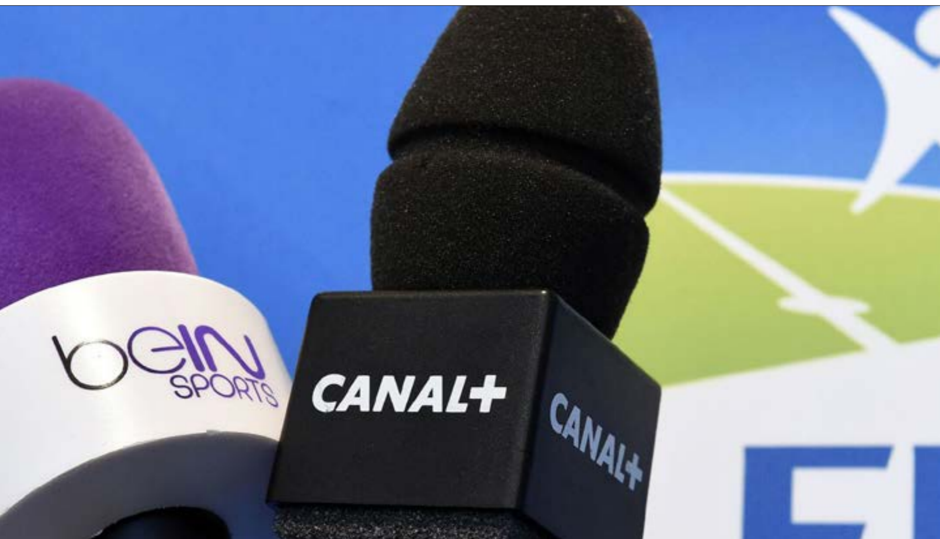
يعود النقل التلفزيوني على الأندية والقنوات بعتات ملايين الدولارات

وشدّد «عودة تمارين الفرق لن تحصل قبل 18 أيار/مايو، واستئناف الموسم أمر لم يتمّ الطرّق إليه، اعتذر، لكن حالياً أفضل التركيز على الرياضات والمجمعات الرياضية الأخرى (ليس ملاعب كرة القدم، بل النوادي الرياضية