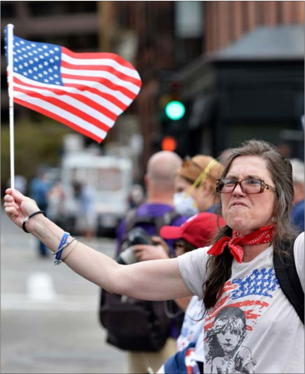
محتجون في ولاية ماساشوسيتس يطالبون بإلغاء إجراء إل الحلق

قررت الإدارة الأميركية ان تخوض حملة شرسة ضدّ الصين عبر تحميلها مسؤولية انتشار الوباء . حملة تسعى الإدارة من وراءها الى التغطية، وات جزئياً. على فشلها في إدارة أزمة فيروس «كورونا»، بعدما أصبحت الولايات المتحدة في مركز الصدارة عالمياً. لجّه عدد الضحايا: 70 ألف وفاة وأكثر من مليون و200 ألف إصابة فيما يتوّقع ان تزيد هذه الأرقام الى أكثر من الضعف اعتباراً من الشهر المقبل