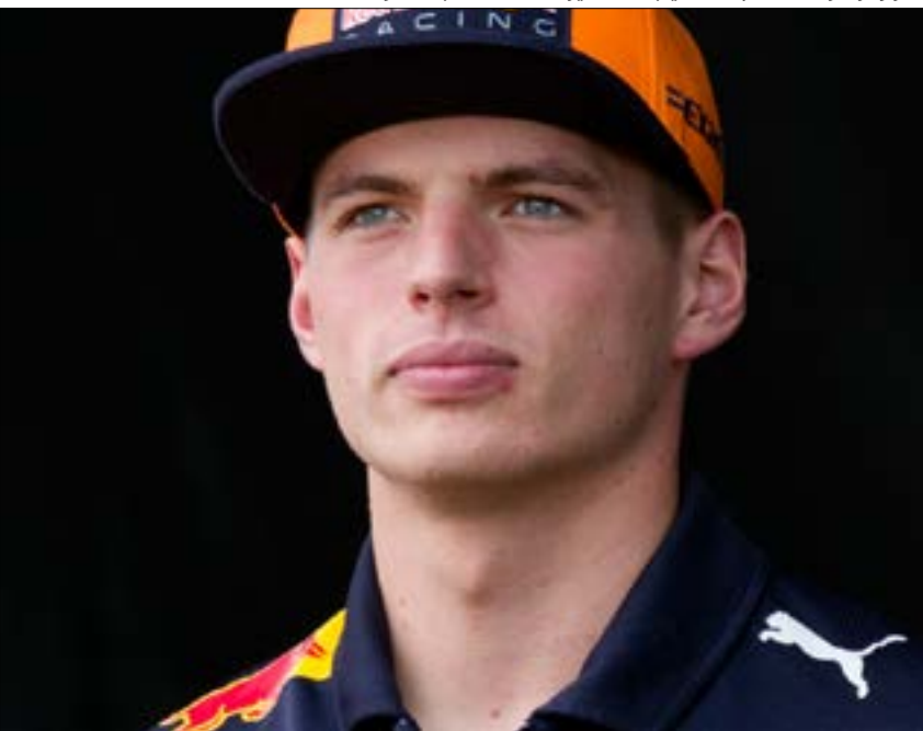
كتب هولندي ماكس فيرشتاين، اعدّ الأيام للانطلاق موسم فورمولوا واحد لعام 2020. يلتقي 33 يوماً فقط للسباق الأول،

عندما يكون ذلك ممكناً وسط ظروف آمنة بالكامل. ووضعت سلطات البطولة سلسلة من خمسة إجراءات أساسية سيتم تطبيقها على هامش السباقات للحؤول دون انتقال عدوى الوباء، أهمها: إجراء فحوص دورية لكشف كورونا على كل المشاركين، إقامة السباقات من دون جمهور لا سيما في المراحل الأولى، تخفيض كبير في عدد أفراد الفرق الذين ينتقلون من بلد إلى آخر، السفر بشكل معزول عن الآخرين لا سيما من خلال استخدام رحلات جوية خاصة، واعتماد قواعد التباعد الاجتماعي. وستكون عودة بطولة العالم بارقة أمل للفرق العشرة المشاركة والتي اضطرت بعضها مؤخراً لاتخاذ إجراءات تكشف مالي في ظل توقف الإيرادات. كما دفعت آثار «كوفيد-19» إلى اتخاذ الفرق قرار