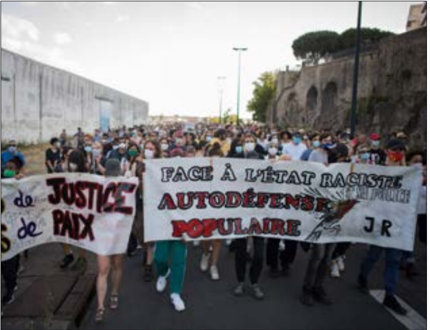
اندلعت صدامات في باريس على هامش مظاهرة محظورة شارك فيها نحو 20 ألف شخص