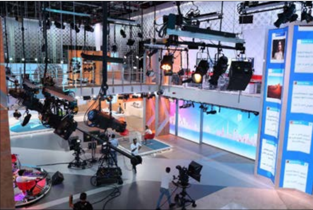
خسرت قناة قرابة 40 في المئة من إعلاناتها

قد انخفضت بنسبة 40 في المئة، حتى إن بعض المعلنين قد أخفقوا كلياً مثل معلمي الأزياء والسيارات والمطاعم والطيران والمجوهرات. كل تلك الإعلانات كانت تُخصّص لها ميزانيات بالملايين، لكنها توقفت فجأة بسبب الحجر المنزلي وحظر التجول. هنا وقعت القنوات الكبيرة من بينها mbc في أزمة البحث عن مدخول مالي يعوّض غياب السوق الاعلاني. كذلك توقفت العديد من عمليات الإنتاج مثل تصوير البرامج والمسلسلات بشكل كلي، فوقعت الشبكة في أزمة تأمين الإنتاج لتلبية طلب المشاهدين.