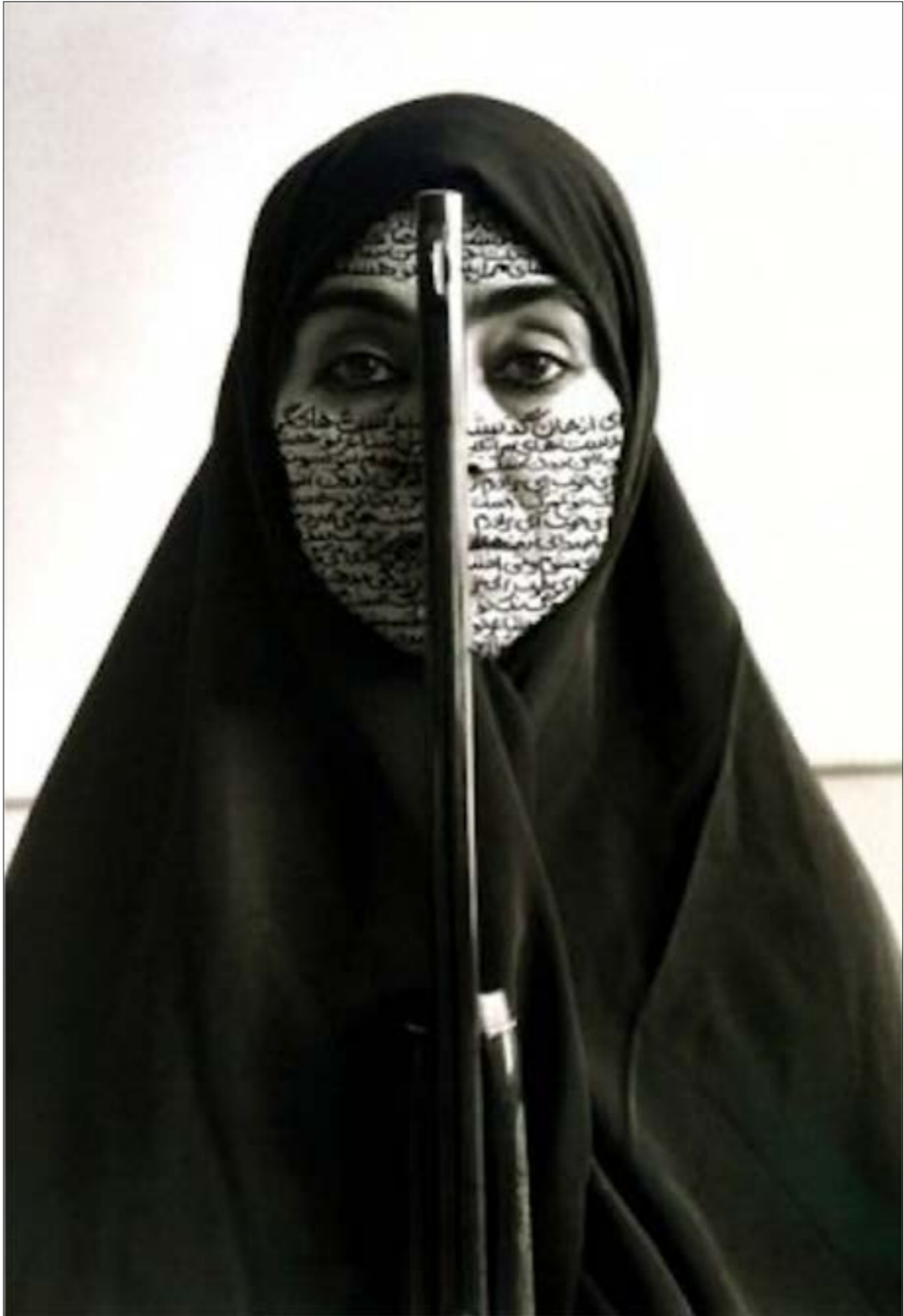
لبريت نسلات - إيرات

الناجمة عن حلّ المسألة الزراعية التي بقيت عvisية على الحل إلى يومنا هذا، ومن حيث النتيجة، شهدت البلاد عشرين انقلاباً ما بين تاجح وفاشل خلال ربع قرن لا يزيد، إلى ان شهدت حالة من الاستقرار النسبي ما بعد تشرين الثاني/ نوفمبر 1970. الأمر الذي شكّل ظاهرة لافتة تصدّى لها العديد من الباحثين والمؤرّخين تحليلاً وشرحاً. فمن قائل إنّ مرّة ذلك الاستقرار، هو نجاح الرئيس حافظ الأسد في بناء «شبكة من الاستداده»، على حدّ توصيف الكاتب البريطاني باتريك سيل، إلى قائل بمبدا «الطاعة والإذعان» الذي ورد لدى المؤرّخ الهولندي نيكولاس فان دام، وهو يرمز إلى نجاح النظام في ربط كبار مسؤوليه بشبكة من الفساد، نتجت في وضعهم في حالة «تحت السيطرة» بشكل دائم، حيث سيكون من المستحيل معها الخروجهم عنه، إلى تشخيص بدا أكثر اكتمالاً ـ وإن كان مشوباً ببعض النقص ـ عند حنا بطاطو المؤرّخ الأميركي من أصل فلسطيني، الذي قال إنّ استقرار النظام في تلك المرحلة يعود إلى «القاعدة الفلاحية» للنظام، التي نتجت في عالنا البويو، لكن الفيروس سيمتخ الفقة العالم باري بوزان Barry Buzan الذي دعا، منذ وقت طويل، إلى إعادة النظر في موضوعات الأمن القومي من منظار أوسع يشمل أدوار الأفراد والحكومات في النظام الدولي، وعدم اقتصر هذا المفهوم على البعد العسكري، ليشمل كل جوانب الحياة المختلفة، بما فيها البيئية والصحية، ضمن إطار التهديدات العابرة للحدود، والأزمات والكوارث الطبيعية، وهي مهمّة جداً لفهم واقعنا المعاصر. هذا يحصل فعلاً بعد فتح موسوعة الحرب التي لم تغلق منذ أيام التهديدات النووية ومعارك الإرهاب التقليدي والحرب السيبرانية، وكما لا يبدو أنّ نظريات الأمن الجماعي سوف تعمل على إيجاد الحل بغياب الحارس الامين على النظام العالمي.