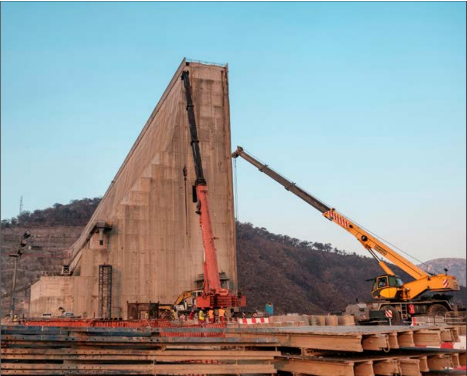
قالت إثيوبيا بوضوح ان المشكلة ليست مع السد بل ان مصر تحصد على نصيب الأسد، من النيل بموجب صفقة باطنية، (اف ب)

إضافة إلى تداعياته على السودان ومصر، إلى جانب عرض اتفاقية إعلان المبادئ الموقعة في آذار/مارس 2015 حين أقرّت التزام الدول بإنجاز اللجنة الفنية للدول الثلاث، لم ترسل