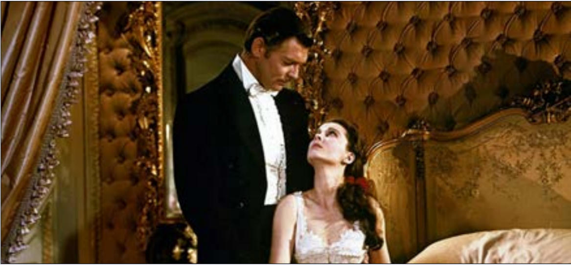
فيفان لي وكلايك غيبك في مشهد من الفيلم

شفيق طيارة كان لديه كل شيء، ليكون ناجحاً، ولكن معظمهم توقع فشله. جلب فيلم «ذهب مع الريح» توقعات عالية، وإنتاجاً طموحاً مليئاً بالتكسات، ورؤية ناض مثير للجدل. بعد 81 عاماً على إنتاجه، يحثّفنا الفيلم عن قوة السينما وسحرها، وعن أسجاد وبؤس ذلك العصر وزمننا. من المستحيل أن نكرهه أو أن نتجاهله. شبابه أبدي، يبدو كأنه صنع بالأسمن من قيل حفنة من المجلتين الشغوفين بتاريخ الولايات المتحدة، الذين يرون العبث به وبالوثائق رخصّة سينمائية لتقديم معجزة على شاشة بيضاء، كبيرة، تعزينا وتؤكد لنا أننا كلنا في النهاية مدان.