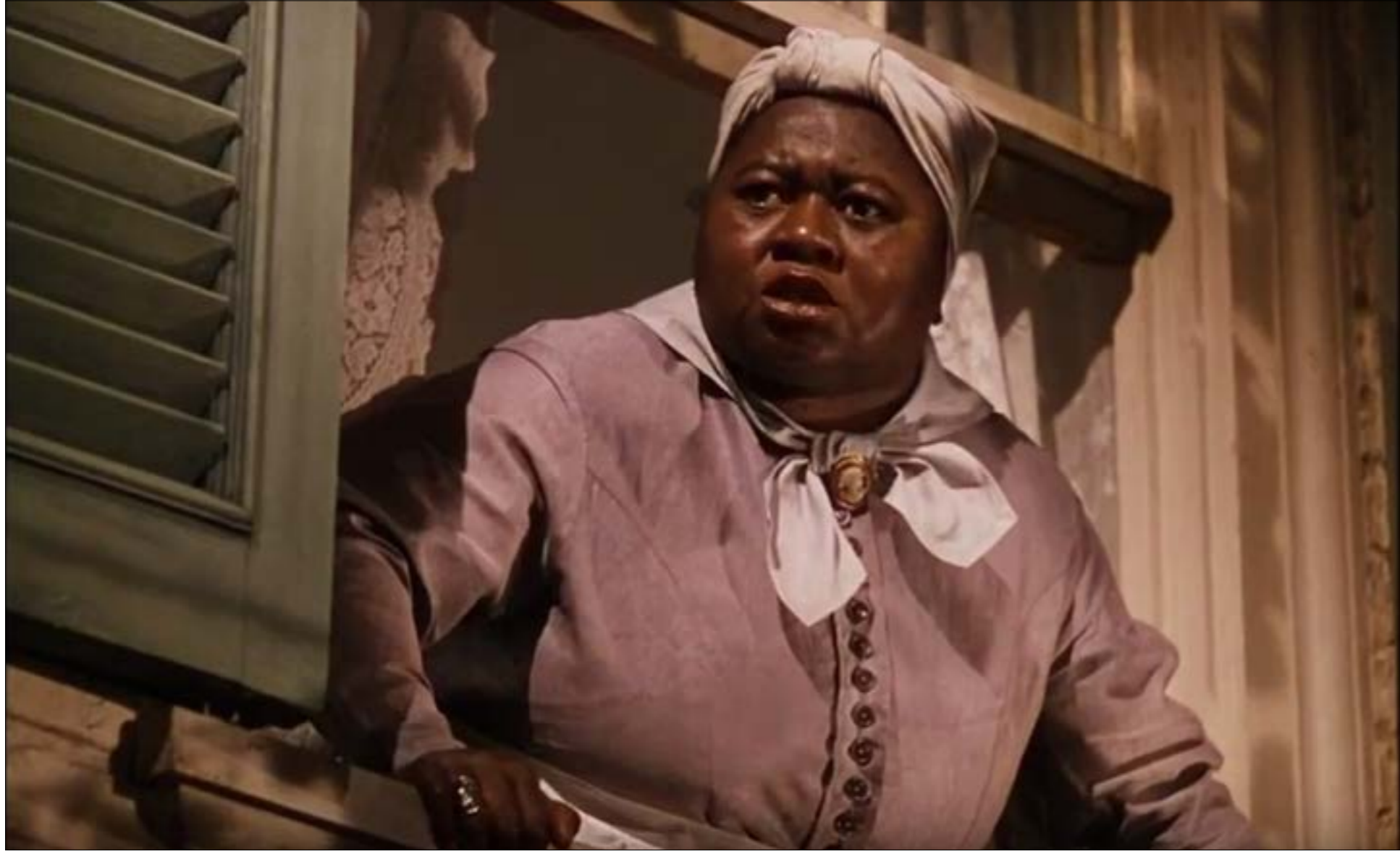
هاتي ماكلدريك من مشهد «ذهب مع الريح»

تخفي الحماسة إلى محو الفيلم رغبة ملخّة في دفن التاريخ القاتم، كأنه لم يكن. كما أنها تبقى عاقلة في قلق طارئ كتعويض عن عجز تحقيق ذلك فعلياً، وخصوصاً إذا ما نظرنا إلى تقرير التّوّع في هوليوود السنة الماضية، ما زالت الإحصاءات تشير إلى تفوّق البيض في صناعة الأفلام الهوليوودية في السيناريو والإخراج والتّمثيل. بين سنة 2011 و2017 وصل عدد المخرجين من كل الأعراق إلى 1,3 من أصل 10 مخرجين من البيض بمعظمهم. أما بالنسبة إلى كُتاب الأفلام، فلم يتجاوز عدد كُتاب السيناريو من الأعراق الأخرى في الفترة الزمنية نفسها، الـ 1 من أصل كل 10 كُتاب العرق وحده لا يحسم الأمر بالطبع، ولا الافتتاح المزيّف على الإنتاجات الأخرى، لا لتشيء سوى لأنها أخرى. السؤال نفسه يبقى إشكالياً، لأنه يعني باصق الوثائق التاريخية عن العرقية في البلاد، محو الإنتاجات العنصرية لهوليوود يتعمّد بطريقة أو بأخرى تجاهل تاريخ طويل للمجتمع