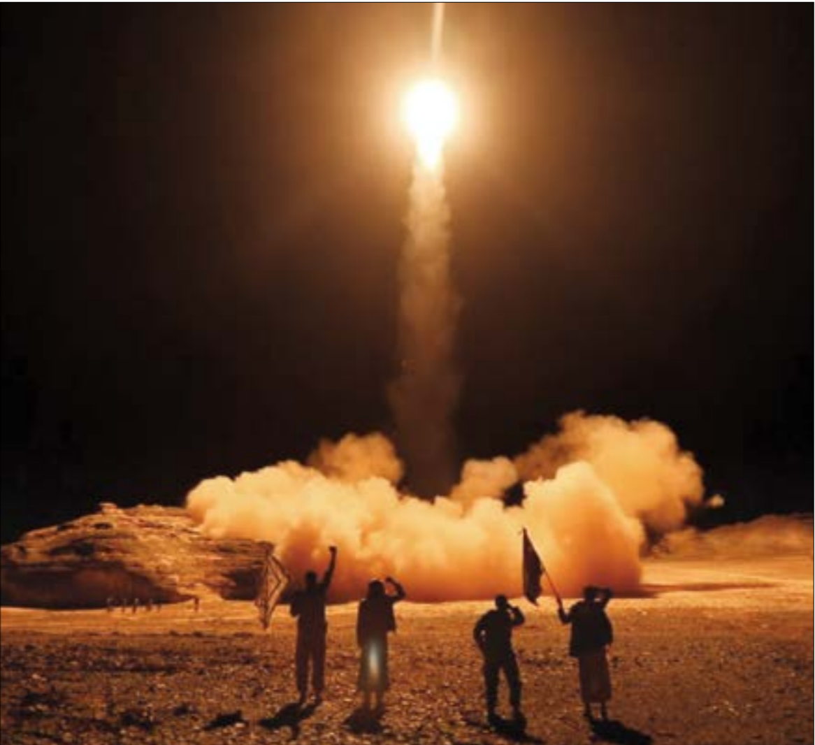
تمّ ذلك، سلام جديد من عائلة المجنحات طويلة المدى لأول مرة في تجربة عملية ناجحة،

ما يزيد على خمس سنوات. إزاء ذلك، جاءت دعوة المتحدث باسم «انصار الله»، رئيس وقدها والتفاوضي محمد عبد السلام: «تحالف العدوان إلى أن يتعاطى بجذبية مع عملية توازن الردع من دون إيغاف العدوان» أو رفع الحصار أو وضع أسس تسوية