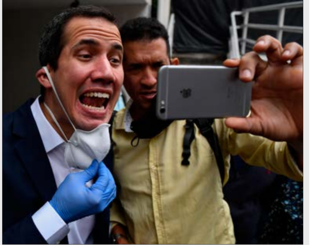
يرتد حماسة ترامب لفلويجو الذي لم يترك الاغراء به رئيسا لراي نيكرا