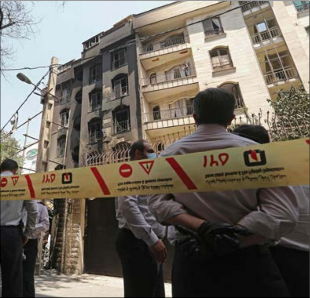
تولت صحيفة «هيبورتك تايمز» نشر تفاصيل الهجوم نقلًا عن مصادر «بارف اوسطية» (ف ب)

بقربه من المؤسسة العسكرية، أكد أن «المهاجم يعرف أن الهجوم لن يوقف المشروع النووي.. الضرر الذي لحق بمختبر تطوير أجهزة الطرد يمكنه أن يؤخر قليلاً الوصول إلى هذه الدرجة، إذ بحوزة إيران آلاف أجهزة الطرد القديمة التي تعرف كيف تقوم بالعمل».