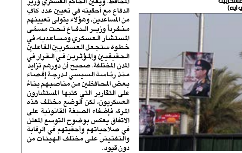
صار بإمكان السيسي إخداك من يريد من قادة عسكريين إلى «المجلس الأعلى للقوات المسلحة، (إي بي إيه)

برغم الدور الشرفي للحاكم العسكري في المحافظات، سنحت التعديلات الجديدة أدواراً أخرى في مقدمتها المناجعة الميدانية والدورية لخدمات المواطنين، إضافة إلى التواصل مع الأحزاب والجمعيات ومنظمات المجتمع المدني والتنسيق مع الجهات التعليمية، ومراقبة المشروعات القومية وغيرها من الأمور التي تقع في اختصاص المحافظ. ويُعين الحاكم العسكري وزير الدفاع مع أحقيته في تعيين عدد كافٍ من المساعدين، وهؤلاء يتولى تعيينهم منفرداً وزير الدفاع تحت مسمى المستشار العسكري ومساعديه. في خطوة ستجعل العسكريين الفاعلين الحقيقيين والمؤثرين في القرار في المدن المختلفة. صحیح أن دورهم تزايد منذ رئاسة السيسي لدرجة إقصاء بعض المحافظين من مناصبهم بناءً على التقارير التي كتبها المستشارون العسكريون، لكن الوضع مختلف هذه المرة، فإضفاء الصبغة القانونية على الإفراج يعكس بوضوح التوسع الملحن في صلاحياتهم وأحقيتهم في الرقابة والتفتيش على مختلف الهيئات من دون قيود.