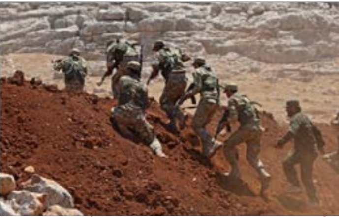
انشفت الوربة عمّ، فرقة السلطان مراد، احتجاجا على إرساك المسلحين لبيبا ليبيا

رغم استمرار تسيير الدوريات الروسية – التركية المشتركة، كما هو متفق، فإن الأمور لا تسيير في منطقتي إدلب، وشمال حلب، على ما يرام. تصفيات واعتقالات واشتباكات بين الفصائل المسلحة في أرياف إدلب، إضافة إلى اشتقاقات في فصائل «الجيش الحر» الموالية لأنقرة شمال حلب. وفي ظل تعرّف الدوريات المشتركة – حتى دورية أسس – عن قطع المسافة المقرّرة الكاملة، والوصول إلى مناطق سيطرة الجيش السوري غربي جسر الشغور، يبدو أن الدوريات بدأت تتحوّل إلى تحركات شكلية لا قيمة ميدانية لها. يوم أمس، سيرت القوات التركية والروسية دورية على الطريق الدولي حلب – اللاذقية (M4)، ابتداءً من قرية ترنية بريف إدلب الجنوبي الشرقي كما جرت العادة، وصولاً إلى قرية داما غربي مدينة جسر الشغور بريف إدلب الجنوبي الغربي. وبدلًا، يفصل آخر النقاط التي وصلتها الدورية عن مناطق سيطرة الجيش في ريف