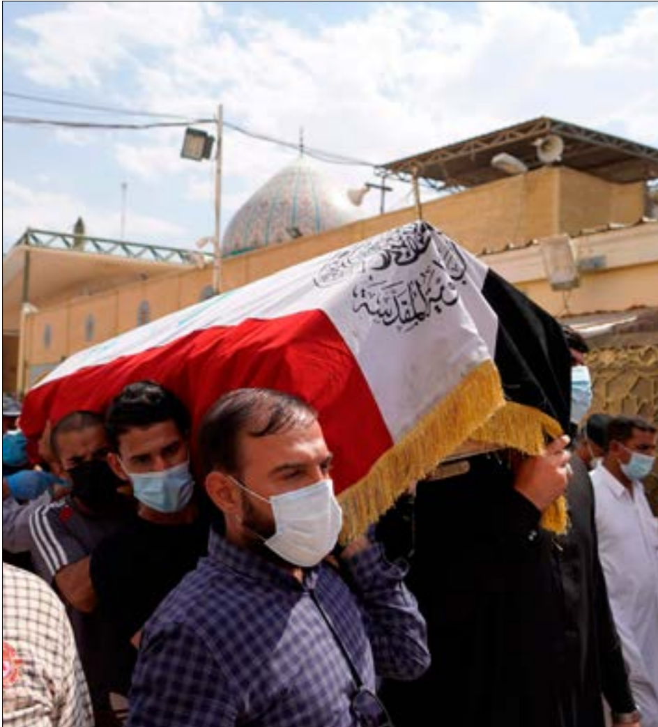
من تسليم الهاشمي، احسن، في مدينة النجف