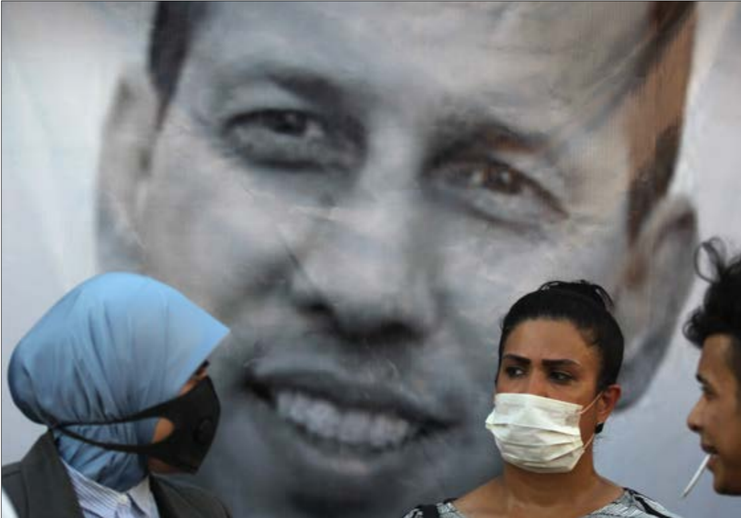
قدّم معلومات حساسة إلى أجهزة التنبّه عن تحركات تنظيم «داعش»، (أف ب)

تحدثت به عن تحالفات البيت السياسي الكردي، أم هو تحالف ليبرالي استخدم «تكتيكات» براغماتية لن توصله إلى صناعة تحالف استراتيجي، وهو بناء رمزية سياسية «سنّية» عربية مسيطرة على محافظات الغالبية العربية «السنّية»؟ إذا ما نجح تحالف ثنائية الحلوسبي والخنجر، فإنه قد تظهر تجلياته فيما يلي: 1- منهجية جديدة في صناعة رمزية قيادية لهالبيت السياسي السنّي» وعملية تعديل موقف التمثيل السنّي حكومياً وبرلمانياً، استخدم قوة تحالف الثنائية في «التعبير الصلاحي»، وهو الذي يغلب فكرة مشاركة غالبية المكّون، أكثر من تغليبه لفكرة العشائرية أو الفقهية المنهجية. في عملية الإصلاح والانطلاق منه.