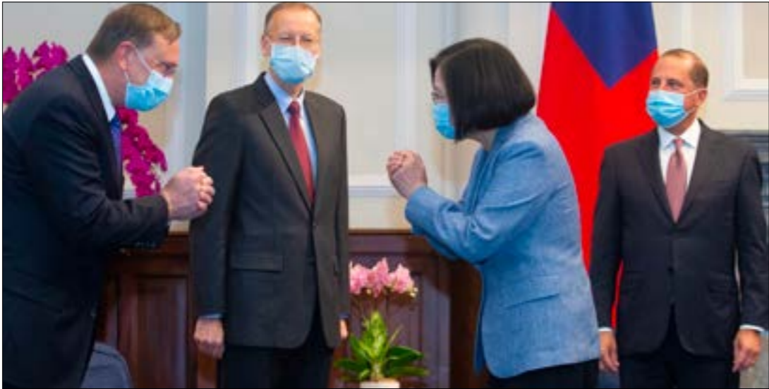
تزامنت زيارة عازار إلى تايبيه مع اعلان بكين عقوبات طالت 11 أميركياً

علاقاتها الدبلوماسية بتايبيه عام 1979 واعترفت بسيادة بكين عليها، بالديموقراطية التي تتمتع بها، ونجاحها في مواجهة وباء «كورونا» وذلك أثناء لقاء جمعه برئيسة الجزيرة، تساي انغ وين، يوم أمس. ولدى سؤاله عن غضب الصين حيال هذه الزيارة، قلل عازار