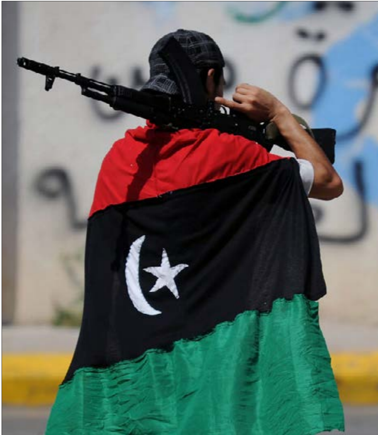
تقوم مقاربة واشنطن على بحث حلول آنية تعهد الأرضية للخبر مستدامة (صن الوبيد)

حفتر وحكومة «الوفاق» - يتطلّع إلى السيطرة على المنطقة التي تعتبر قلب الهلال النقطي. ولا تستند القاهرة، في تحركها الجديد، إلى التأييد الخليجي لها فقط، بل أيضاً إلى اختراق أممي تمكّنت من إحداثه في قلب حكومة «الوفاق»، من خلال نائب رئيسها أحمد معيتيق، الذي يبدو أنه توصل إلى تفاهمات بشكل غير مباشر مع المصريين خلال الفترة الماضية، فضلاً عن تفاهماته مع موسكو للعب دور أكبر في الحياة السياسية الأمن هناك وتفاذي أي احتكاكات مصرية - تركية، سواء بشكل مباشر ام غير مباشر، علما بأن كلاً من طرفي الصراع - اللواء المتقاعد خليفة