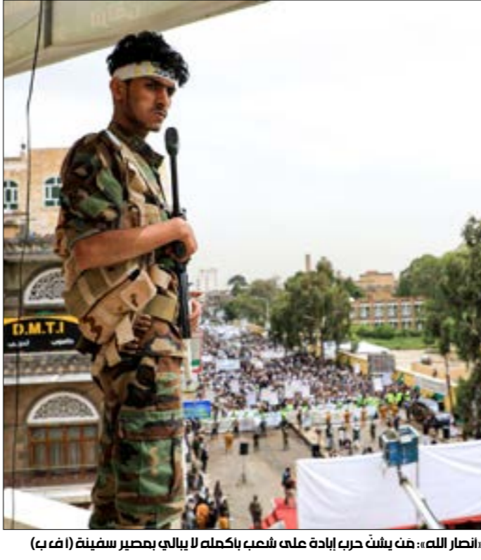
«انصار الله»، من يبلّغ حرب إبادة على شعب بأكمله لا يبالي بمصير سفينة