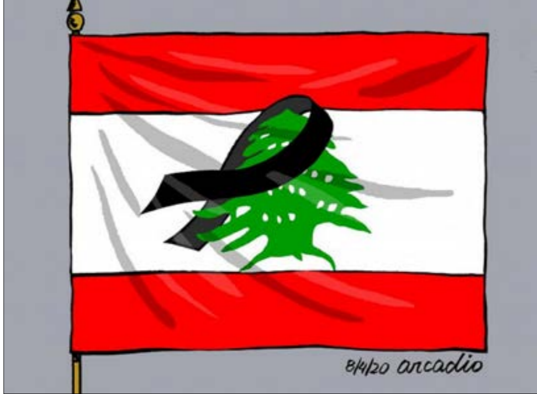
اركاديو - بنعا

هذا لن يهّم الكاتبة الراضية عن كونها لُمأة بارعة في الترميم، ويناجها في مغازلة مزاج من يستكثفها لتحافظ على زاويتها الأسبوعية بكل ما تحمله من «فضائل» مادية ومعنوية. لعّل الحكايات التي وصلت إلى مسامع صاحبة «تاء الخجل» لم تتضمن شيئاً عن هويات الضحايا الذين توزعوا على كامل جغرافيا الوطن وديموغرافيته، وعن عمال المرفأ الفقراء القادمين بمعظمهم من الأطراف المهملة في الجنوب والبقاع ليس لعبة، وأن صورتهم البراقة التي جهدوا في رسمها سنوات طويلة تخللها جهد إبداعي كبير، هي أولى الضحايا.