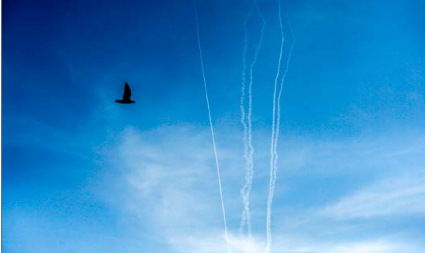
انطلقت المقاومة، أمس، 9 صواريخ باتجاه البحر في عملية وصفت بـ«غير الاعتيادية»

خطت المقاومة، أمس، خطوة جديدة على طريق تصعيد الضغوط الهادفة إلى إرغام الاحتلال على تنفيذ تهاجمات التهدئة، وهي خطوة يبدو أنها فهمت جيداً الدن الضيادة الإسرائيلية التي تسعى لدن الوساطة لمنح تدهور الأوضاع، فيما تؤكد المقاومة استعدادها لمواجهة