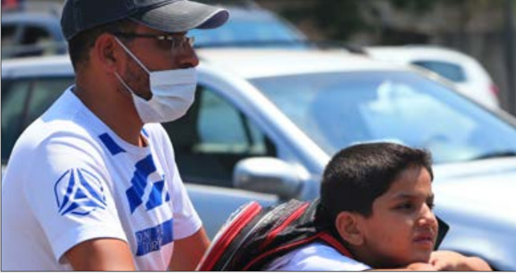
796 من الضحايا الحاليين يُقيمون في «أماكنهم الخاصة» (هيلم الموسوي)

وبفعل مواصلة ارتفاع العداد، وصل عدد المُصابين الحاليين في لبنان إلى 4442. يُقيم منهم في المُستشفيات 187 شخصاً (37 منهم حالتهم حرجة)، ما يعني أن نحو 96% من المُصابين يُقيمون في «أماكنهم الخاصة».