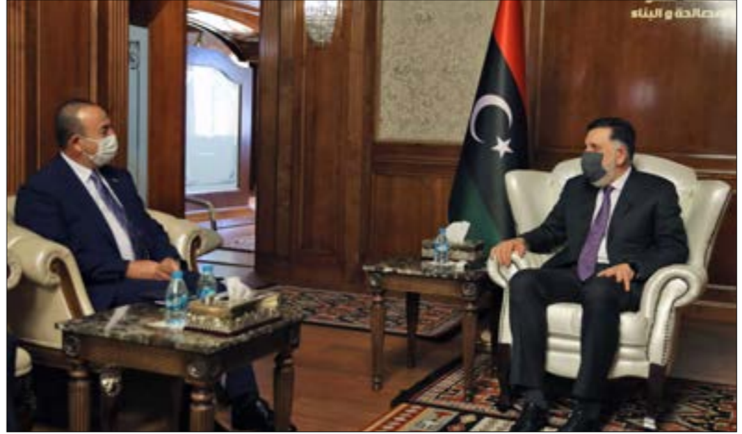
الدولتان الوحيدتان اللتان تلبتان دورا عسكريا معلنًا في ليبيا هما تركيا ومصر (ف ب)

الدولتان الوحيدتان اللتان تلبتان دورا عسكريا معلنًا في ليبيا هما تركيا ومصر (ف ب) في الحرب، فيما باتت هذه المنطقة الاستراتيجية وسط المتوسط ساحة تصارع على النفوذ بين أوروبا وتركيا وروسيا ومصر وداعميها الخليجيين. تحاول أوروبا أن ترسم صورة موحدة لدورها في ليبيا، لكن ذلك يحذّ من هاشم تحركها، وتبدو مشارغل فرنسا، أكثر دولها انخراطاً في الملف، متركّزة على احتواء