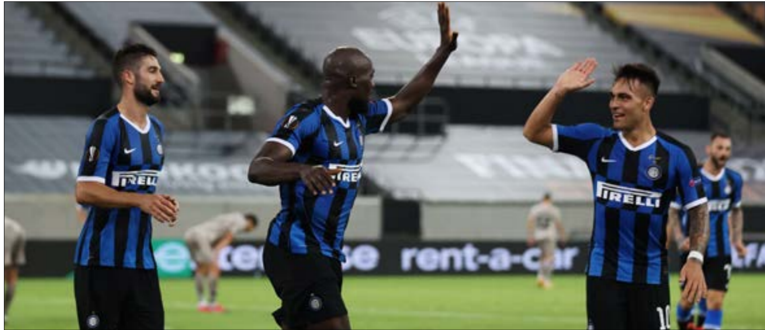
وصل الإنتر إلى النهائي الأوروبي العاشر له في مختلف المسابقات

تشهد مدينة كولن الألمانية نهائياً «مشتعلاً» في الدوري الأوروبي بين أحد أكثر الفرق نجاحاً في تاريخ المسابقة، حيث يلتقي صاحب الثلاثة ألقاب إنتر ميلانو مع نظيره إشبيلية الإسباني صاحب الخمسة ألقاب. غدا الجمعة عند الساعة 22:00 بتوقيت بيروت على ملعب «راين إينرجي ستاديون».