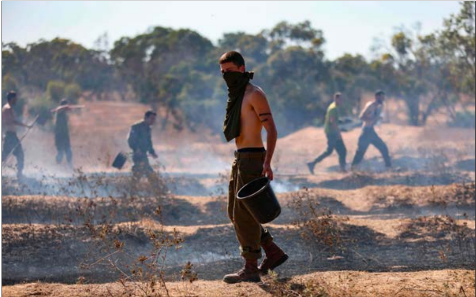
اشعلت البالونات الحارقة أمس أكثر من 25 حريقاً في مستوطنات غلاف غزّة

تصطمم بتعنت الاحتلال ورفضه تطبيق تفاهات التهذئة التي تمّ الاتفاق عليها في نهاية 2018»، مضيفة أن «حماس أوصلت رسائل باسم جميع الضفائل بأنها لا ترغب في مواجهة عسكريّة حالياً، لكنّ تعنت الاحتلال قد يدفع إلى ذلك»