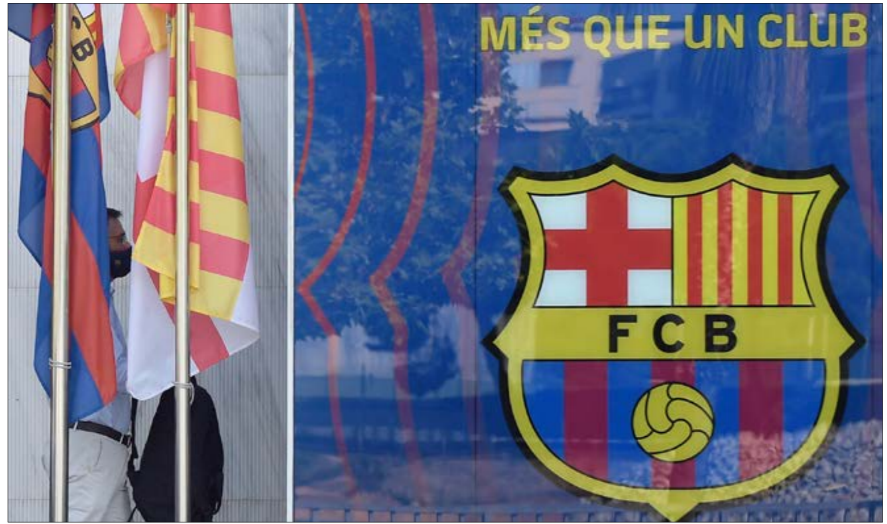
بطلب الجمع برحله إدارة بارتوميو