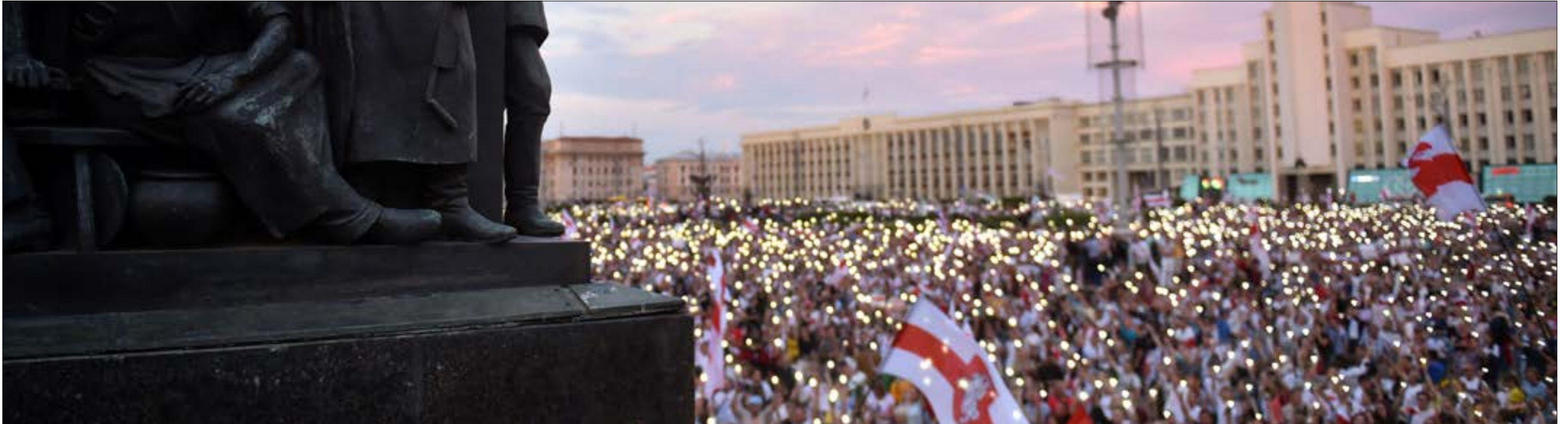
تسلطت حركات الوروبية توازياً مع الحراك البيلا روسي المناهض للوكاشينكو