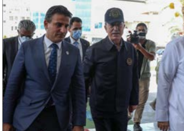
نائب زيارة عباس كامل للقاء حفتر بعد يومين من زيارة وزيره دفاع تركيا وقطر لطرانس (أ ف ب)

الجفرة الذي لم يتمّ اختراقه إلى الآن، في وقت باتت فيه المقترحات حول هذه المنطقة تحجّجه نحو تصديفها «معزولة السلاح»، مع إمكان أن تصير مقراً رئيساً لإدارة انتقالية، بحسب رئيس البرلمان الليبي، عقيلة صالح، الذي قدّم مقترحاً في هذا الإطار، لكنه لم يلق قبولاً كبيراً، لكونه يتعارض مع