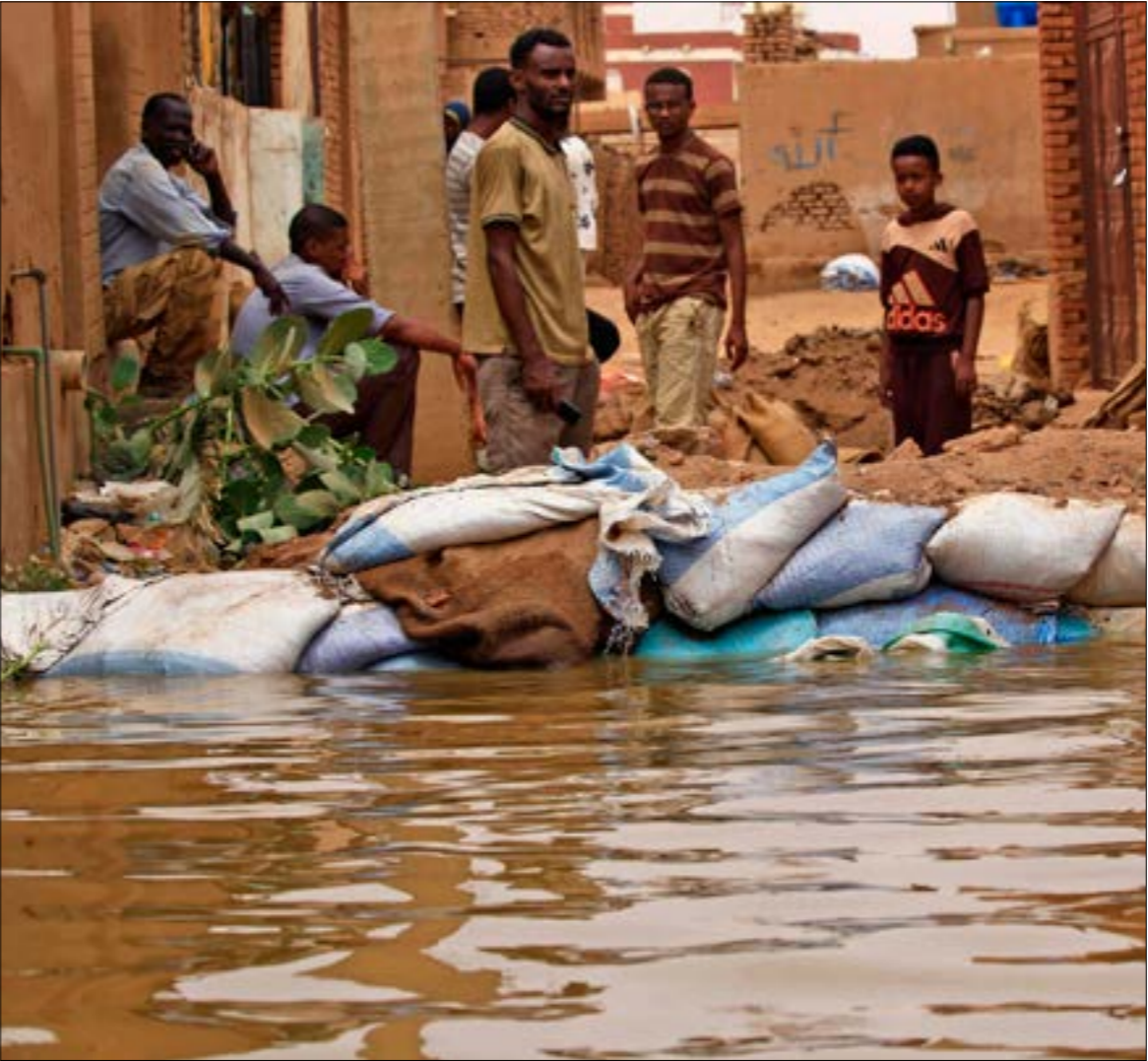
تسببت الفيضانات الأخيرة في السودان بإضرار بالغة لمئات آلاف المواطنين

قيام المؤتمر المذكور. وقال القيادي في تحالف الحرية والتغيير، يحيى الحسين لـ«الأخبار» إنه «يجب إرجاء القضايا الجوهرية المتعلقة بشكل