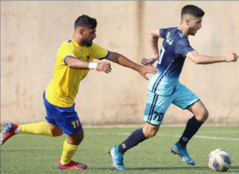
كان عليه الحاج (70) واحداً من اللاعبين الشباب الذين بدأ العهد فيهم المباراة (حست بحسبون)

لقاء ستكون العين عليه على أكثر من صعيد، سواء من ناحية النجمة أو البرج، فالجمهور النجموي سينتظر