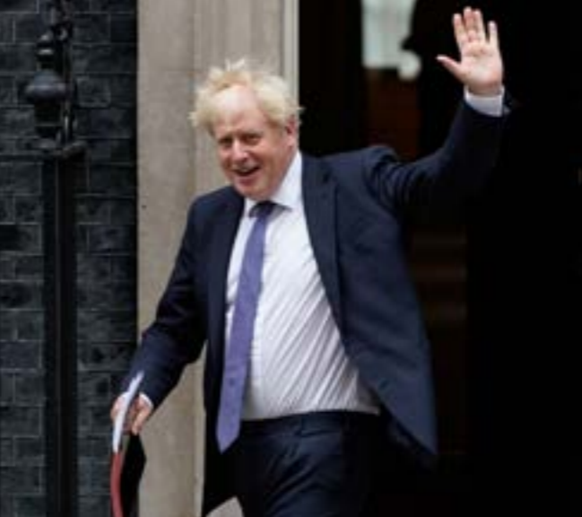
جونسون، هناك خطر غير منوصف، يتملك في ترك ايرلندا الشمالية معزولة عن بقية المملكة المتحدة

1- مارون عبود -2- الزلابيت -3- زب- ريد - ريو -4- بيرة- ام - عن -5- رو - إنصراف -6- مقابل -رينو -7- ترتب- نقش -8- رعد - مالي -9- ار - سلم - دؤ -10- جديدة- المس