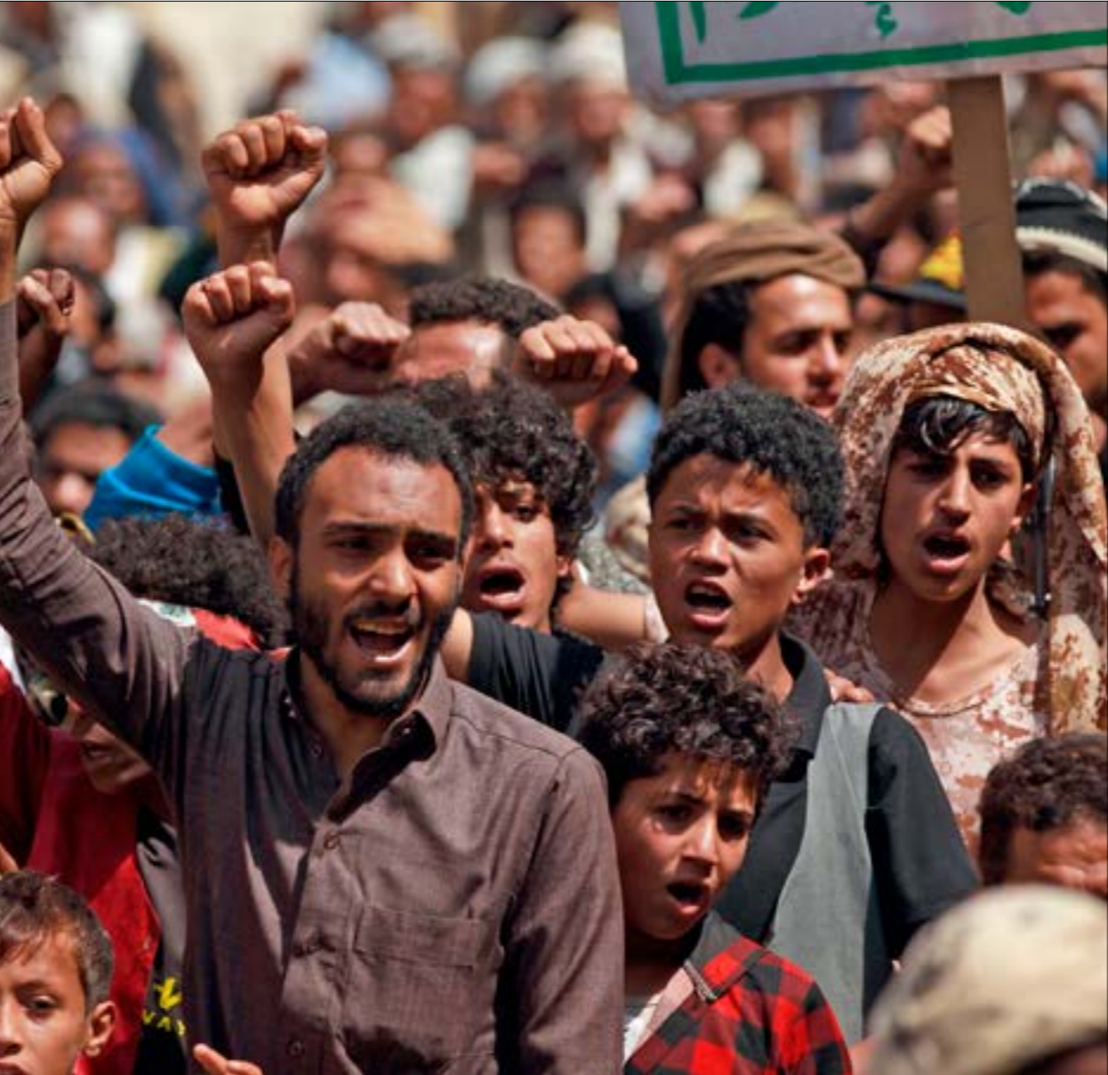
معركة مدينة مارب بدأت بسقوط الصدارة. الخطّ الغامق الأول عب الحديدة

والصبايح شمالي منطقة صافر النقطية وجنوبي مديرية وادي عبيدة. ووفقا لمصادر قبلية، فقد بدعت الحكومة الموالية لتحالف العدوان، أول من أمس، "بالواء 107" المكلف حماية المنشآت النفطية في منطقة صافر للمشاركة في القتال في الجبهتين المذكورتين، حيث حاولت القوات الجديدة الانتقال من الدفاع إلى الهجوم بعد سقوط منطقة قرن أغراب الإستراتيجية تحت سيطرة قوات صنعاء. وأشارت المصادر إلى