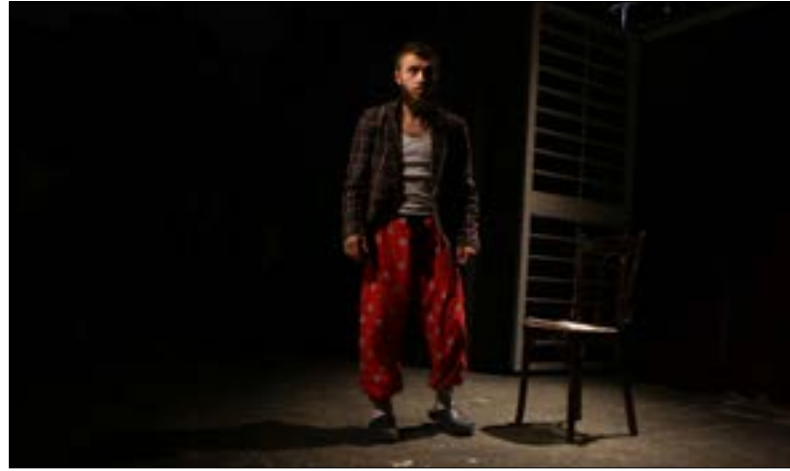
من فيلم «السجناء الأزرق» الذي يُعرض ضمن مسابقة Final Cut