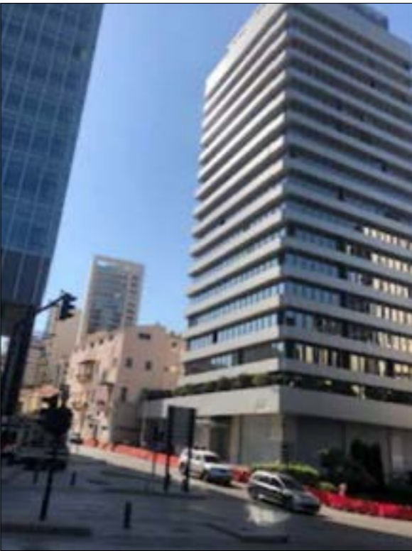
ابراج رينك البحر المتوسط

من المقاتطع، مع الشارع الذي يوصل كنيسة الكوشية، ببؤابة السطبية في أسفل الأسواق العتيقة، من هناك أمشي، باتجاه مقر بلدية