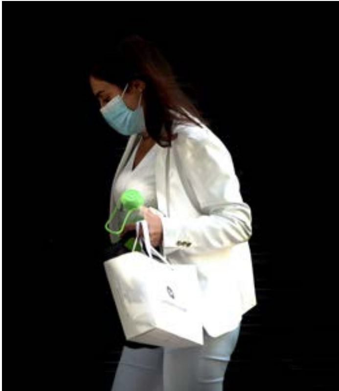
إنتشار فيروس كورونا بمناطق كلبية وبعاد كبيرة لعامة الأجراء الوفاية بشكل حاد من هذا الإنتشار

وبرغم دخول البلاد قلب العاصفة، لا تزال المستشفيات الخاصة تنصرف للتعاطى مع فيروس كورونا على أساس حسابات الريح والخسارة. فبالإذن، لا تزال ترفض الدخول