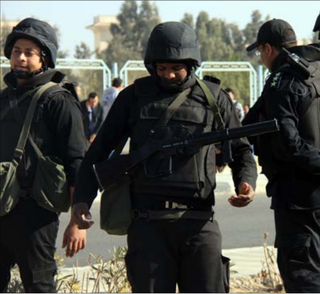
لم تتغيّر طريقة النيابة في التعامل مع ما تقدّمه وزارة الداخلية من روايات

العامة كأنها إرث له، فيحدّد الأولويات وفق ما يراه مناسباً، ويتجاهل ما يخدم المعارضة، ويرخب بما يخدم النظام، وكلّها تصرفات يمكن رصدنا من خلال تجاهل النيابة التعامل مع عمليات التشويه والإساءة التي تتعرّض لها شخصيات محسوبة على المعارضة، مقابل اتّخاذ قرارات سريعة ضدّ من «يرتكب إساءة» إلى النظام مهما كانت. في القضايا السياسية، لم