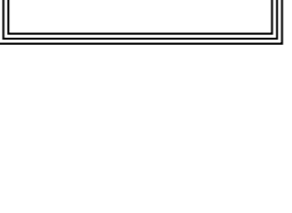
توجه نائب مسادم الرئيس إلى مصدق من أجل وقف سائت من االعاج الجاري، (أف ب)

نقلت وكالة «رويترز» مساء أمس، عن مصادر مطلّعة تأكيدها أنّ تركيا تعمل على سحب قواتها من نقطة المراقبة في مورك في ريف حماة الشمالي جنوبي محافظة إدلب، والتي كانت قد أقامتها عام 2018، بعدما حاصرها الجيش السوري والعديد من المواقع التركية الأخرى العام الماضي. وقال مسؤول بارز في المعارضة السورية، مُخرّب من تركيا، إنّ تفكيك القاعدة بدأ، موضحاً أنّه سيستغرق عدّة أيام، واصفًا ذلك بأنه جزء من الجهود التركية لتعزيز خطوط وقف إطلاق النار التي تمّ التوصل إليها في اتفاق مع روسيا في آذار/ مارس على أن يبادر مصدران آخران بمكّلمان على العملية، طلبا عدم نشر اسميهما، بأنّ الانسحاب بدأ في وقت مبكر من يوم أمس، فيما أشار أحدهما إلى أنّ القوات التركية لا تُفكر في إخلاء موقع مراقبة آخر في هذه المرحلة (رويترز)