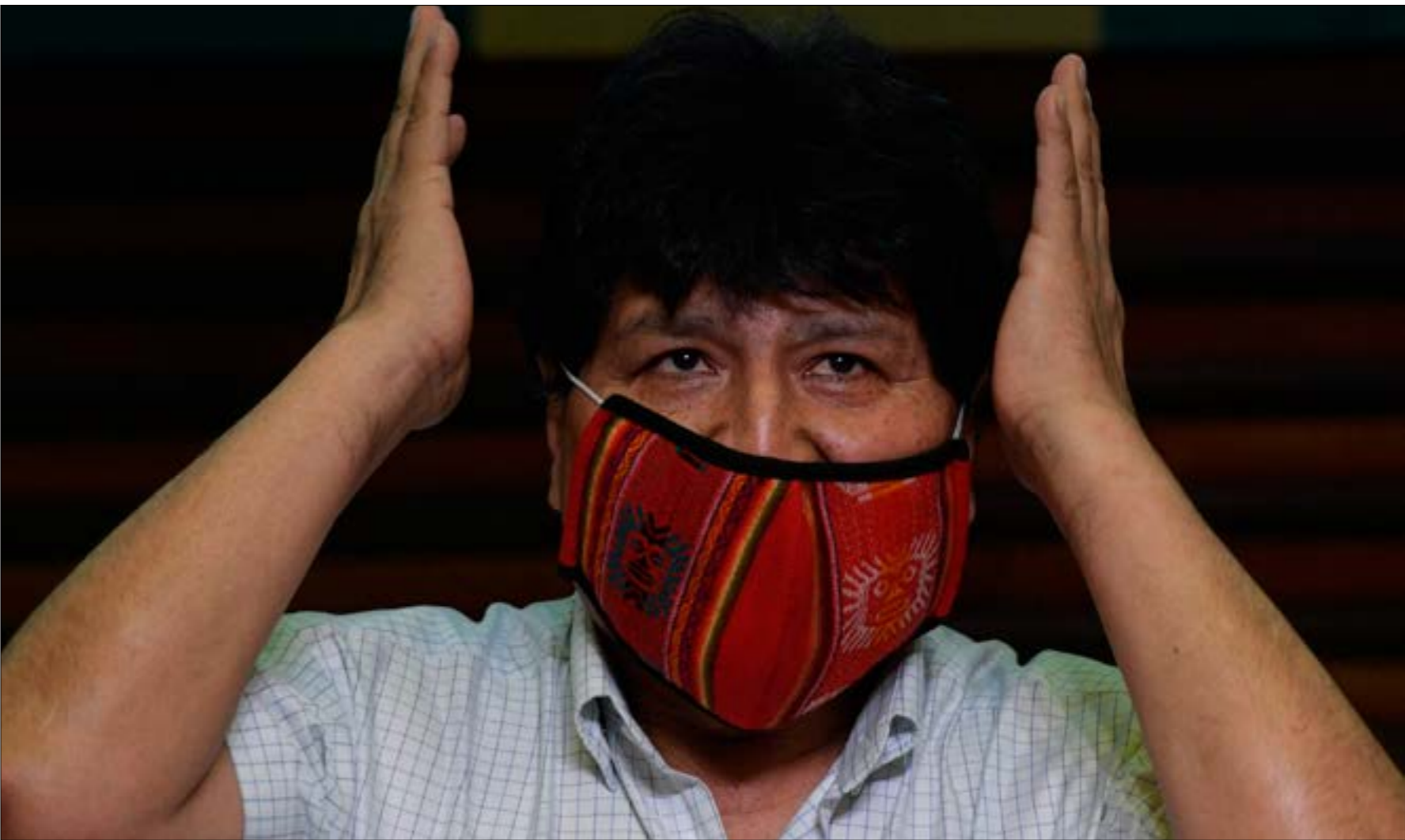
يشكّل سقوط الحزب الحاكم خسارة استراتيجية لابوليفيا واشنطن (ا ف ب)