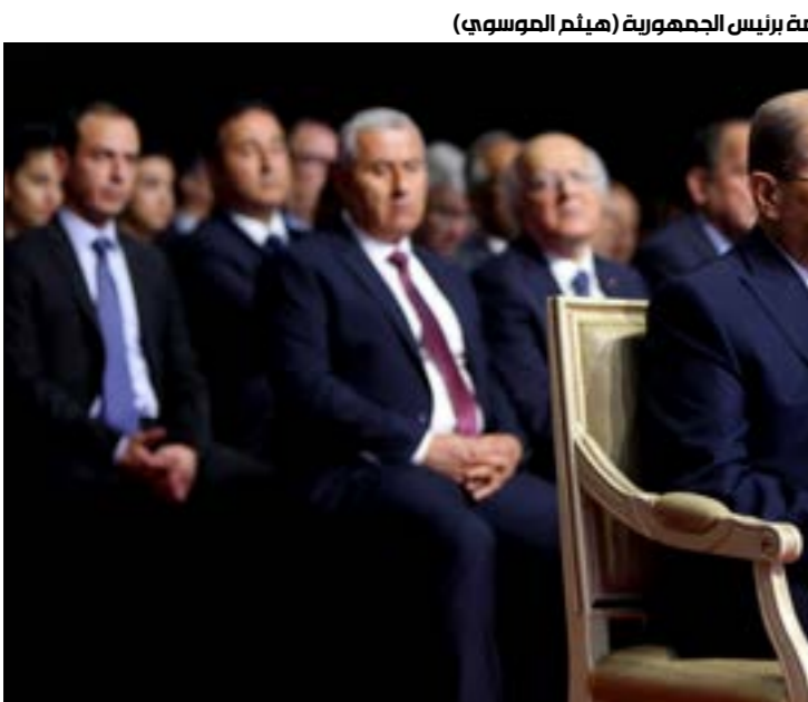
قد تُحصر الحصّة المسيحية الوازنة داخل الحكومة برئيس الجمهورية (هيثم الموسوي)

حتى ولو جرى تأمين الدولارات النقدية، ولكن، يؤكّد مديرون في مصارف أن حاكم مصرف لبنان، رياض سلامة، كان قبل قرابة شهرين من صدور القرار، «قد أصدر لألحة تضمّ أسماء أولاد ضباط من مؤسسات عسكرية وأمنية، للسماح لهم بتحويل الأموال إلى جامعاتهم في الخارج». وحين كان يرفض المصرف المعنى تحويل المال، كان يابته الجواب من أهل الطلاب بأن «مصرف لبنان سمح بذلك، فعنّا على هذا الأساس نُمنّ التحويل». في المقابل، تقول مصادر في المجلس المركزي لمصرف لبنان إنّ الموضوع كان مُبرحاً في إحدى الجلسات على جدول الأعمال، ولكن فور الوصول إليه بادر الحاكم إلى القول إنّ البند «ما ينقطع»، ولم يُناقش أصلاً ليجري التصويت عليه». وتشير المصادر إلى أنّ «من المستبعد أن يكون قد منّ دون علمنا، ولكن ثمة احتمال بأن يكون قد وقّع على استنفاات لبعض الضباط الذين طلبوا ذلك.»