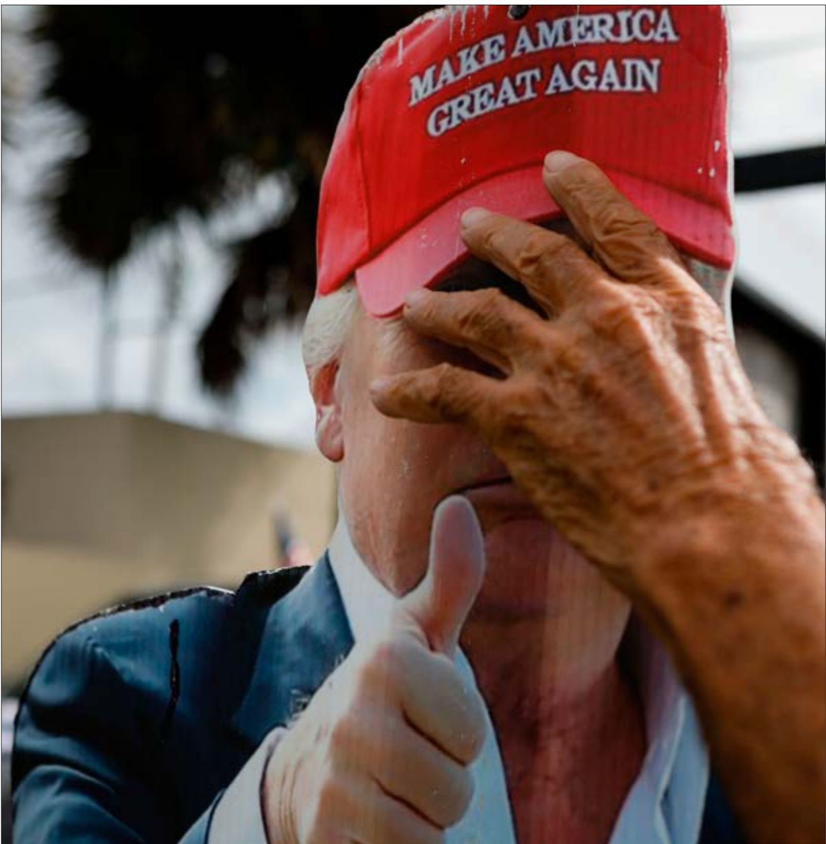
ضمّ المجمع الانتخابي لياخذ التصويت الشعبي في الاتجاه الذي نراه الولايات مناسباً

كيفية تقسيم مقاعد الكونغرس، كانت «الثلاثة أخماس» عبارة عن اتفاق لحلّ وسط بين المندوبين من الولايات الشمالية والجنوبية في المؤتمر الدستوري للولايات المتحدة (1787). وفي ذلك الحين، جرى البحث في كيفية احتساب العبيد من إجمالي عدد سكان الولاية، لتحديد عدد مقاعدها في مجلس النواب، ومقدار الضرائب التي ستدفعها. توصلت التسوية إلى احتساب ثلاثة من كل خمسة عبيد كاشخاص، ما أعطى الولايات الجنوبية مقاعد أكثر بمقدار الثلث في الكونغرس، وثلت الأصوات الانتخابية، أي أكثر مما لو تمّ تجاهل العبيد، ولكن أقلّ ممّا لو تمّ احتسابهم مع «الأحرار»، بالتساوي. وإن كان من توضيح لما حصل، فكيفي الإشارة إلى ما ذكرته «ذي اتلانك»، من أن «المجمع الانتخابي» أعطى حافزاً للولايات الجنوبية (ذات الميول الجمهورية)، وكان سبباً في تفضيل أصوات البيض على حساب غيرها، حتى يومنا هذا.