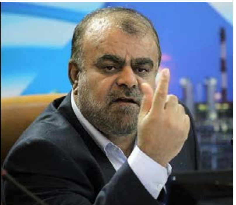
كان قاسمي طلباً في الحلفاء الديبلوماسية في المنطقة

بدأت تتسرّب أسماء عديدة طامحة إلى الإيرانية، المقرّر إجراؤها في صيف 2021، ومن الأسماء المطروحة في هذا الإطار، رستم قاسمي، الذي يشغل منصباً رفيعاً في الحرس الثوري، بما في ذلك مساعد قائد «فيلق القدس»