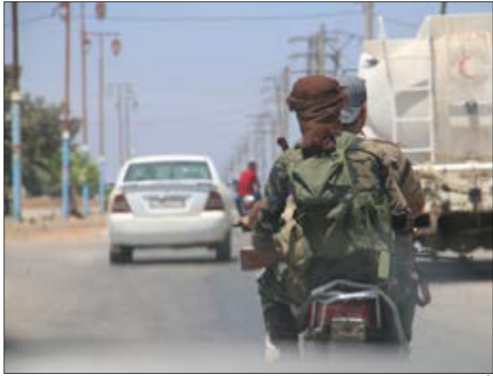
قُتل القياديون الخمسة بعد توهّبهم للتزوّد بالوقود قربه ازرع أثناء عمدهم من مصدق(الأخرا)

مثيين قرب مدينة أزرق، الواقعة تحت سيطرة الجيش. ولعلّ أبرز ما يُجمّع المقتولين الخمسة أنهم جميعا رموز عسكريّة من المسلحين المُرّبين من أحمد العودة، قائد «اللواء الثامن» التابع ل«الفيلق الخامس» المدعوم من روسيا، والمسيطر على غالبية أرياف درعا، والقياديون القتلى